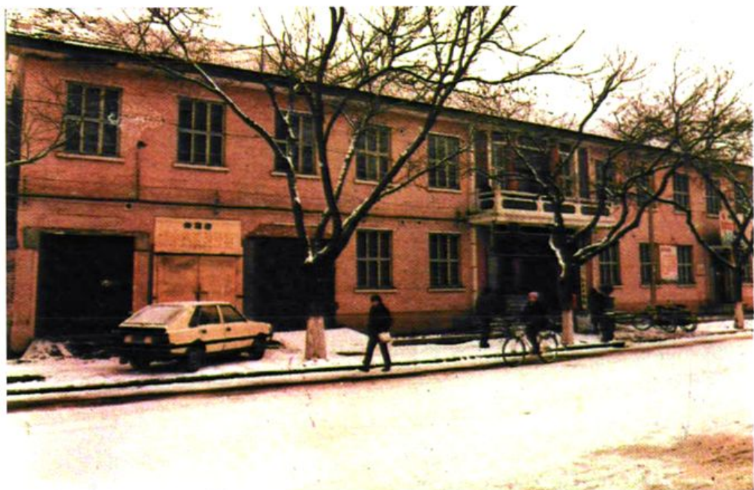
1957年9月中国人民建设银行保定市支行办公地址(保定市裕华东路34号)。