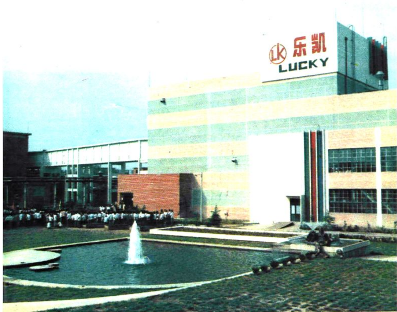
保定胶片厂引进彩色胶片涂布生产线外景