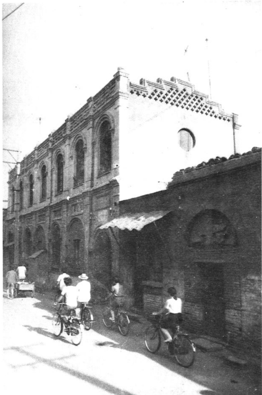
1952年7月交通银行保定办事处办公地址(保定市东大街50号)。