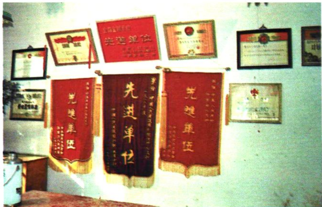
1986年8月保定建行被评为全国金融系统先进单位。