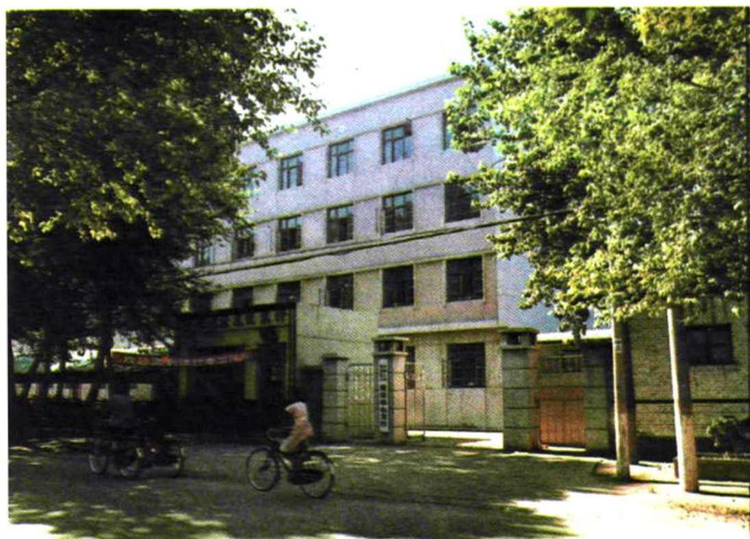
1986年中国人民建设银行保定中心支行办公地址(保定市卫生路5号)。