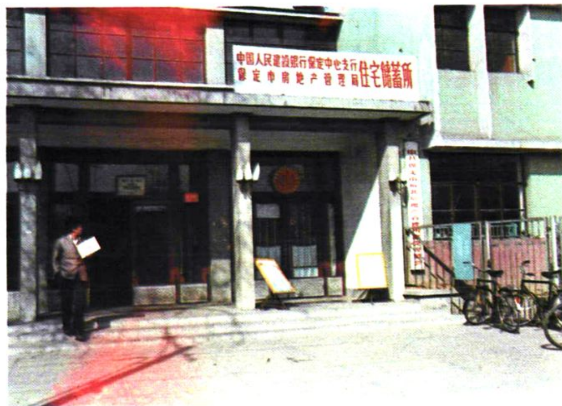
1987年保定建行开办全省第一家住宅储蓄所。