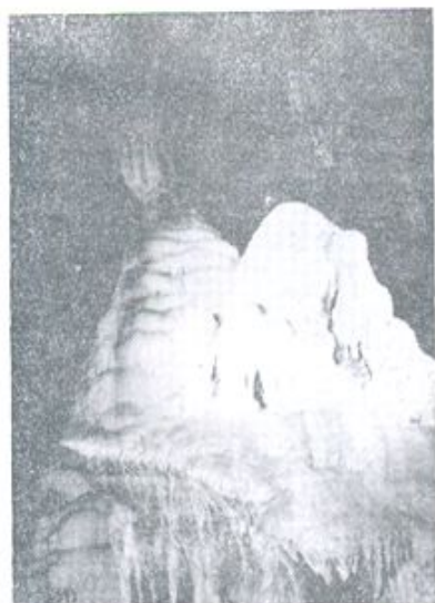
平庄万佛长廊洞玉王宫景观