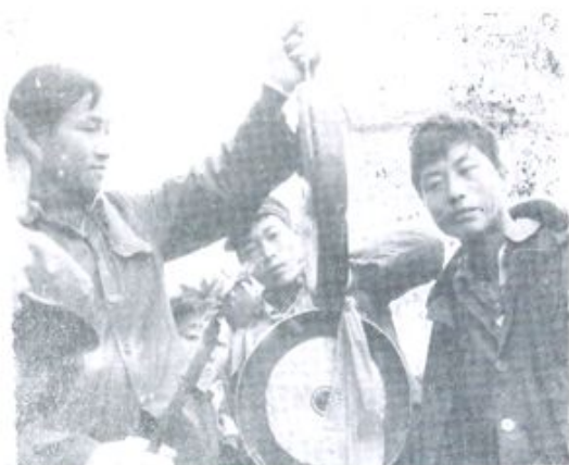
思州苗族《抡锣》