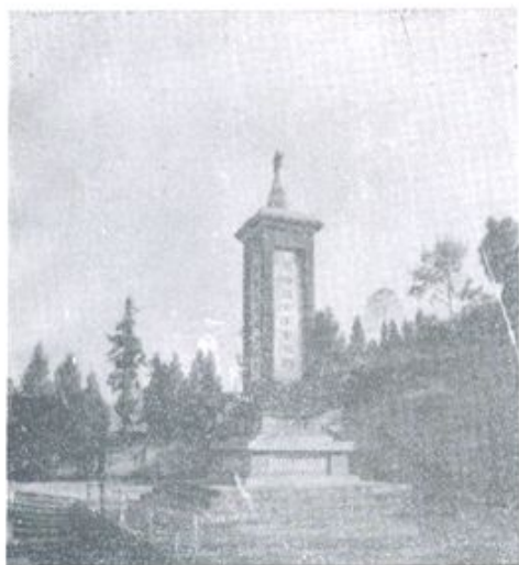
岑巩县烈士公墓纪念塔