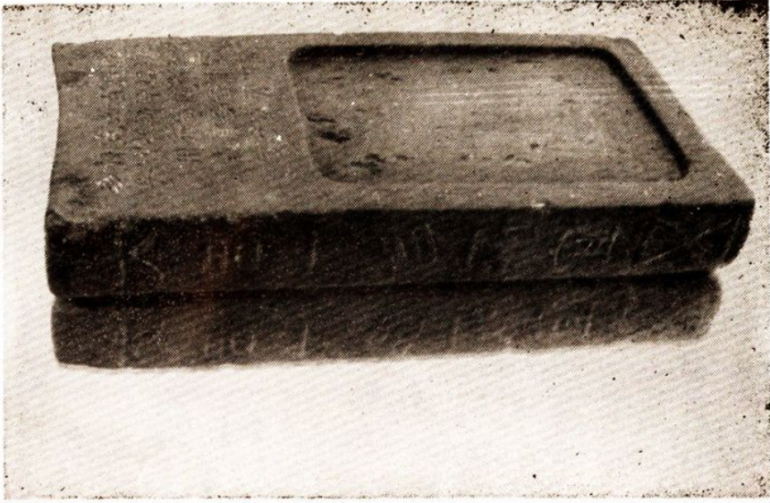
《汉砖砚》距今一千零八十年