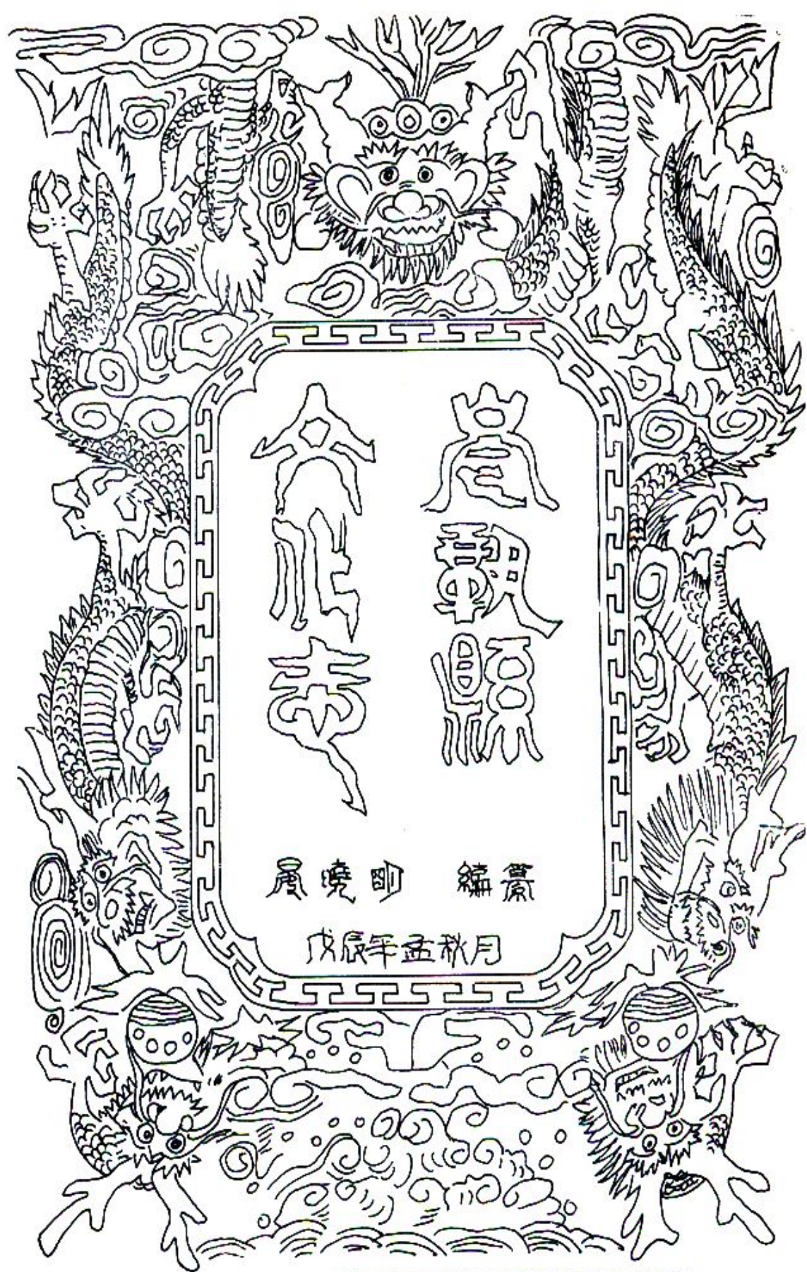
思州民间剪纸五龙抢宝造型图