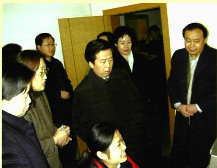
▶ 省教育厅厅长李冬福参观 模拟中心