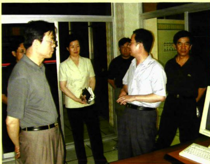
▶ 省教育厅副厅长 贾坚毅来校视察