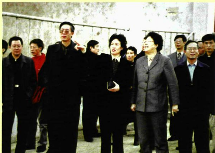
◀ 王昕副省长来校检查工作