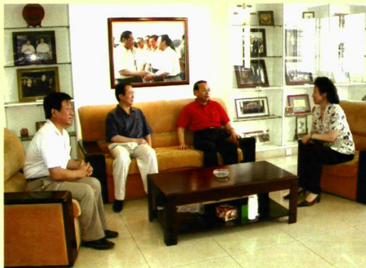
◀ 山西大学校长郭贵春 指导工作