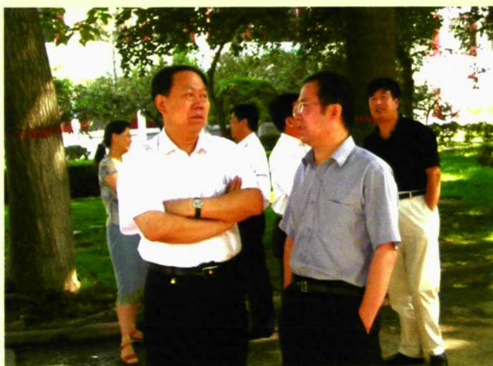
▶ 山西大学党委书记秦良玉 副校长贾锁堂来校指导