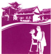
Image and Video Culture of Chinese Bai Villages