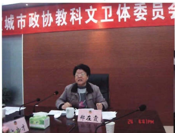
2011年11月24日市政协副主席郑在霞 视察调研食品药品监管工作