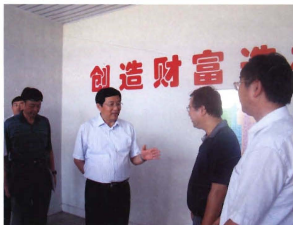
2009年7月3日市委书记、市人大 常委主任高登榜视察 安徽新和成皖南药业有限公司