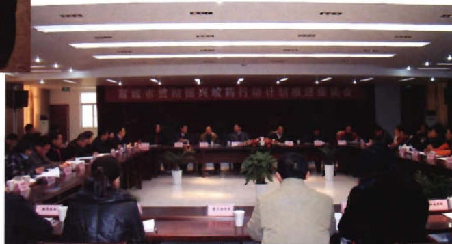
2010年12月31日副市长李明 参加全市贯彻振兴皖药行动计划推进会