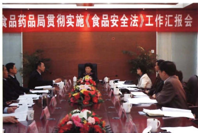
2012年4月17日市人大常委会 副主任程年红到市食品药品监督管理局 调研《食品安全法》实施情况