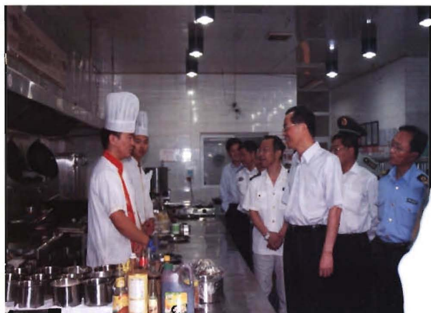
2012年9月29日市长韩军检查餐饮安全