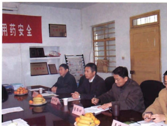
2009年12月9日市委副书记钱晓康 检查市食品药品监督管理局 党风廉政建设工作