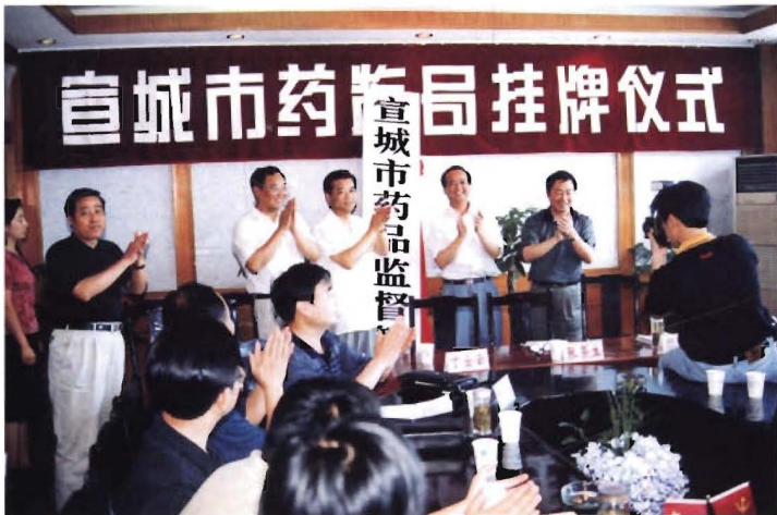
2002年6月12日宣城市药品监督管理局挂牌仪式