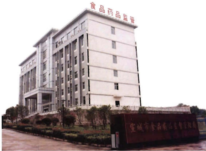
宣城市食品药品检测大楼