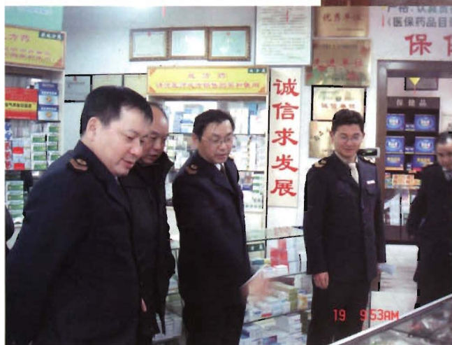
2012年1月19日, 开展 药品市场专项检查