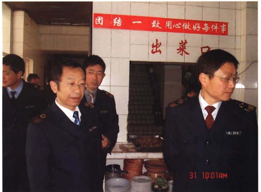
2012年1月-3月, 开展“龙年第一季” 食品药品专项检查