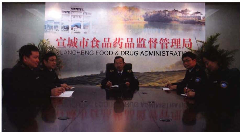
2012年12月局领导班子集体