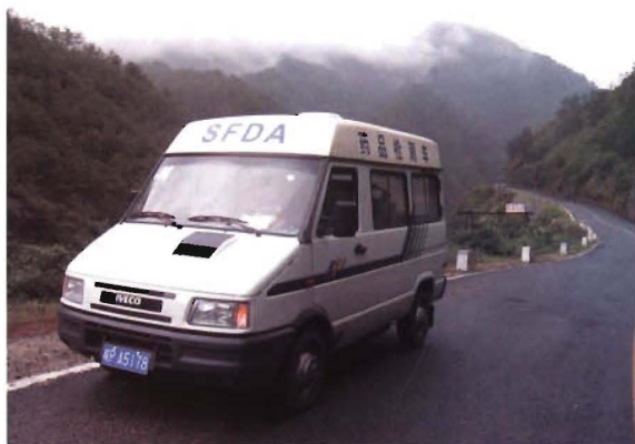
2006年9月12日, 药品检测车深入农村检查