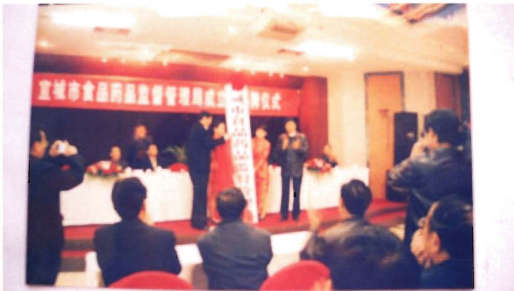
2004年11月26日宣城市食品药品监督管理局挂牌仪式