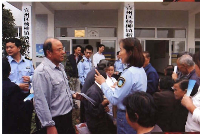
2012年9月14日, 在宣州区 杨柳镇现场接受群众咨询