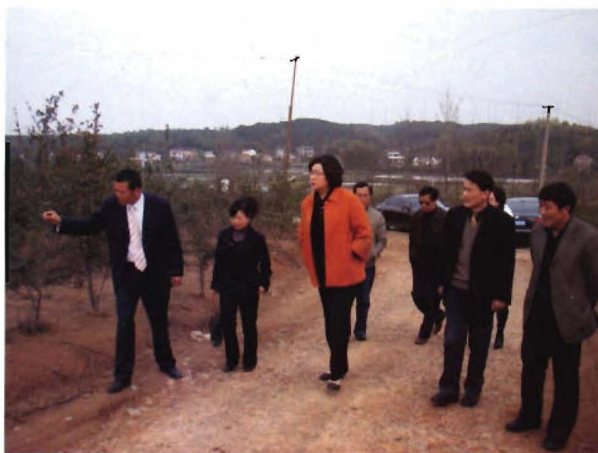
2010年4月2日副市长夏月星 视察中药材产业