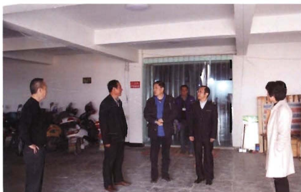
2012年11月8日市政协副主席彭明满 视察市药械健康产业园