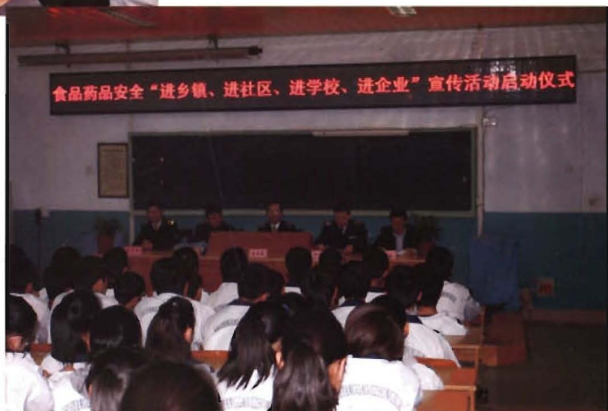
2012年3月30日在水阳高级 中学开展安全用药 进学校活动