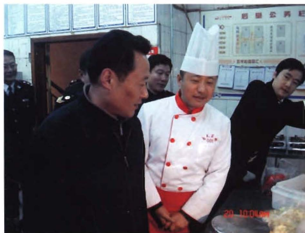
2012年1月20日市长虞爱华 检查春节餐饮安全