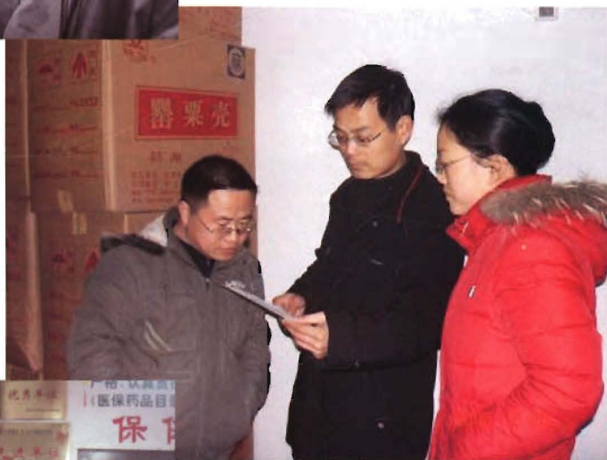
人员开展特殊药品检查 2006年2月28日, 药品监管