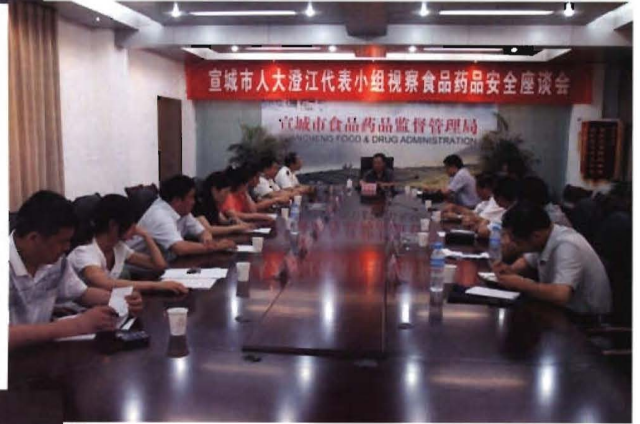
2012年6月19日市人大常委会 副主任张玉峰率市人大澄江代表小组 视察食品药品安全工作