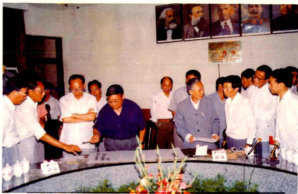
四川省甘宇平副省长为《泸州市城乡建设志》题辞