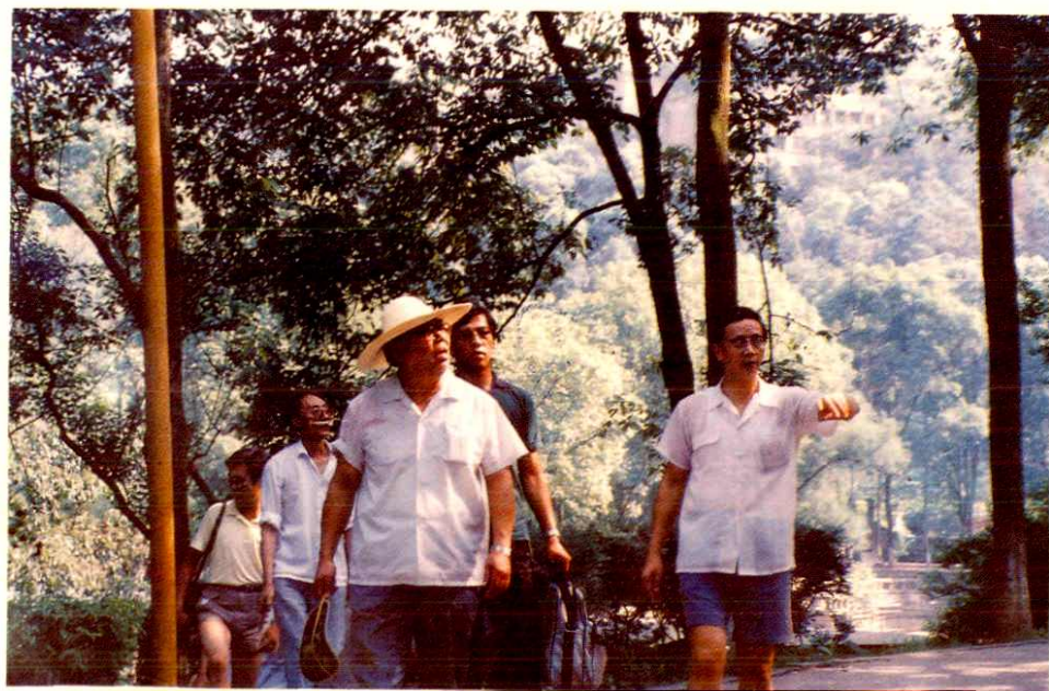
建设部干志坚副部长在唐宁市长、关志新主任陪同下视察忠山公园