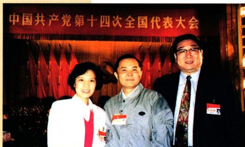
倪惠英出席中国共产党第十四次代表大会。