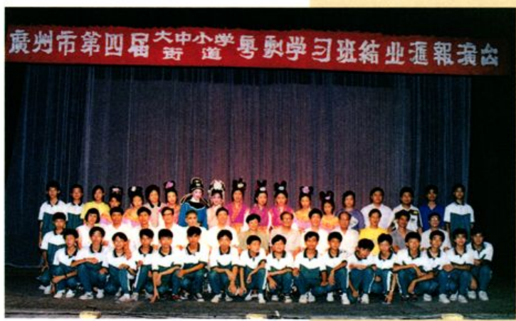
1993年第四届大中小学、街道粤剧学习班举行结业汇报演出后，学员、老师与有关领导合影留念。

廣州紅豆粵劇團加拿大演出留紀念 粵劇之光 國際粵劇藝術協會 敬贈 一九九三年十月八日