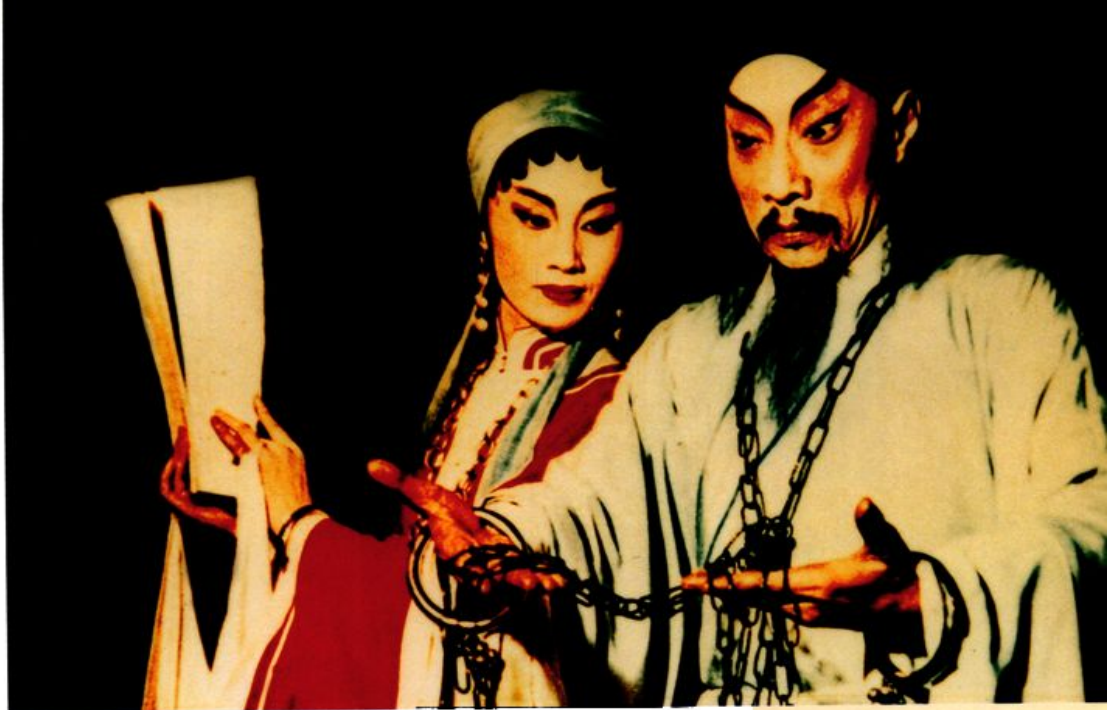
红线女与粤剧大师马师曾主演粤剧《关汉卿》，红线女饰朱帘秀，马师曾饰关汉卿。