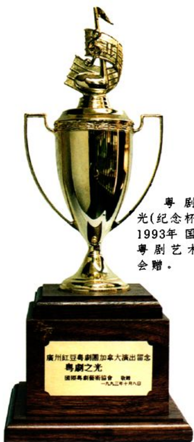
粤剧之光(纪念杯)——1993年国际粤剧艺术协会赠。

廣州紅豆粵劇團加拿大演出留紀念 粵劇之光 國際粵劇藝術協會 敬贈 一九九三年十月八日