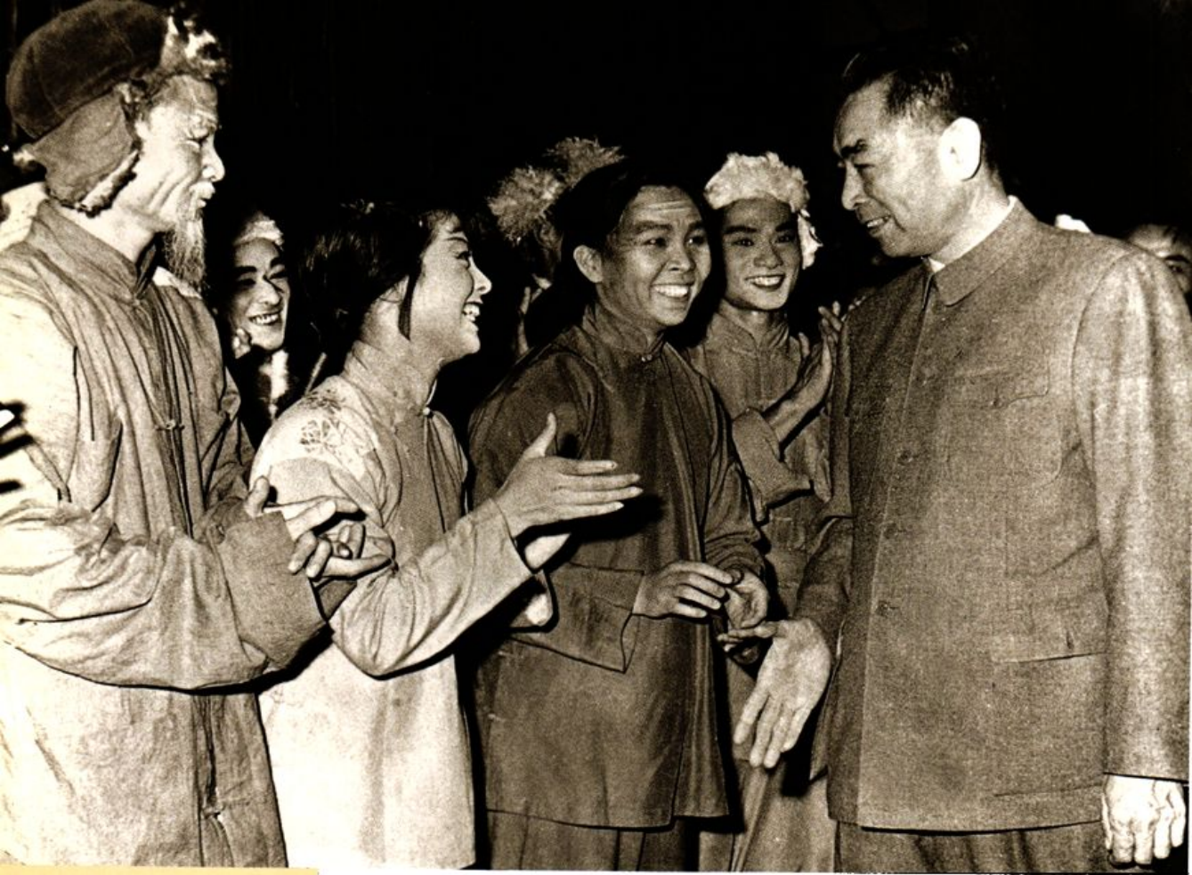
周恩来总理1963年观看广州粤剧团青年剧团演出现代剧《白毛女》选场后接见演员的留影。卢秋萍饰喜儿，黄志明饰杨白劳，何家耀饰大春，甄瑞兰饰大春妈。