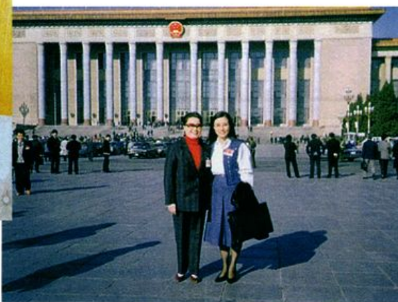
红线女在出席全国人大期间，与汪明荃合影。