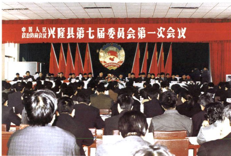
政协兴隆县第七届委员会 第一次会议（2003年4月）