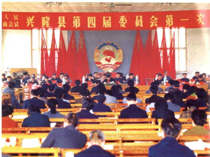
政协兴隆县第四届委员会 第一次会议（1990年4月）