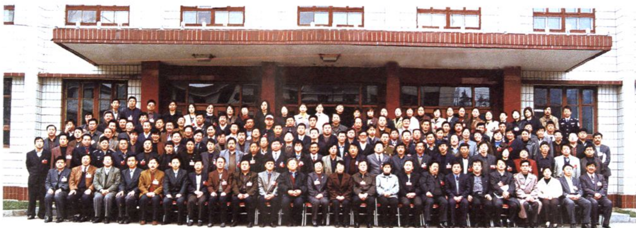
政协兴隆县第七届委员会全体委员合影（2003年4月）