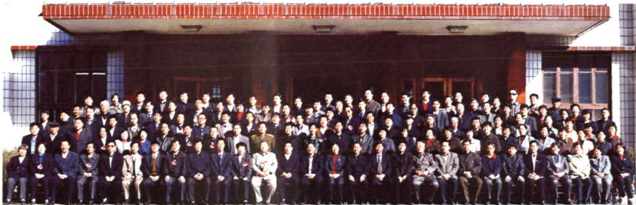
政协兴隆县第六届委员会全体委员合影（2002年3月）