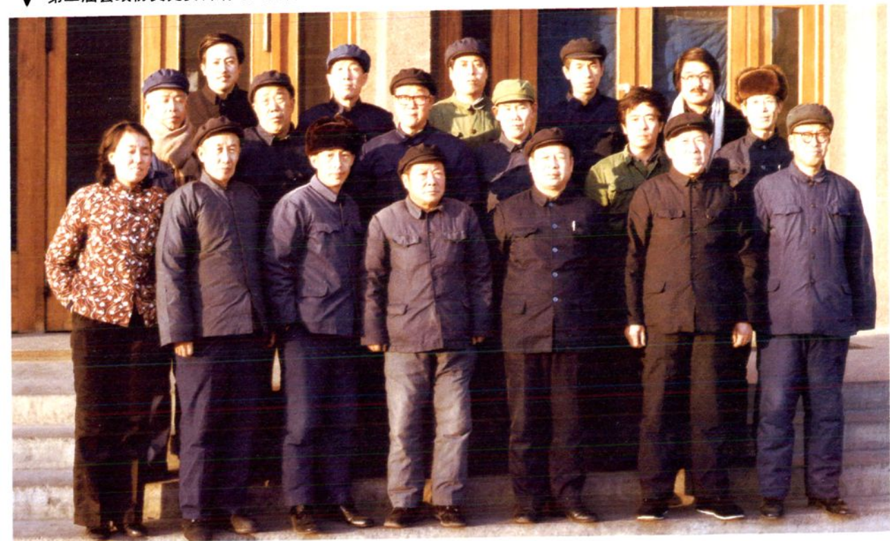
▼ 第二届县政协文史资料编写人员合影（1986年4月）