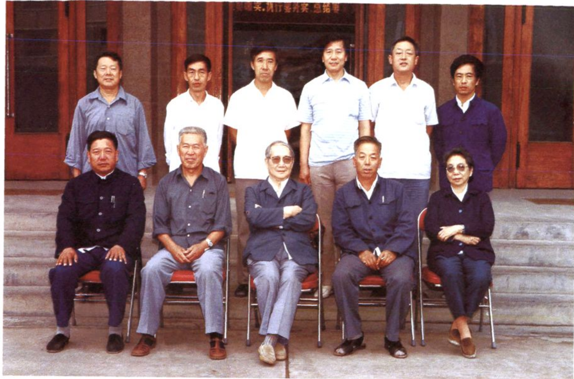
全国政协常委、中国医学科学院院长、中国农工民主党副主席沈其震（前排中），来兴考察时与县政协主席白明义（左二）、副主席王者恒（左一）、温义（右二）合影（1986年8月）