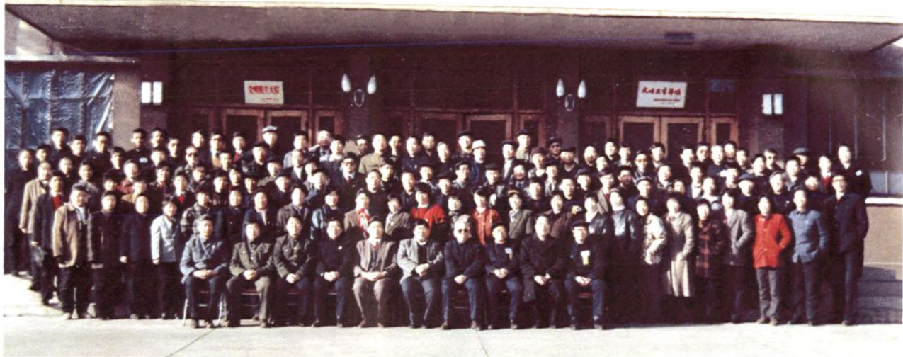
政协兴隆县第五届委员会全体委员合影（1993年2月）