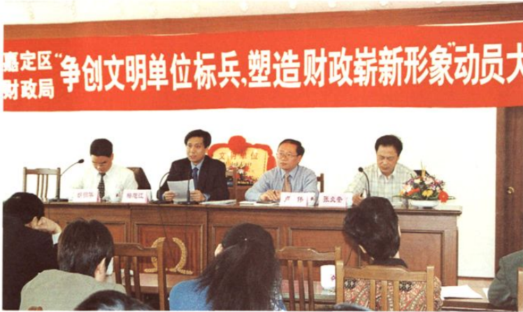
2001年4月16日,局召开“争创文明单位标兵、塑造财政崭新形象”动员大会