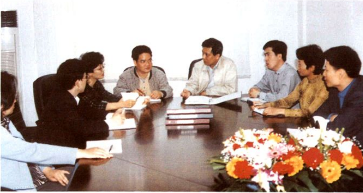
2000年9月25日，财政局 召开调研工作会议