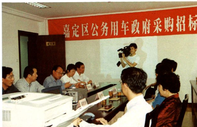
2001年5月17日，嘉定区公务用车政府采购招标会