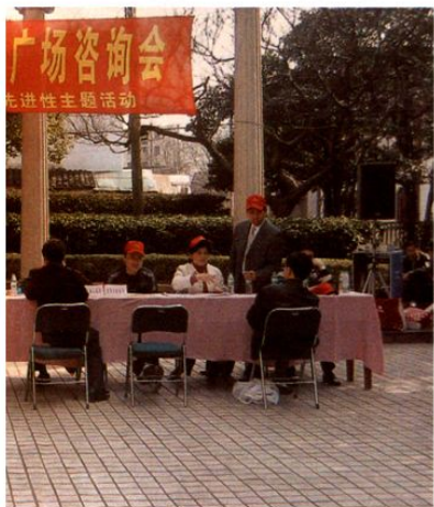
娄龙广场开展“立党为公，理财为民”