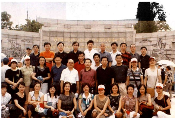
局全体党员在沙家浜学习参观