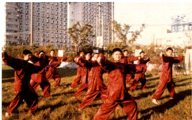
区财政局参加市财税系统第五届运动会武术比赛