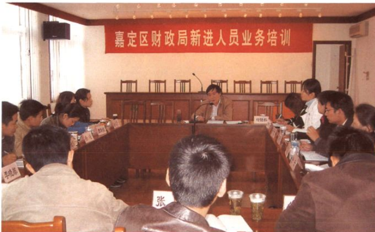
2004年11月22~30日,区财政局举办新进人员业务培训班