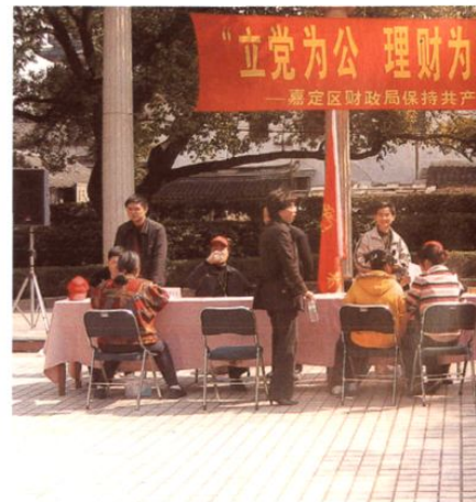
2005年3月20日,局全体党团员在咨询活动