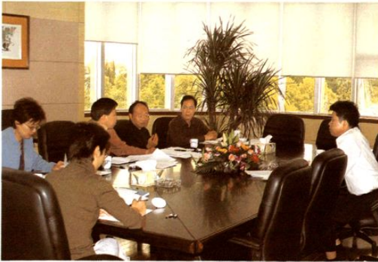
局领导在研究《嘉定财政志》编纂工作