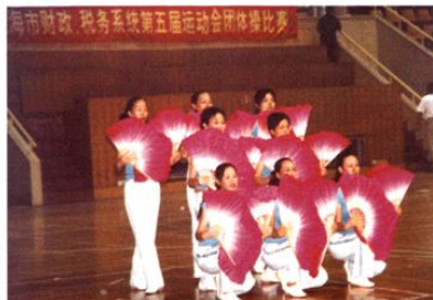
2003年9月26日，区财政局参加市财税系统第五届运动会团体操比赛