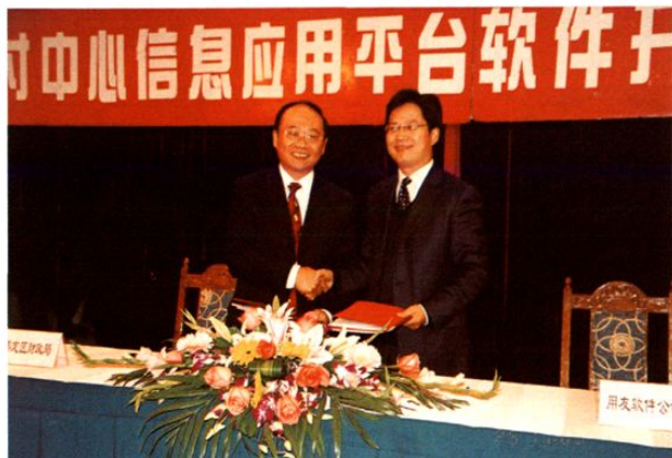
2003年12月25日，区财政局与用友软件有限公司举行财政资金收付中心信息应用平台软件开发系统签约仪式