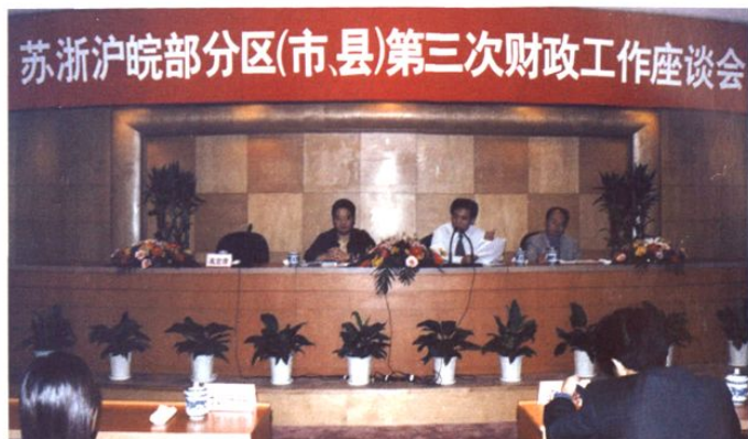
2002年11月17~19日,苏浙沪皖部分区(市、县)第三次财政工作座谈会在嘉定召开