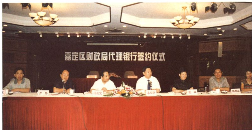
2003年9月18日,区财政局代理银行签约仪式