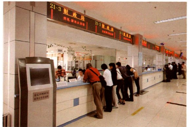
区办证办照服务中心财政服务窗口