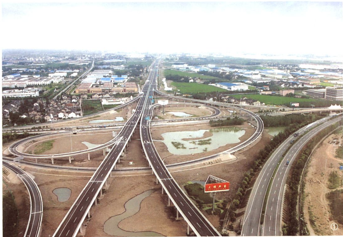
1 沪嘉高速公路 (A12) 与 市郊环线 (A30) 立交