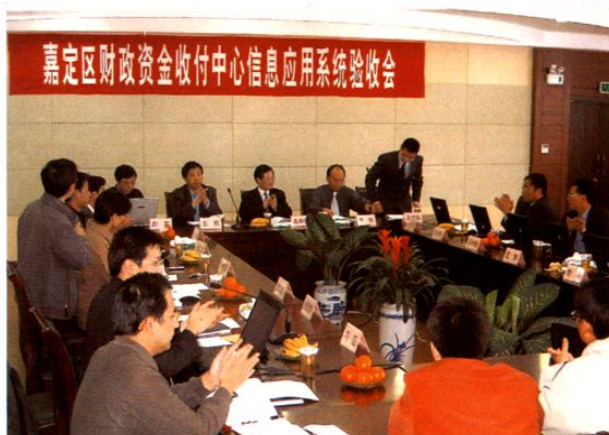
2004年11月12日，局召开嘉定区财政资金收付中心信息应用系统验收会