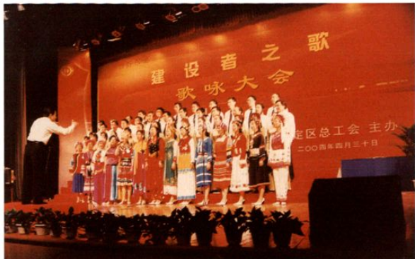
2004年4月30日，区财政局参加区总工会“建设者之歌”歌咏大会