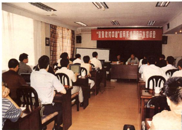
2003年8月6日,区财政局财政资金收付中心应用系统项目开发招标会