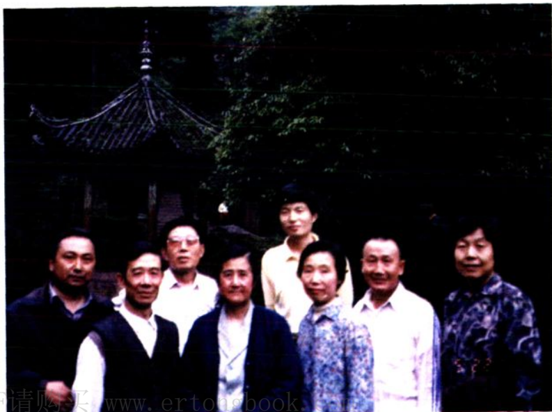
▲ 接待全国人大常委会办公厅代表联络局领导来峨检查工作。（前排左二为联络局领导）