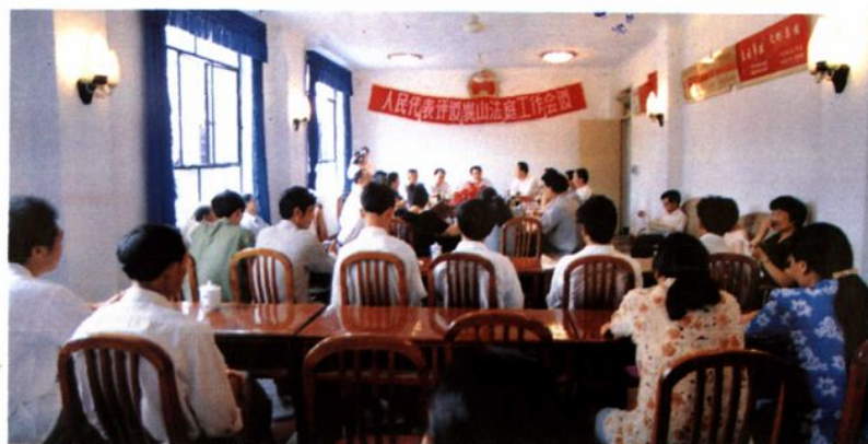
▲ 乡镇人大代表评议市法院基层法庭工作