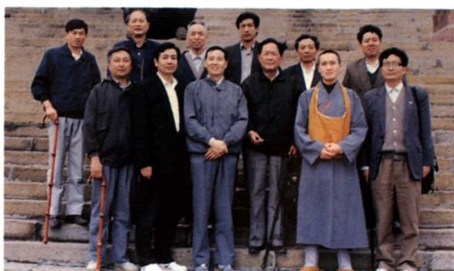
▲ 乐山市人大常委会教科文卫工作委员会来峨视察