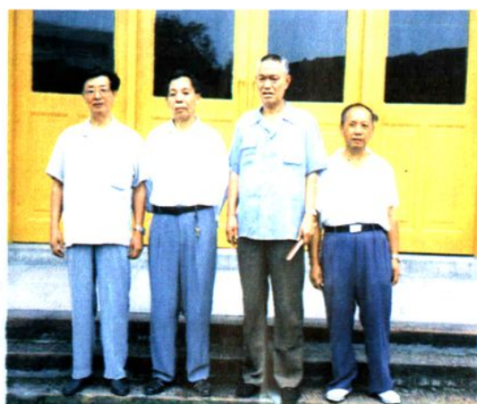
▲ 第十届人大常委会领导(左至右) 刘绳武、张文斌、马国章、万英才