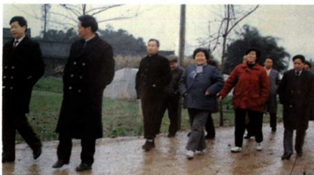
▲ 全国人大代表视察符溪镇开发农业