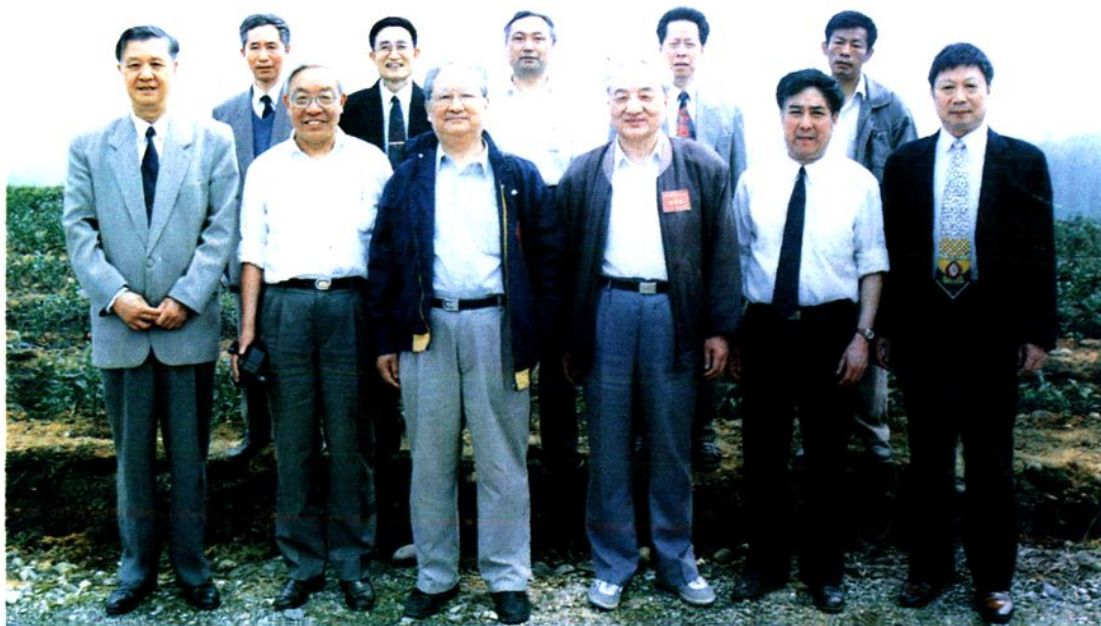
◀ 全国人大专门委员会领导同省、地、县、乡四级人大领导合影。前排左至右二、三四为全国人大专门委员会领导。