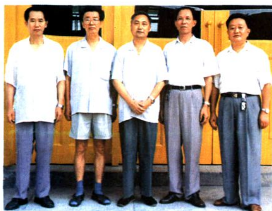
▲ 第十二届人大常委会领导(左至右) 张知华、刘绳武、徐伯珪、熊忠良、朱福君