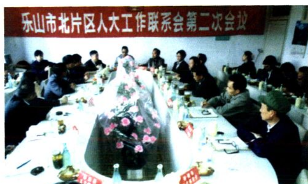
▲ 乐山市北片区人大工作联系会