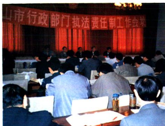
▲ 推行执行责任制会议