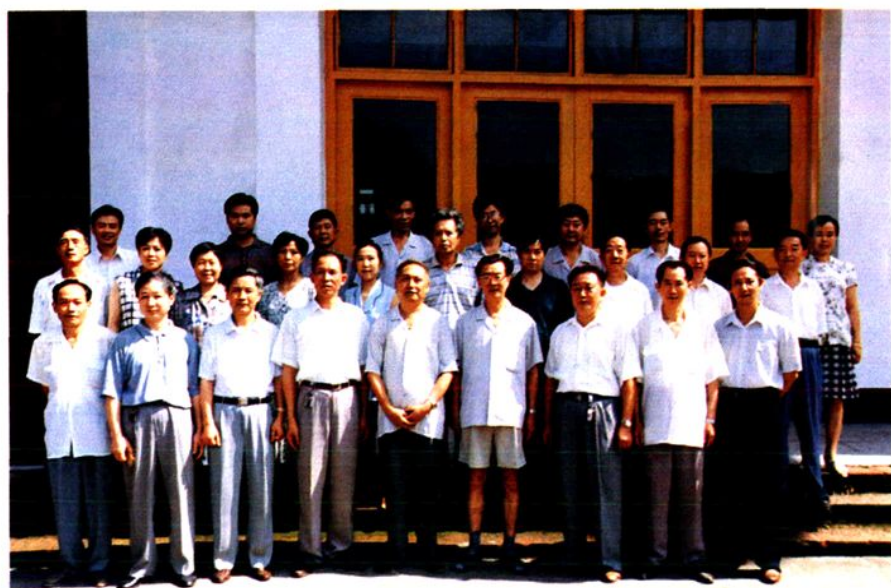
▲ 《峨眉人大志》编纂委员会和编写人员、工作人员合影