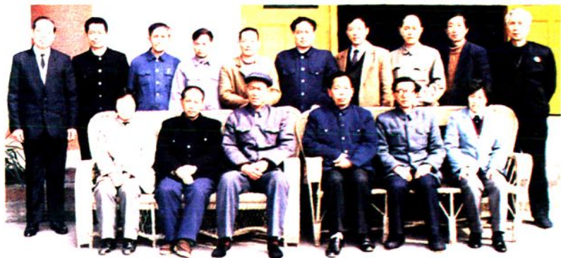
委员会组成人员合影 ▲第十届人大常委