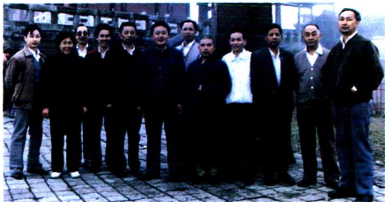
▶ 市人大常委会 联合检查峨眉山后