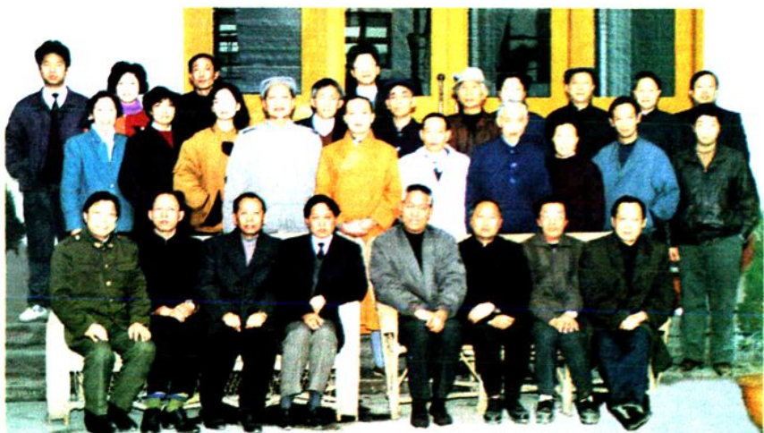
组成人员同政府“两院”领导 及人大机关工作人员合影 ▶第十一届人大常委