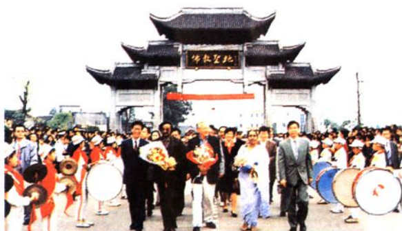
▲ 欢迎联合国教科文组织世界遗产委员会专家来峨检查，申报世界自然与文化“双重”遗产工作。