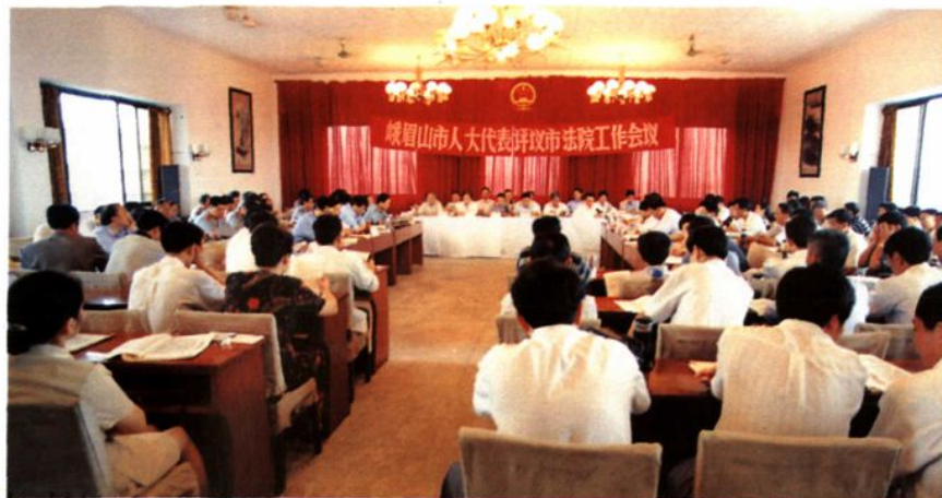
▲ 市人大代表评议市法院工作