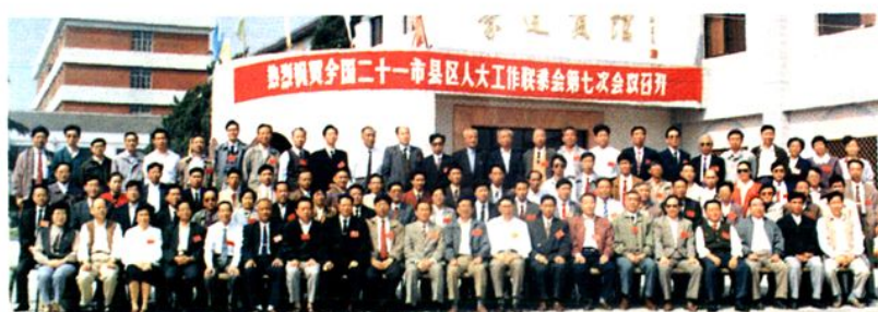
▲ 承办全国县级人大工作联系会