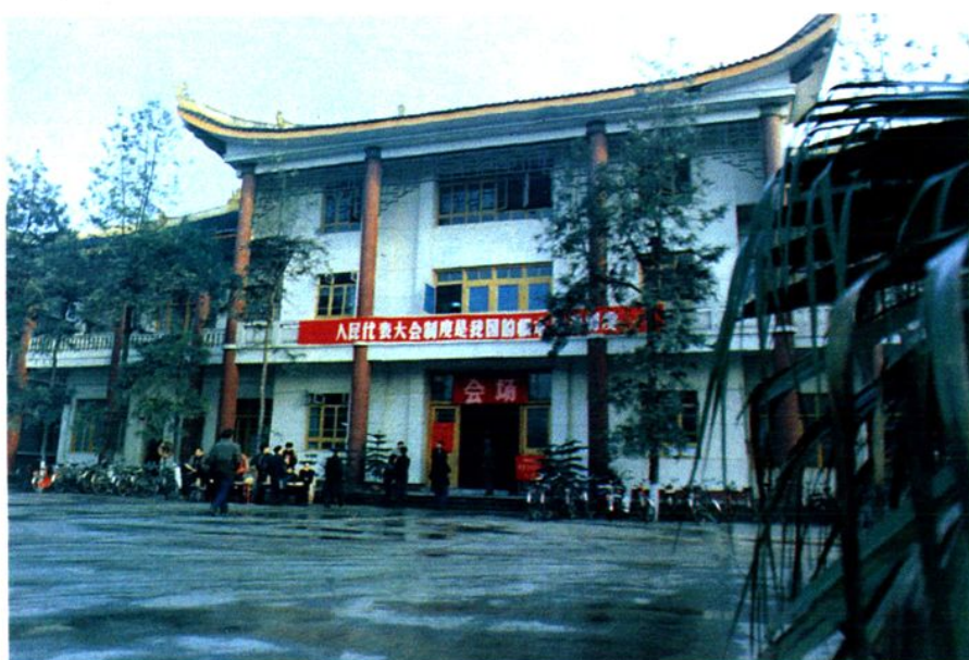
▲ 人大常委会机关办公大楼