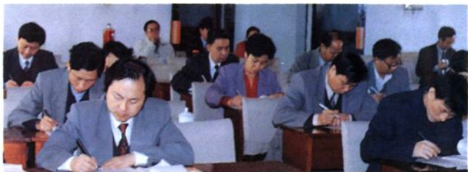
▲ 人大常委会任命干部法律知识考试