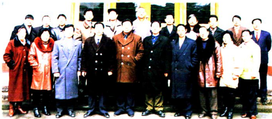
委员会组成人员合影 ▶第十三届人大常委