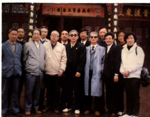
▲ 省人大领导检查峨眉山《森林法》执行情况