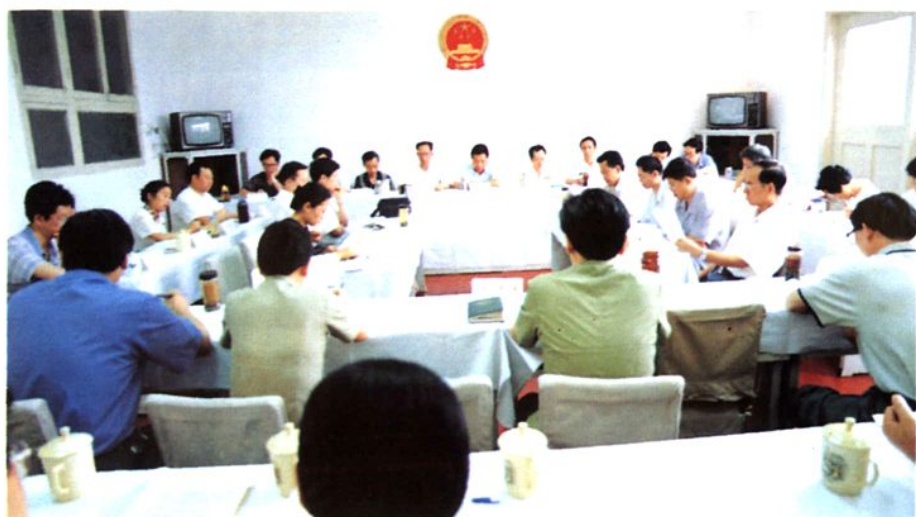
▲ 市人大常委会会议