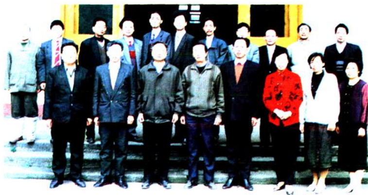
委员会组成人员合影 ▲第十二届人大常委