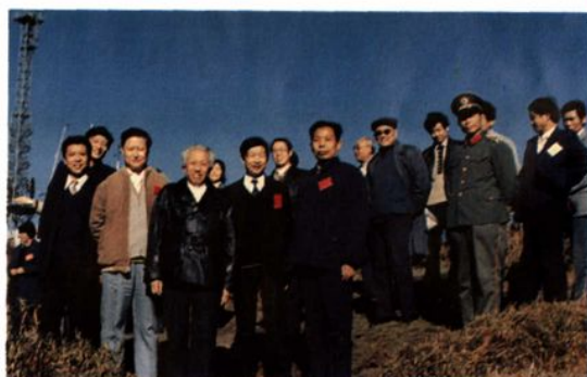
▲ 省人大主任何郝炬视察峨眉山 (前排右二)