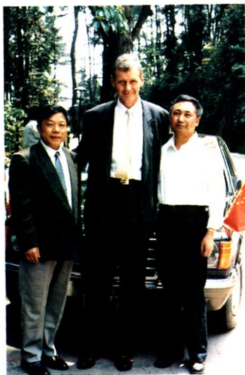
▲ 接待匈牙利最高检察院总检察长提尔吉·卡尔曼来访峨眉山。中：提尔吉·卡尔曼总检察长