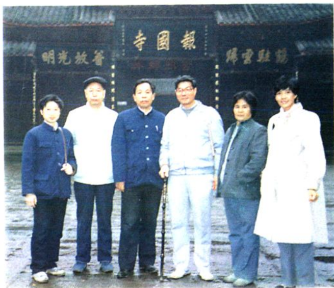
▲ 接待福州市郊区人大主任来访峨眉山