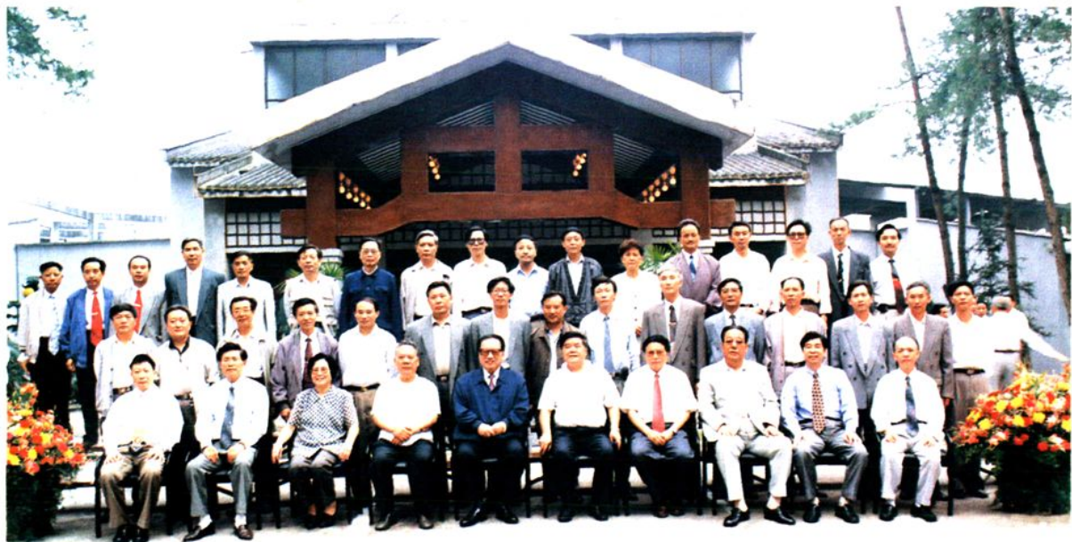
▲ 乔石委员长同乐山市和我市“四大家”领导合影，前排左至右五是乔石委员长。