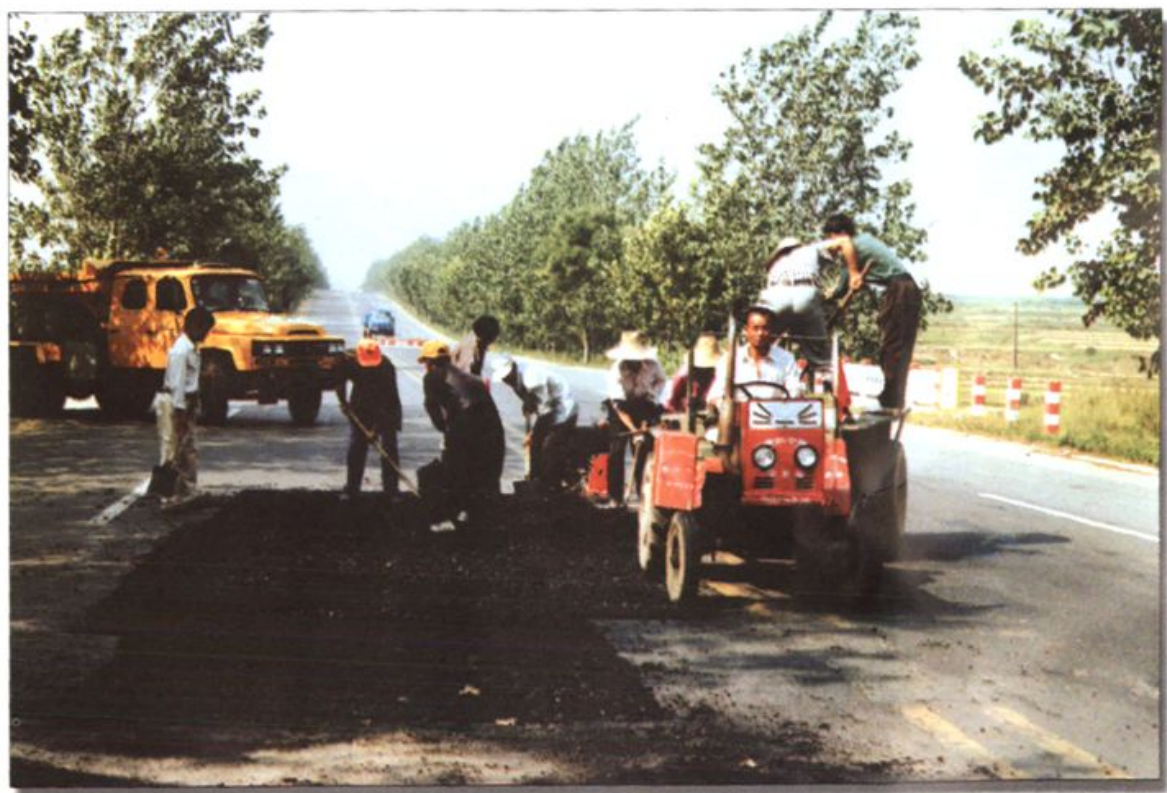
道班工人正在养护作业