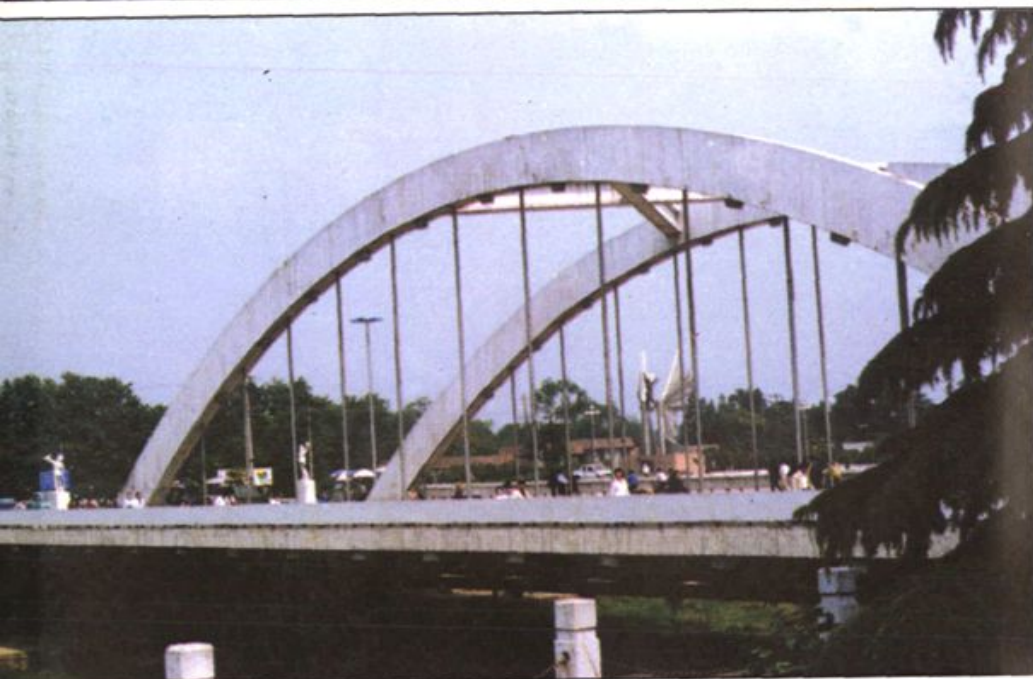
合肥市寿春路桥——辖区 首座中承式钢筋混凝土拱桥