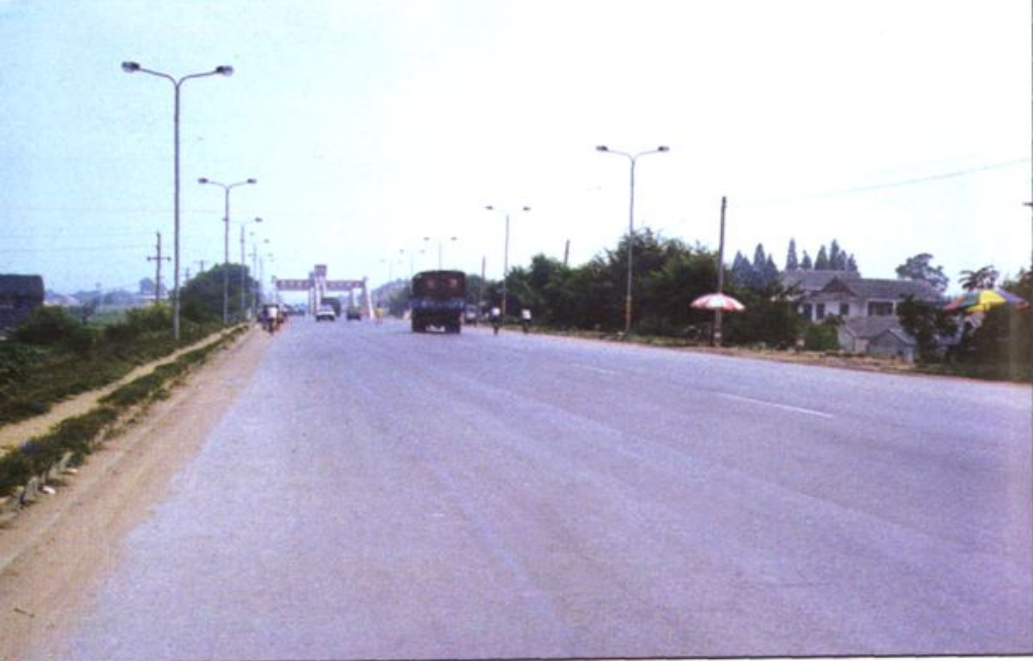
合(肥)安(庆)路合肥段