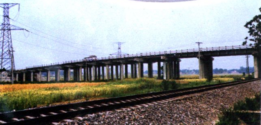
肥东县三十埠公铁立交桥——全省最长的公跨铁宽腹式斜置立交桥