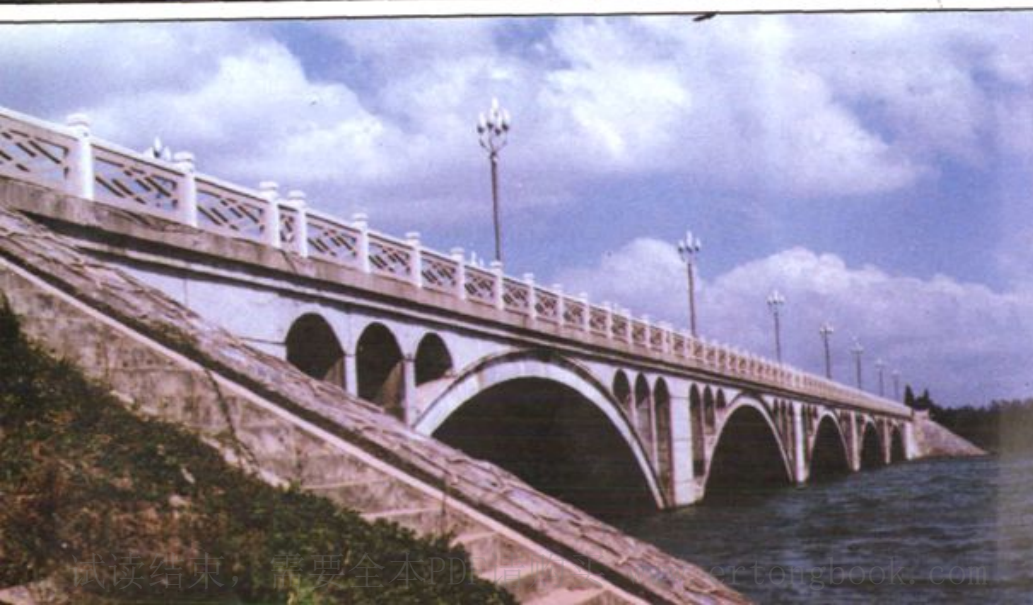
合肥市蜀山湖桥——辖区 最长的钢筋混凝土双曲拱桥