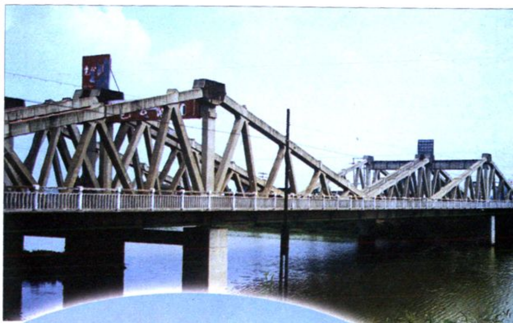
肥西县上派河桥——全省第一座下承式斜拉预应力钢筋混凝土桁架悬臂梁桥