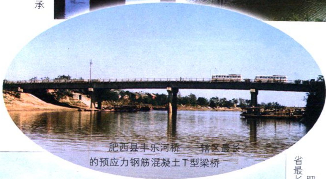
肥西县丰乐河桥——辖区最长的预应力钢筋混凝土T型梁桥