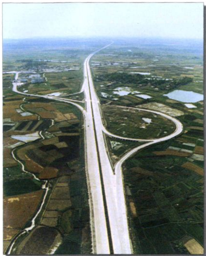
合肥至南京一级汽车专用路