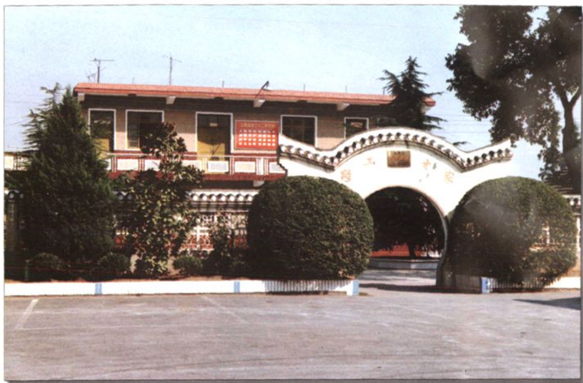
文明道班之一的官亭道班