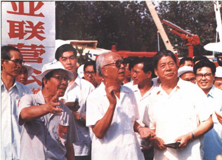
1983年国务院副总理万里参观展车。