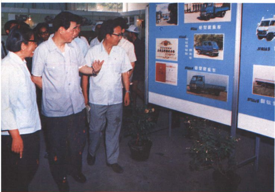
1983年国务院副总理李鹏参观展车。