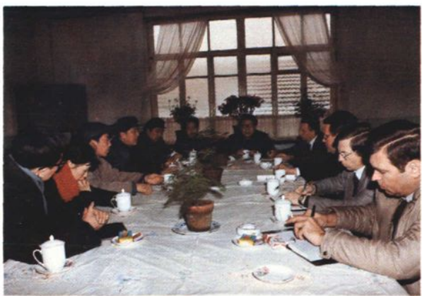
工厂领导与西德奔驰公司洽谈