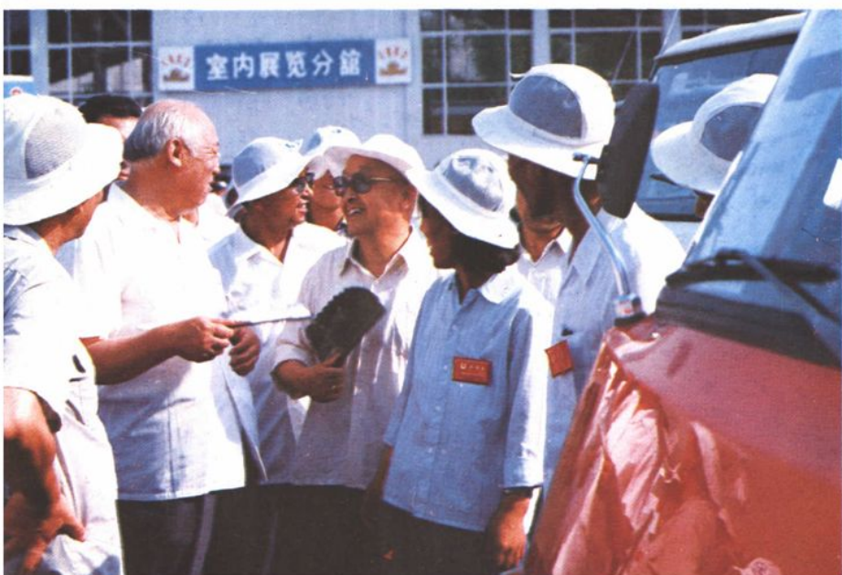
原沈阳市委书记，现北京市人大主任焦若愚参观展车。