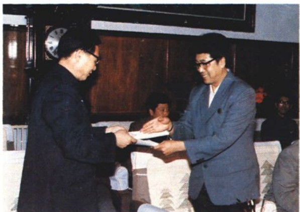
沈汽厂与沈阳评剧院签订文化联合体协议