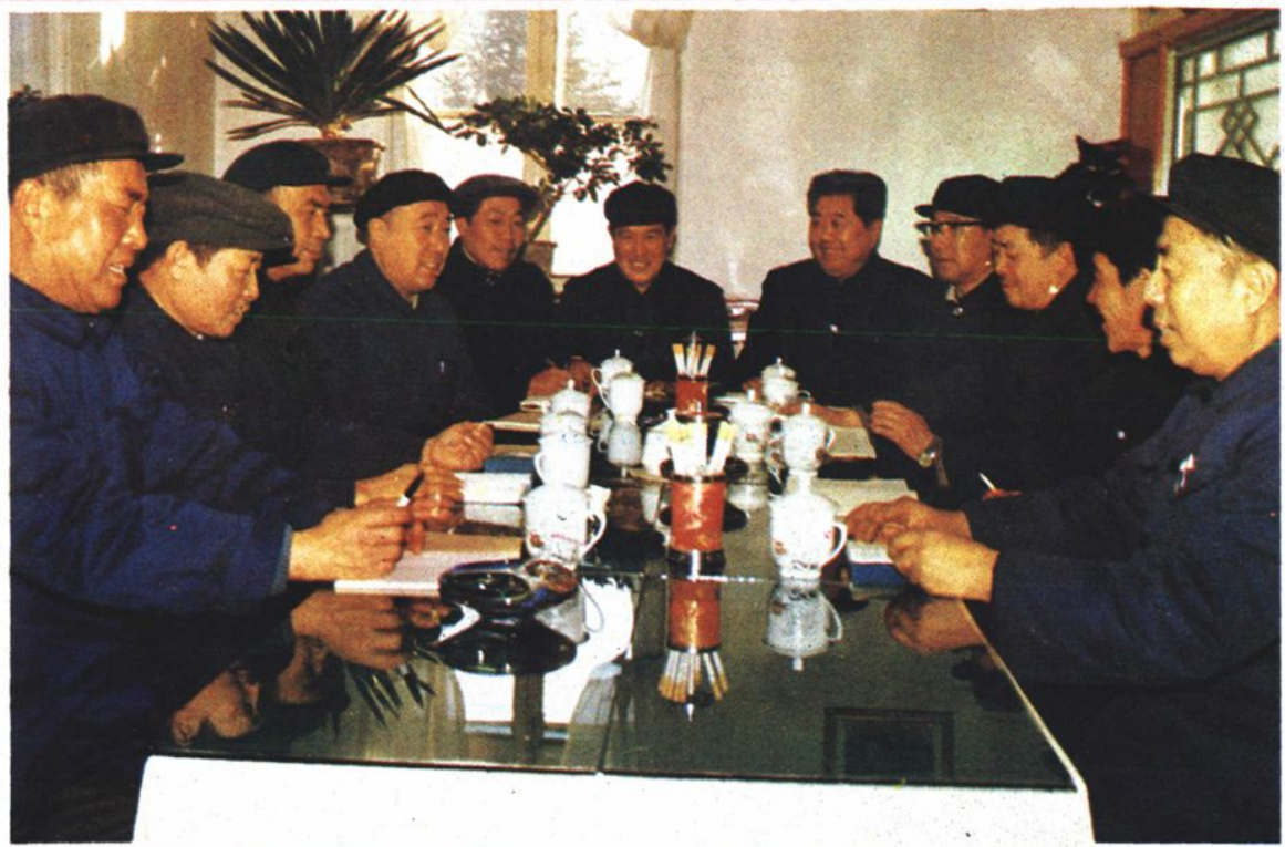
厂级调研员在讨论1986年工厂方针目标