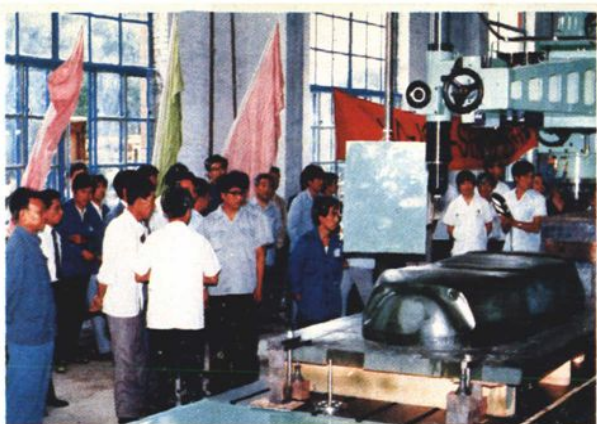
引进日本数控仿型铣床投入生产