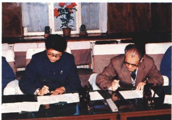
沈汽厂与新疆汽车改装厂签订合作生产轻型汽车协议