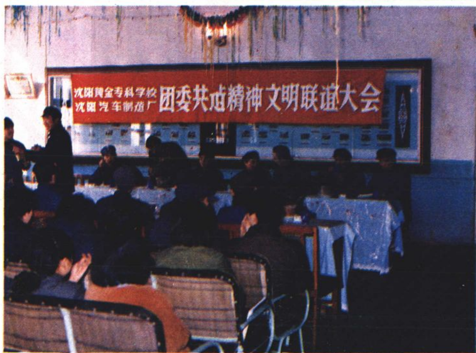
沈汽厂与黄金专科学校共建精神文明联谊大会