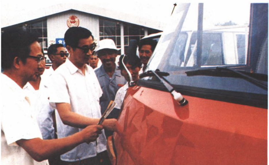
1983年中共中央书记处书记胡启立参观展车。