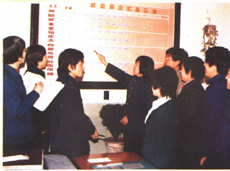
财务人员进行质量成本分析