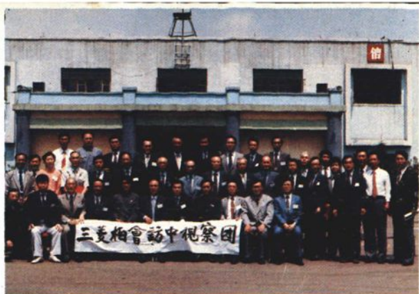
日本三菱株式会社访华代表团来沈汽厂参观