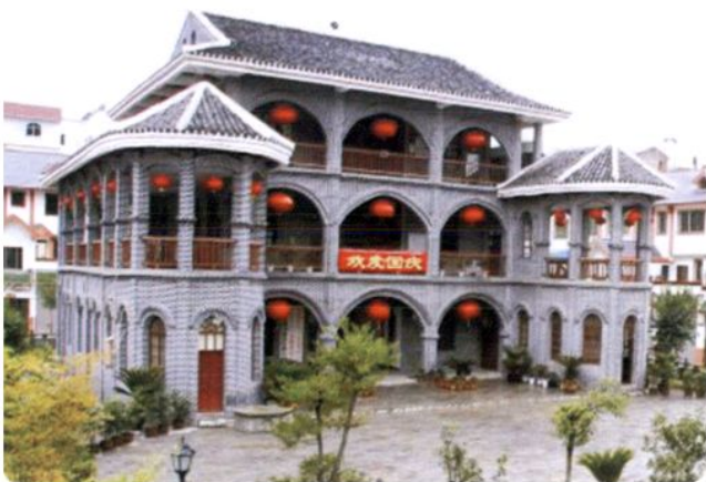
桐梓县海军学校，抗日战争时期由清末福州船政学堂延续的马尾海校西迁至此