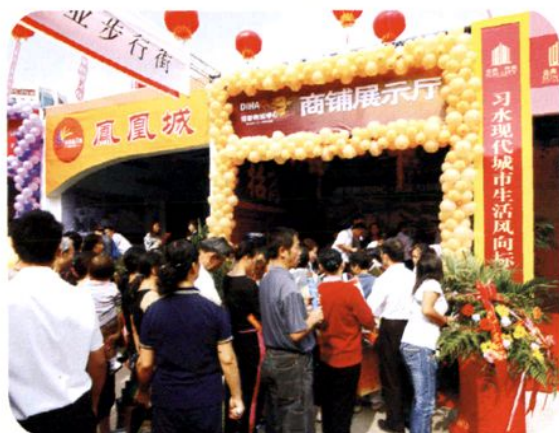
2007年遵义市房交会现场