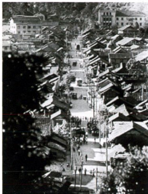
20世纪70年代的遵义市老巷子尹路民居