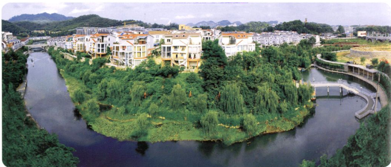
桃溪河畔住宅小区