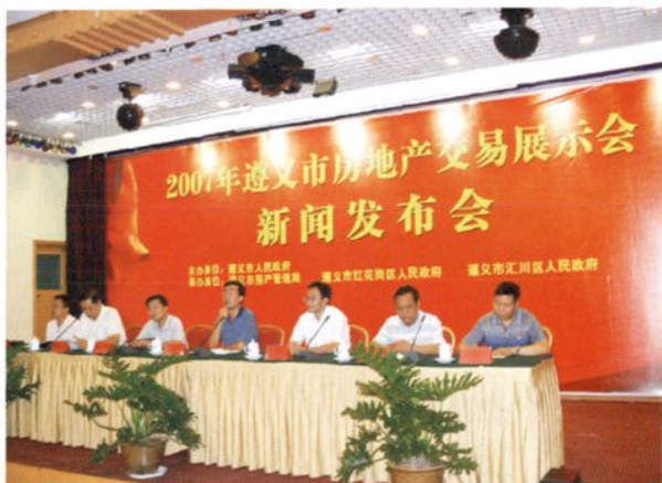
2007年遵义市房地产交易展示会新闻发布会