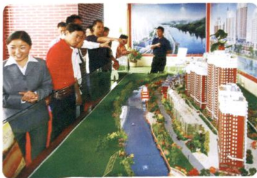
2007年9月，遵义市第八届房地产交易会展示会参展楼盘