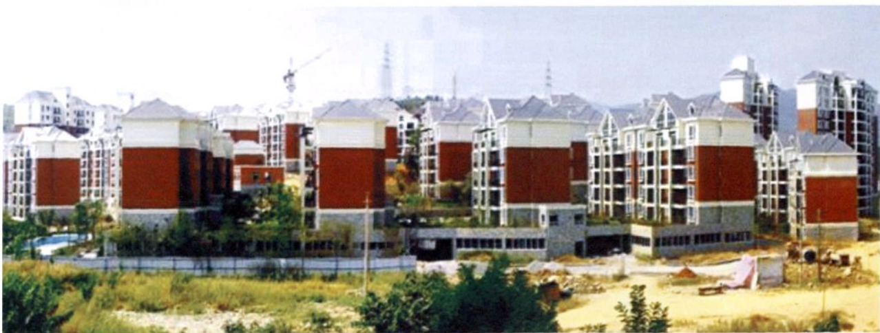
开发中的遵义东欣·彩虹城（2008年）