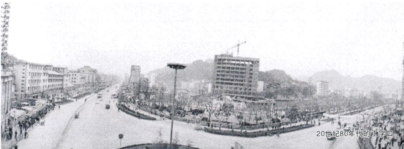
20世纪80年代的丁字口