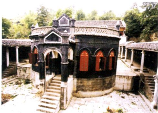
桐梓县城民国19年修建的周公祠