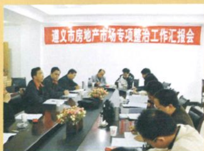
2007年10月8日，遵义市房地产市场专项整治工作汇报会