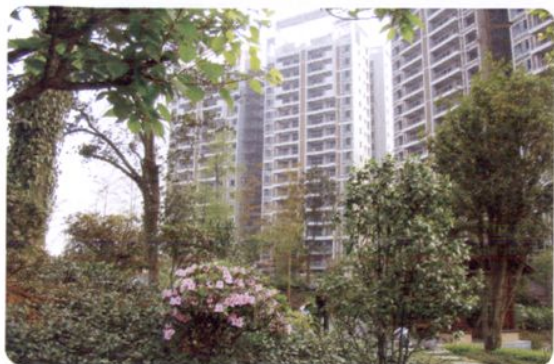
爵士蓝岛住宅小区