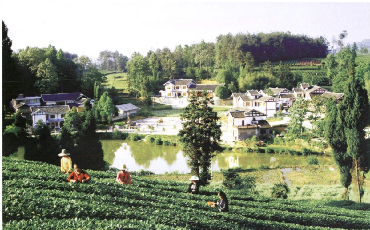
湄潭县田家沟民居