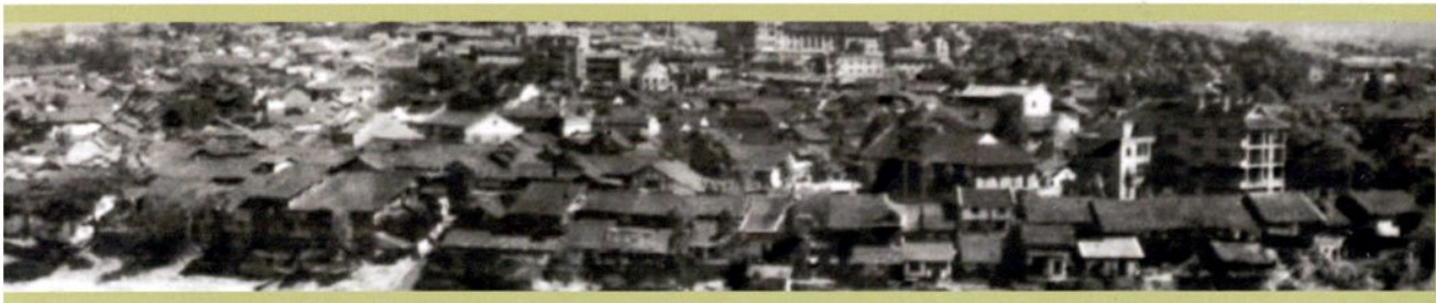
20世纪60年代赤水城民居