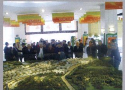
2007年遵义市离退休老干部参观桃溪河畔小区