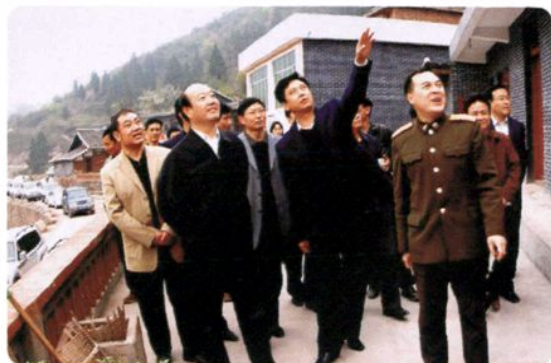
2007年3月15日，中共遵义市委书记傅传耀（左二）视察习水县新农村建设