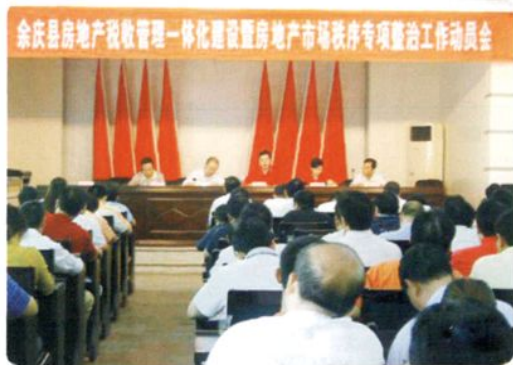
2007年9月5日，余庆县房地产市场专项整治工作会