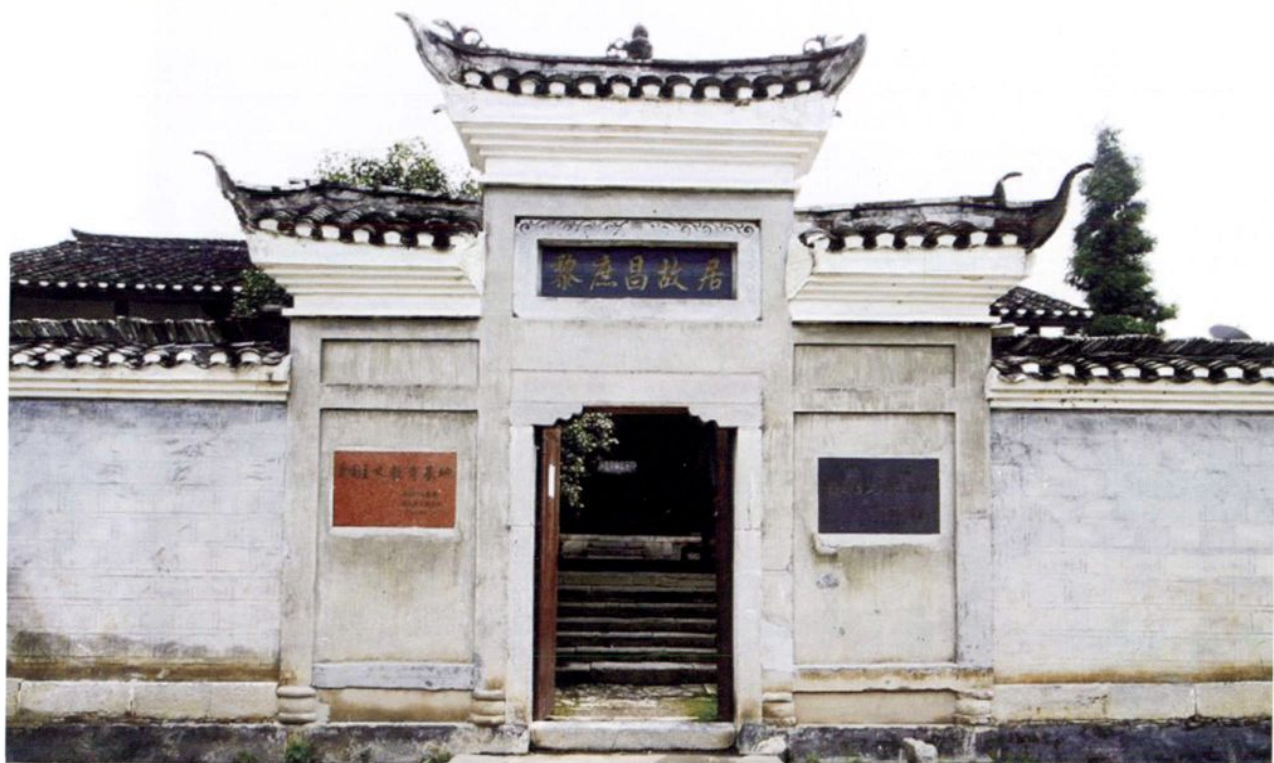
遵义县新舟镇清代光绪年间黎庶昌故居正门