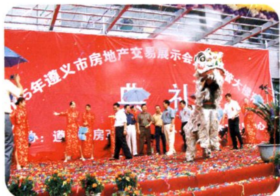
2005年遵义市房交会开幕式现场