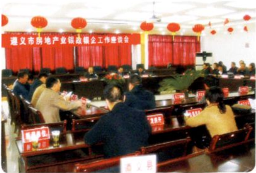
2008年遵义市房地产业银政银企工作座谈会