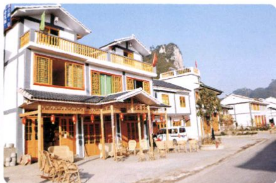
遵义县板桥镇民居