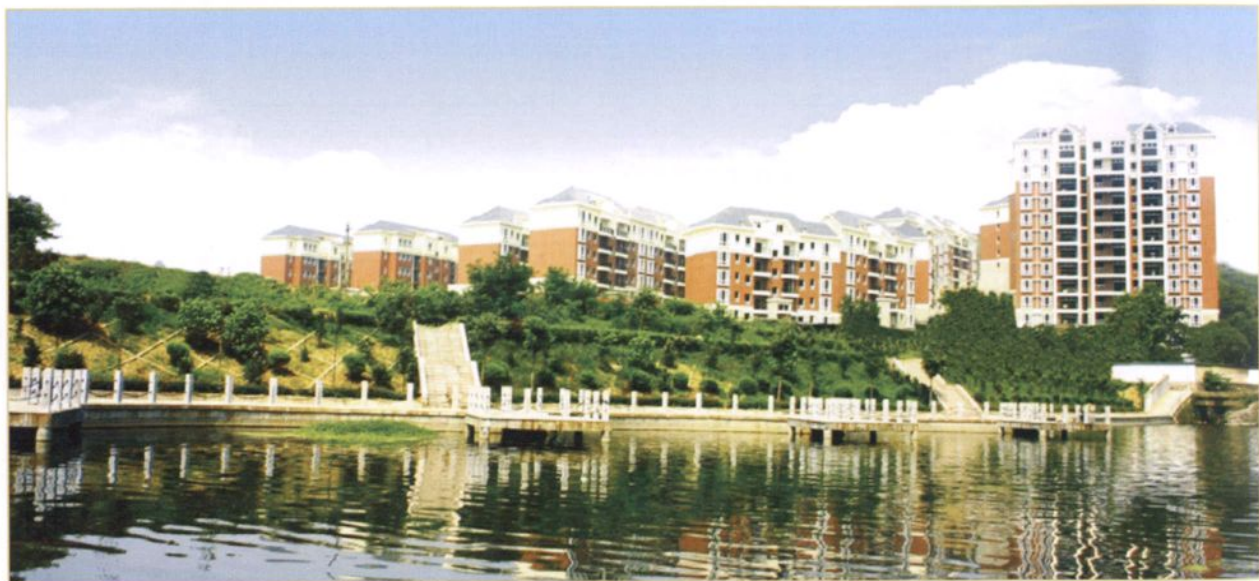
东欣彩虹城住宅小区