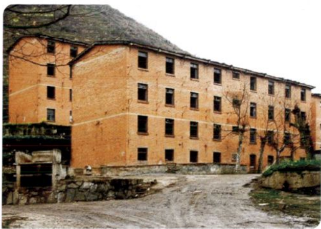
061基地3414厂60年代修建的职工住房