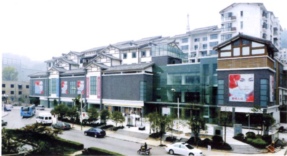
2007年开发的遵义市老城新街民居