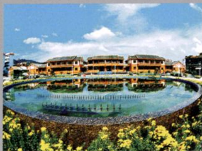
遵义老城纪念广场