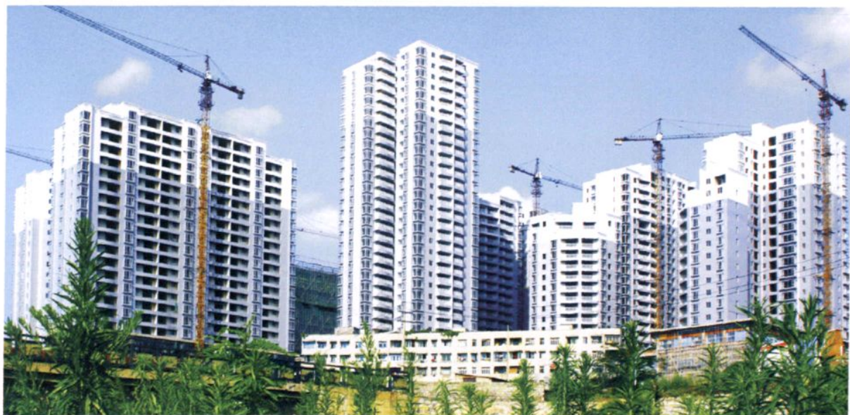
正在修建的遵义市南部新城（2007年）