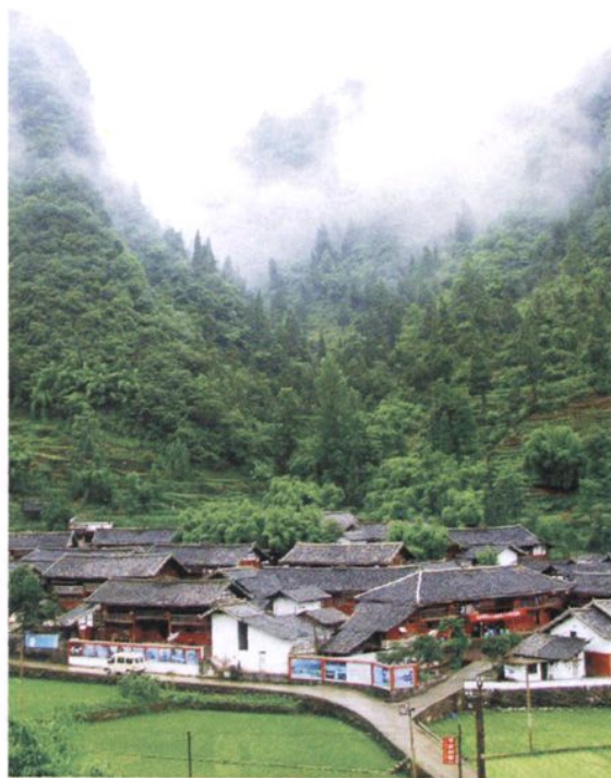
绥阳县耿家寨民居