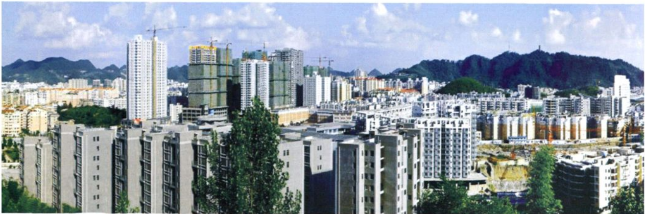
遵义市北部新城（2007年）