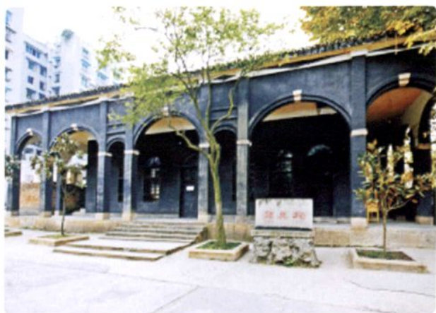
民国19年（1930年）修建的郑莫祠（现位于遵义市城区）