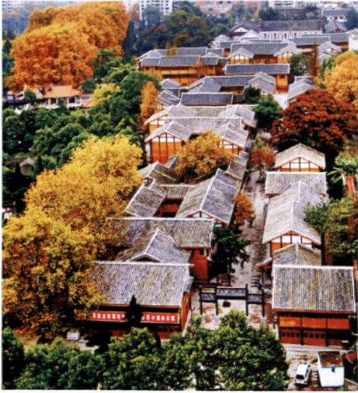
2007年新建的遵义市红军街