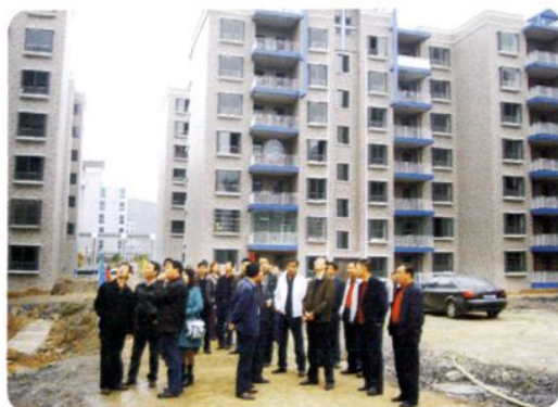
遵义市各县（市）房管（建设）局负责人参观习水县城正在建设中的住宅小区