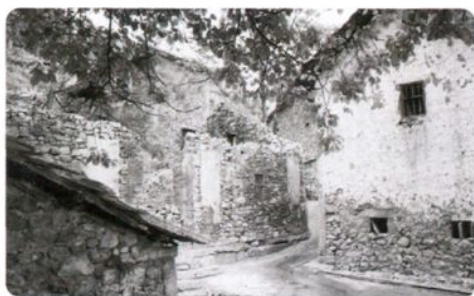
20世纪50年代凤冈县 绥阳镇大石村民居（干打 垒房）