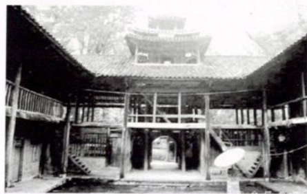
明代民居（碉楼） 正安县土坪镇林溪村