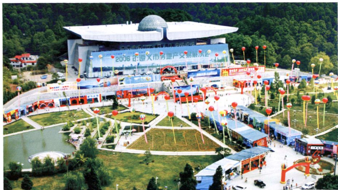
2006年遵义市房交会主会场