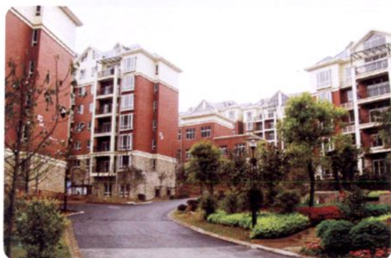
东欣彩虹城住宅小区