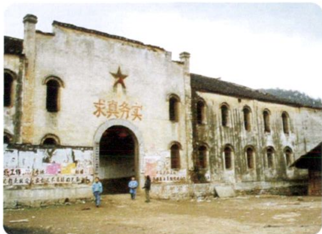
民国时期修建的风冈县新岗村政校