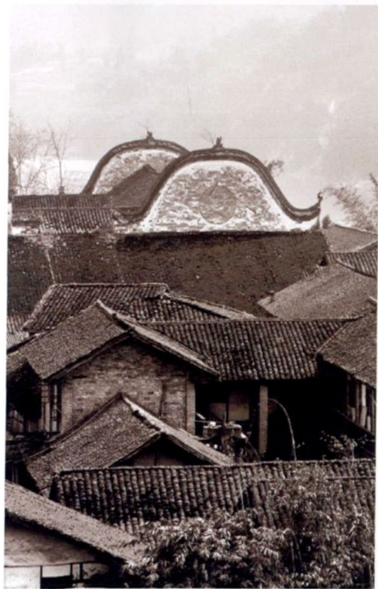
赤水市复兴镇明清时期民居