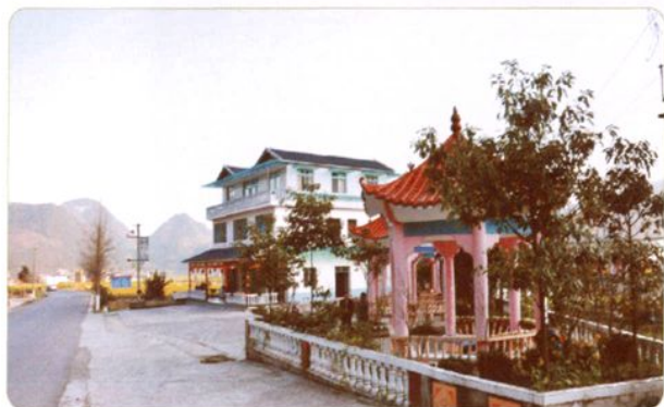
遵义县板桥镇民居