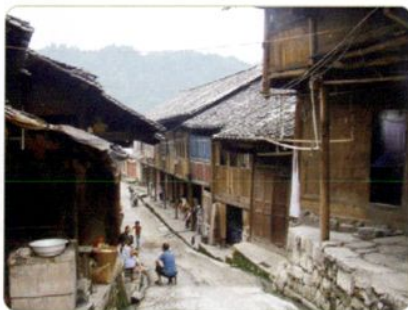
绥阳县茅垭镇民居