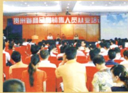
2007年8月17日，举办商品房销售人员从业培训班