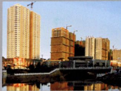
建设中的大成帝景（2007年）