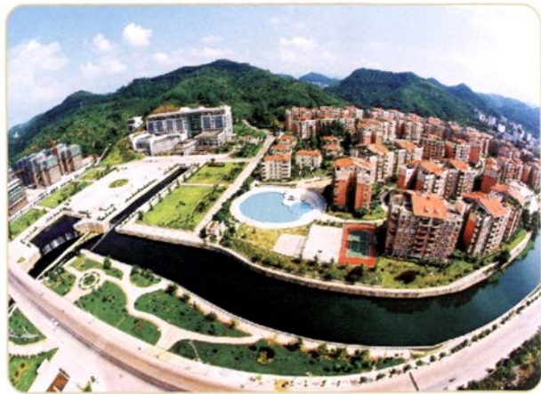
遵义市政府办公区