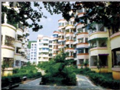
凤冈县计生花园（2005年）