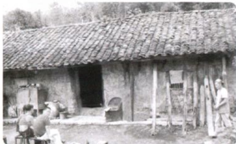
20世纪50年代仁怀县 民居（土墙房）