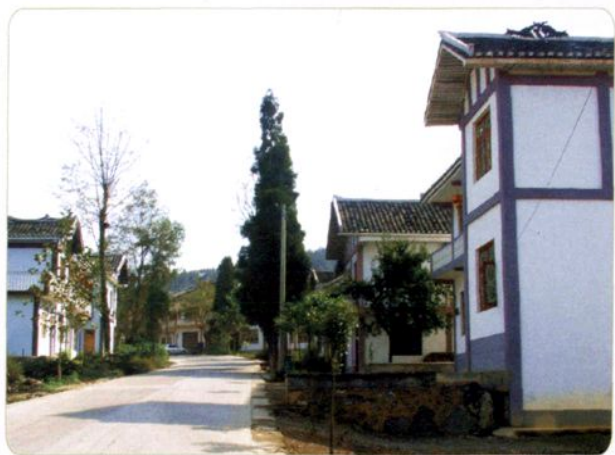
乡路民居（凤冈县永安镇）