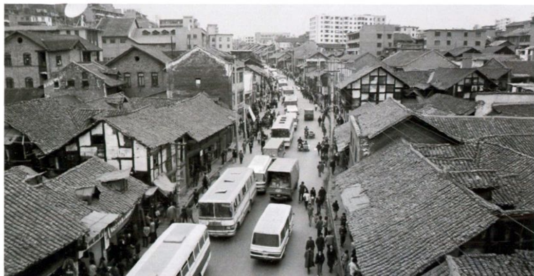
20世纪80年代的遵义路（现中华路）民居