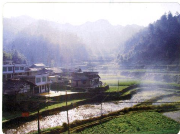
乡舍晨曦（汇川区高坪镇）