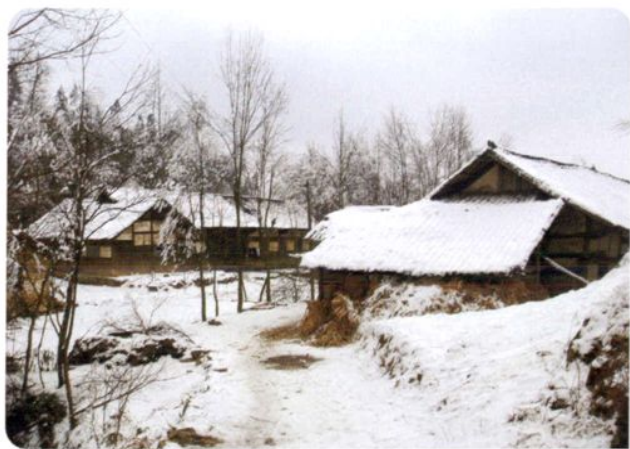
20世纪80年代的遵义县平正乡民居