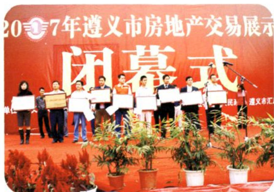
2007年遵义市房交会闭幕式现场