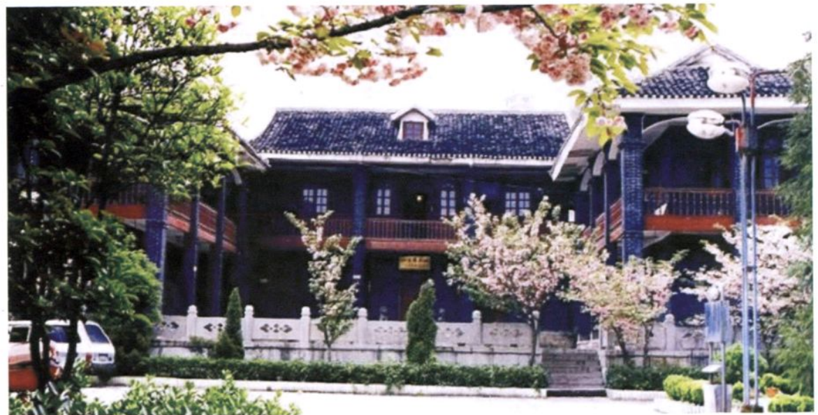
桐梓县城民国6年修建的周西成（贵州省主席）公馆