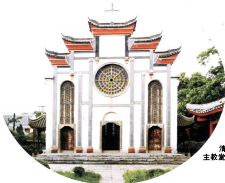
清代修建的遵义中心城区天主教堂（红军总政治部旧址）