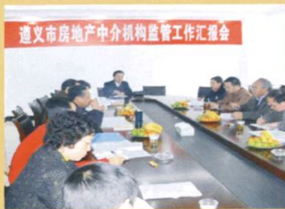
2007年3月12日，遵义市房地产中介机构监管工作汇报会