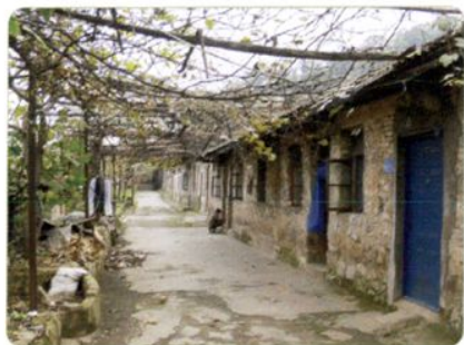
60年代贵州蚕科所职工住房