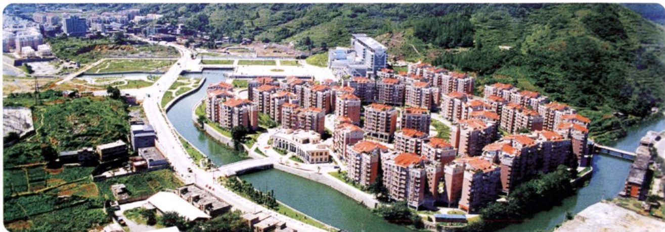
遵义市政府一小区