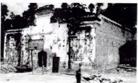
祠（火砖房） 凤冈县清代付氏宗