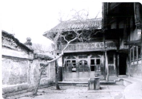
明清时期遵义县尚嵇镇袁姓住宅