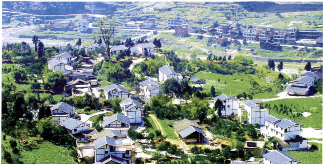
桐梓县松坎镇罗万村民居