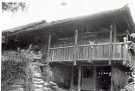
清末民居（吊脚楼） 习水县土城镇统一村