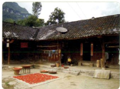
遵义县沙湾镇民居