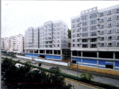
2006年开发的南京路一角