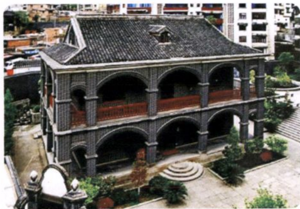
民国22年易少全官邸，位于遵义市中心城区（毛泽东故居）