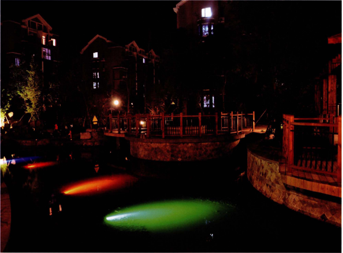
金水源小区夜景一角