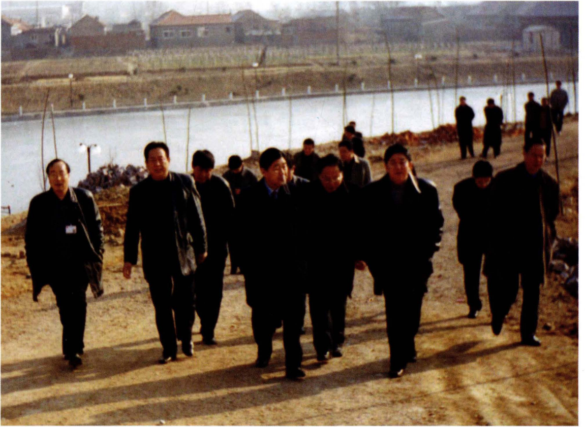
中共山东省常委、青岛市委书记张惠来（前左一）、李沧区委书记王殿章（前右一）在李家上流村视察工作。（2001年1月摄）