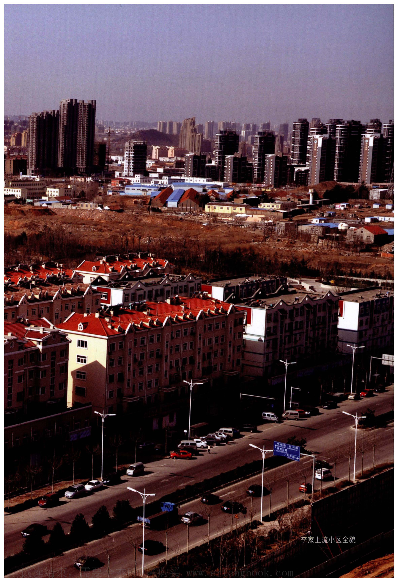
李家上流小区全貌