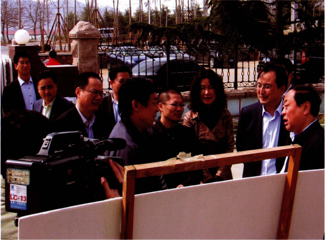
中共山东省常委、青岛市委书记阎启俊（右一）在李家上流社区视察工作。（2010年4月摄）