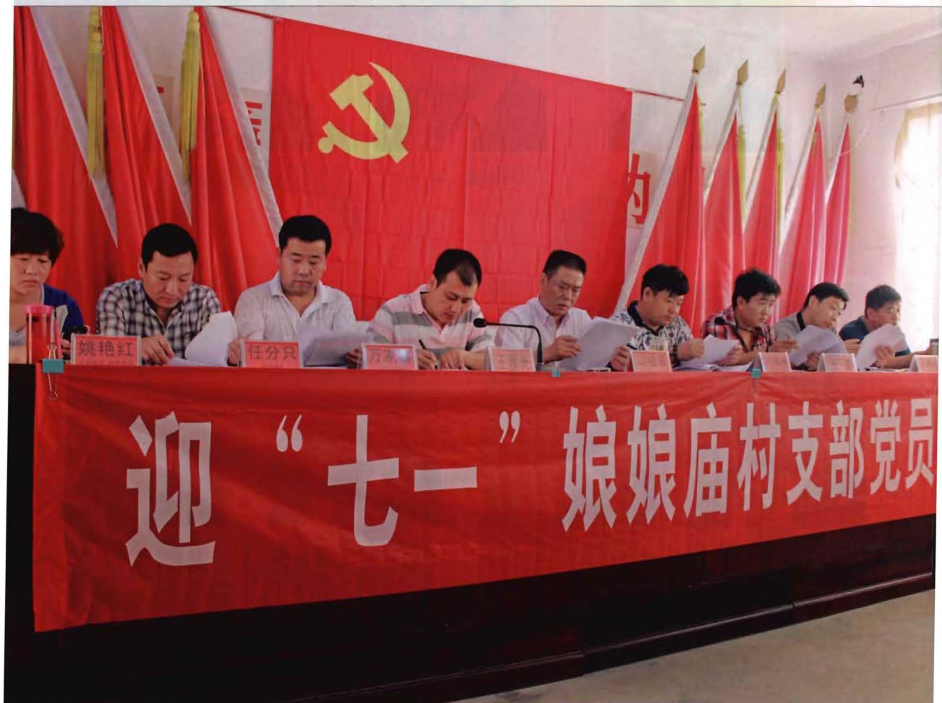
2013年迎“七一”党员大会