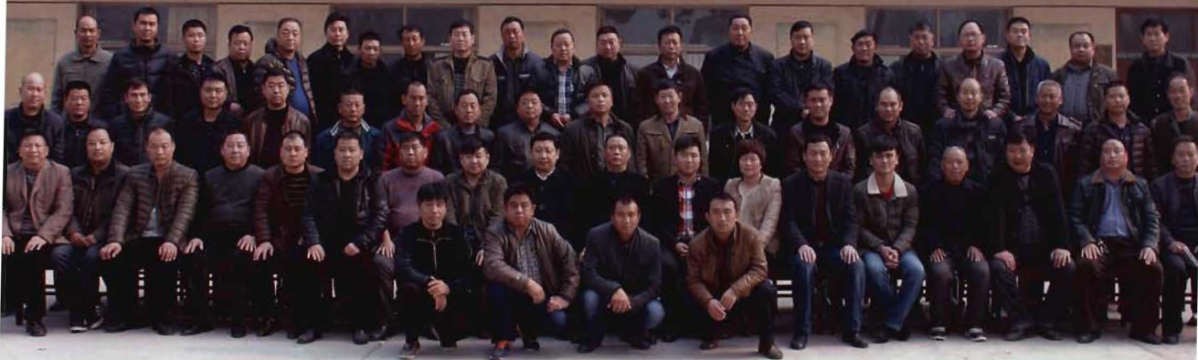
2014年第八届村委会换届选举代表合影