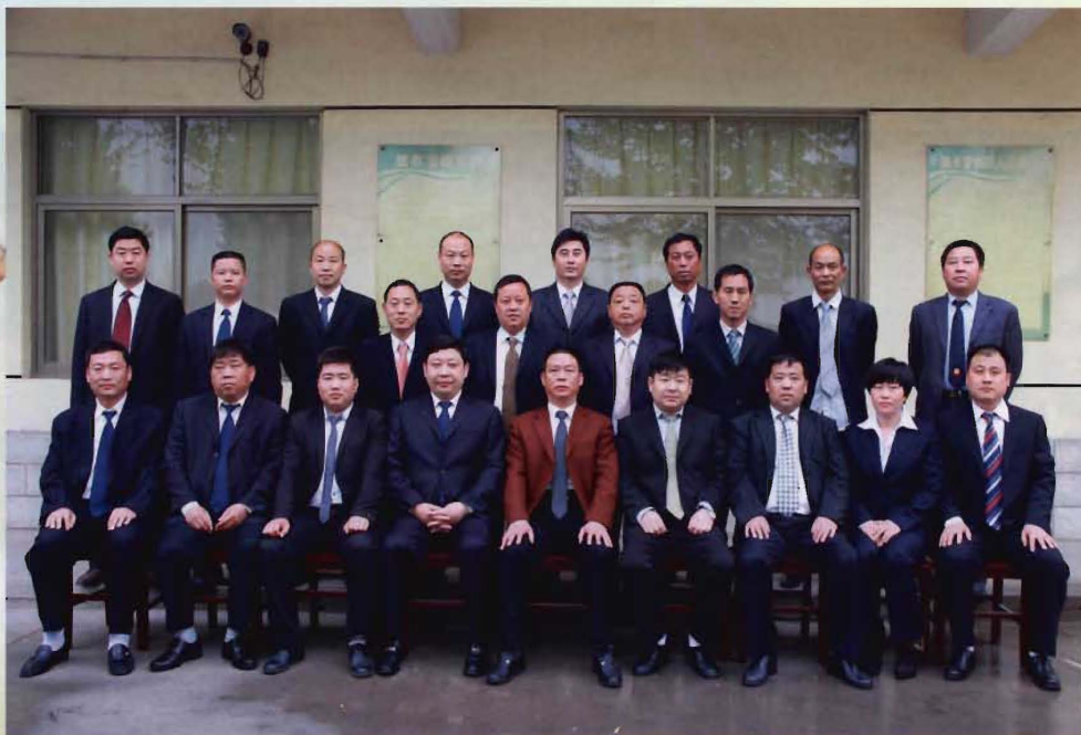
2014年村两委全体工作人员合影