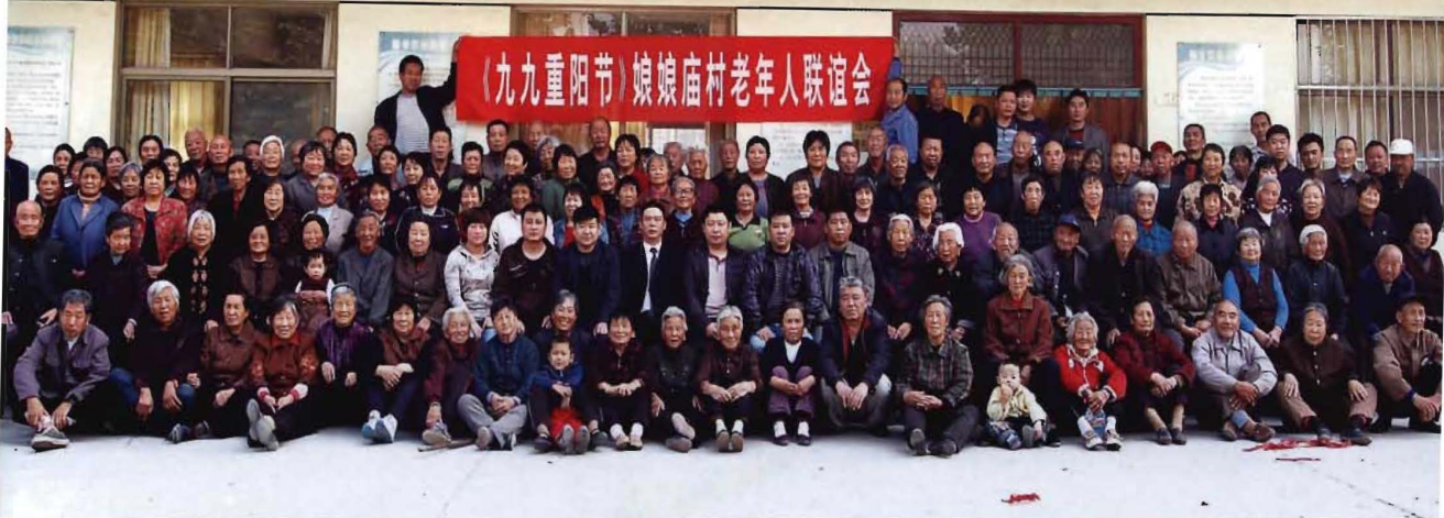
村干部重阳节与老人合影