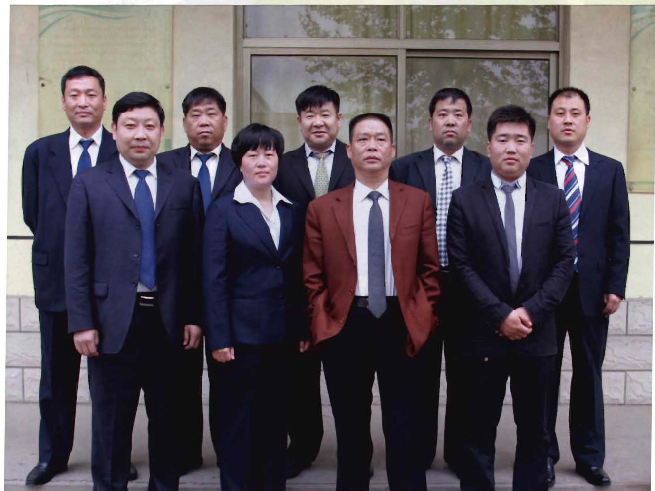
2014年第八届村两委班子合影