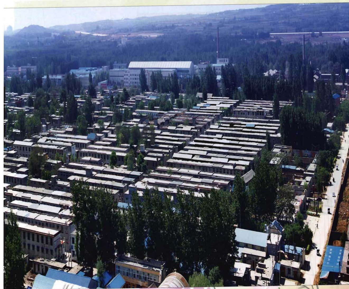
娘娘庙村鸟瞰图（2014年）