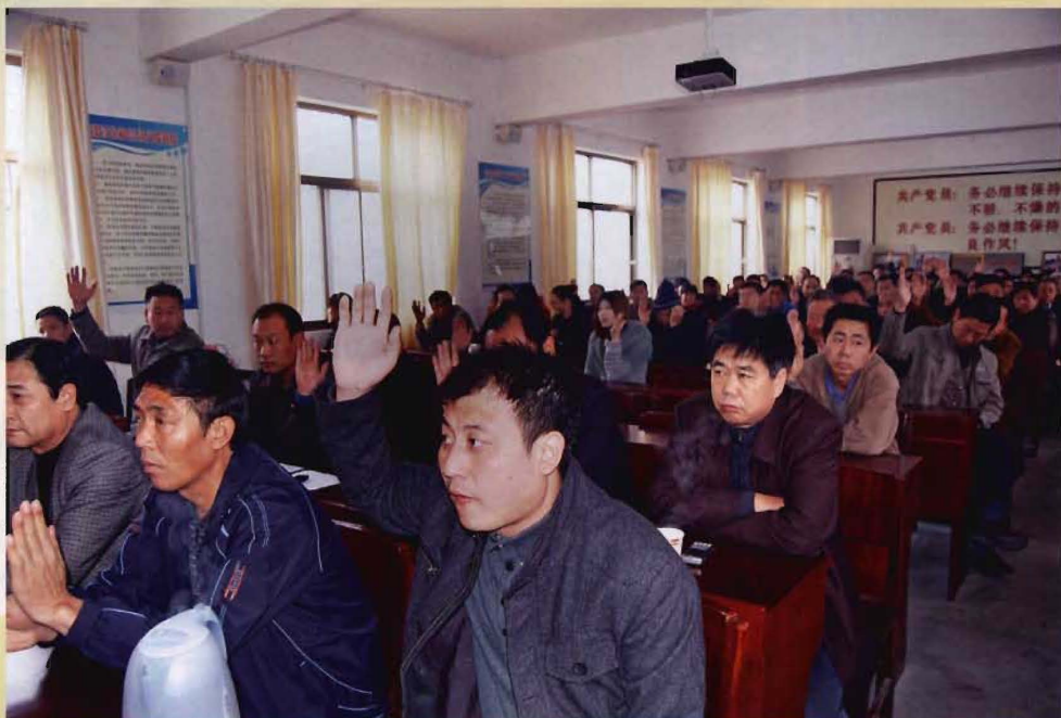
2014年党支部换届选举会场