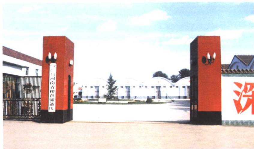
◀ 灵宝一一〇九 河南省粮食储备库