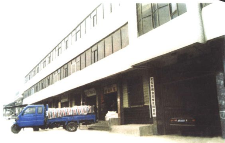
◀ 豫灵粮管所办公楼