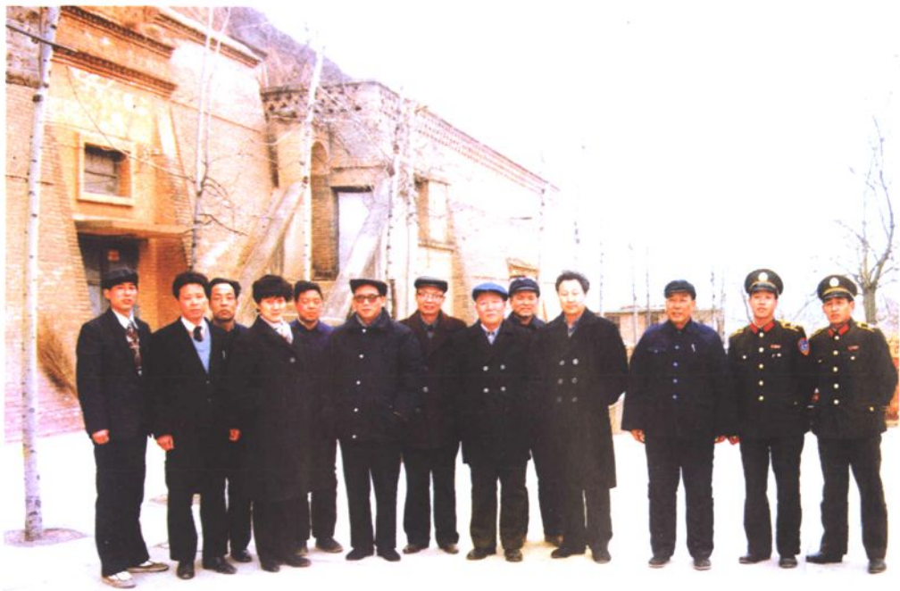
▲国家粮食局局长白美清(左四)、三门峡市委书记王茹珍(左三)等领导视察灵宝县粮食局五〇一地下粮库。(1988.11)