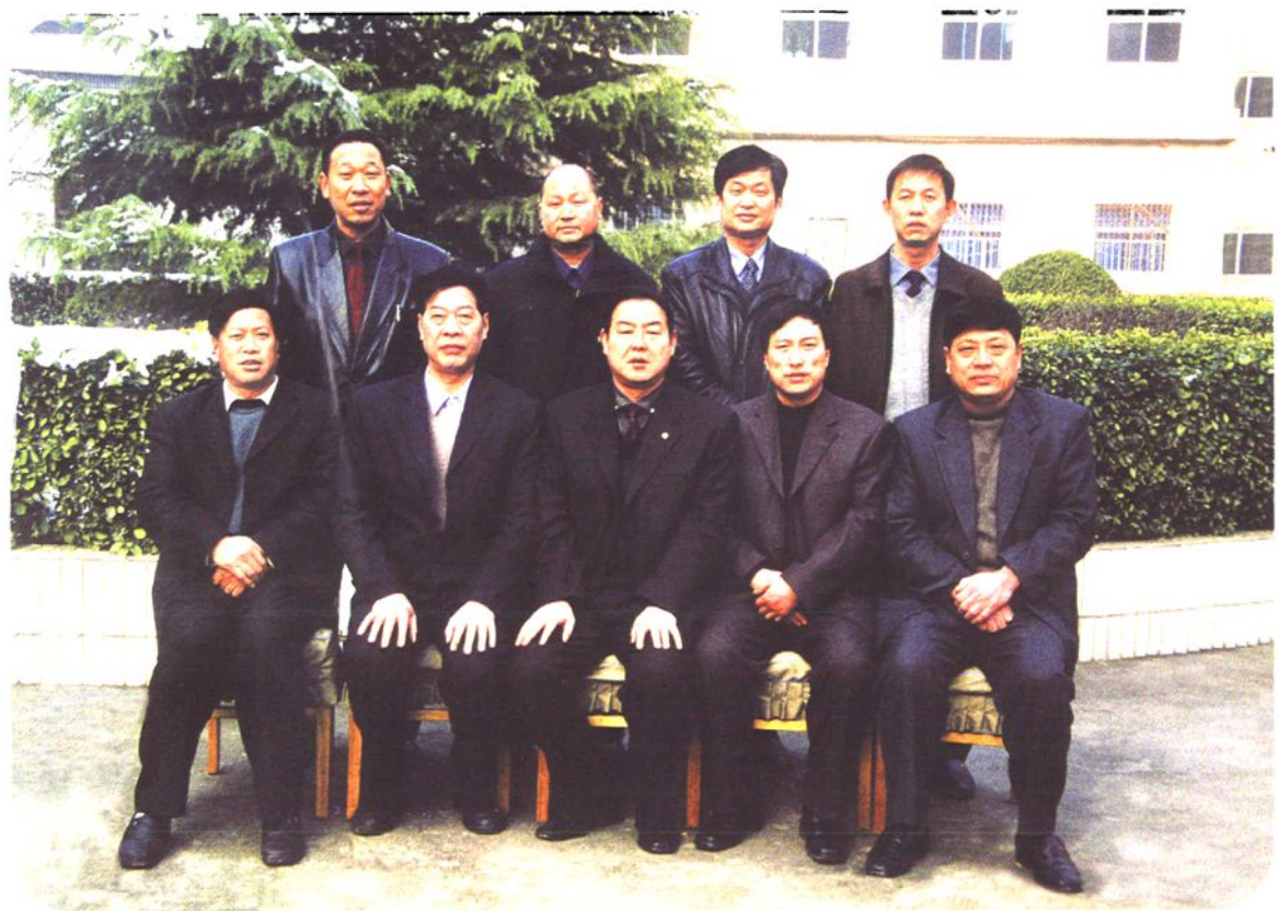
▲灵宝市粮食局党委班子全体成员