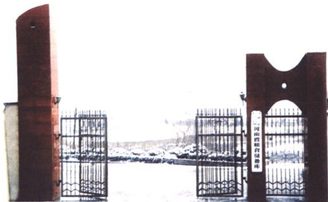
▶灵宝一一〇四 河南省粮食储备库