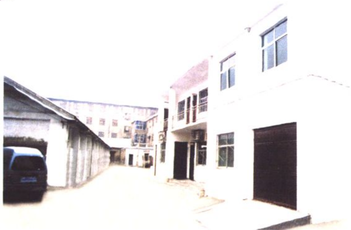
▶城关粮管所办公楼