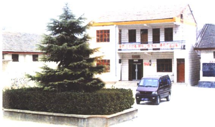
◀ 五亩粮管所 办公大院