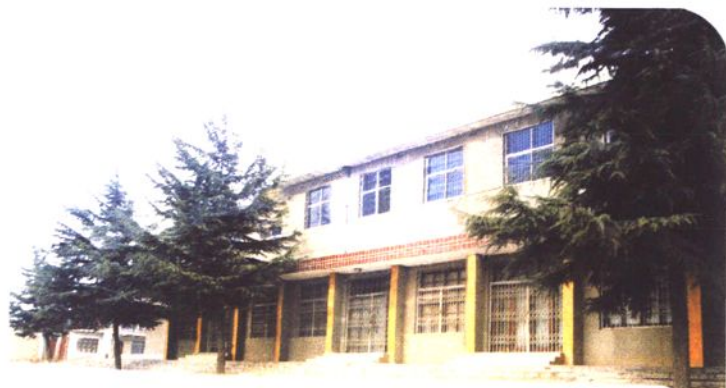
◀ 西阎粮管所街面楼