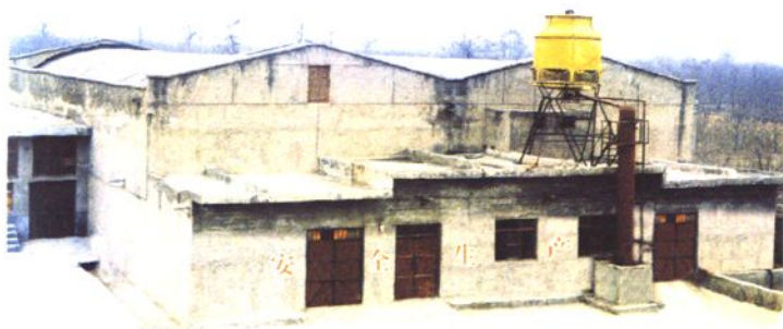
◀ 西阎粮油经营站 百吨冷库