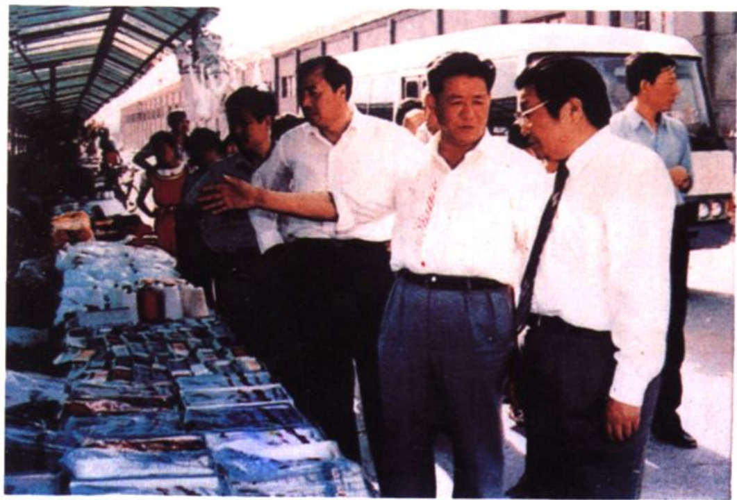
1987年7月,中共山东省委书记梁步庭视察即墨县服装批发市场。