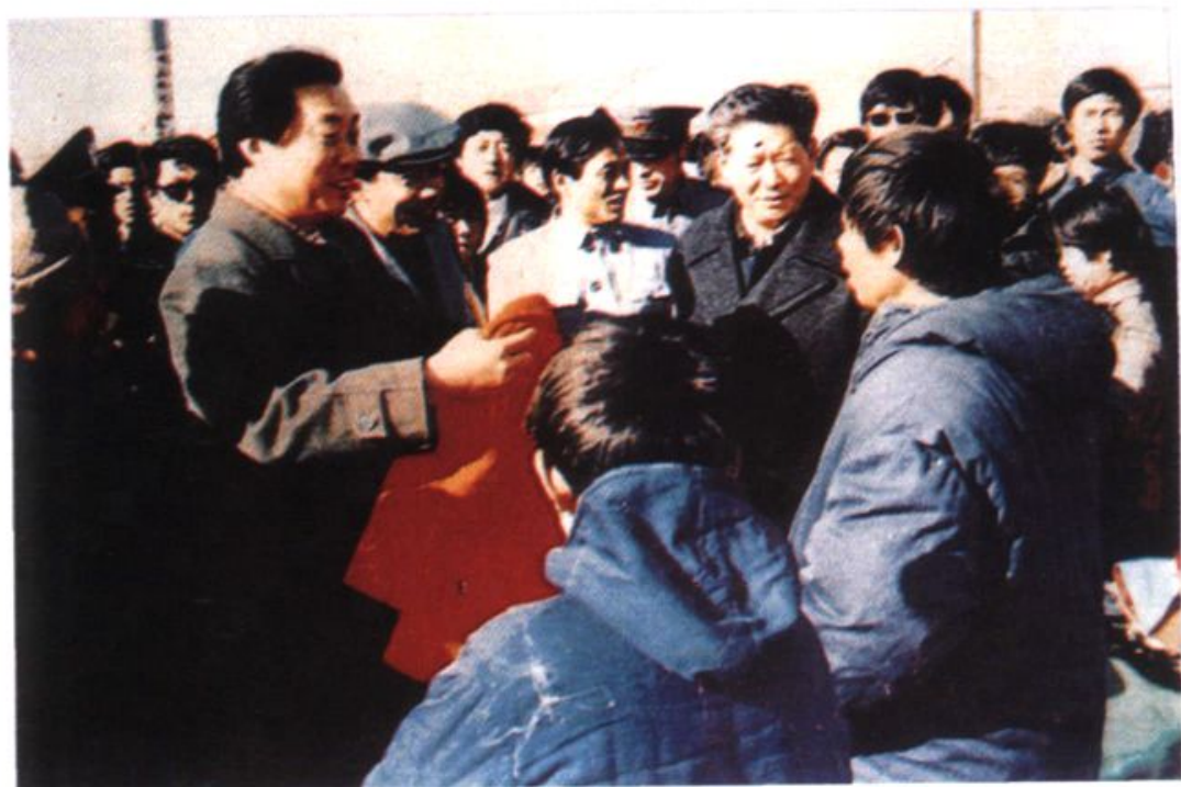
1986年12月6日,山东省省长李昌安视察即墨县服装批发市场。