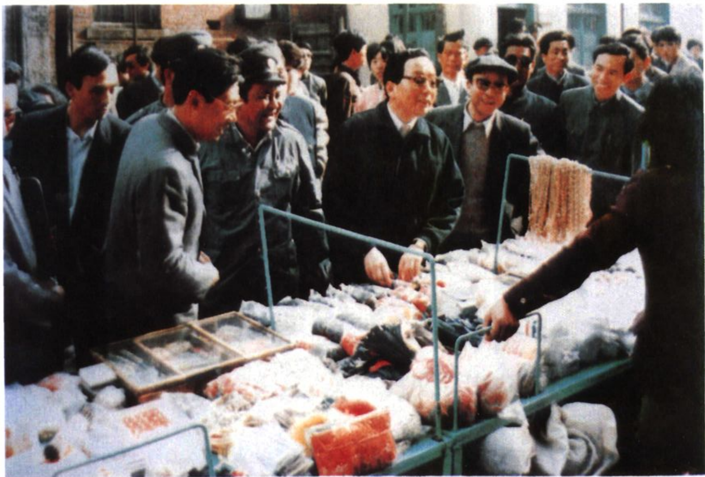
一九八七年五月，中共中央政治局委员、国务院副总理田纪云视察即墨路小商品市场。