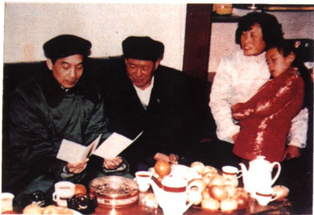
1988年2月7日,中共中央书记处候补书记、办公厅主任温家宝与即墨县服装加工户进行交谈。