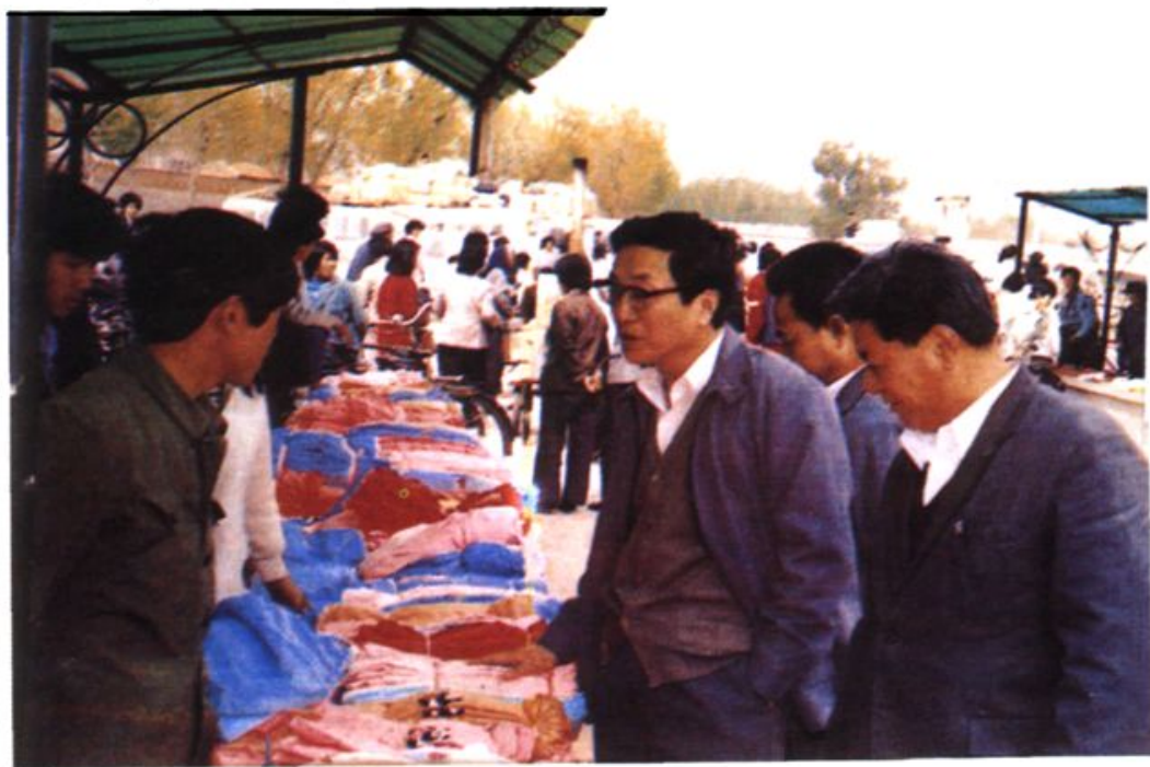
1993年4月,中共青岛市委书记兼市长俞正声视察即墨市服装批发市场,并与个体商贩交谈。