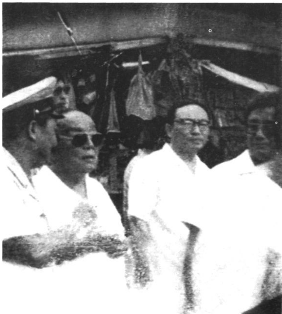
1987年8月29日,国家主席杨尚昆一行30余人在中共青岛市委书记郭松年陪同下,视察即墨路小商品市场。