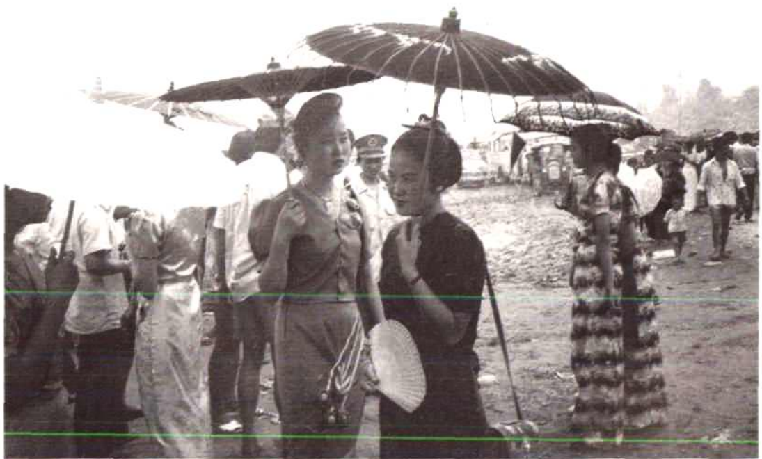
物资职工参加傣历新年活动