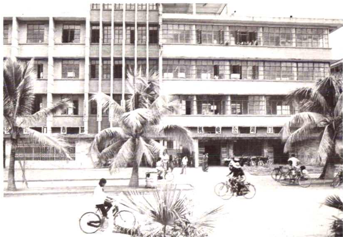
州物资公司办公楼