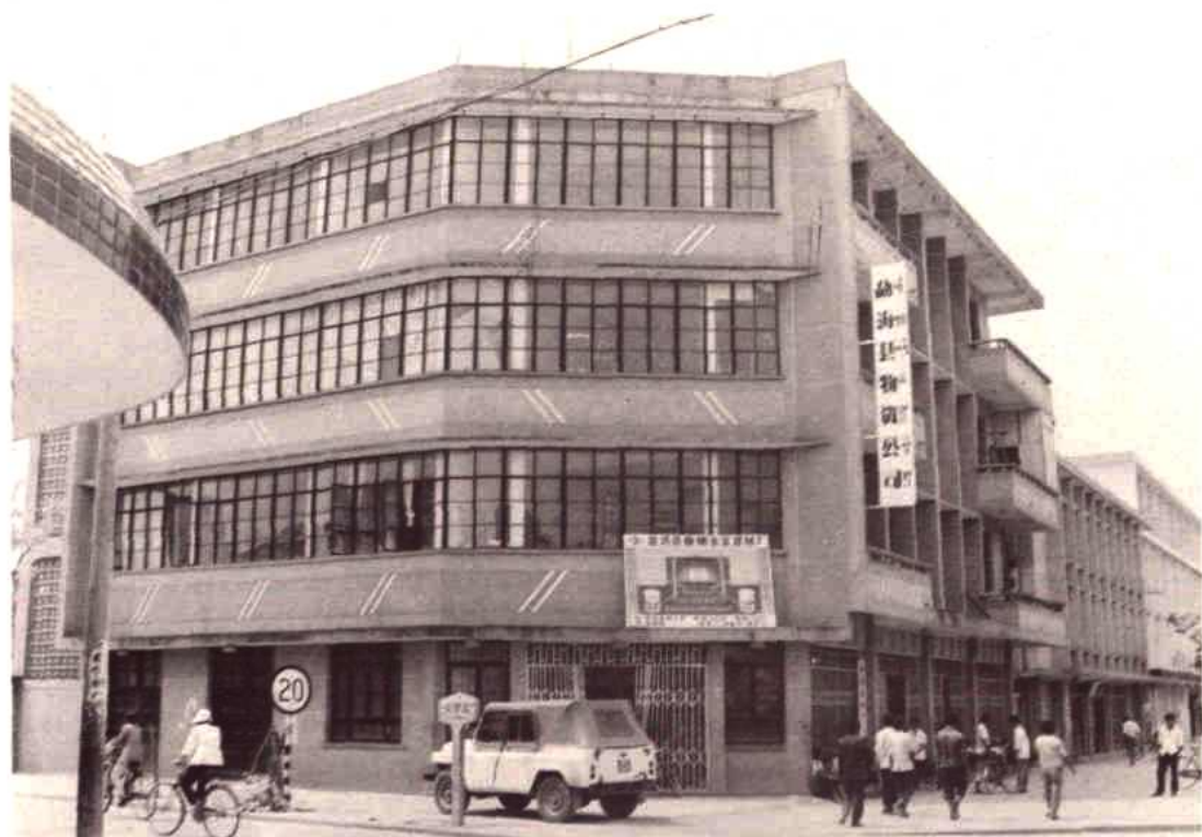
勐海县物资公司办公楼