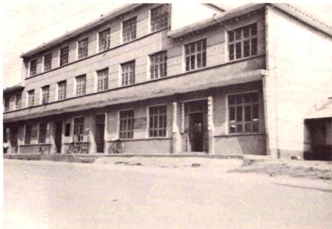
勐腊县物资公司办公楼