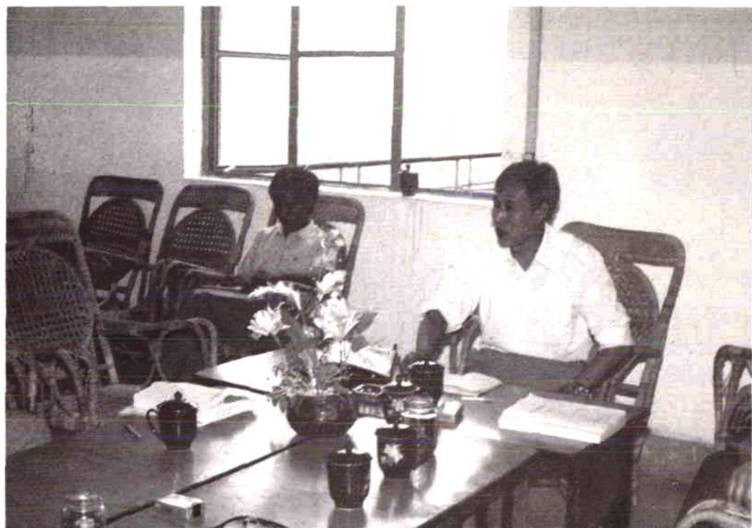
任舜年副州长在物资志稿评审会上讲话