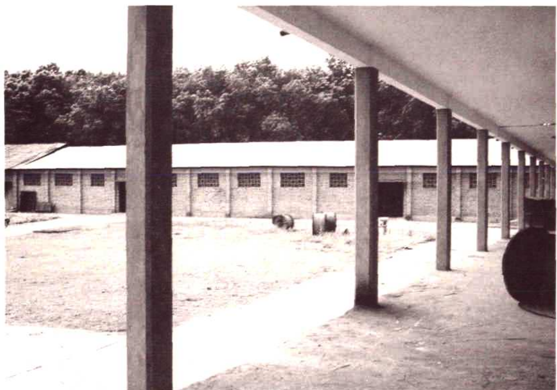
州化轻建材公司仓库