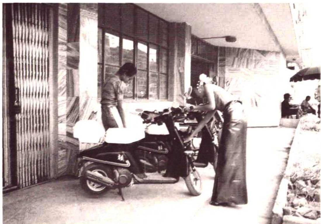
顾客在选购摩托车