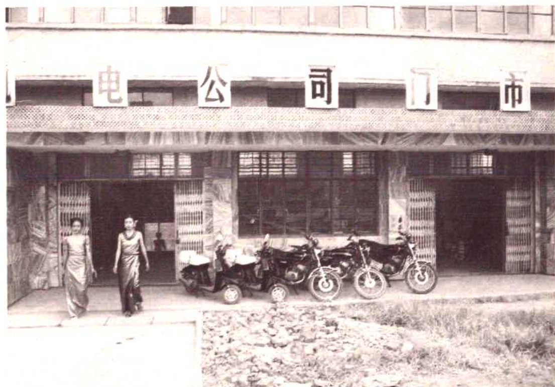
州机电设备公司门市部