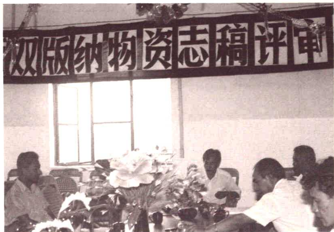
物资志稿评审会议