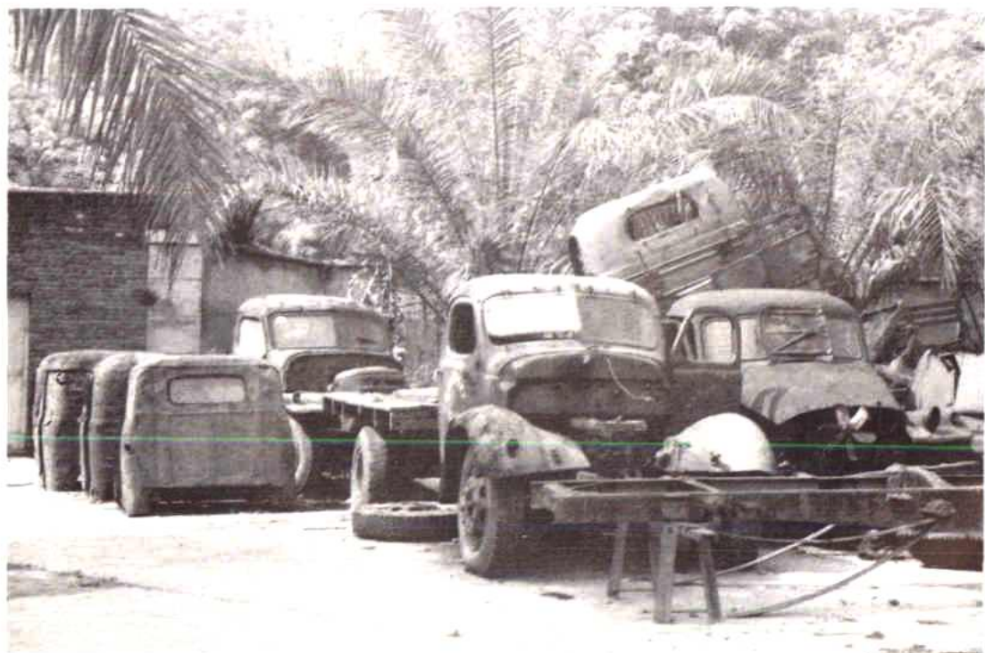
州废旧金属回收公司货场一角