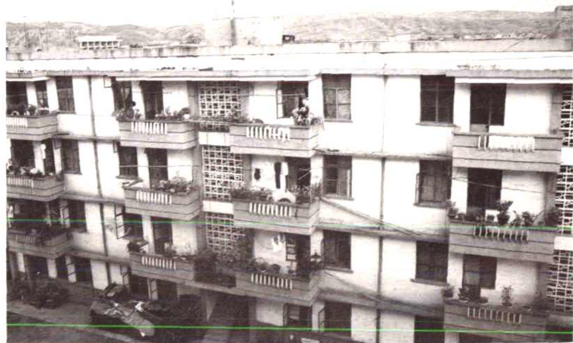
州物资公司职工宿舍