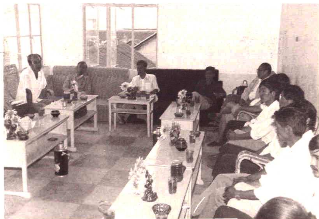
全州物资工作会议