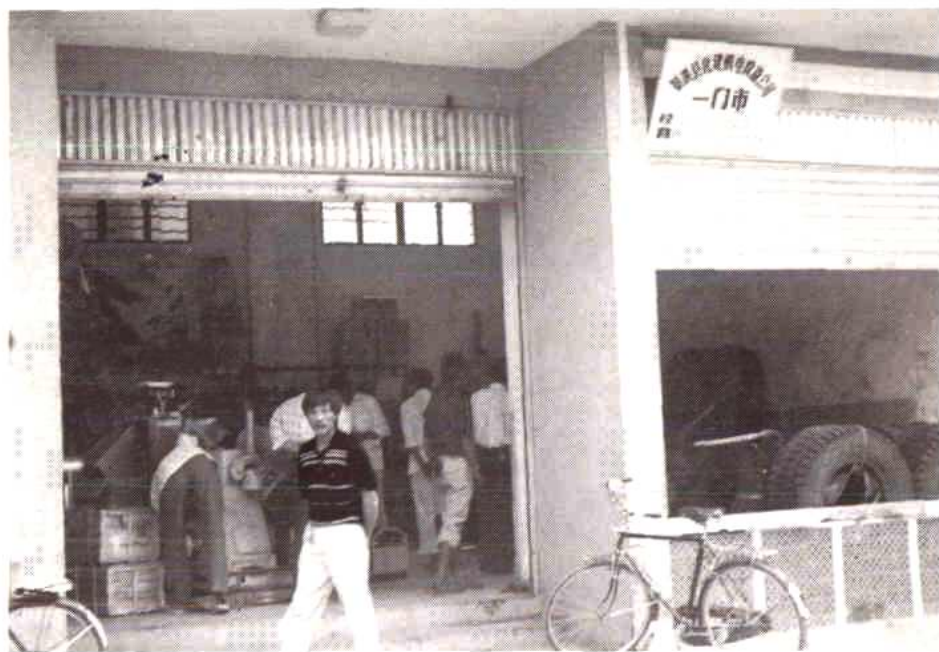
景洪县化建机电设备公司一门市部