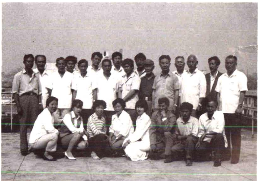
参加物志稿评审全体人员合影