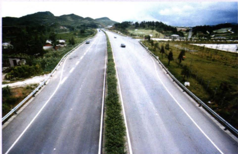
贵阳至遵义高等级公路