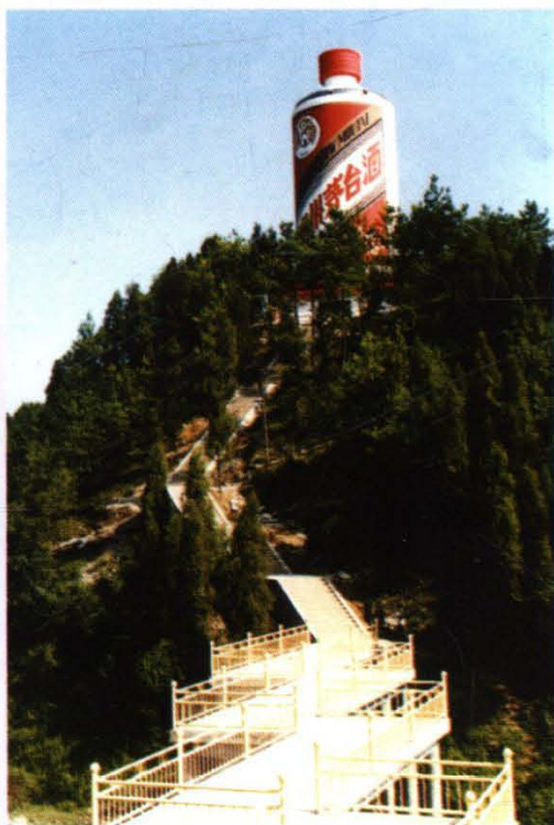
国酒茅台