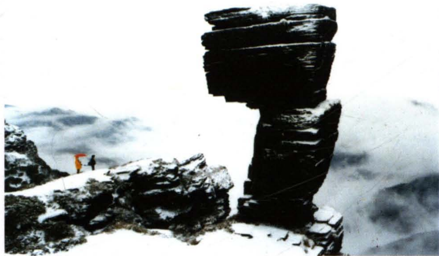
梵净山蘑菇石