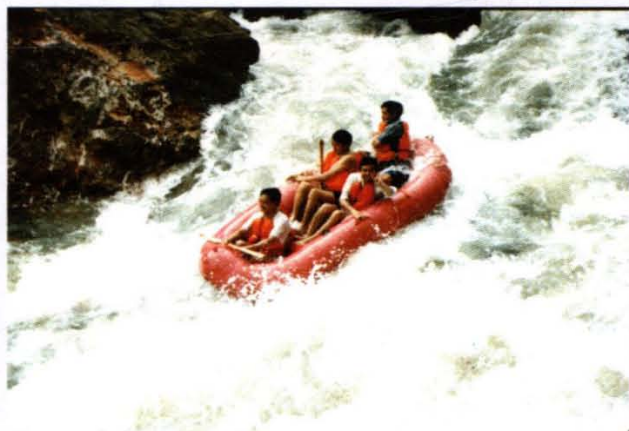
荔波樟江风景区漂流