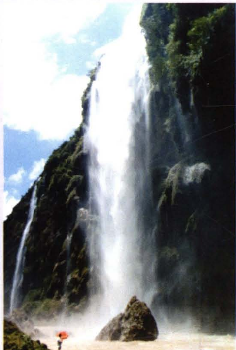
国家风景区马岭河峡谷大瀑布