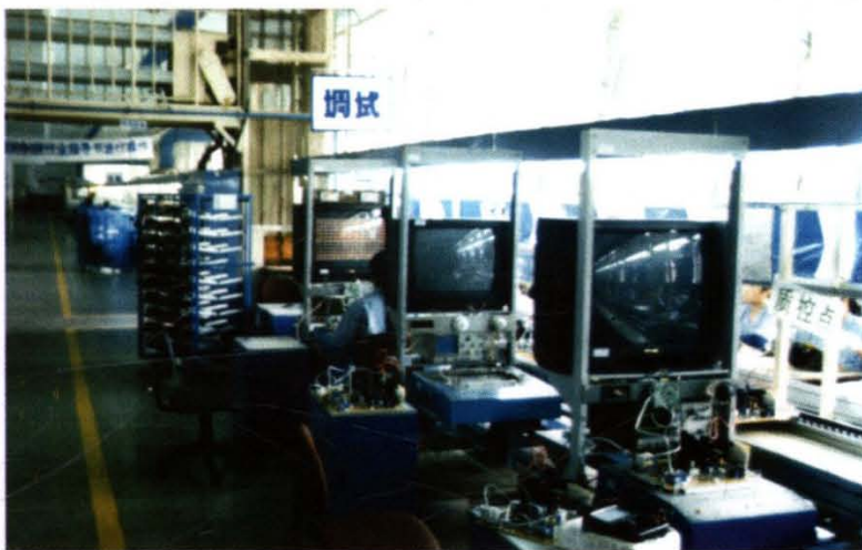
贵州海信电视机厂 青岛办 供稿