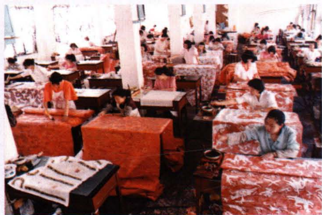
安顺蜡染厂