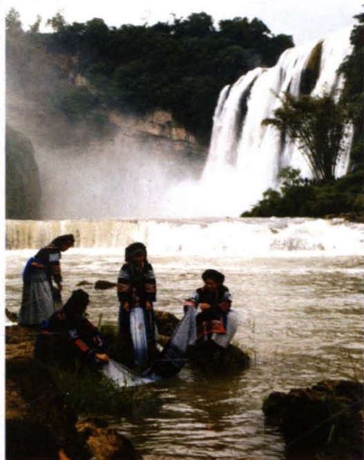
黄果树洗衣歌