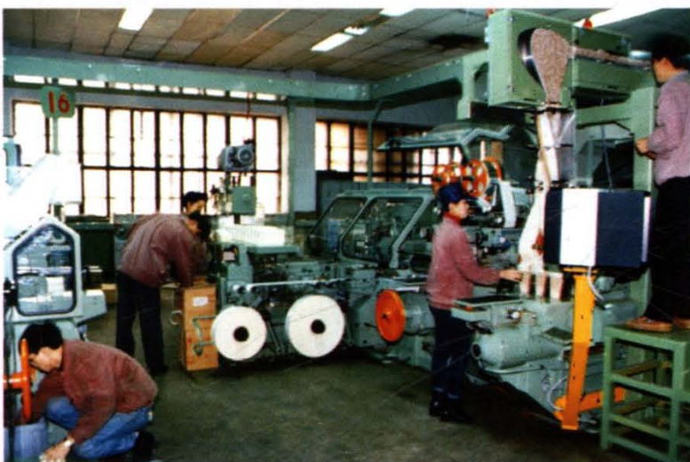
贵阳卷烟厂车间 贵阳卷烟厂办 供稿