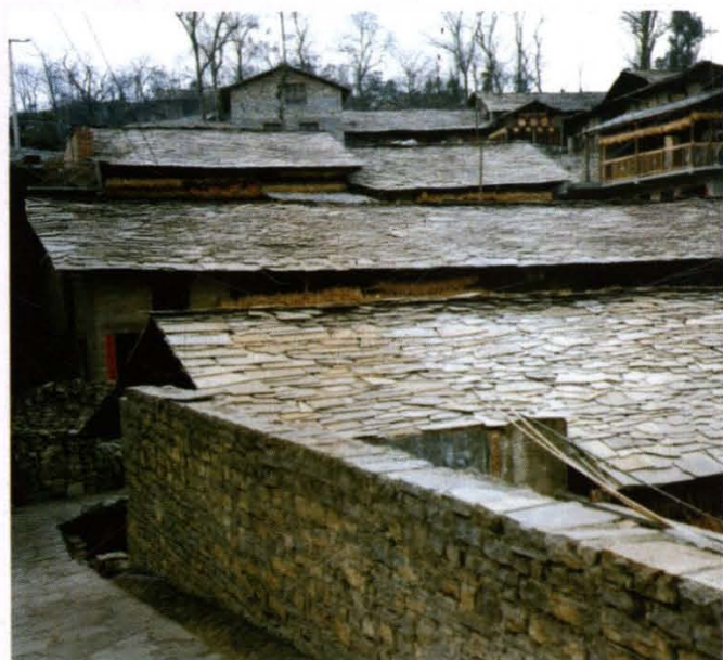
花溪镇山布依寨石板房