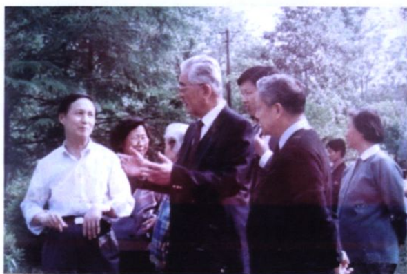
1993年5月22日，时任国家副主席荣毅仁及夫人来我园视察。