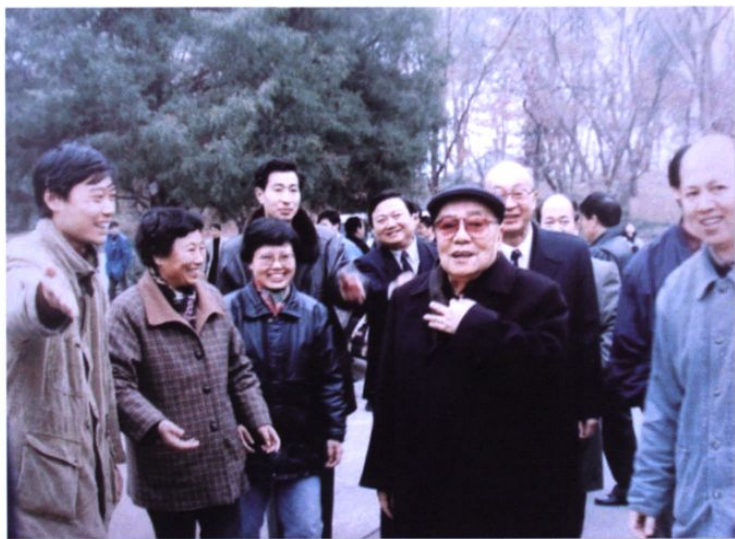
1995年12月4日，原国家主席杨尚昆来我园视察。