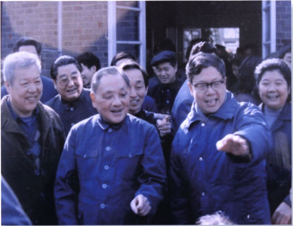
1985年2月3日，邓小平同志来我国视察。