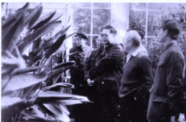
1983年12月10日，时任国务院副总理李鹏来我园视察。