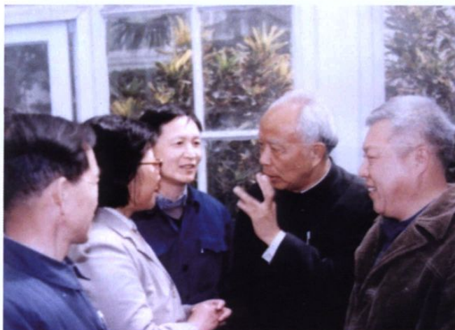
1985年4月2日，时任国务院副总理万里及夫人来我园视察。