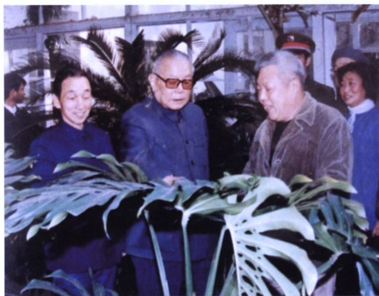
1985年12月28日，原国家主席李先念来我园视察。