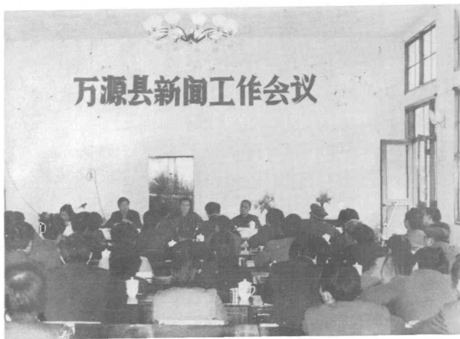
1988年4月，召开万源县新闻工作会议，并培训业余通讯员。