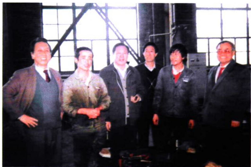
胡富国等领导与车间工人合影