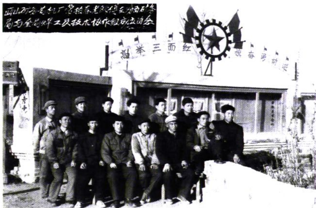
1964年11月，西山局机修厂与汾西局机修厂联合成立了焊工技术协作组