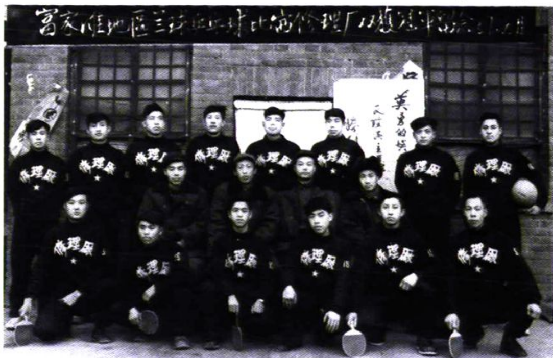
富家滩修理厂篮球队与乒乓球队