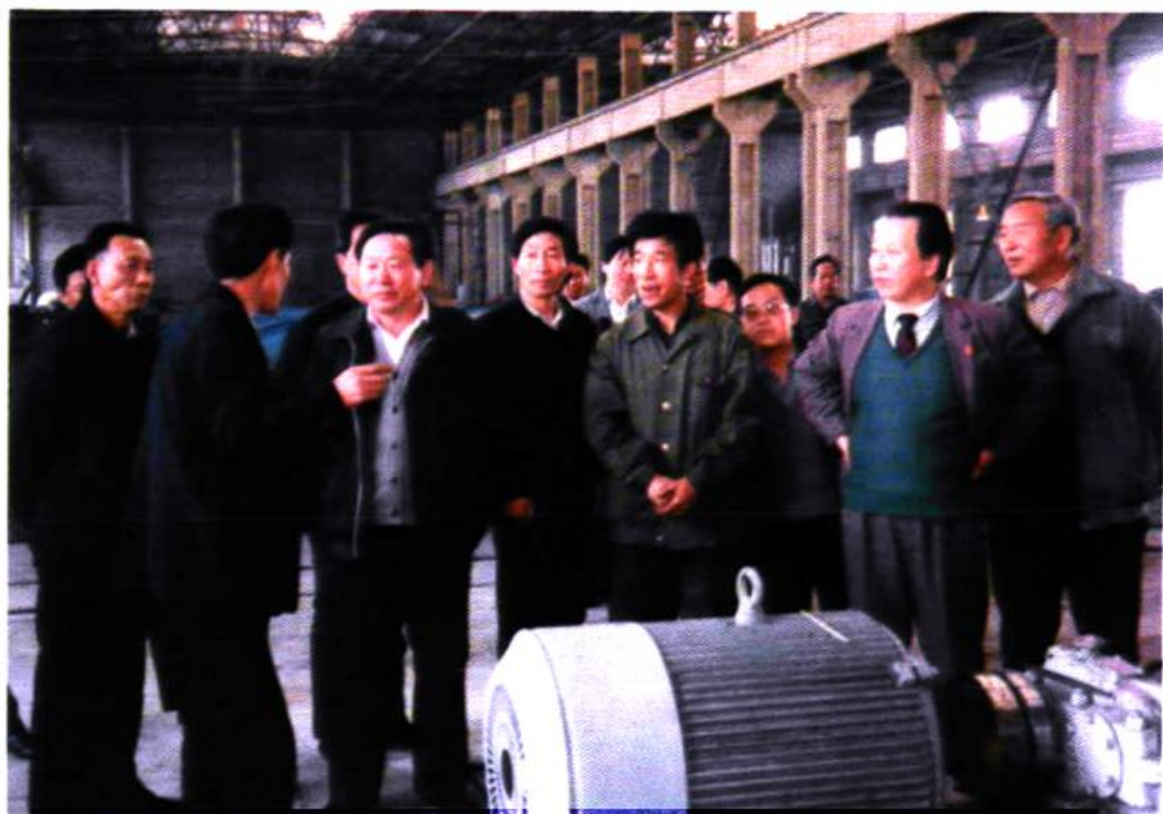
1991年，原中国统配煤矿总公司总经理胡富国来厂调研