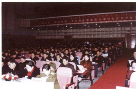
全体代表听取各项报告