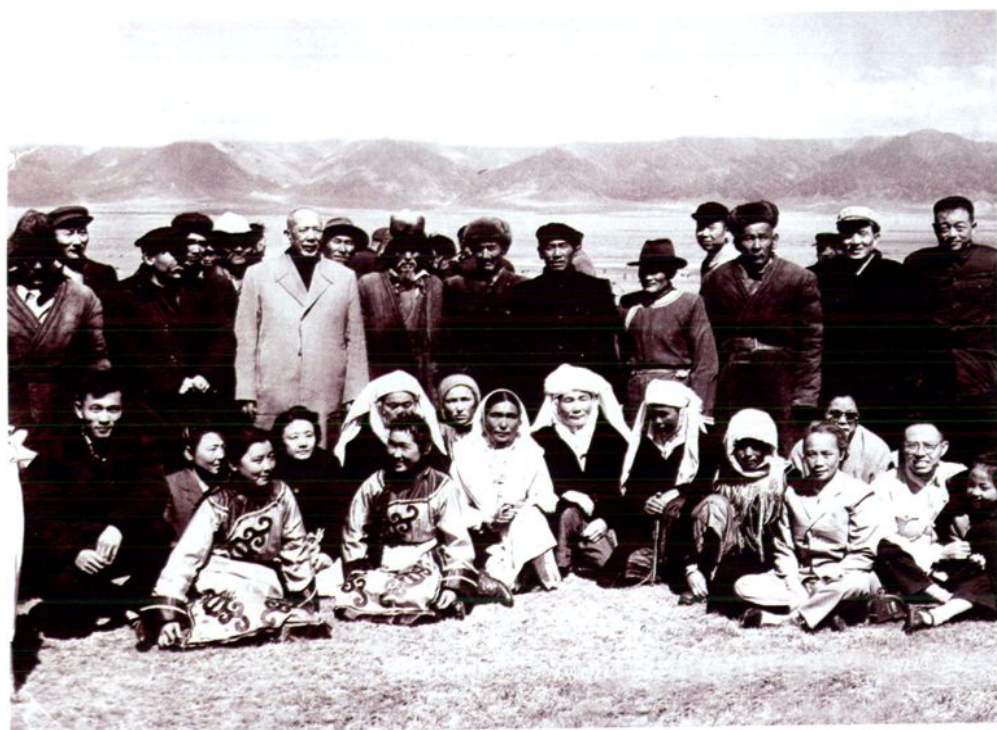
1961年全国人大常委会副委员长李维汉在博州视察