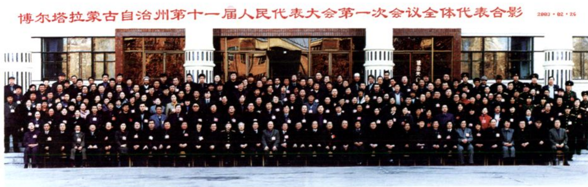
2003年2月 自治州第十一届人民代表大会第一次会议代表合影