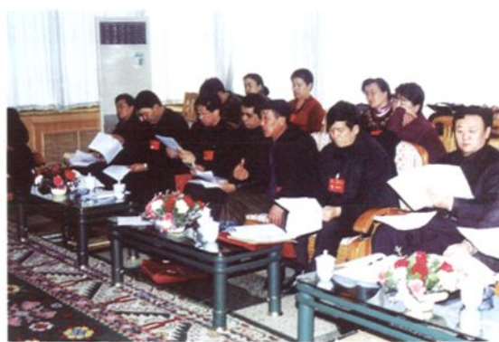
代表分组审议各项报告