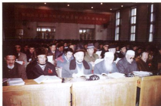
全体代表听取各项报告