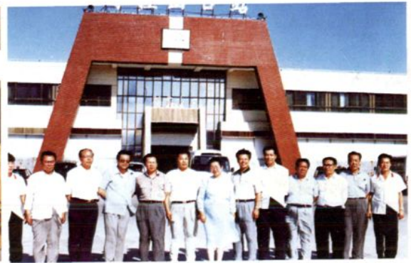
1998年7月 自治区人大常委会副主任海里且姆·斯拉木在博州视察