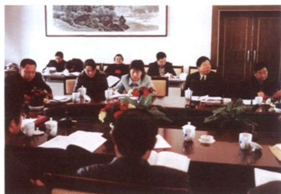
代表分组审议各项报告