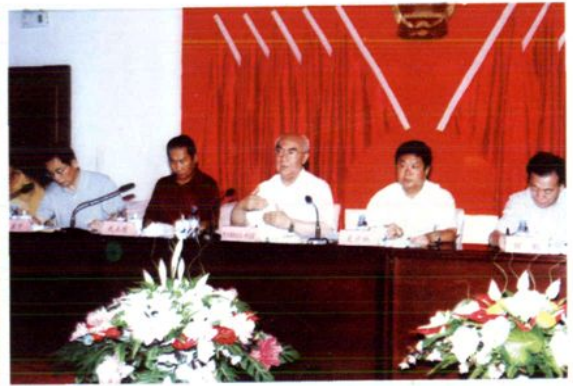
2005年8月 自治区人大常委会主任阿不都热依木·阿米提在博州召开的自治区州市地人大工作联系会议上做重要讲话