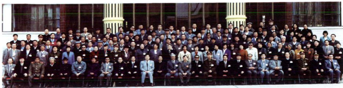
1993年3月 自治州第九届人民代表大会第一次会议代表合影