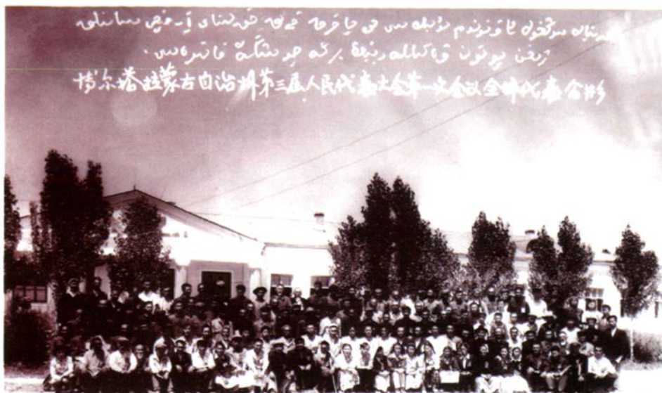
1952年5月自治州第三届 人民代表大会第一次会议代表 合影