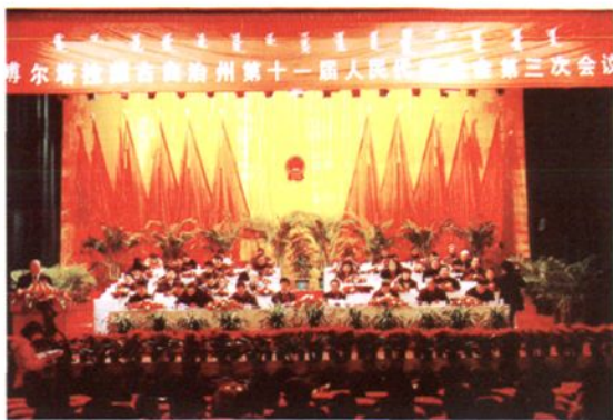
2005年2月 自治州十一届人大三次会议在博尔塔拉影剧院举行