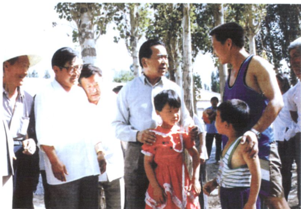
1995年全国人大常委会副委员长铁木尔·达瓦买提在博州视察