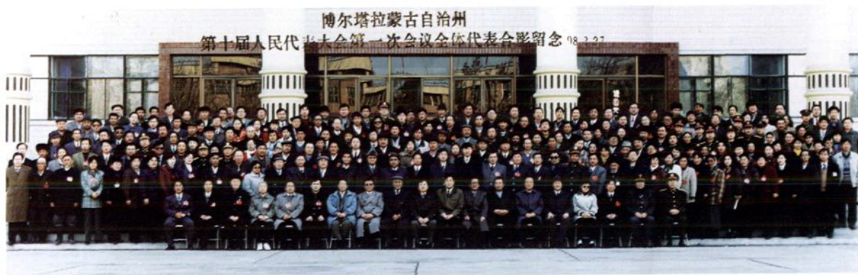
1998年2月 自治州第十届人民代表大会第一次会议代表合影