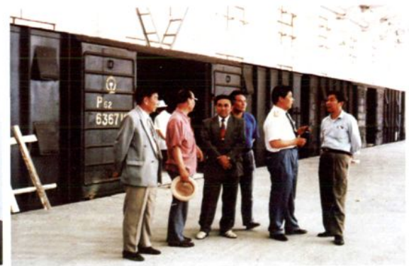
2001年8月 自治区人大常委会副主任胡吉汉·哈克莫夫在博州检察