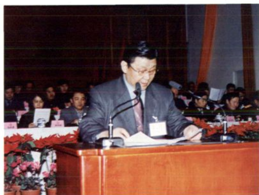
1999年3月 州人大常委会主任赛来在自治州十届人大二次会议上作常委会工作报告