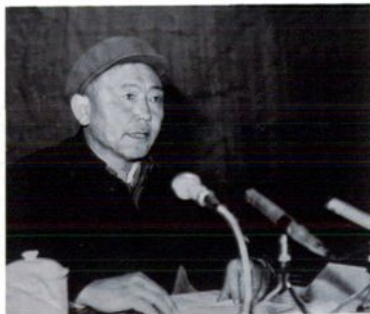
1988年5月 州人大常委会主任乔尔东在自治州八届人大一次会议上作常委会工作报告