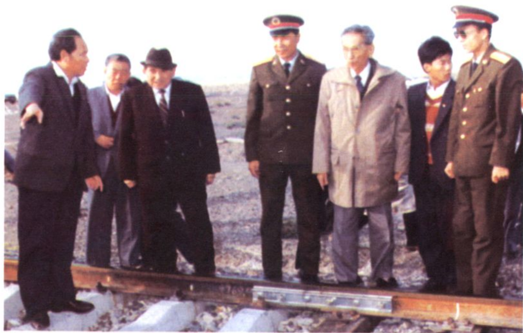
1992年全国人大常委会副委员长阿沛·阿旺晋美在博州视察