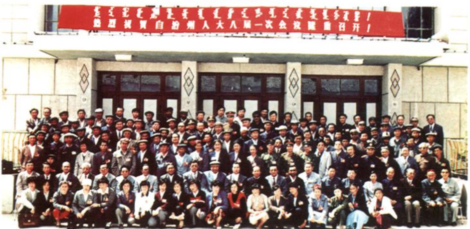
1988年5月 自治州第八届人民 代表大会第一 次会议代表合影