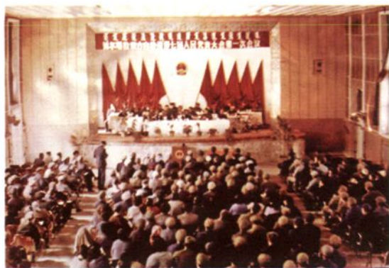
1983年4月 自治州七届人大一次会议在州政府俱乐部举行