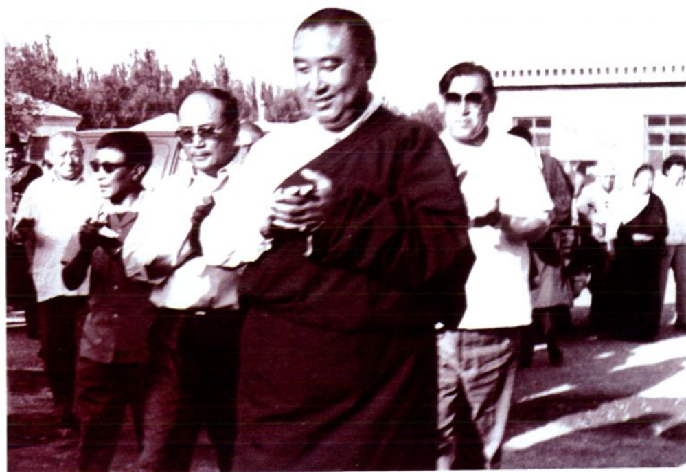
1984年全国人大常委会副委员长班禅额尔德尼·确吉坚赞在博州视察