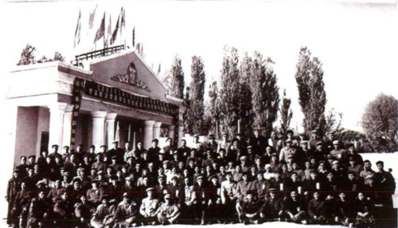
1963年10月自治州第 四届人民代表大会第一 次会议代表合影