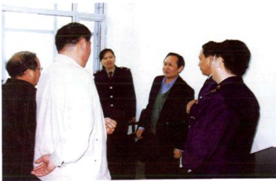
2006年4月 自治区人大常委会副主任达列力汗·马米汗在博州检察