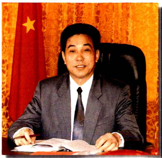
广西区党委常委 中共柳州市委书记

得以在经济文化诸方面斐然进步。柳州在历史长河中积累了一份珍贵的财富，故1994年获得国务院命名为国家历史文化名城，并非偶然，而是实至名归，这是对柳州人从古到今全部历史的一个精当概括。当然，它也是授予柳州市的一项崇高的荣誉，对于柳州市今后攀登新的历史高点更是莫大的鼓励。