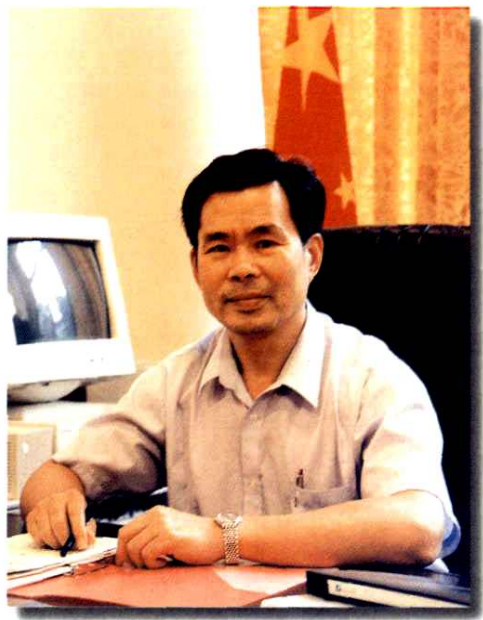
中共柳州市委书记

1985年，中共柳州市委、市政府专门成立了柳州市地方志编委会，署理修志这一“经国之大业，不朽之盛事”，修志工作全面展开。由此，各级党政机关、企事业单位以及无数热心此项千秋文化功业者，十数年如一日，为这一宏篇巨制的编纂与付梓出谋献策，添砖加瓦。在柳州历史上，牵动如此众多的部门和人员从事一项文化系统工程，绝无仅有！更为可贵的是，广大修志工作者坚持实事求是、尊重历史、立足当代的原则，进