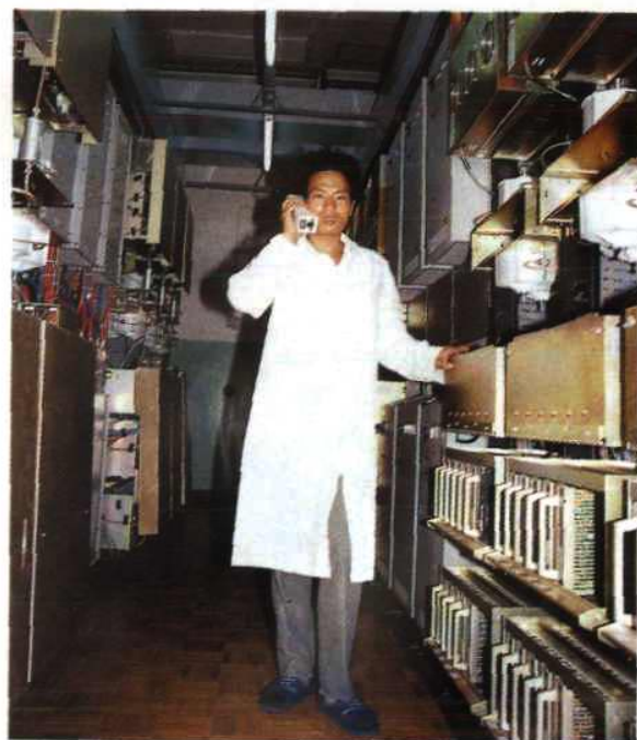
青阳 60 个信道移动 电话基站