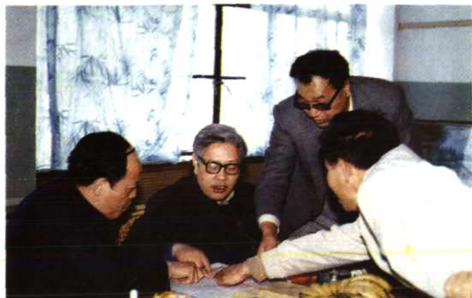
邮电部副部长 宋直元(左2)视察 晋江邮电局(1989 年2月27日)