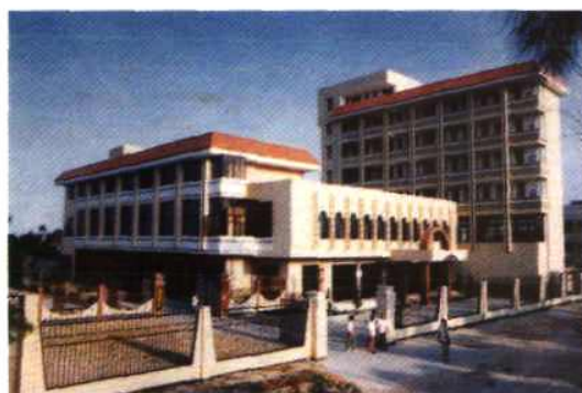
全国邮电先进集体—— 英林邮电支局