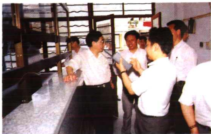
邮电部副部长朱高峰(左1)视察晋江邮电局(1991年5月 16日)