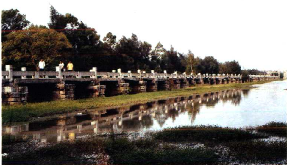
天下无桥长此桥——晋江安平桥