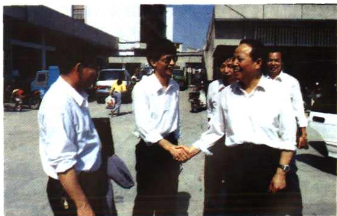
邮电部副部长 林金泉(前右1)视 察晋江邮电局 (1994年4月6 日)