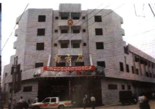
全省第一个村级程控电 话模块局——洋埭模块局