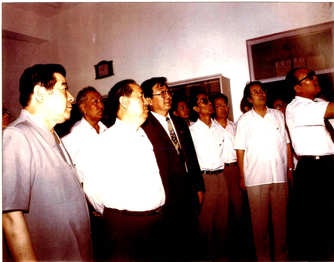
1996年6月24日，姜春云副总理视察金河集团，听取金河工程汇报。