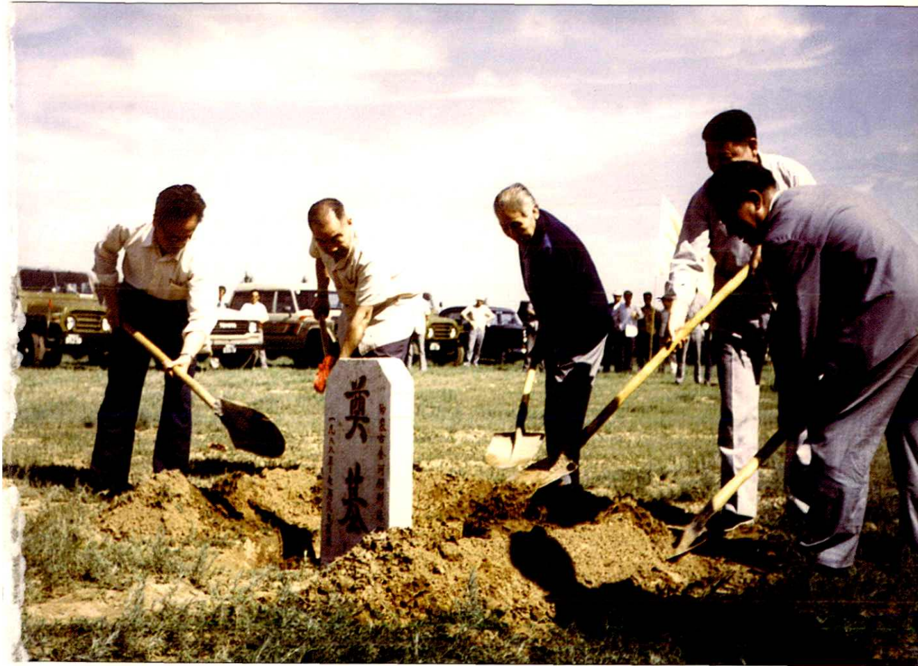
1988年7月9日，内蒙古自治区主席布赫为“内蒙古金河饲料添加剂厂”奠基培土。