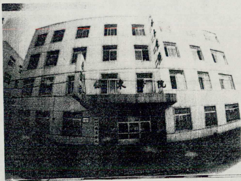
龙潭区铁东医院办公楼照片