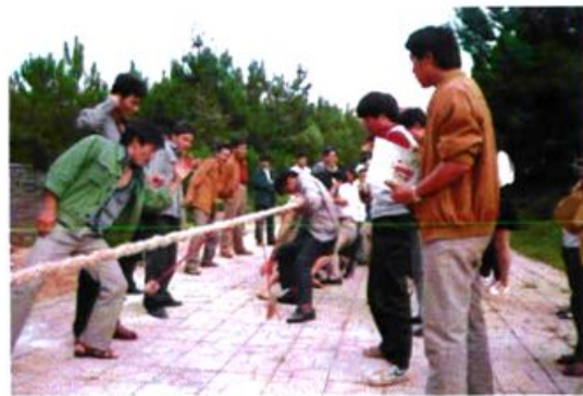
农业系统文体活动