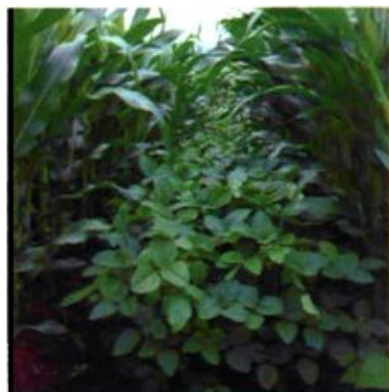
玉米间作大豆种植