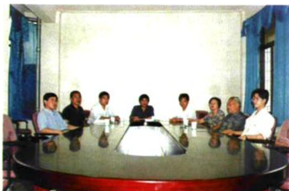
《农业志》编纂领导小组成员及编写人员