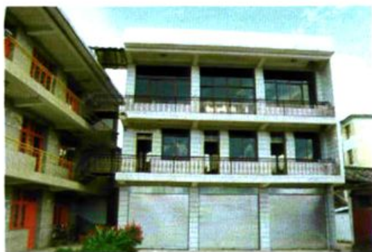
县农业局办公楼一角