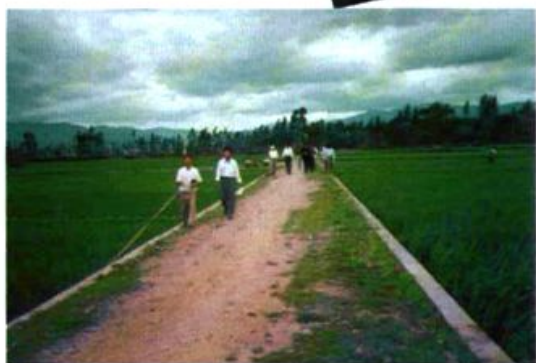
滇中现代化农业示范工程