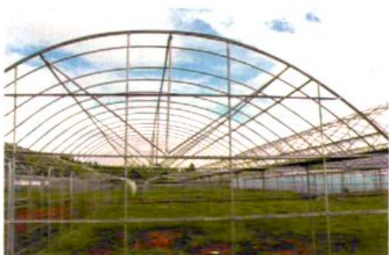
高效农业示范基地