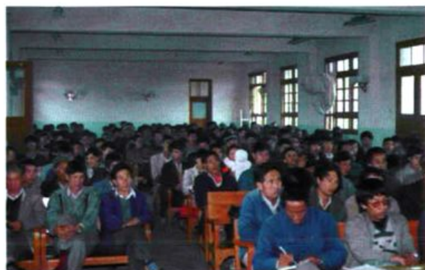
培训乡、村农科人员