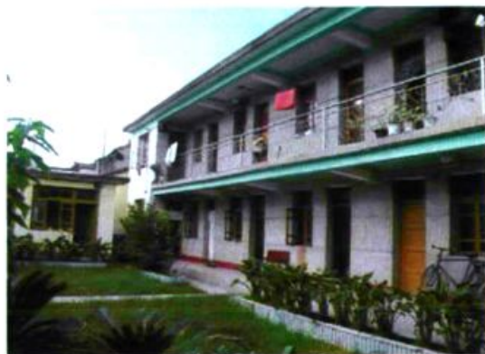
巍宝乡农技站基础建设