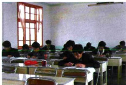
县农广校教学一角