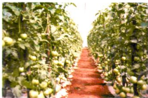
大棚蔬菜西红柿种植