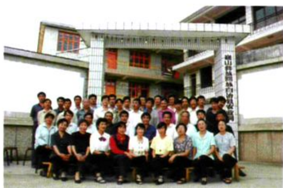
县、乡农科部门领导及部分农科人员