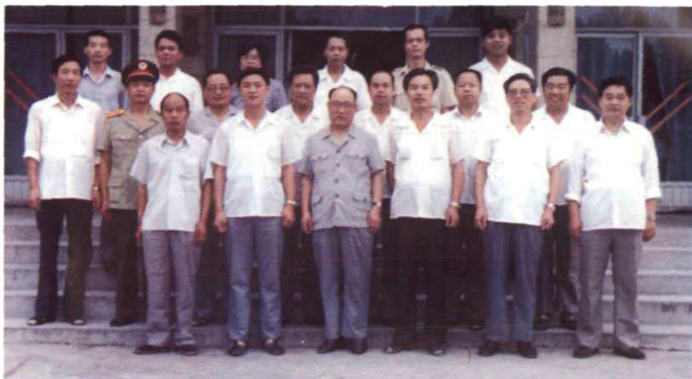
1990年8月18日，河南省委书记侯宗宾到邓州市视察工作时留影。前排左二为市委书记解朝来、左三为侯宗宾、左四为市长李辉、左五为地委书记李金明。