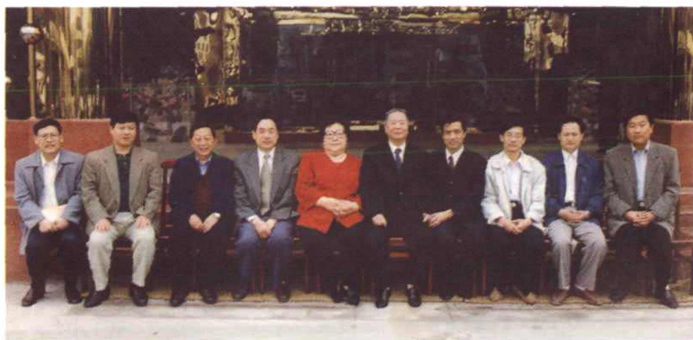
1998年4月29日，原中共中央政治局委员，解放邓县时任桐柏军区第三军分区司令员的张廷发到邓州市视察工作时留影。左四为南阳市委秘书长李天成、左六为张廷发、左七为市委书记李天岑。