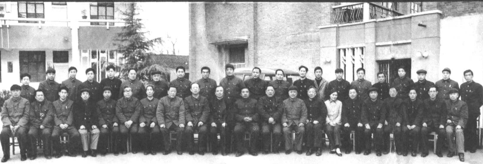
1986年3月6日，河南省省長何竹康到鄧縣視察工作時與南陽地委、行署、縣委、縣政府部分領導同志合影。前排左起第八人為縣長李仲庭、左九為地委書記宋國臣、左十為省長何竹康、左十一為行署專員張洪華、左十二為縣委書記殷文欣。