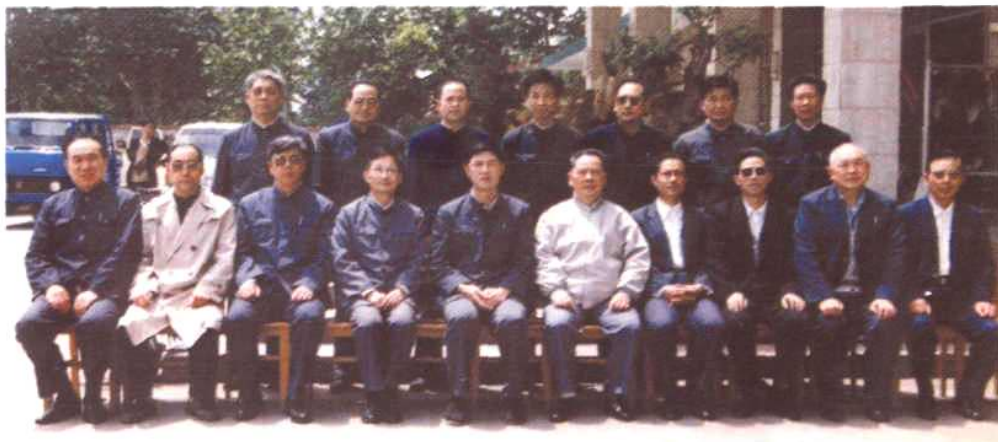
1989年5月，河南省委书记杨析综到邓州市视察工作时留影。前排右五为市委书记解朝来，左六为杨析综，左七为市长韩义君，左八为地委书记李金明。