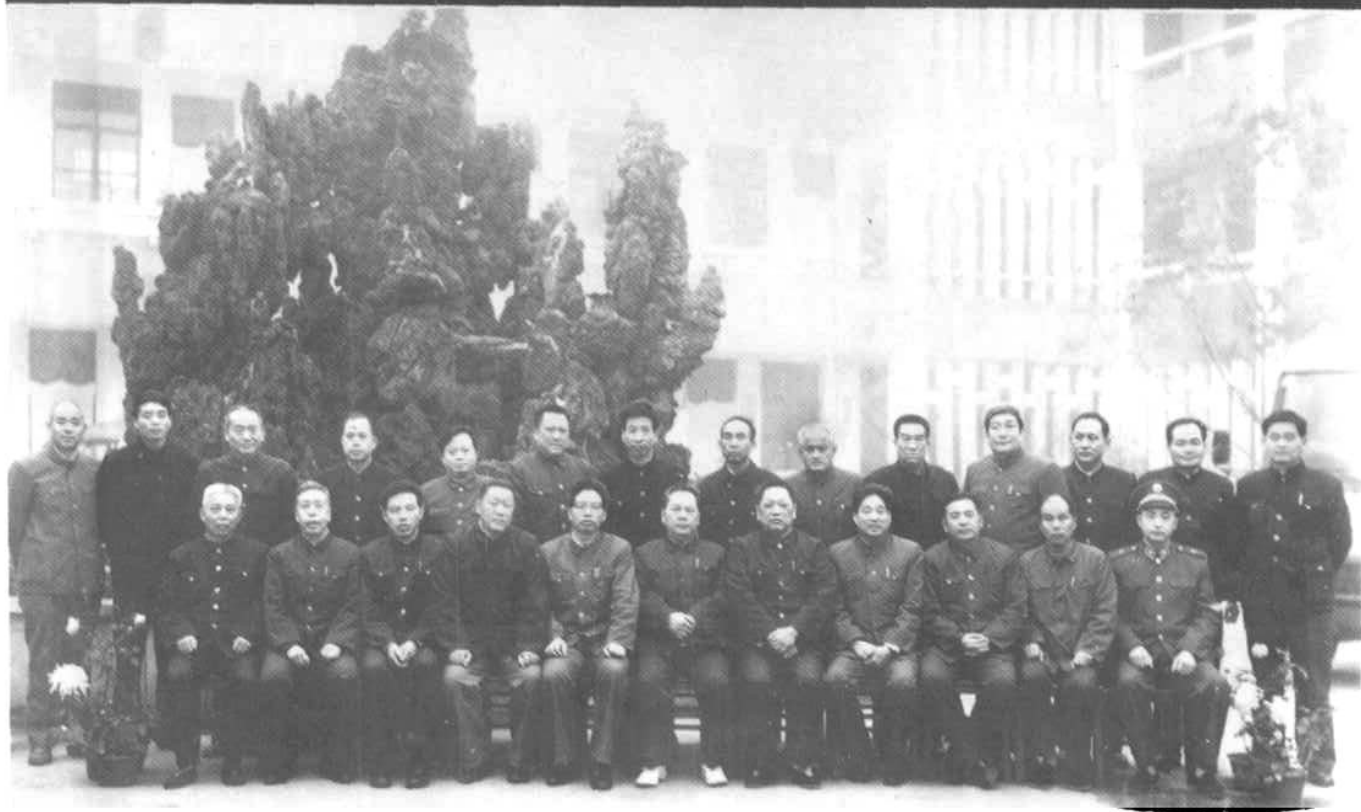
1986年11月13日，河南省委书记杨析综在邓县视察工作时留影。前排左四为县长李仲庭，左五为地委书记李金明、左六为杨析综、左七为县委书记殷文欣、左九为行署专员张洪华