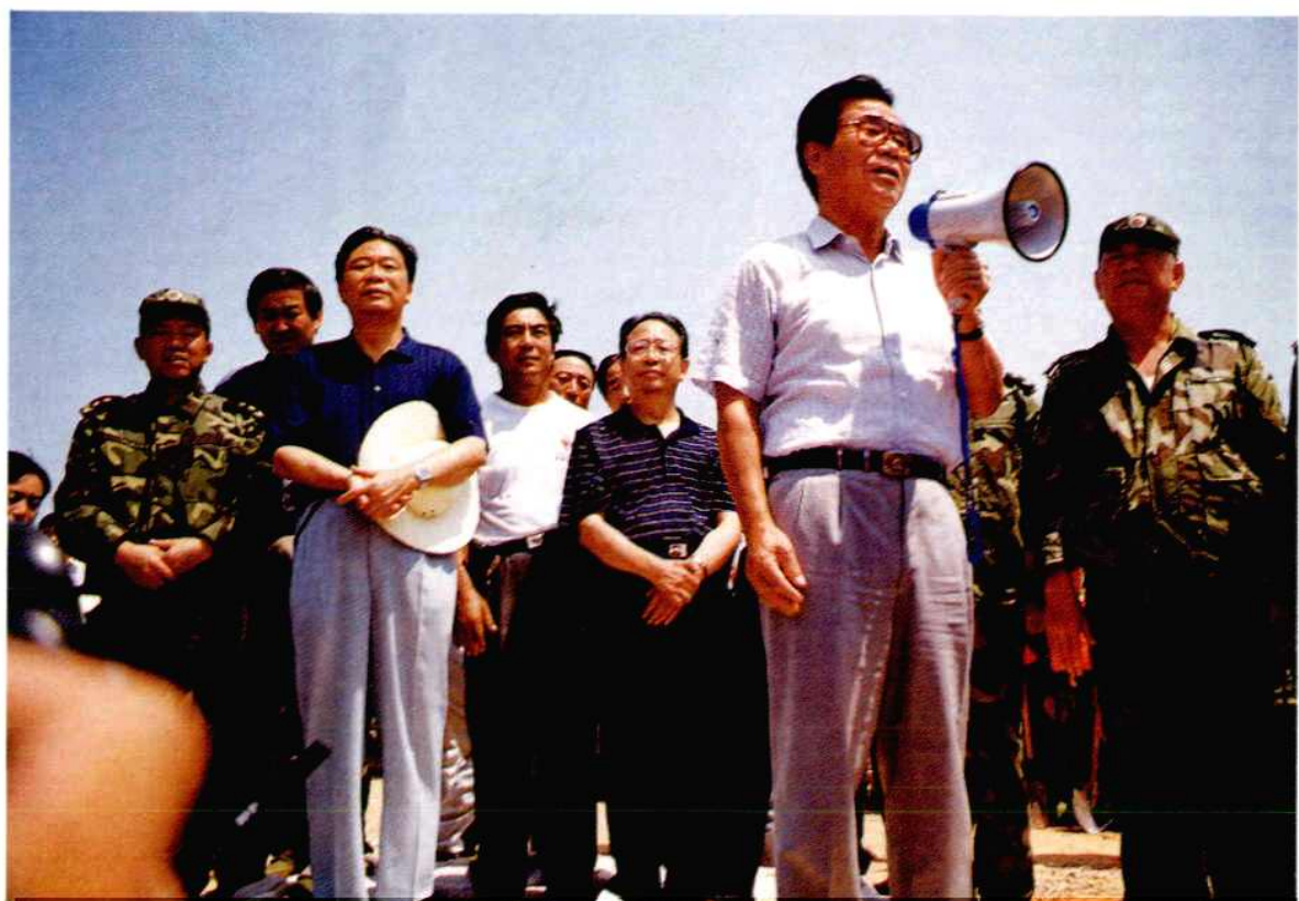
8月23日，全国政协主席李瑞环在省委书记王茂林（左三）、省长杨正午（右三）陪同下，视察岳阳市抗洪抢险工作。