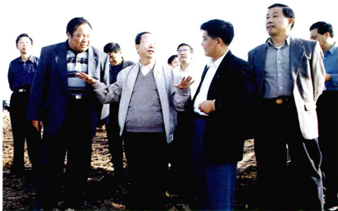
1998年11月，省委书记杨正午在君山区察看长江大堤冬修工程。