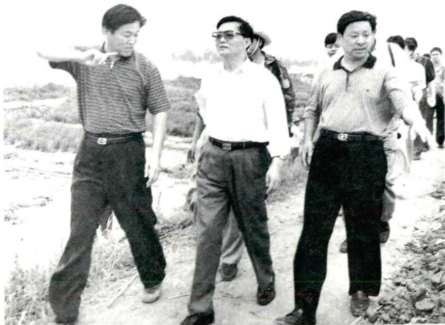
8月26日，国家防总副总指挥、水利部部长钮茂生在省、市领导储波、张昌平陪同下察看华容县团洲垸防汛情况。