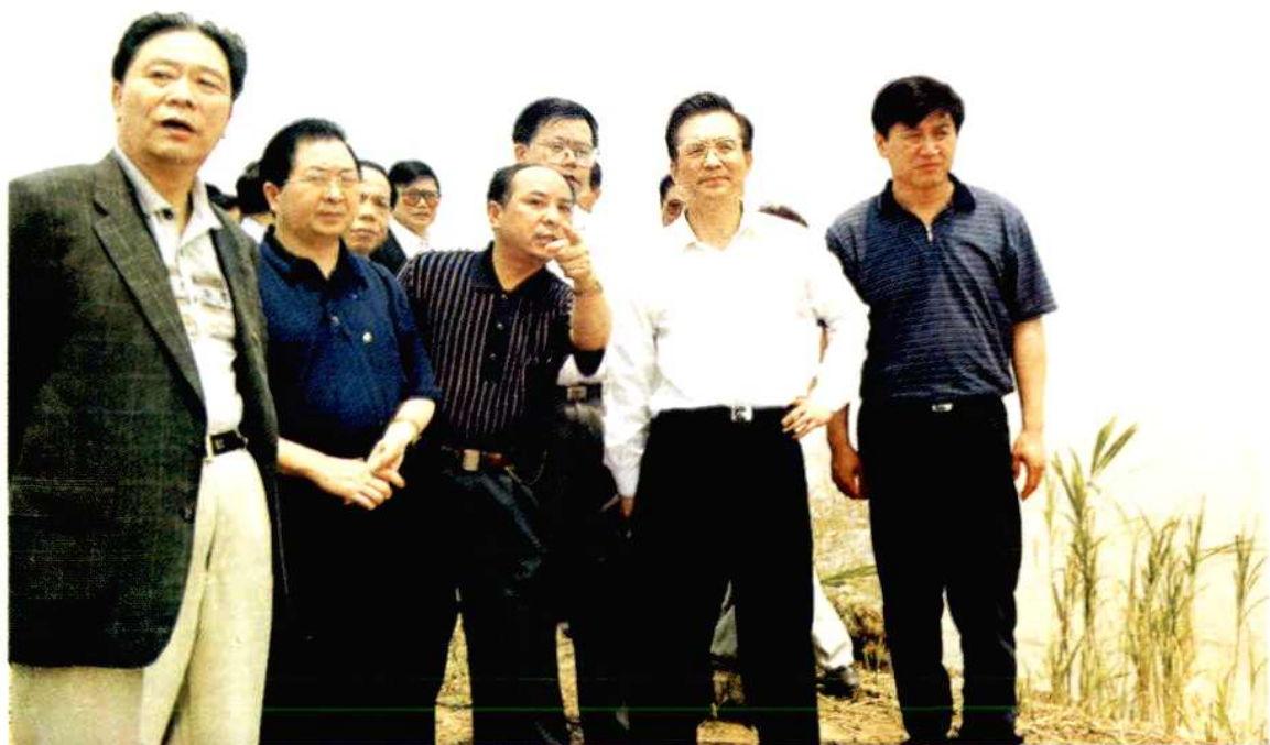
5月30日，国务院副总理、国家防总总指挥温家宝（右二）在省、市领导王茂林、胡彪、庞道沐、张昌平、黄甲喜陪同下视察长江七弓岭崩岸险情。