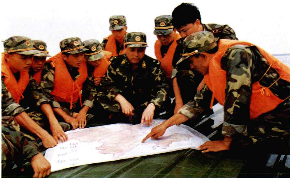
省武警总队政委徐国武少将与市武警支队官兵商讨汛情。