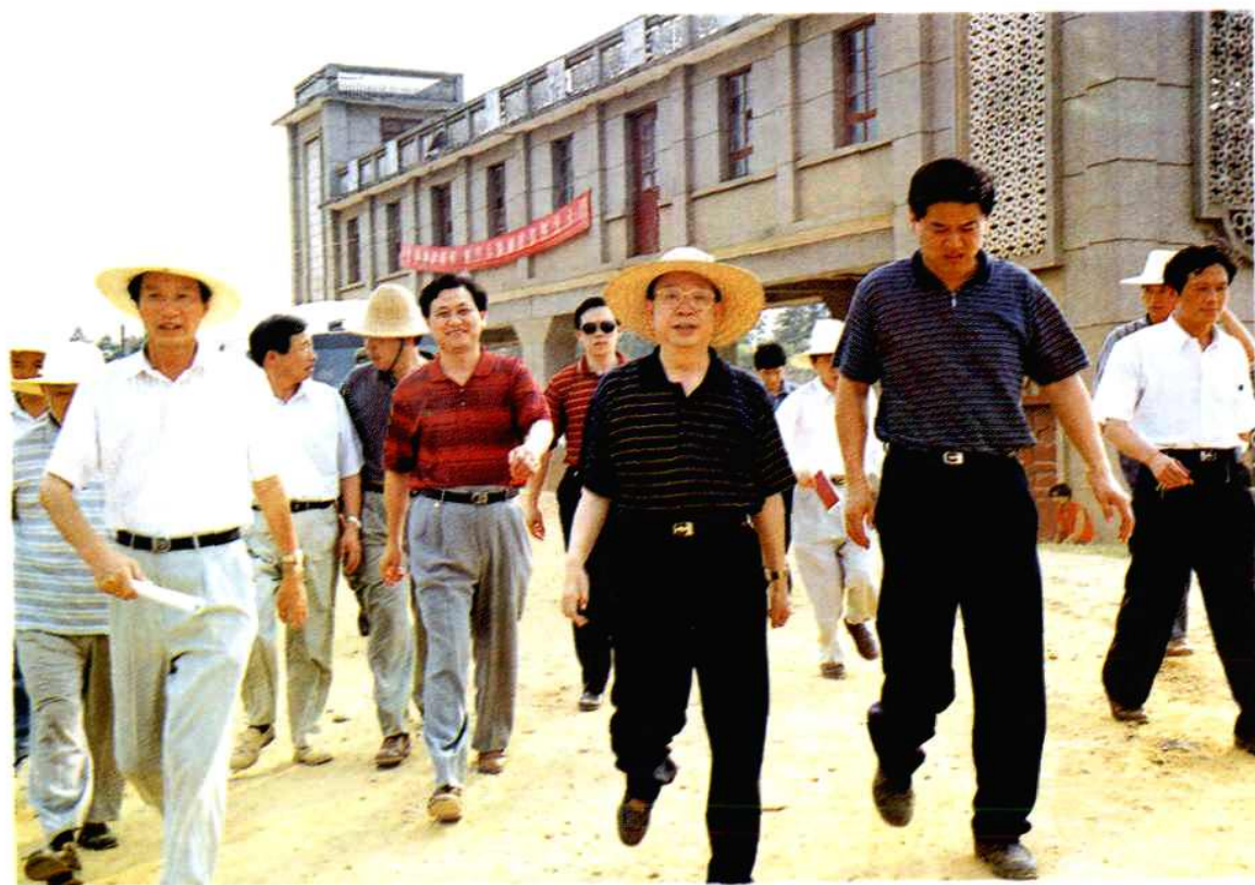
省长杨正午在临湘市察看防汛工作。