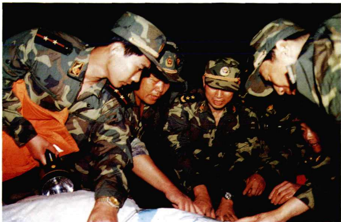
武警总部政委徐永清中将、省武警总队总队长张显伯大校率武警岳阳市支队在中洲大堤排险。