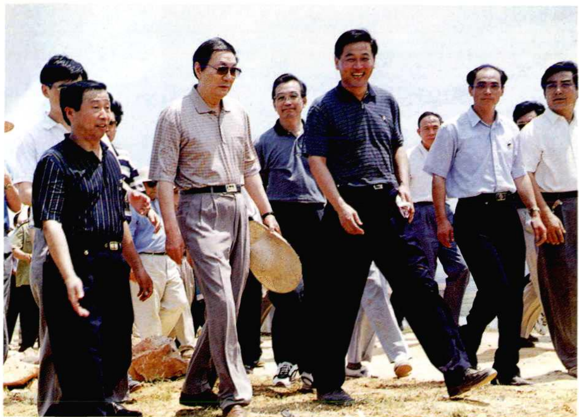
7月8日，国务院总理朱镕基、副总理温家宝在市委书记张昌平（右三）、市长周昌贡（左一）陪同下，亲临岳阳市一线大堤视察防汛工作。