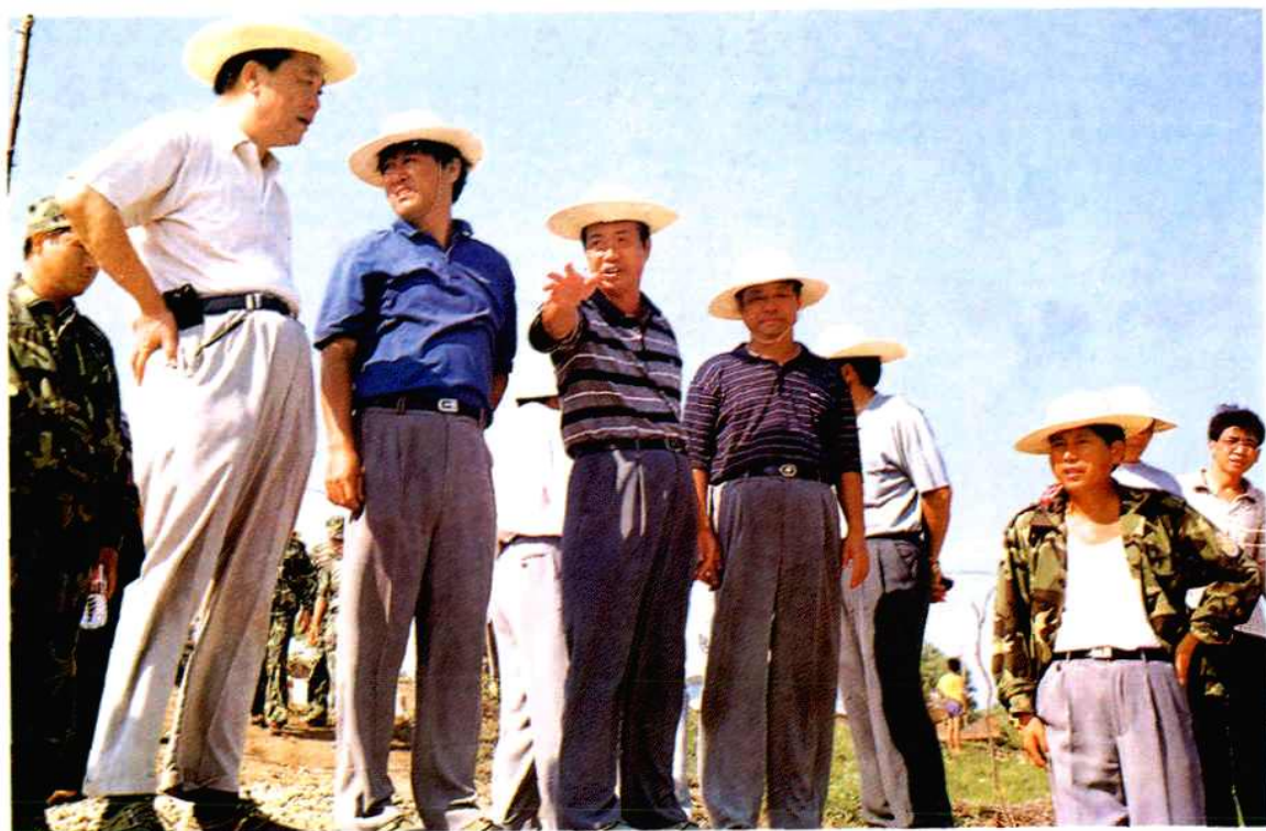
省委书记王茂林、副书记储波在华容县团洲垸现场察看险情。