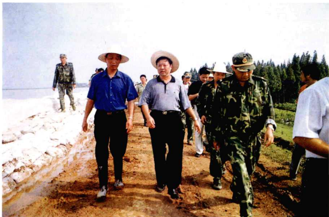
省委副书记储波在华容县洪山头镇长江堤上察看子堤。