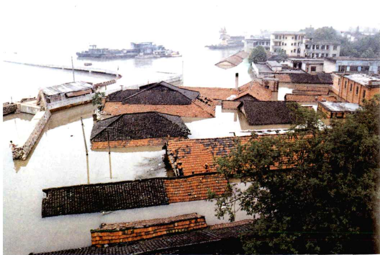
洪水中的城陵矶沿湖居民区。