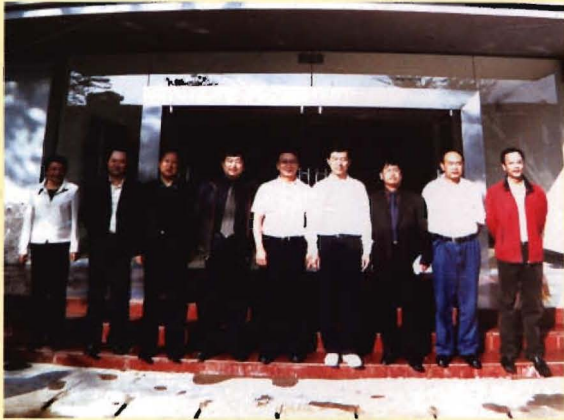
国家卫生部副部长王陇德、云南省副省长高峰、云南省卫生厅副厅长段鸿到丽江市疾病预防控制中心检查指导工作