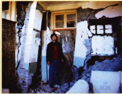
“2.3”地震卫生防疫人员的家园被毁