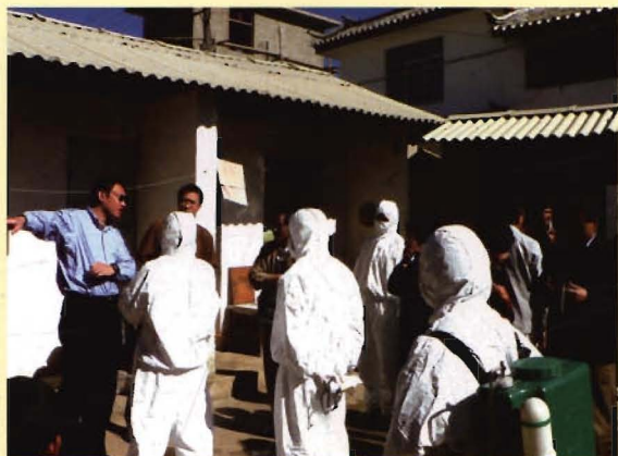
云南省疾控中心主任陆林现场指导消毒消杀工作