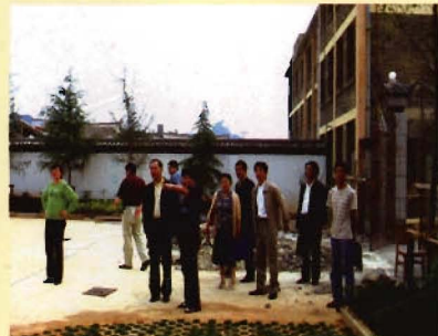
市卫生局领导到国债建设项目工地检查指导