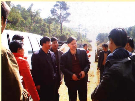
国家、省级专家到鼠疫疫源地调研