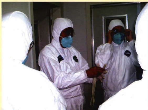
国家传控所领导指导鼠疫强毒室开展工作