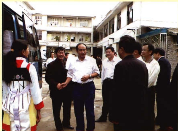
云南省卫生厅副厅长段鸿到中心检查指导工作