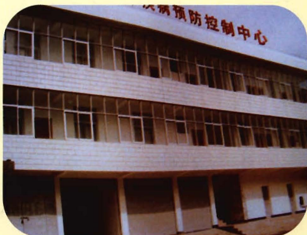
九十年代中心艾滋病实验楼