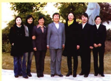
慢性病防治科成员