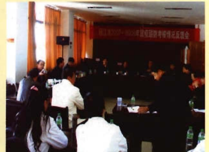
丽江市鼠疫联防联控工作反馈会