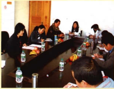
省级专家检查工作