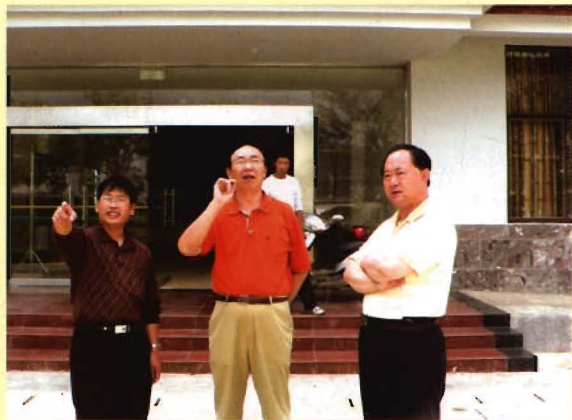
云南省卫生厅厅长陈觉民到中心检查指导工作