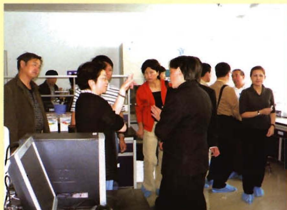
国家CDC党组书记沈洁到中心艾滋病实验室指导工作