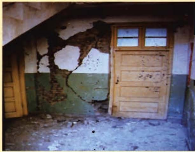
“2.3”地震毁坏的工作场所