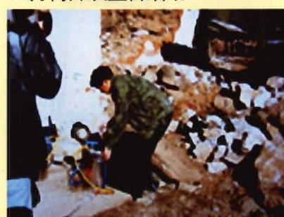
“2.3”地震后卫生防疫工作人员开展消毒工作