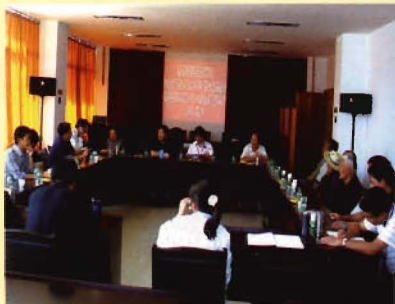
市卫生局老领导到市疾控中心指导工作