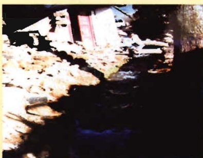
“2.3”地震后卫生防疫工作人员对水源进行消毒