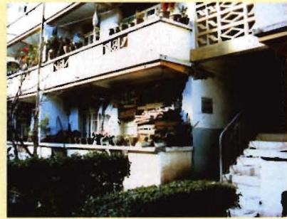
“2.3”地震被毁的职工宿舍