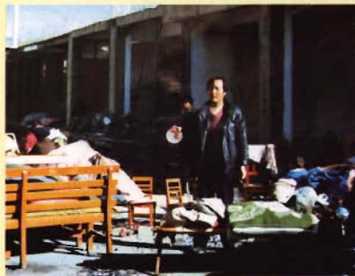
“2.3”地震后的艰难岁月（1）