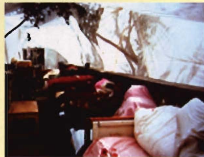
“2.3”地震后的艰难岁月（2）