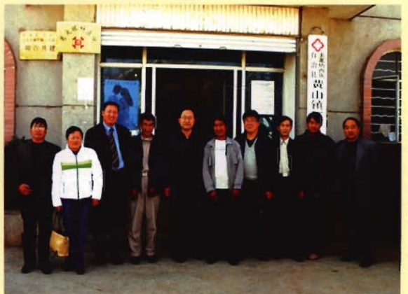
国家应急办主任陈贤义、云南省疾病预防控制中心主任陆林至基层卫生院检查工作