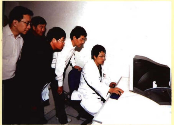
国家卫生部副部长王陇德、云南省副省长高峰、检查指导传染病疫情网络直报信息系统