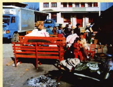
“2.3”地震后的艰难岁月（5）