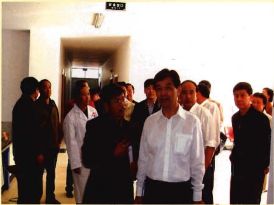
国家卫生部副部长王陇德到中心督查国债建设项目