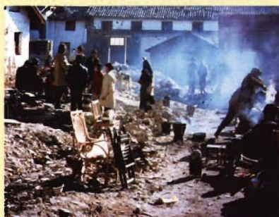
“2.3”地震后的艰难岁月（4）