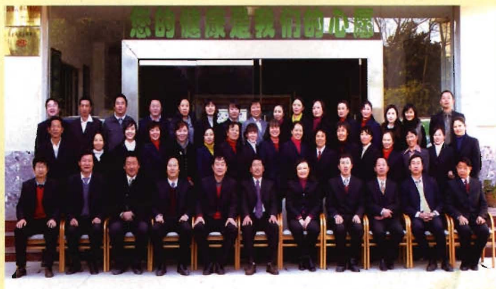
全体干部职工合影