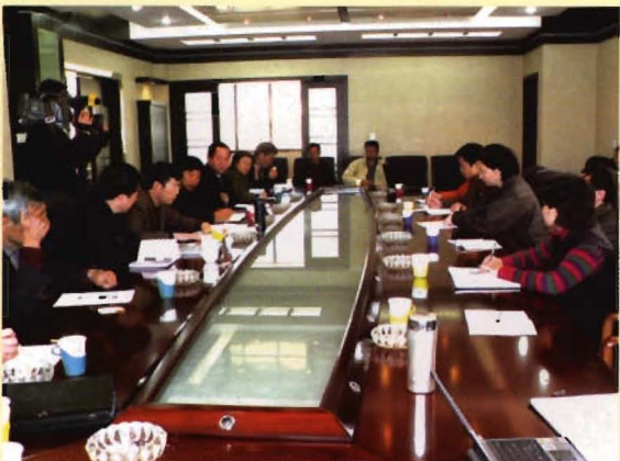
国家应急办反馈工作情况