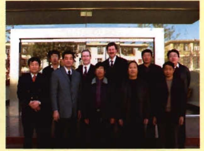
美国CDC项目官员及专家到中心指导工作