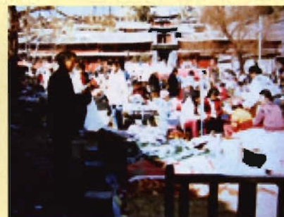
“2.3”地震防疫人员到古城四方街开展宣传活动