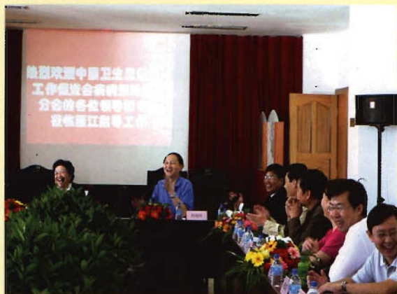
云南省疾控中心书记阎明明在中心检查指导工作