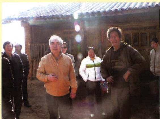
国家鼠疫首席专家俞东征在南溪指导工作