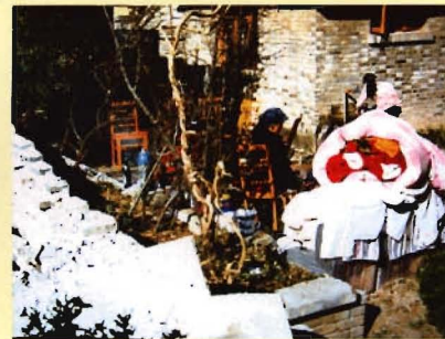
“2.3”地震后的艰难岁月（3）