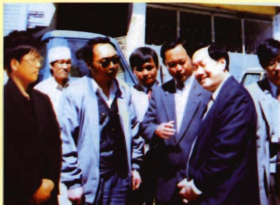
时任卫生部副部长孙隆椿到卫生防疫站指导工作