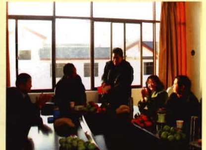
丽江市直工会慰问中心困难职工