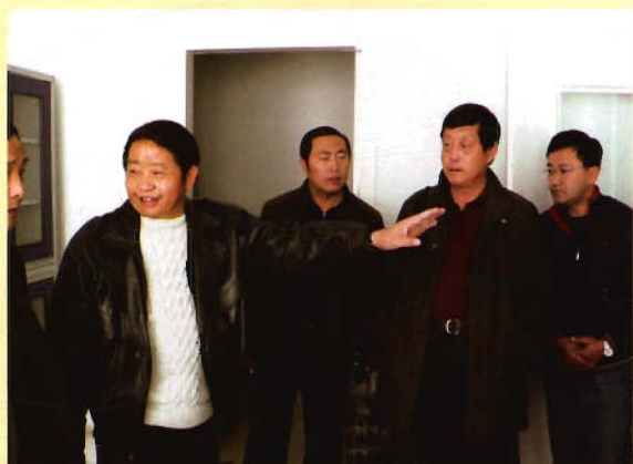
国家鼠布基地专家到中心鼠疫实验室检查指导