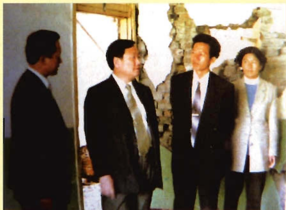
卫生部副部长孙隆椿、丽江行署解毅副专员、毛志良局长、张云萍副县长查看职工宿舍楼受损情况