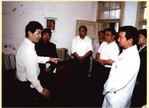
国家卫生部副部长王陇德检查指导免疫规划工作