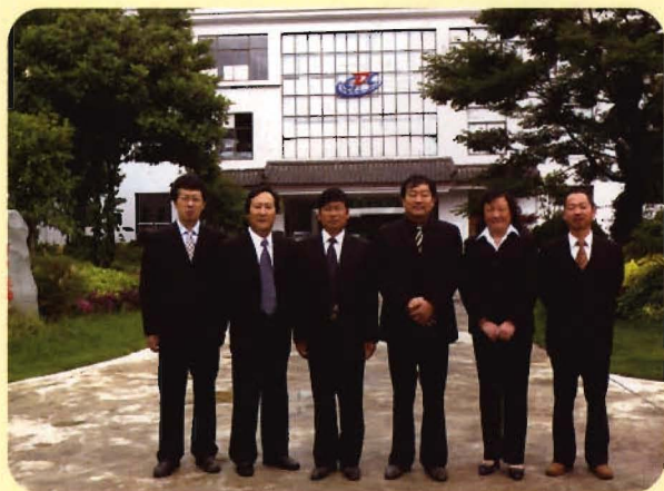
主任办公会议成员