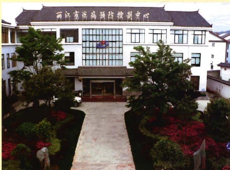
新世纪市疾控中心检验大楼