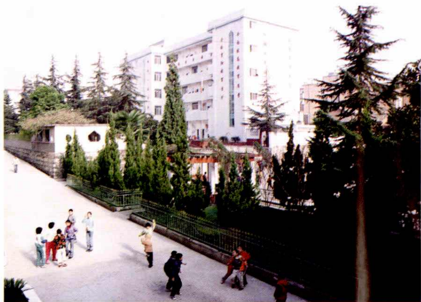
具有90余年历史的联盟中心学校（马村小学）