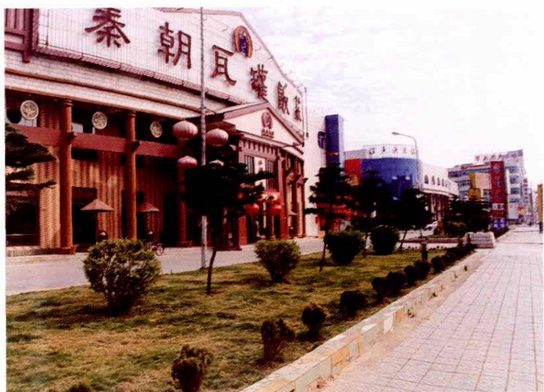
北大门美食城一角