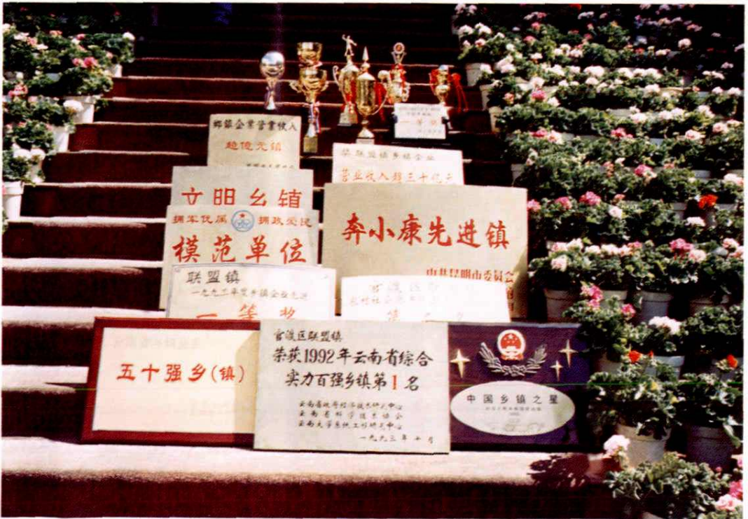
联盟镇在各个历史时期荣获的市级以上奖杯奖状（部分）