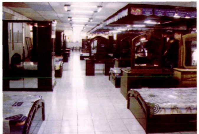
康发家具商城一角（1993）