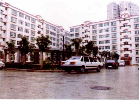
小坝麻线营村统建房