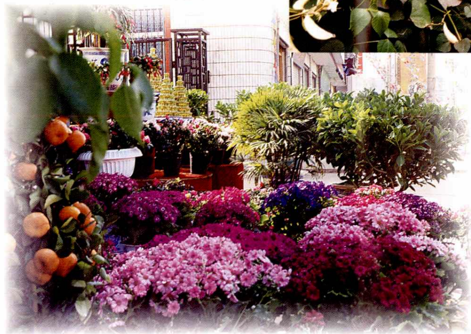
昔日的稻田、菜地景色已被庭园绿化所取代（上二图在1994年时的今联盟大酒店附近摄）