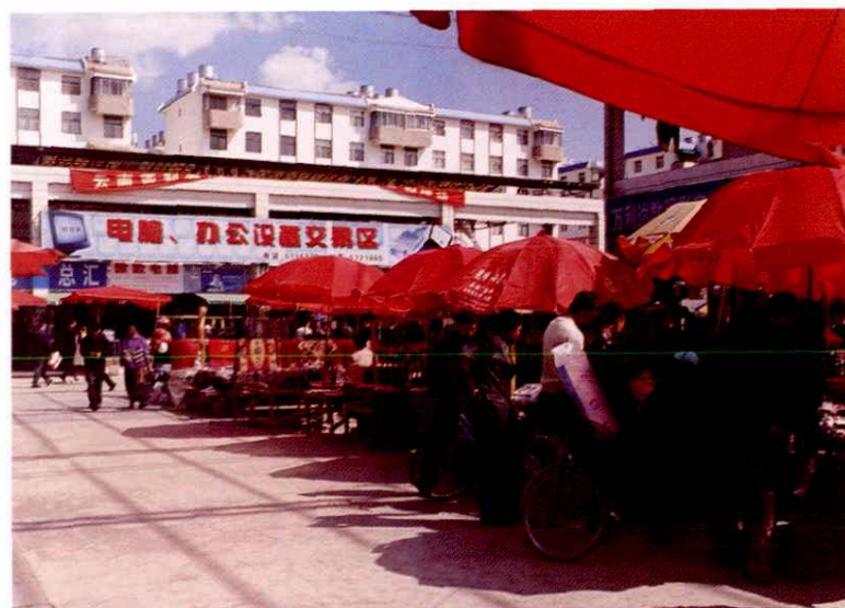
昆明旧货市场张官营市场是云南省内规模较大的调剂市场，图为通信器材及电脑办公设备交易区