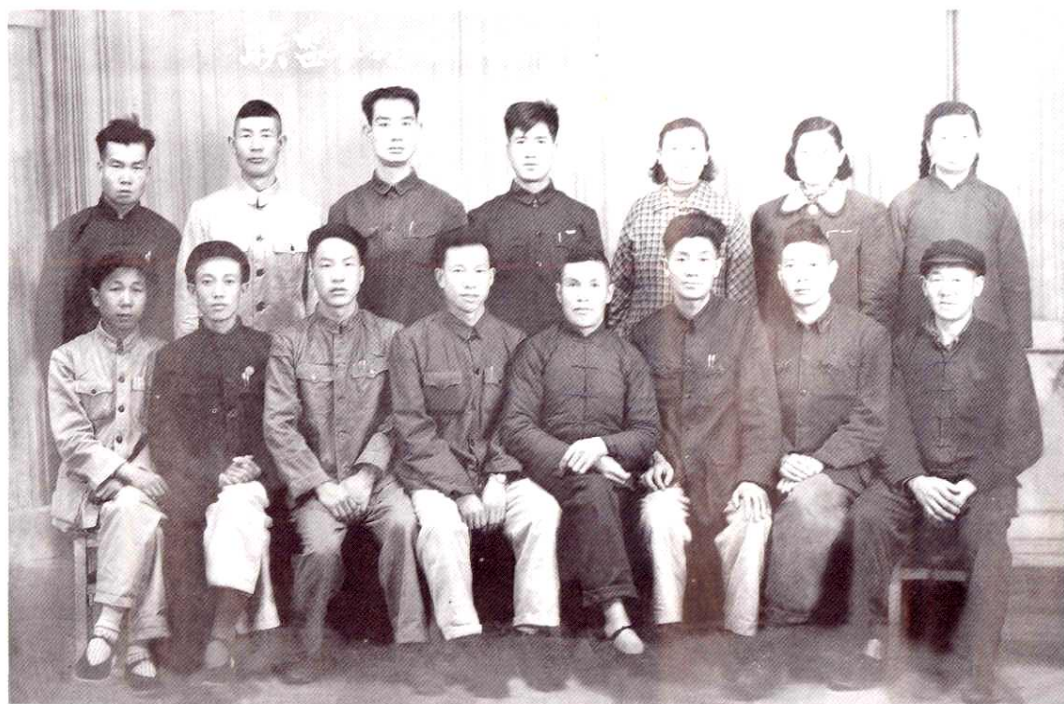
联盟农场全体干部合影 (1961.4.1)