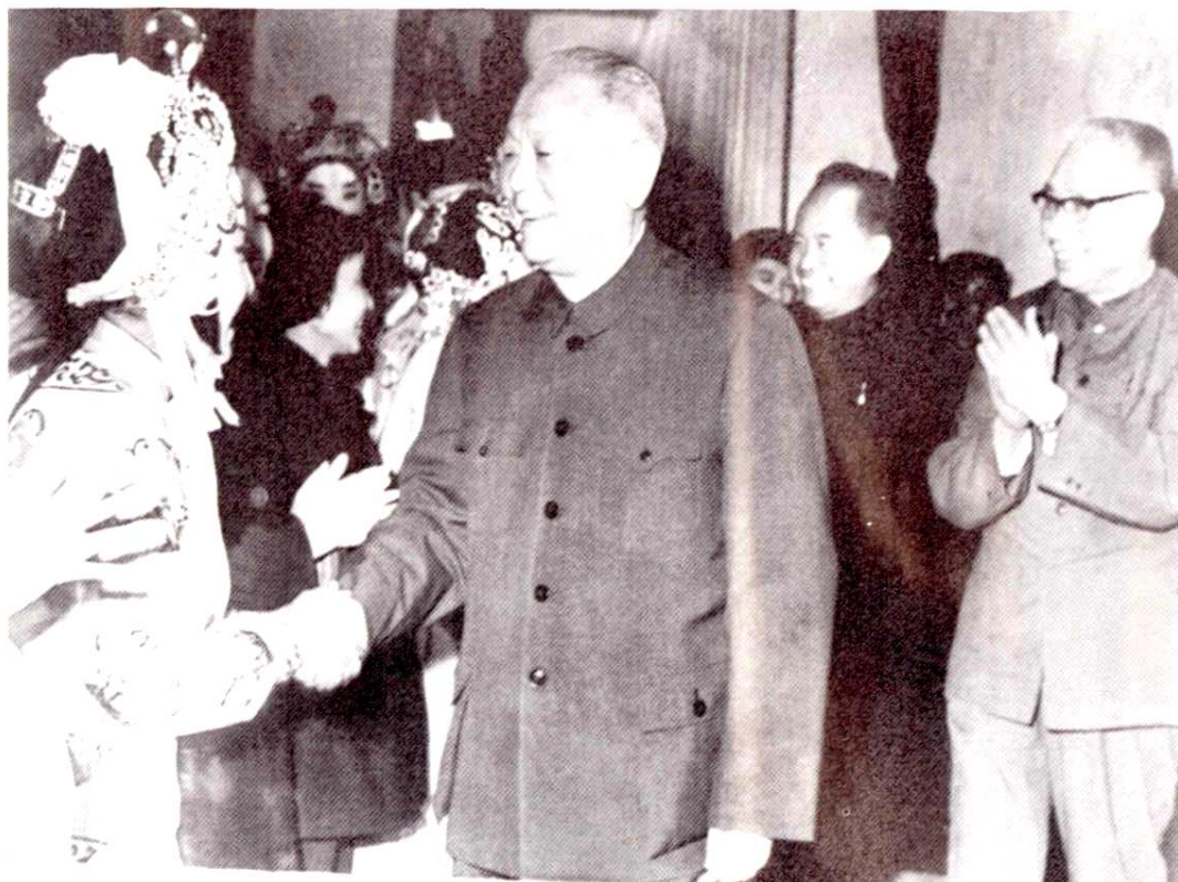
国家主席李先念会见联盟镇籍滇剧表演艺术家王玉珍