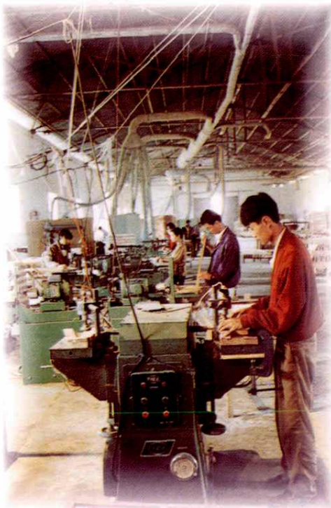
◁图为20世纪90年代初期的联盟镇乡镇企业富康木业制造有限公司生产车间