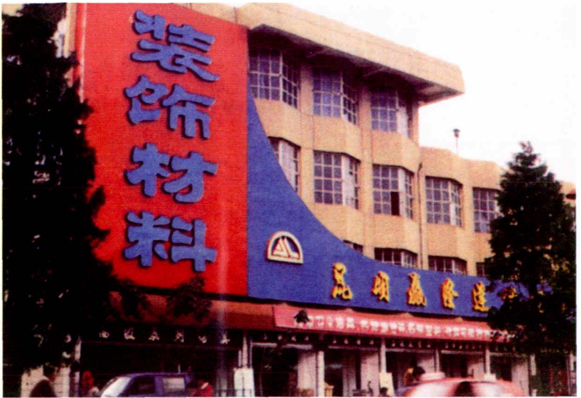
建材、装饰业是联盟镇20世纪90年代乡镇企业的支柱产业之一