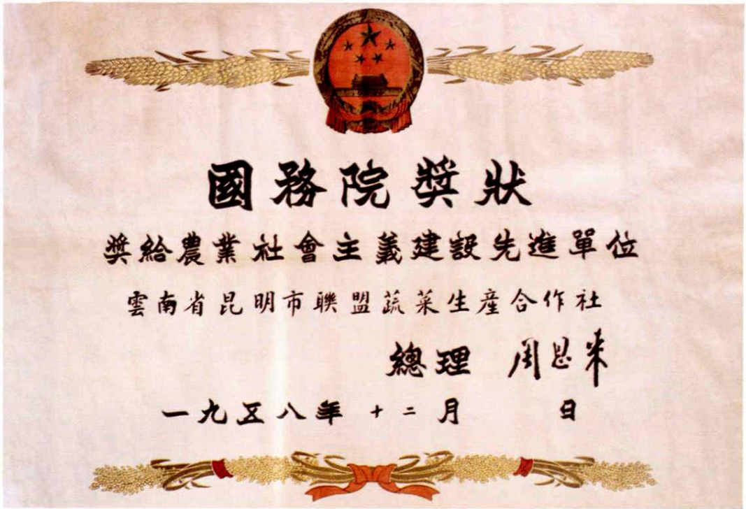
联盟蔬菜生产合作社获国务院总理周恩来签发的奖状（1958.12）