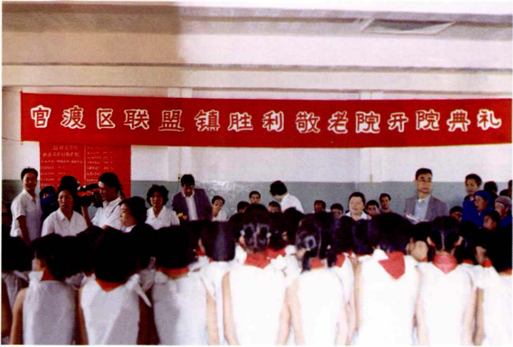
联盟镇胜利敬老院开业典礼（1990）