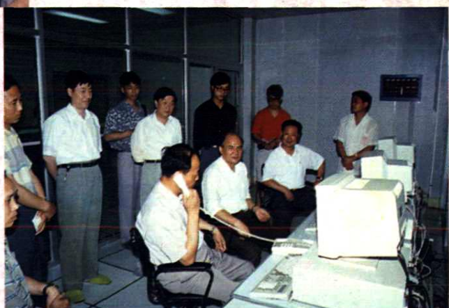
邮电部副部长林金泉在程控机房视察