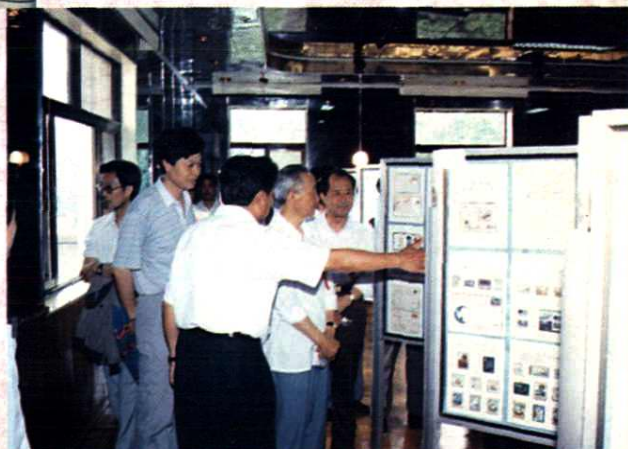
1993年邮电部原副部长李临川参观“井冈之夏”邮展。