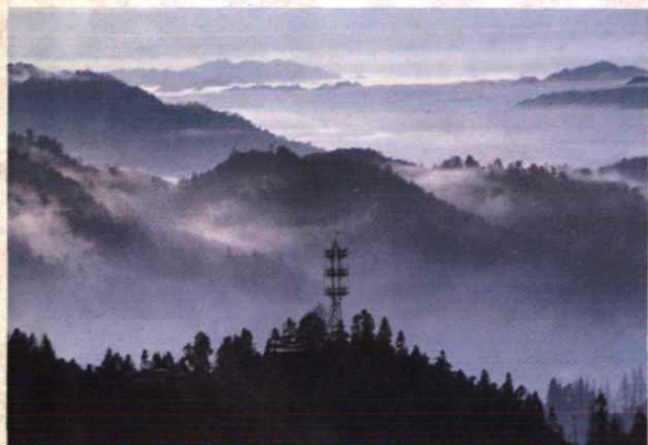
井冈山移动电话发射塔