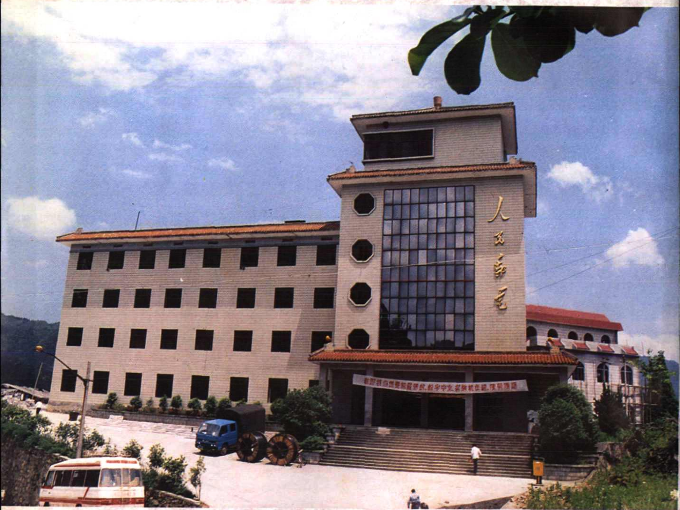
井冈山市邮电生产大楼