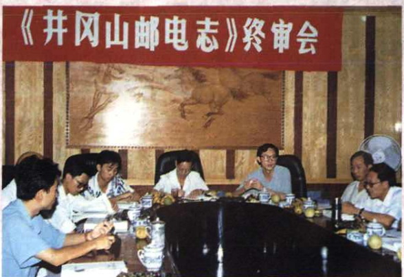
《井冈山邮电志》终审会议