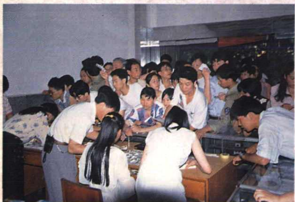
1997年7月1日香港回归之际, 邮票门市部门庭若市。