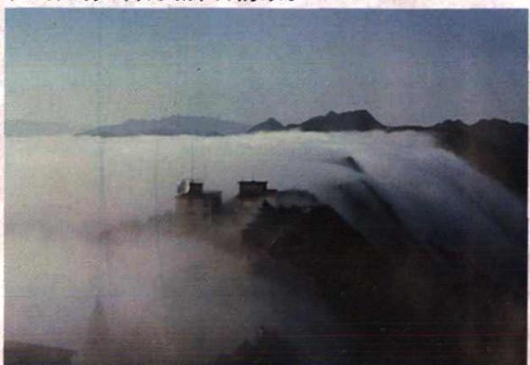
井冈山黄洋界微波站