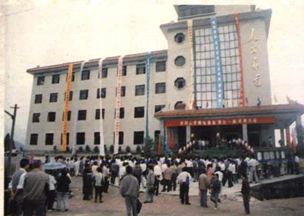
井冈山市邮电通信“两化一网”庆典大会