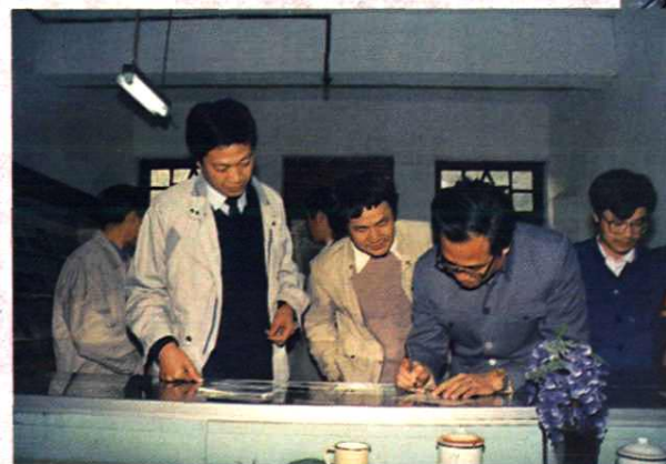
邮电部副部长杨贤足视察井冈山邮电局