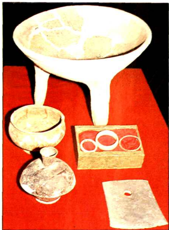
华容县三封乡毛家组车轱山遗存。