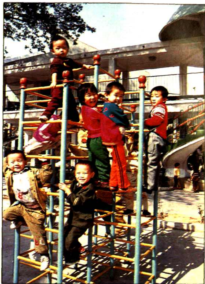
活泼可爱的市直 机关幼儿园小朋友。