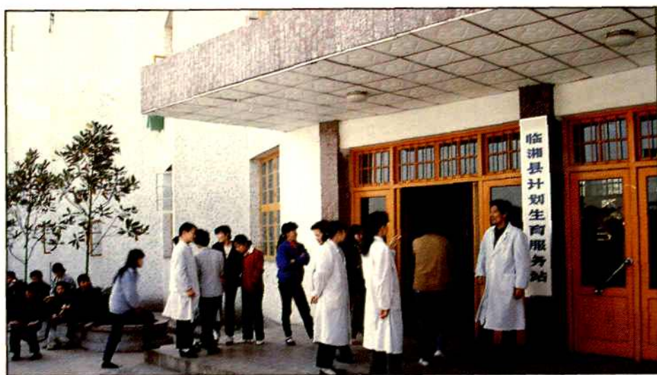
临湘县计划生育服务站。