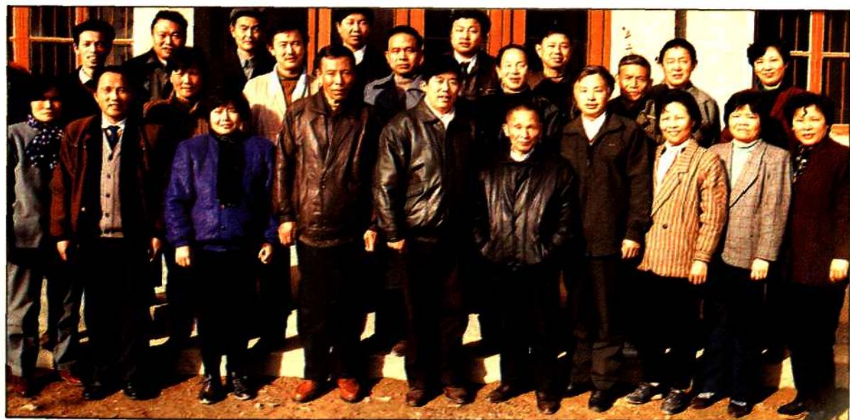
1992年12月24日, 参加《岳阳市人口志》评审工作的编委和市地方志办公室领导合影。