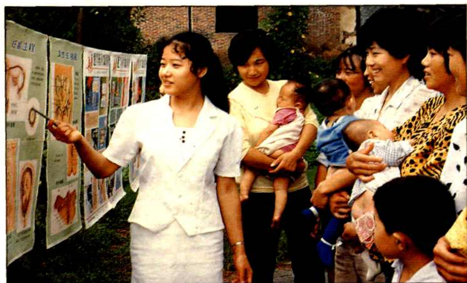
向育龄妇女讲解避孕知识。