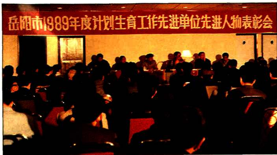
1990年1月，市委、市政府召开计划生育先进表彰会。