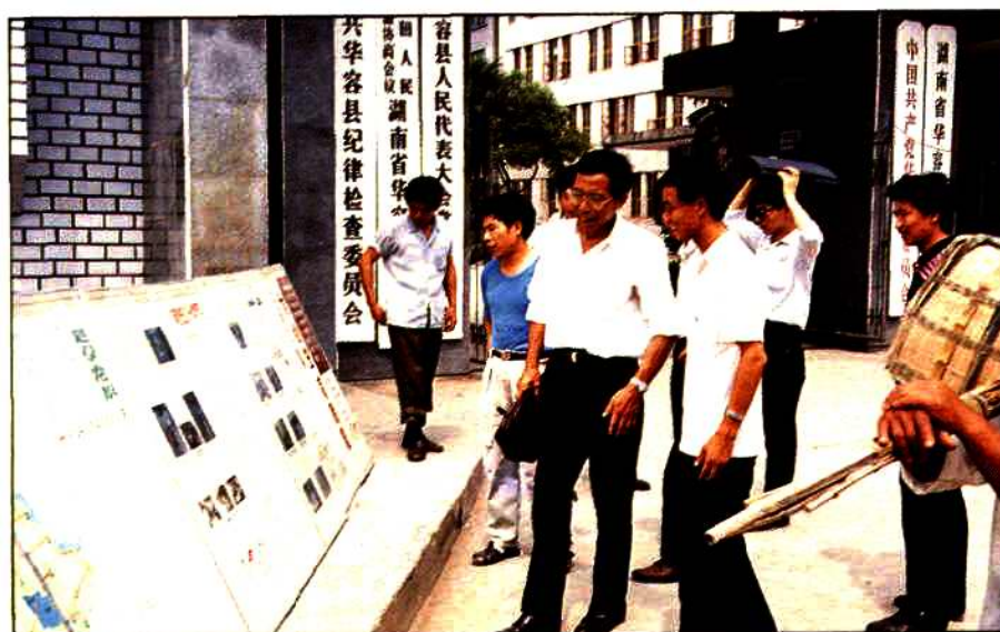
在街头开展计划生育宣传。