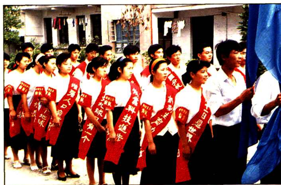
计划生育宣传队伍。