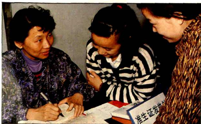
贯彻《湖南省计划生育条例》，计划生育工作人员向育龄妇女发放“准生证”。