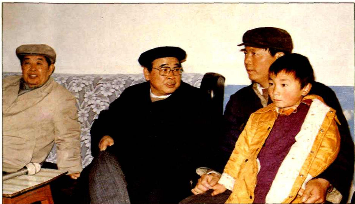
1987年3月9日，国务院总理李鹏由省委书记熊清泉陪同，在岳阳市郊区考察时，和独生子女户白年生亲切交谈。