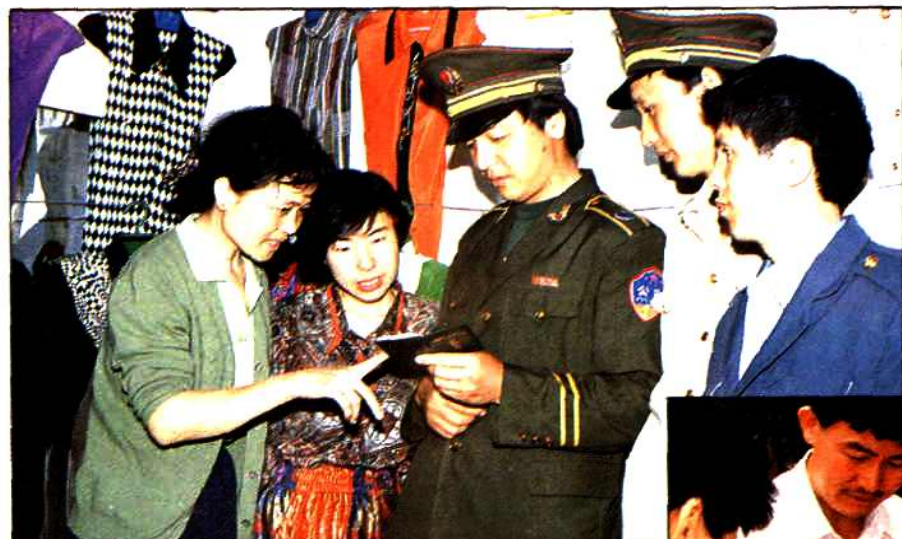
南区公安、工商部门查验“流动人口计划生育证”。