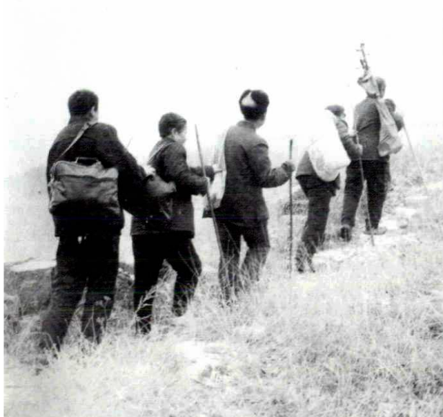
▼ 盲人曲艺宣传队深入山区演出