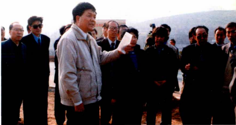
▶ 分管民政工作的 山西省副省长范堆 相(左三)在陵川指 导工作