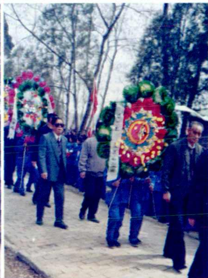
◀ 县委、县人大、县政府领导向烈士纪念塔敬献花圈