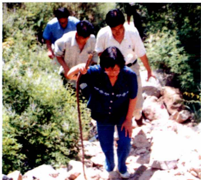
◀ 曾任县委书记现任晋城市副市长赵学梅（前）爬山涉水深入基层调查研究