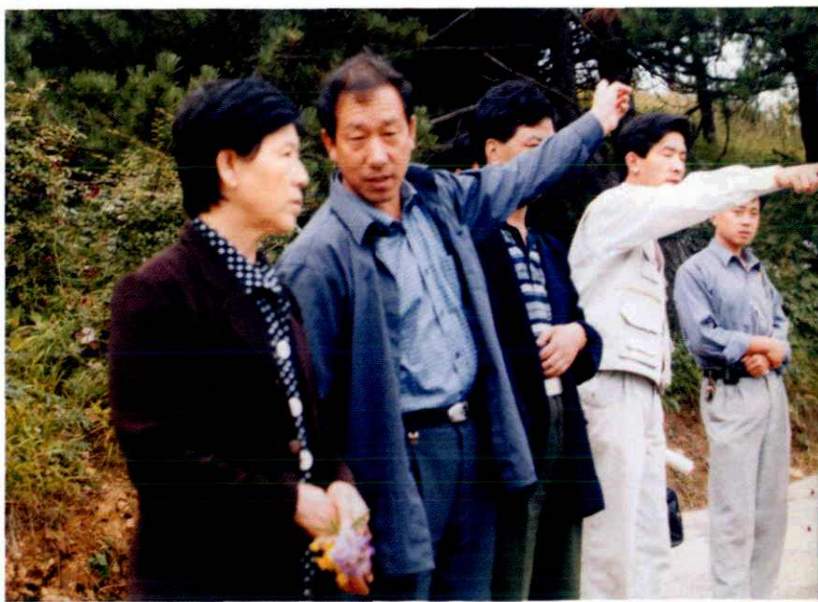
▶ 山西省民政厅副 厅长赵生平(左一) 在陵川指导勘界工 作