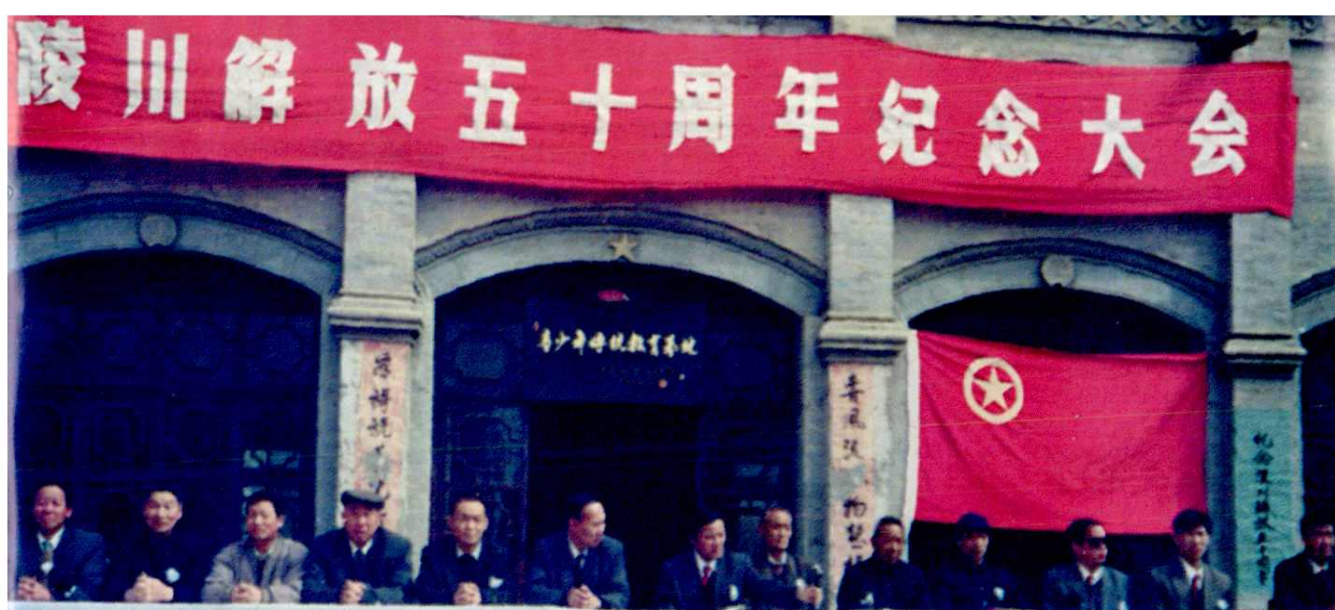
▲ 1995年4月10日县委、县政府隆重召开陵川解放50周年纪念大会，县委、县人大、县政府、县政协领导参加了各项悼念活动。