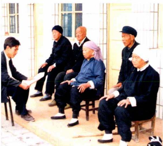
▲ 礼义中心敬老院工作人员与老人一起学习时事