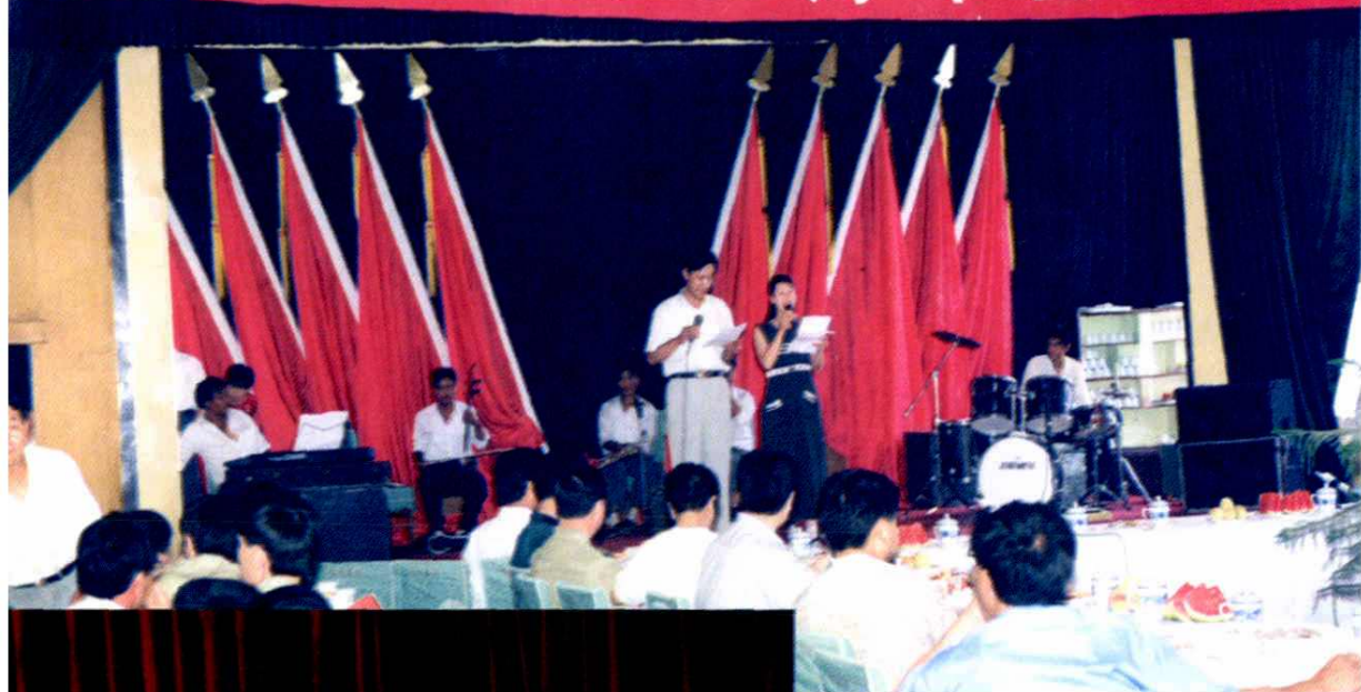
▲ 为纪念中国人民解放军建军72周年，县委、县政府举行军民联欢座谈会议