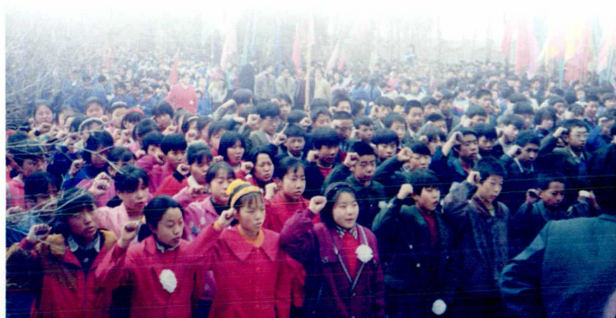
▼ 中、小学生在烈士纪念厅前宣誓