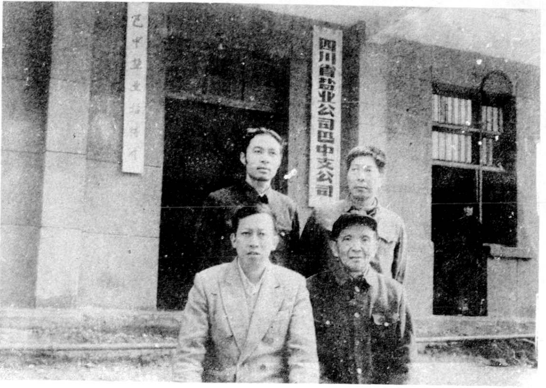
盐业志编纂领导小组