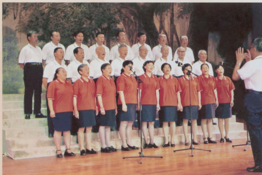
干休所歌咏队演出