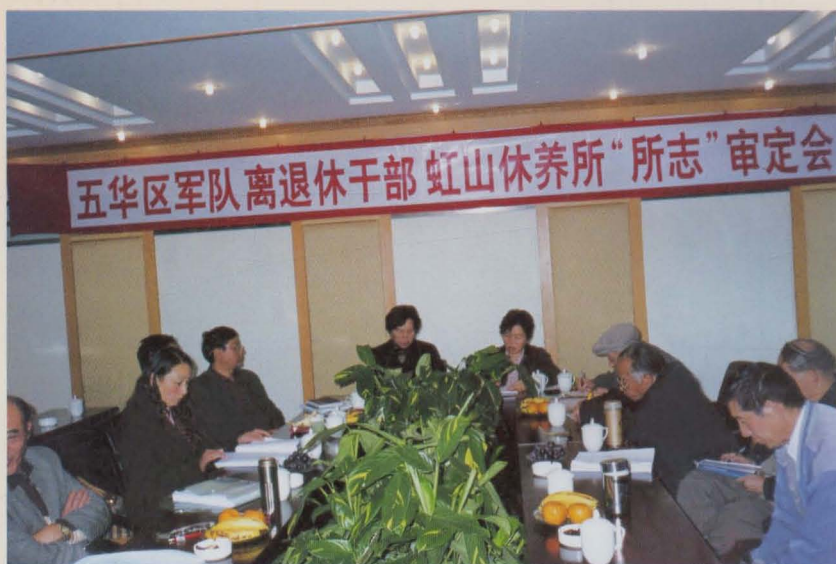
干休所“所志”审定会