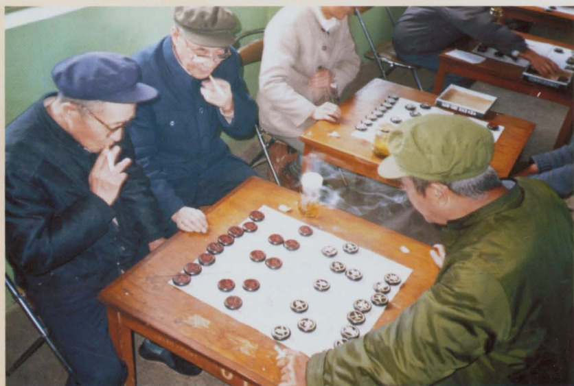
对弈厮杀、难分难解