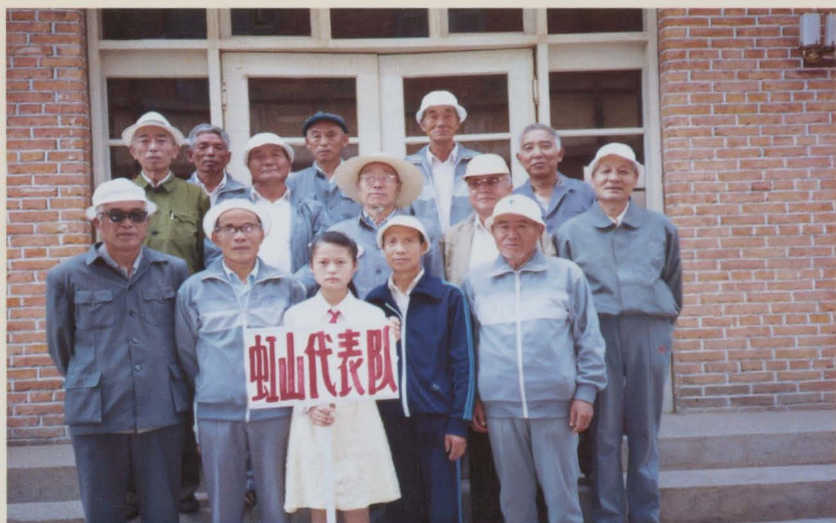
干休所老干部参加市安置办组织的文体活动