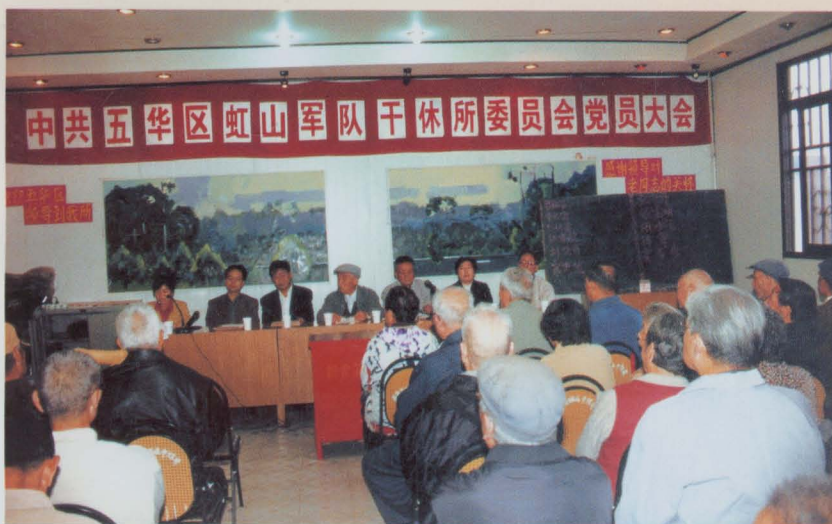
中共五华区虹山军队干休所委员会党员大会