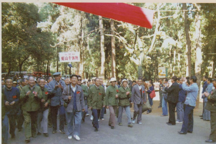
干休所“敬老节”组织老干部登山活动