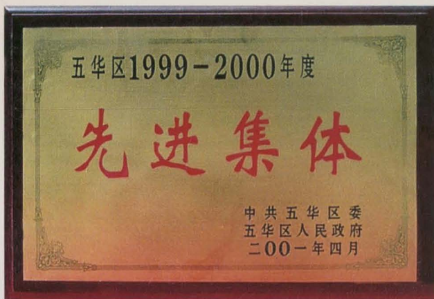
干休所荣获五华区 1999-2000 年度“先进集体”称号