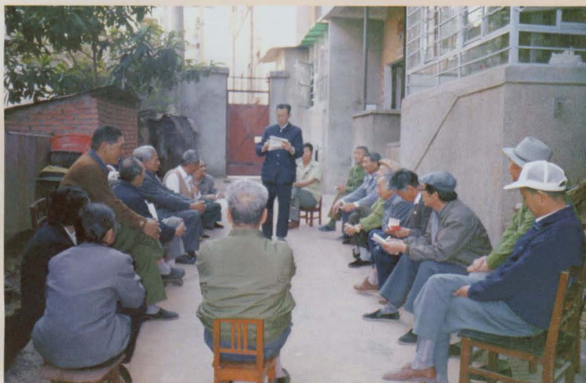
干休所老干部积极参加支部组织活动