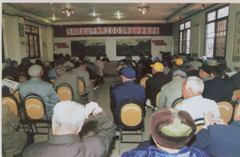
工休人员迎新春座谈会