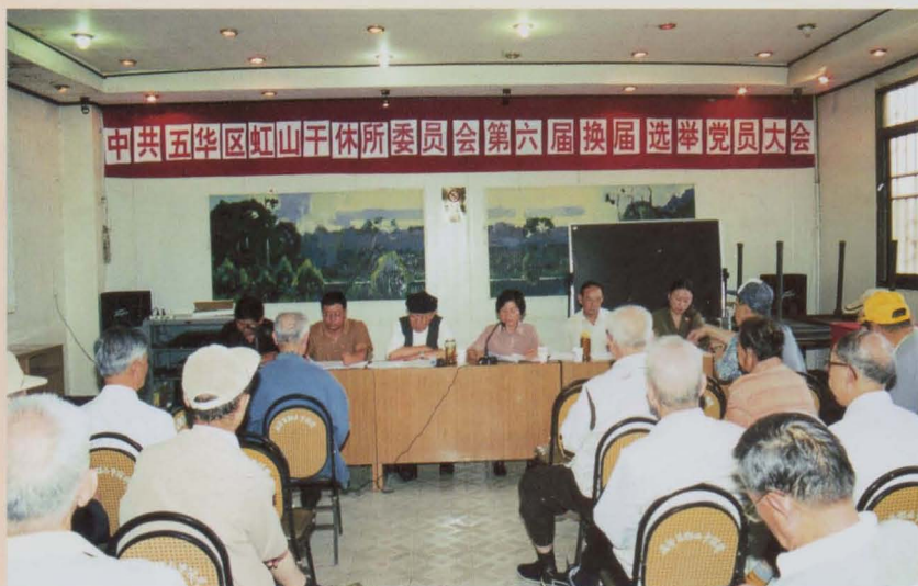
干休所换届选举党员会