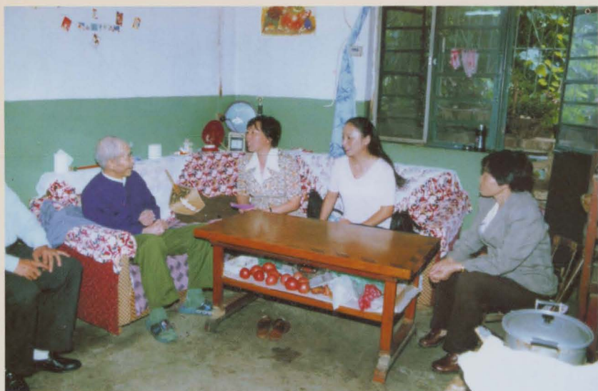
五华区民政局局长及干休所所长到老干部家慰问