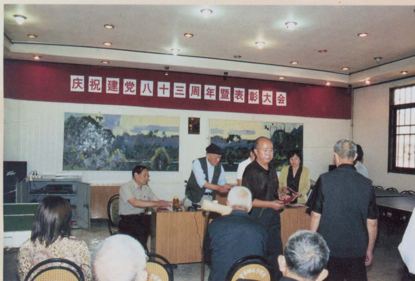
庆祝建党八十三周年暨表彰大会