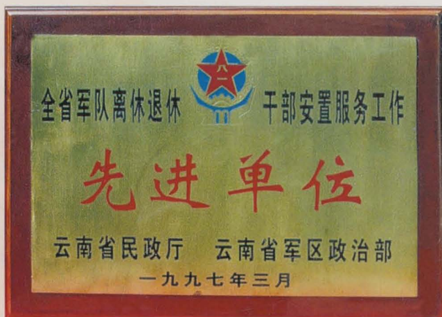
干休所荣获云南省民政厅,云南省军区政治部 颁发的“先进单位称号”