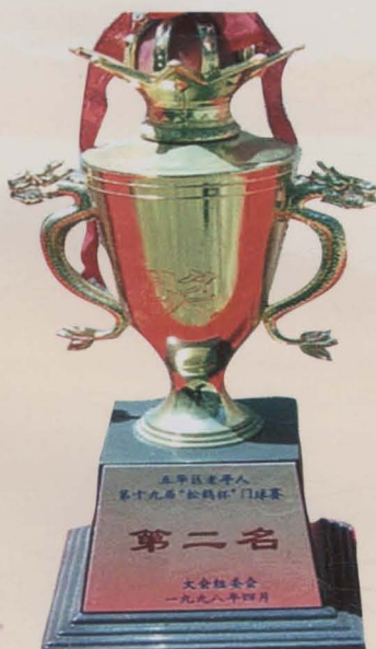
干休所荣获五华区老年人门球大赛第二名奖杯