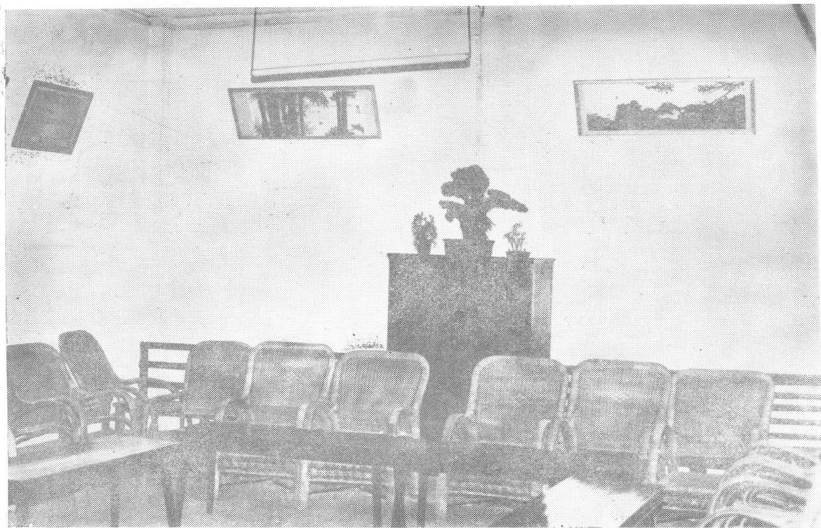
涪陵地区劳动局会议室