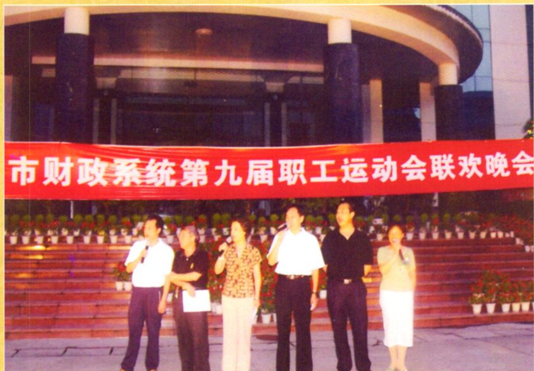
2005年6月20日，市财政局党组成员参加财政系统职工运动会联欢晚会。