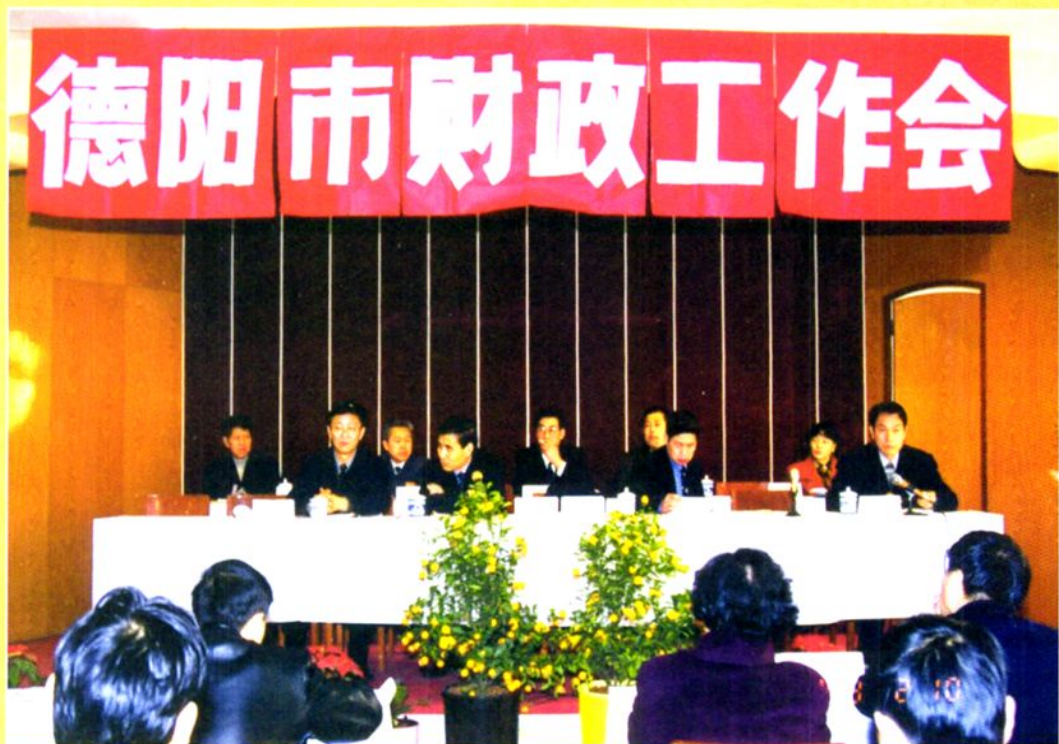
1999年2月9日，德阳市财政工作会议召开，图为会议主席台。