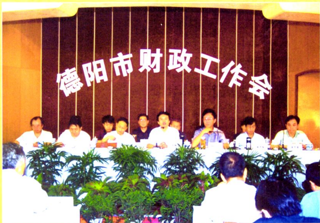
2000年8月23日，德阳市财政工作会议召开，图为会议主席台。