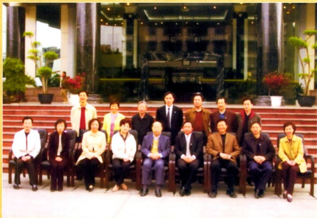
2006年4月13日，全国人大常委会原副委员长、财政部原部长王丙乾到德阳视察工作，与德阳市市县两级财政部门领导合影。