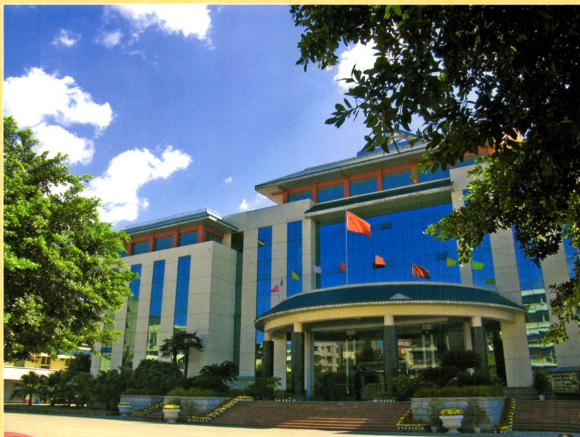
德阳市财政局办公大楼