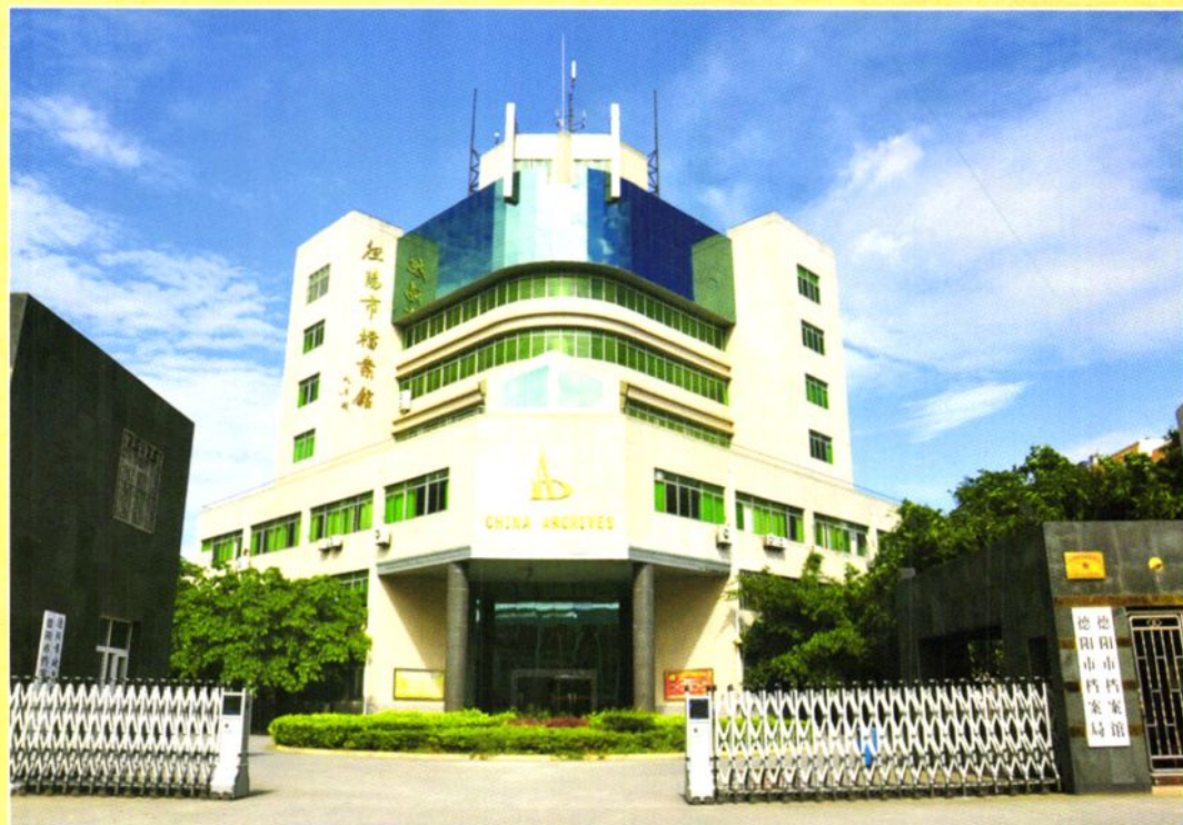
德阳市档案馆，建于1999年12月，2001年3月竣工，工程规模为6744.3m 2 ，财政投资1082.72万元。