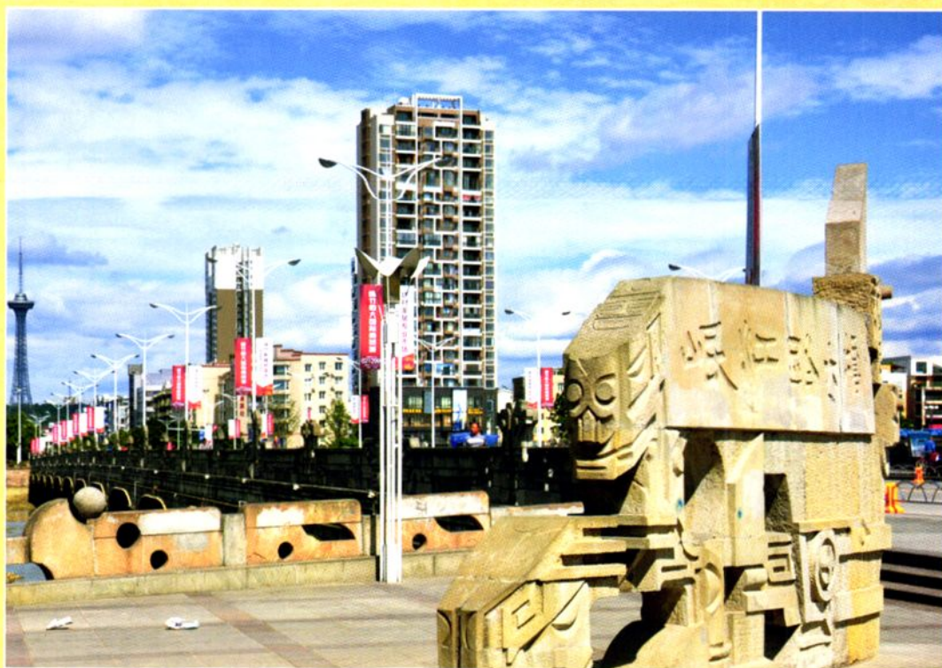
德阳市岷江路大桥，于1999年10月开建，2000年6月竣工，全长260米，宽35米，财政投资2030.47万元。