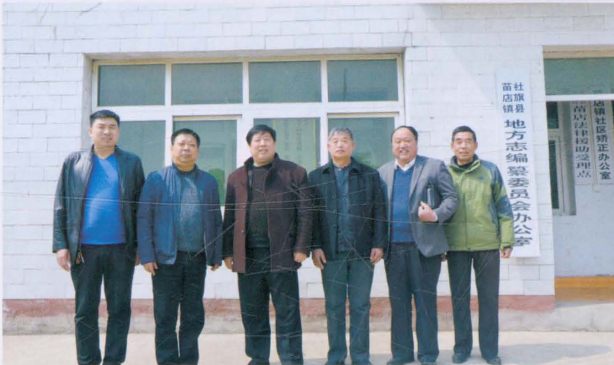
禹州市无梁镇镇领导来苗店学习交流镇志工作，县志办领导陪同