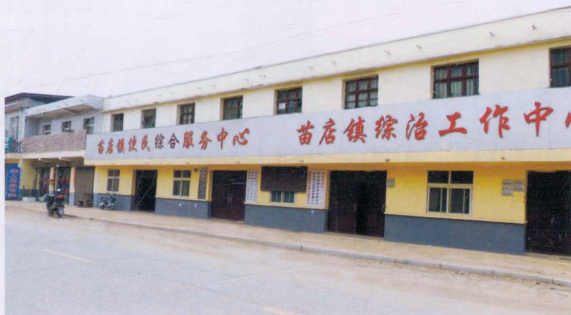
苗店镇劳动服务中心