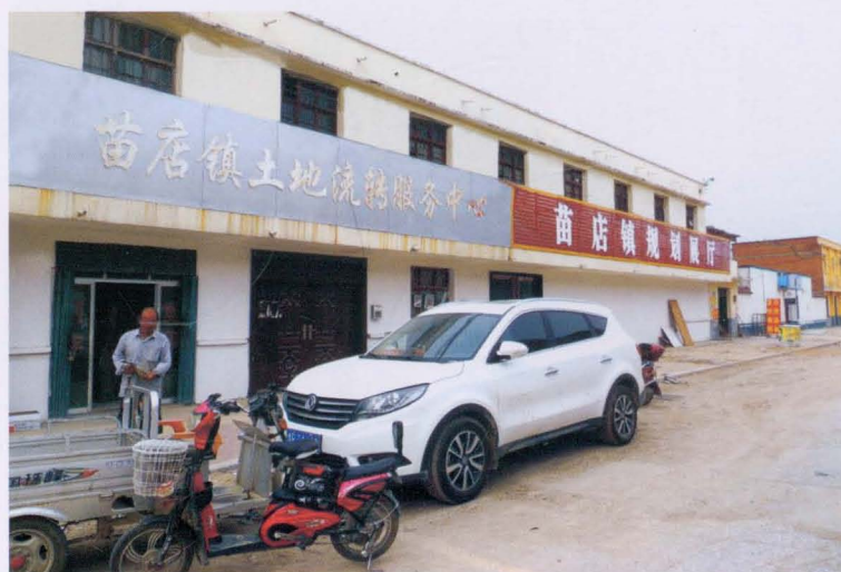
苗店镇土地流转服务中心