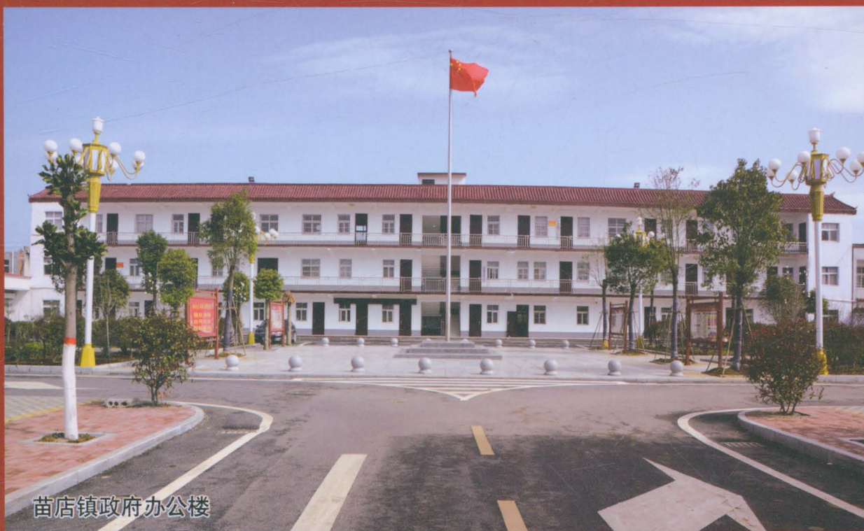
苗店镇政府办公楼