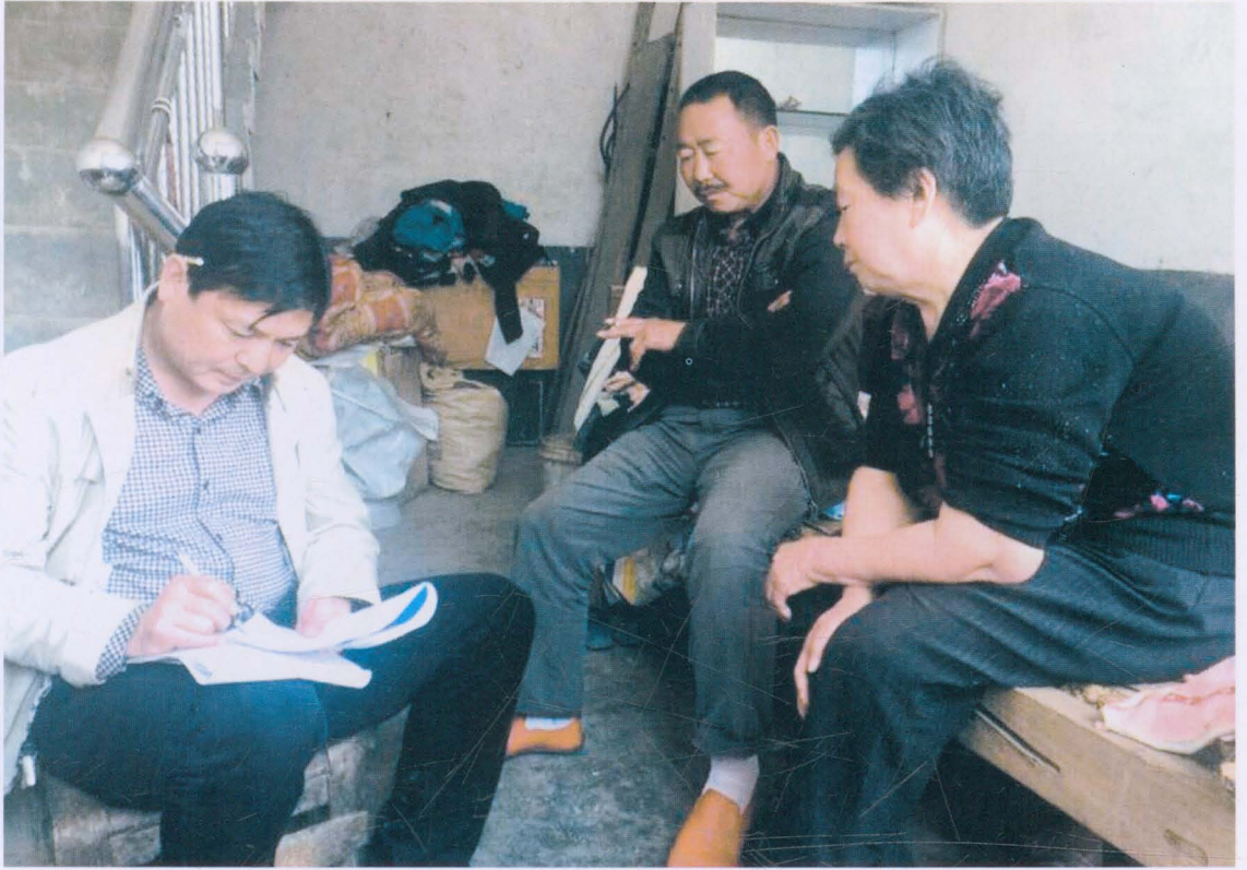
人大主席团主席郭清武（左一）到贫困户家中了解情况