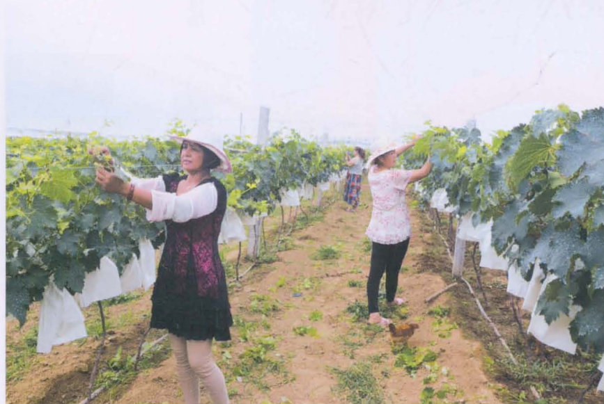
石塔寺村新建葡萄园