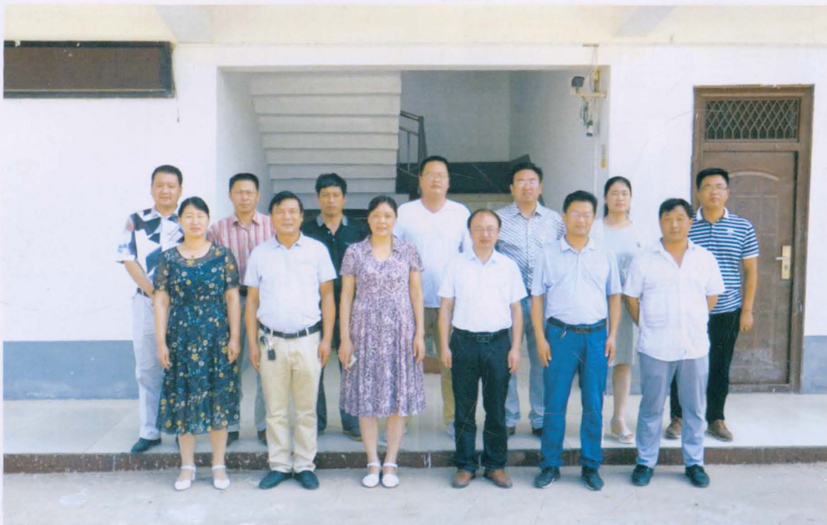
苗店镇党政人大领导成员