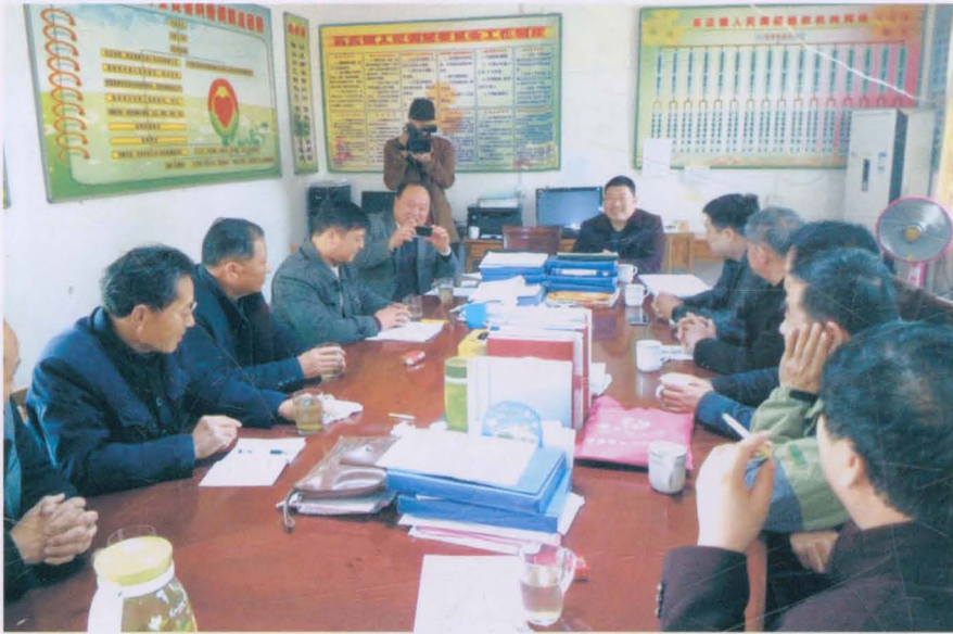
县志办领导亲临指导镇志工作