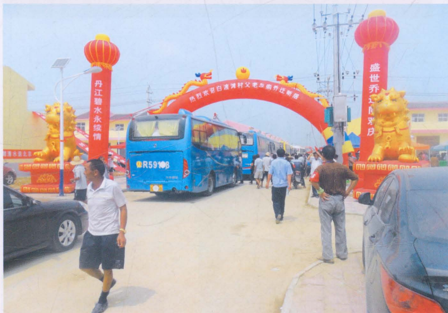
欢迎移民入住现场