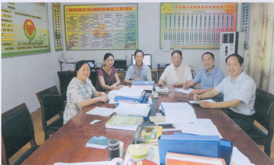
镇志办成员研究镇志编纂工作