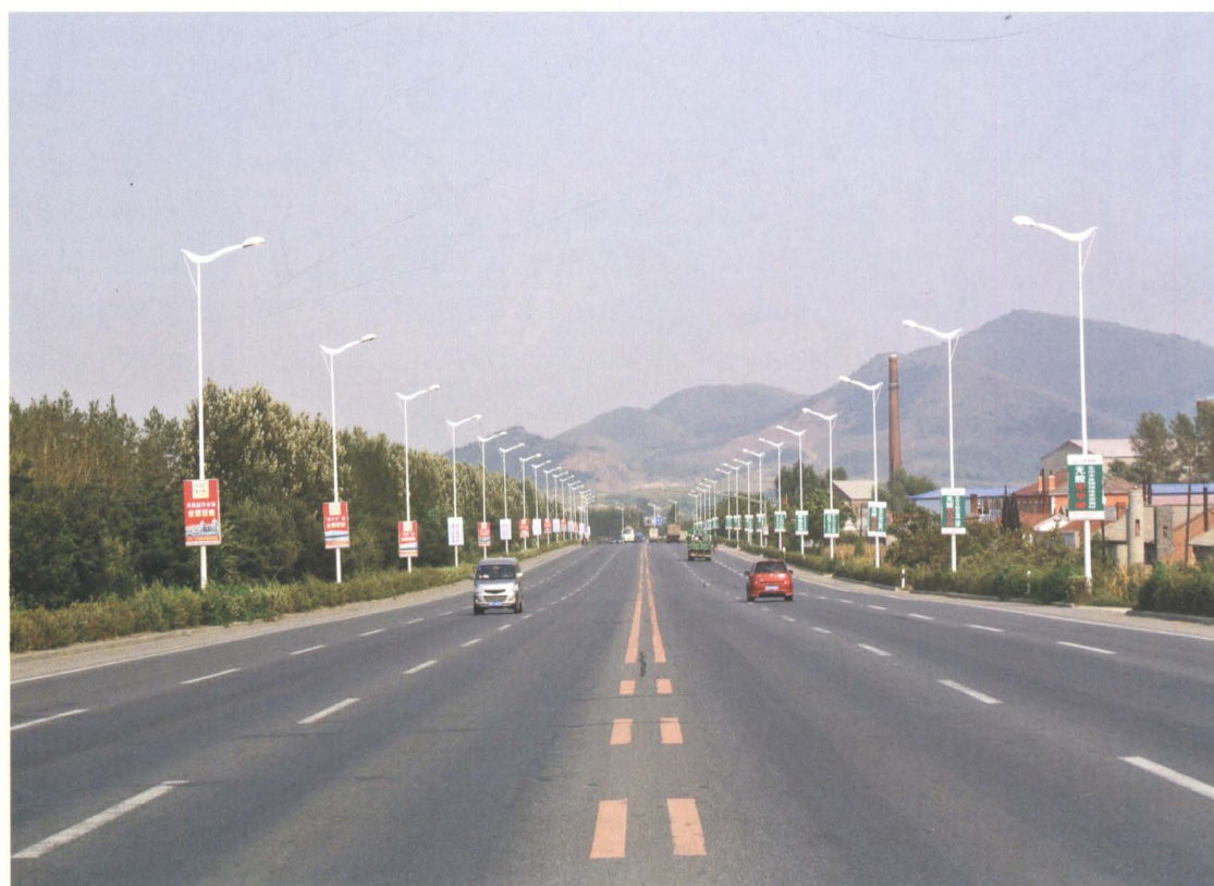
2006年改建的国道京哈公路铁岭至懿路段一级公路