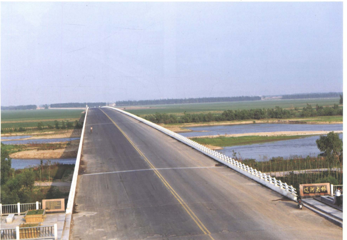
2009年建成的新调公路铁岭市预应力钢筋混凝土T形梁辽河大桥