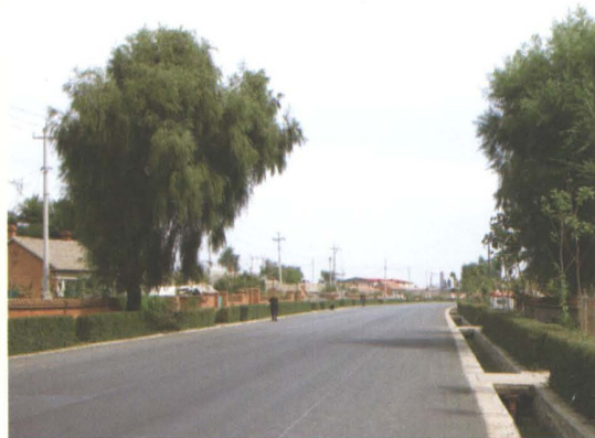
省道辽开公路开原市城东乡过境路建成的石砌边沟