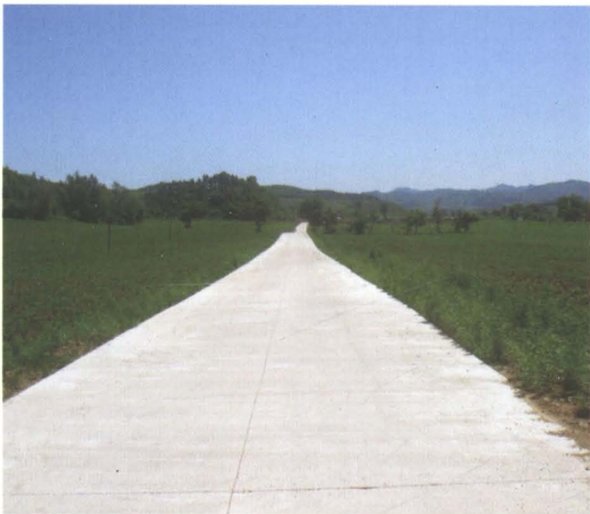
2007年新建的西丰县乡级公路忠康线水泥混凝土路面