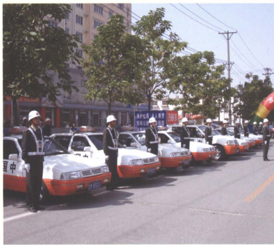
2006年铁岭市开展《辽宁省公路条例》执法宣传活动