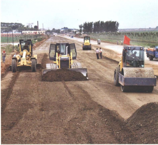
2006年京哈公路改建工程进行机械铺筑路面基层作业