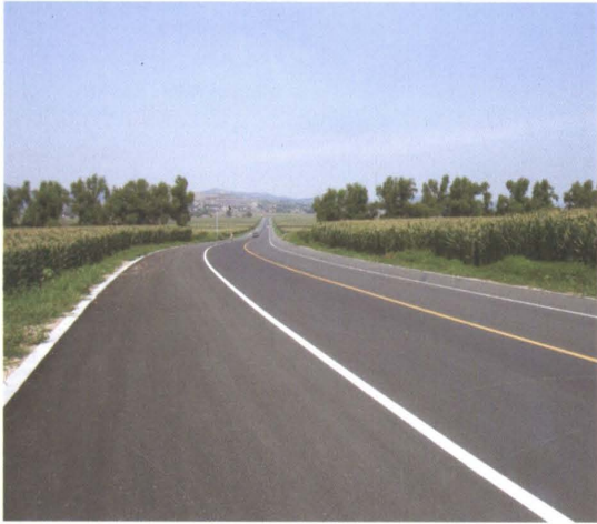
2009年新建的新城区至调兵山二级GBM公路