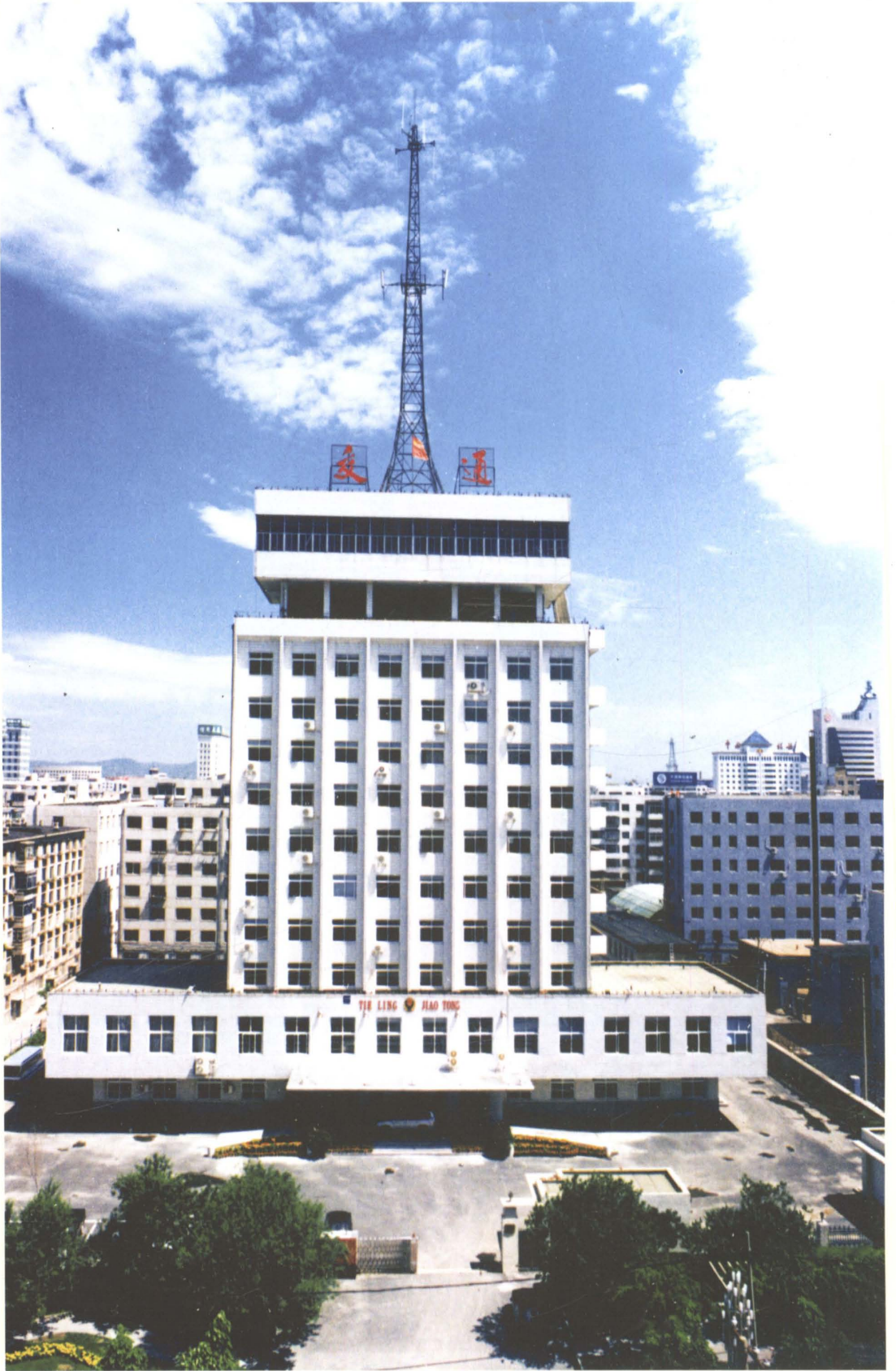
铁岭市公路管理处办公楼