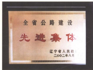
2002年铁岭市荣获省政府“全省公路建设先进集体”称号