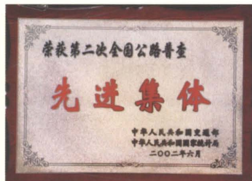
2002年市公路处被交通部、国家统计局评为“第二次全国公路普查先进集体”