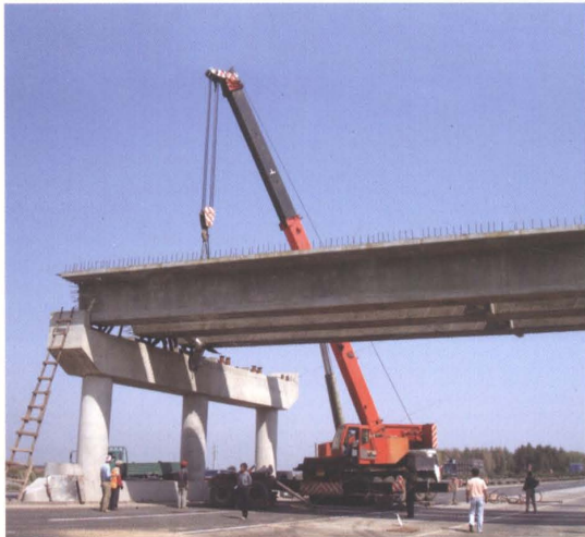
2007年阮家洼子跨线桥吊装箱梁施工