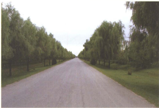
2009年改建的国道集锡公路昌图县境内二级公路