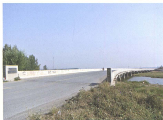
2006年改建的县道阿陈公路铁岭县预应力钢筋混凝土空心板随荒地大桥