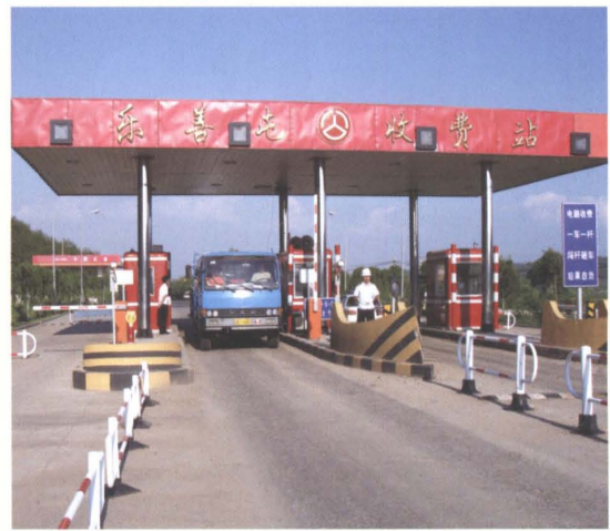
省道辽开公路西丰段乐善屯公路收费站