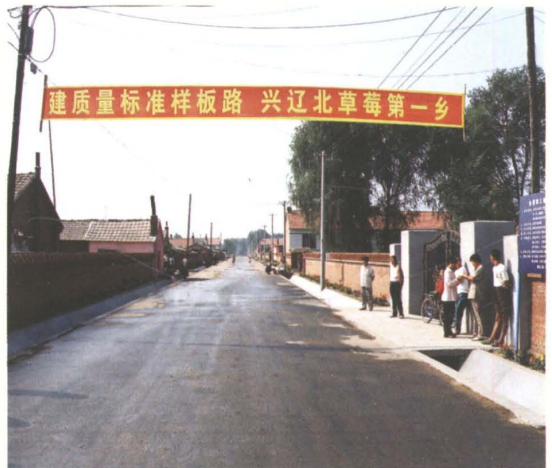
2003年新建的开原市三家子乡级公路沥青路面