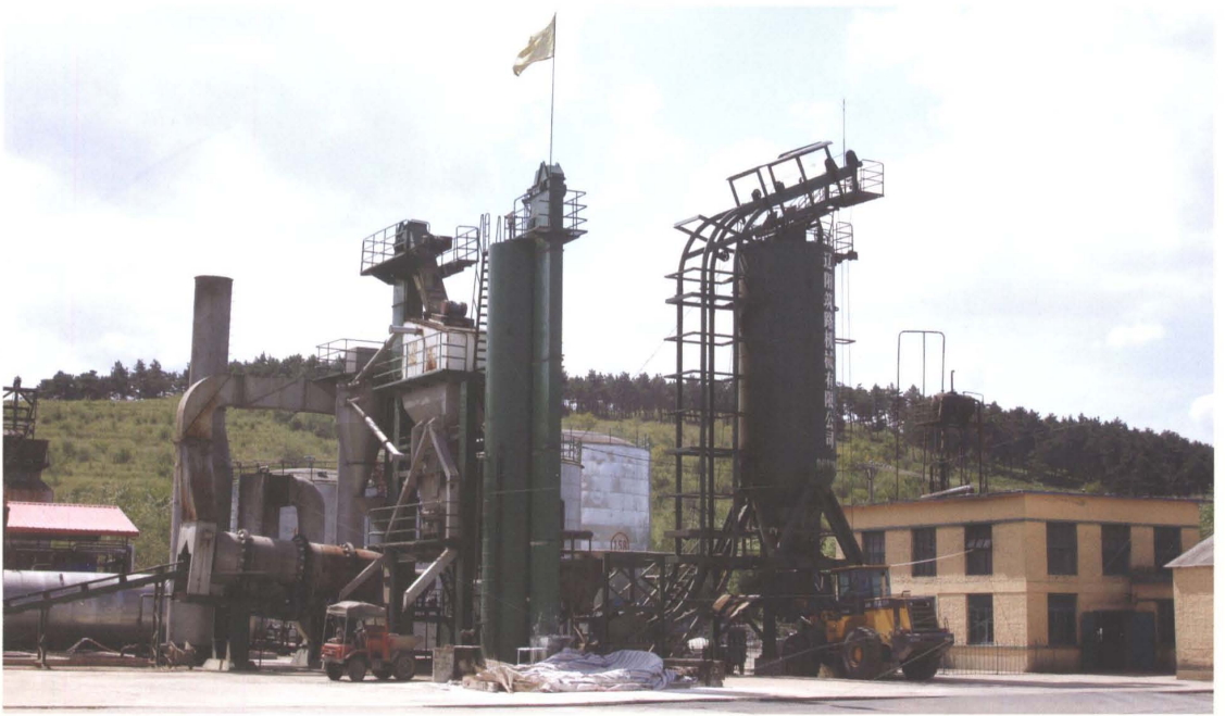
西丰县公路段公路沥青拌合站