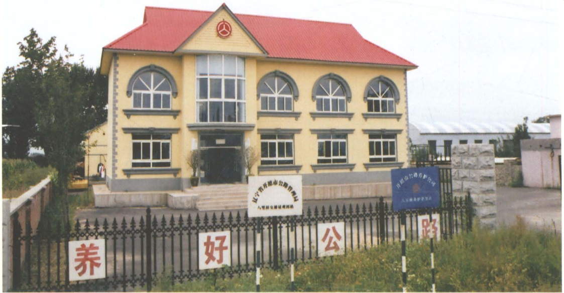
国道京哈公路开原市公路局八里桥公路管理站