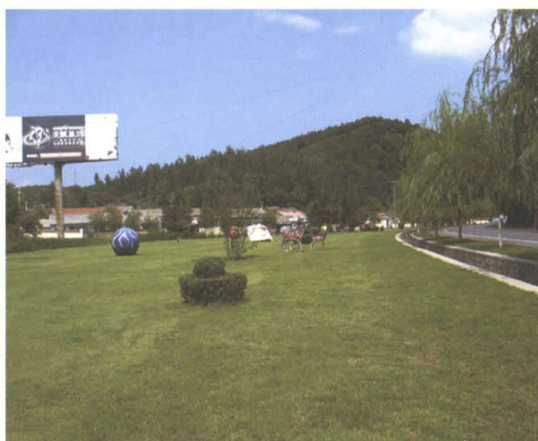
省道辽开公路乐善屯段公路养护小景点