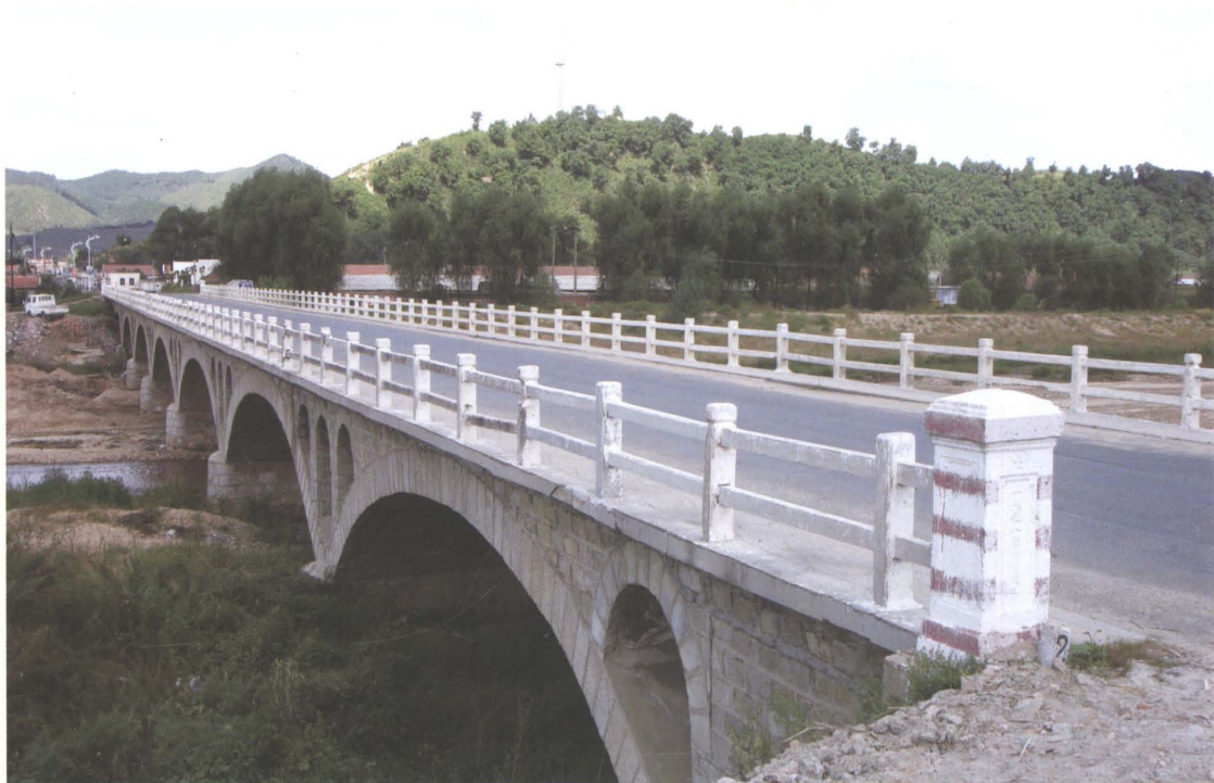
1971年建成的县道郜兴公路西丰县空腹式片石拱凉泉桥