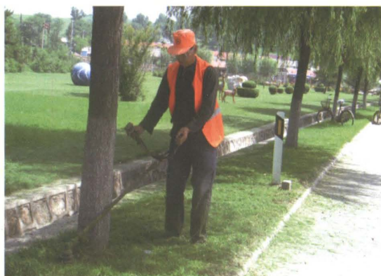
公路养护职工进行公路绿化带修剪作业