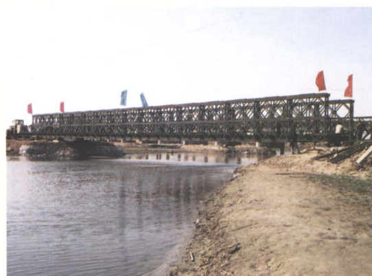
2006年昌图县因通江口大桥改建在辽河上架设的双层、双排、单跨战备钢梁便桥