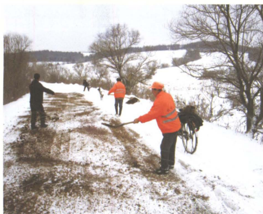
公路养护职工进行山区公路铺撒防滑料