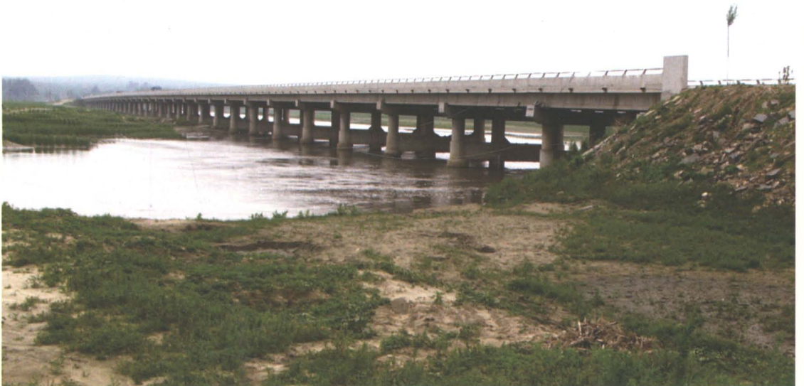
2002年维修改建的省道新梨公路昌图县钢筋混凝土少筋微弯板通江口大桥