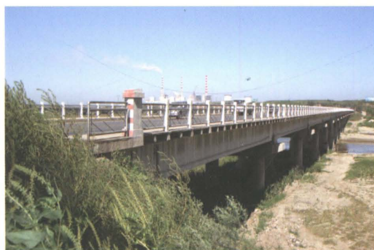
1982年建成的省道沈环公路铁岭县预应力钢筋混凝土筒支梁辽河大桥