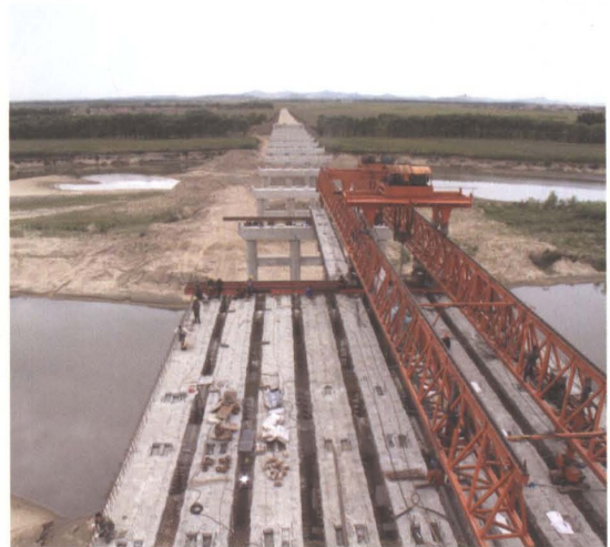
2009年新调公路新建的辽河大桥施工现场