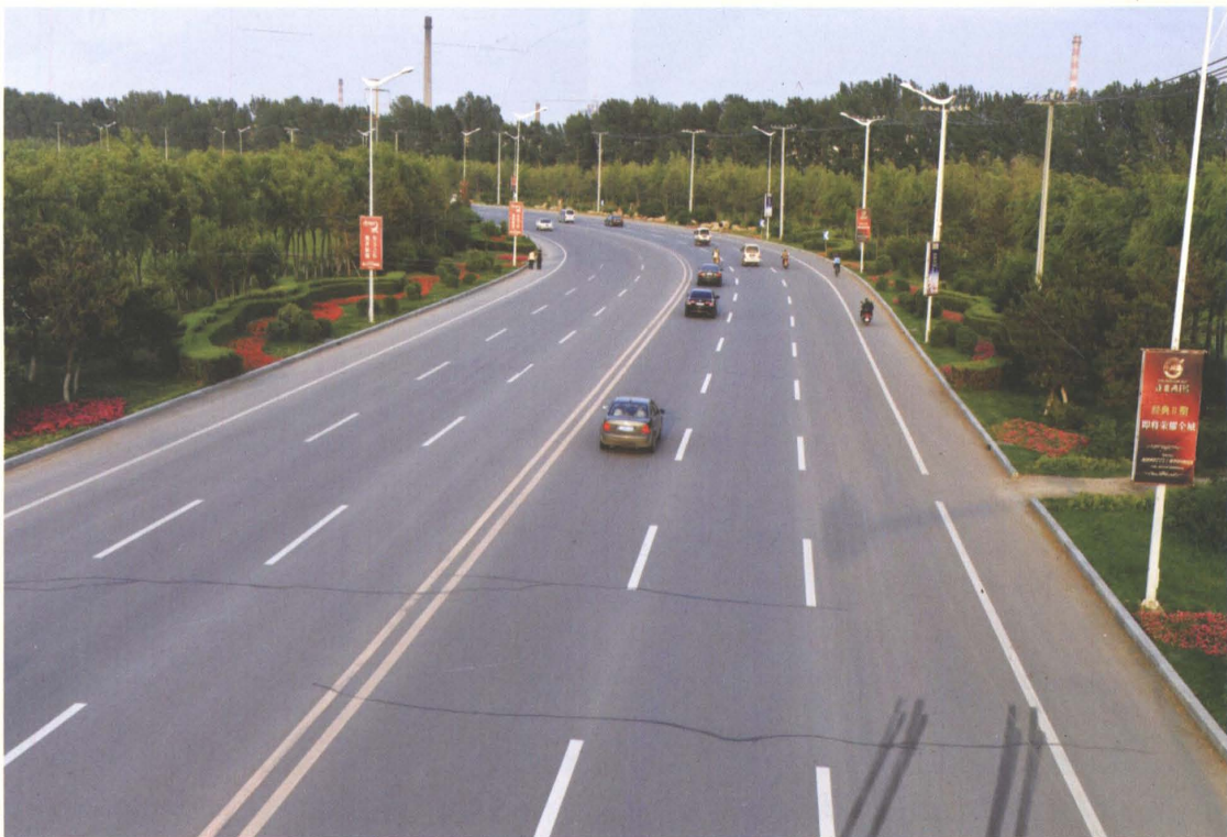
2006年新建的县道铁三公路银州区至新城区段一级公路