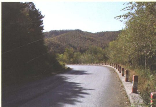
2002年改建的县道开草公路清河区境内段二级公路