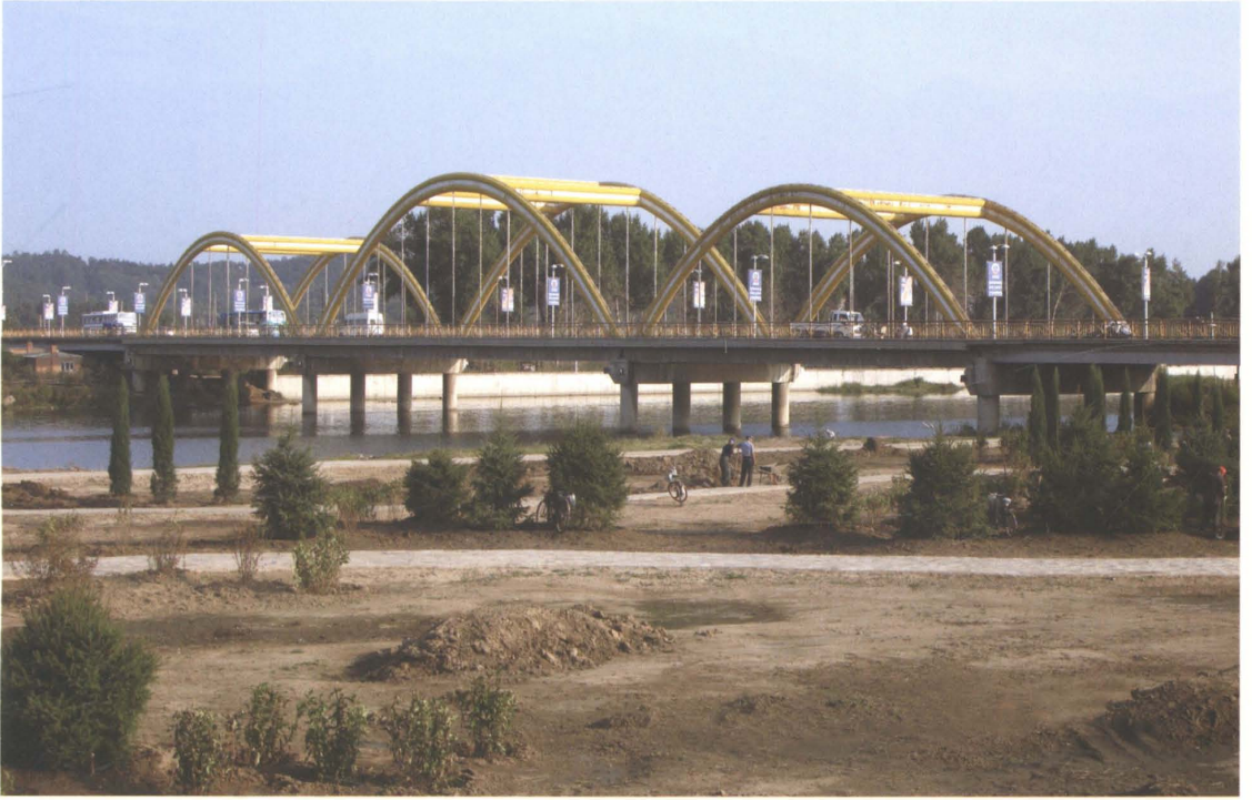
1998年新建的铁岭市北出口组合式钢管混凝土系杆拱柴河大桥