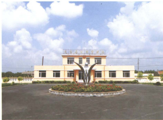
国道京哈公路昌图县公路管理局毛家店公路管理站