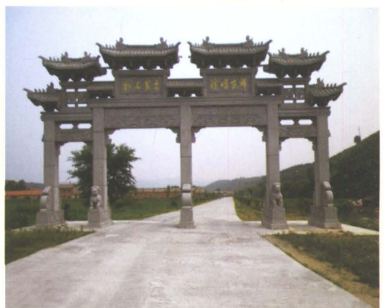
2008年新建的西丰县凉泉至城子山旅游公路水泥混凝土路面