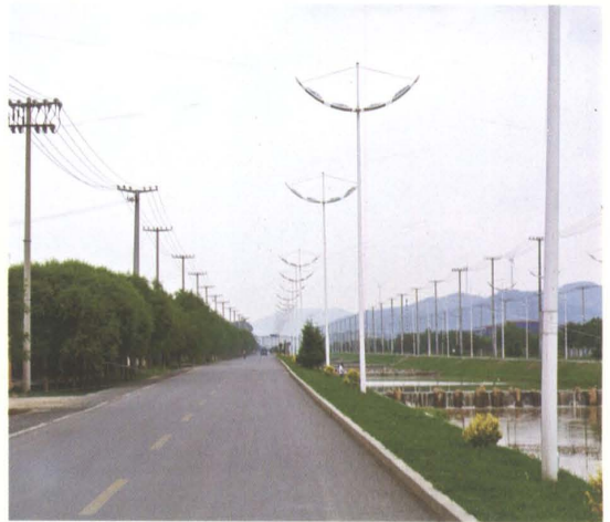
2008年新建的铁岭经济开发区乡级公路茨太线沥青路面