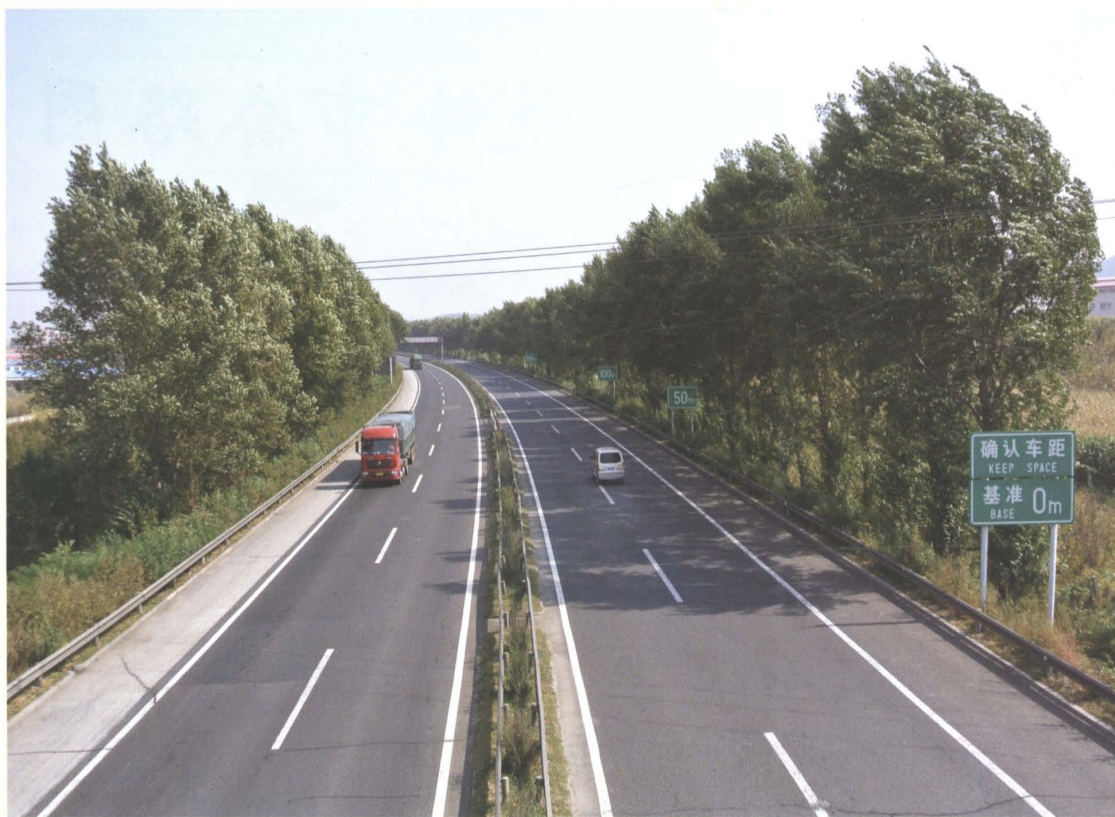
1998年京哈高速公路铁岭境内路段全线建成通车