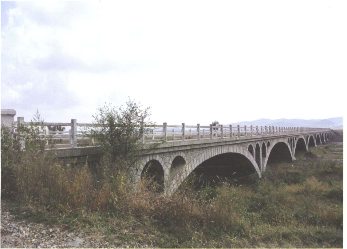
1993年建成的乡道明永公路西丰县空腹式石拱明德大桥