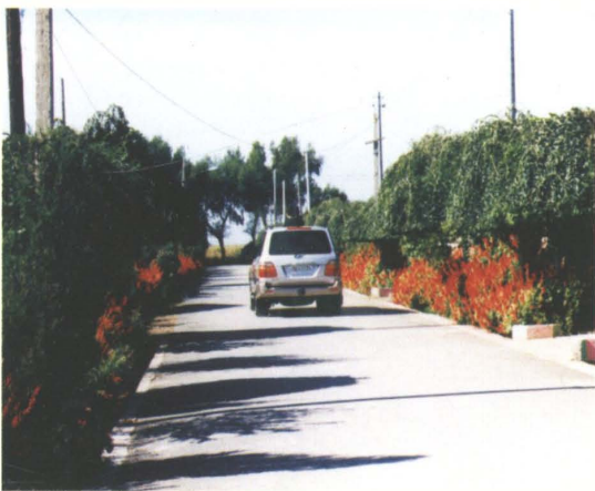
2003年新建的铁岭县胜台子村沥青路面