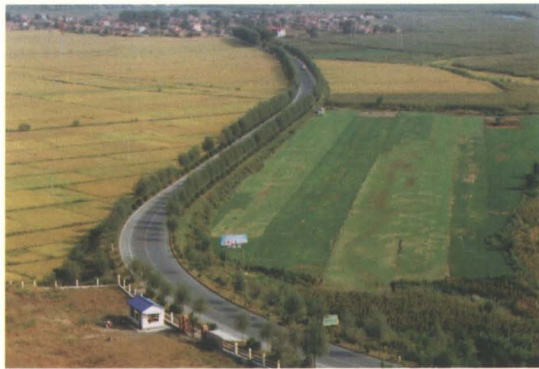
1999年改建的省道沈环公路东辽海至小靠山屯段二级GBM公路