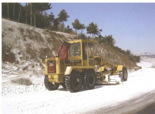
公路养护职工进行机械除雪防滑作业