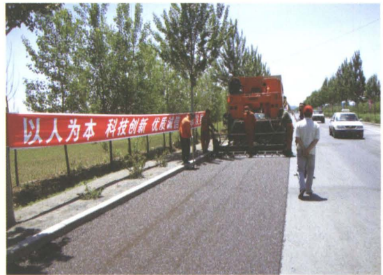
2009年国道京哈公路实施多元化养护碎石封层施工