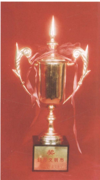
1999至2009年铁岭市累计10次荣获省交通厅“公路文明市”奖杯