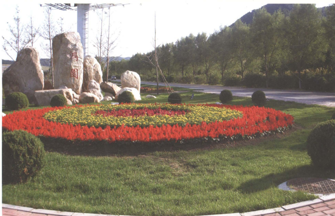
省道沈环公路铁岭开发区官台工业园公路养护小景点