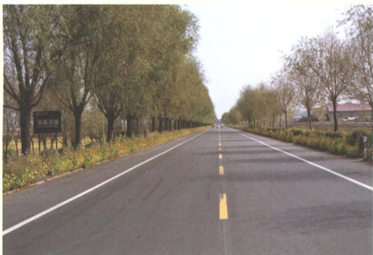
2000年改建的省道辽开公路西丰县邵家店段二级GBM公路