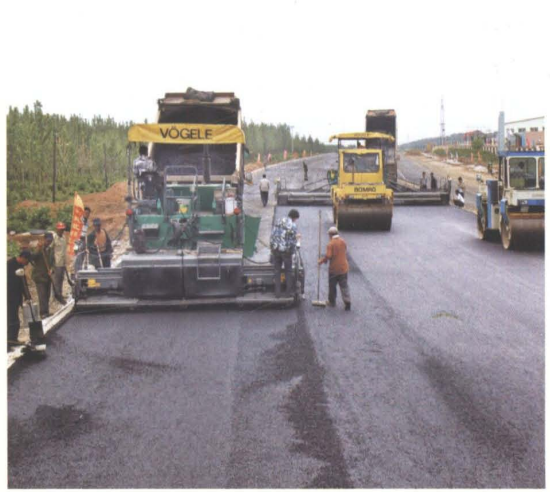
2006年京哈公路改建工程实施机械摊铺沥青路面作业