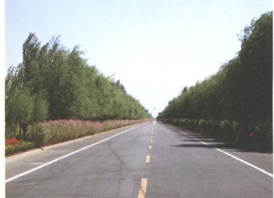
省道辽开公路西丰县境内公路绿化