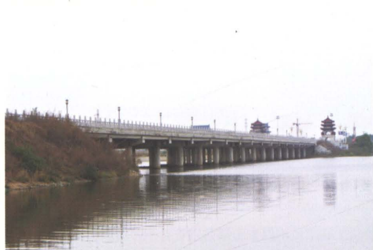
2009年改建的国道京哈公路开原市钢筋混凝土空心板梁清河大桥