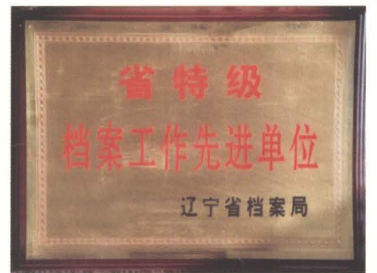
2000年市公路处被省档案局评为“省特级档案工作先进单位”