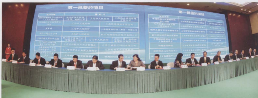
11月26日，浙商回归助推义乌国际贸易综合改革项目推介会