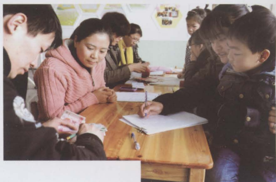
外来人员子女在义上学人数达5万之多