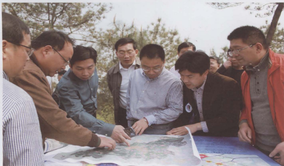
3月30日至31日，义乌市委书记李一飞（中）调研全域空间布局