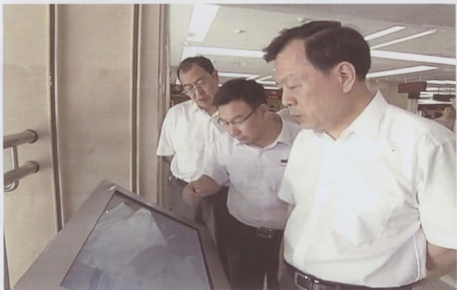
8月1日，省委书记、省人大常委会主任夏宝龙（中） 来义调研国际贸易综合改革试点工作