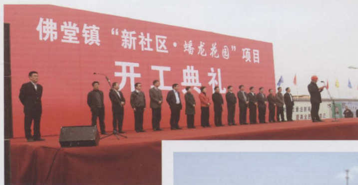
集聚区项目开工建设