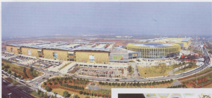
义乌国际生产资料市场