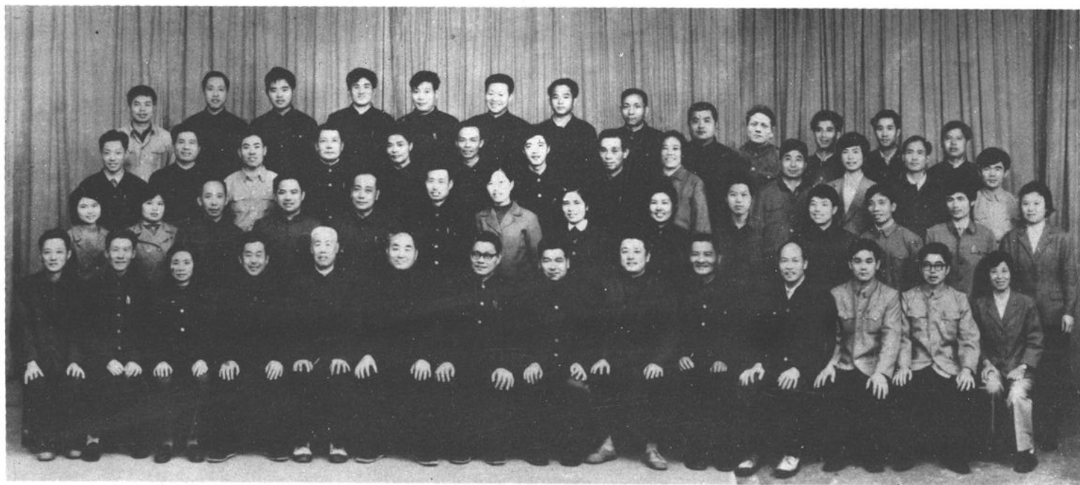
萧山县商业局机关工作人员（一九八〇年至一九八七年期间）