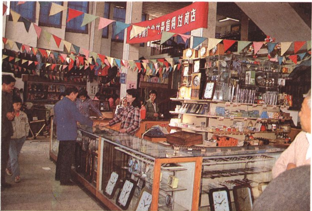
临浦百货大楼营业大厅