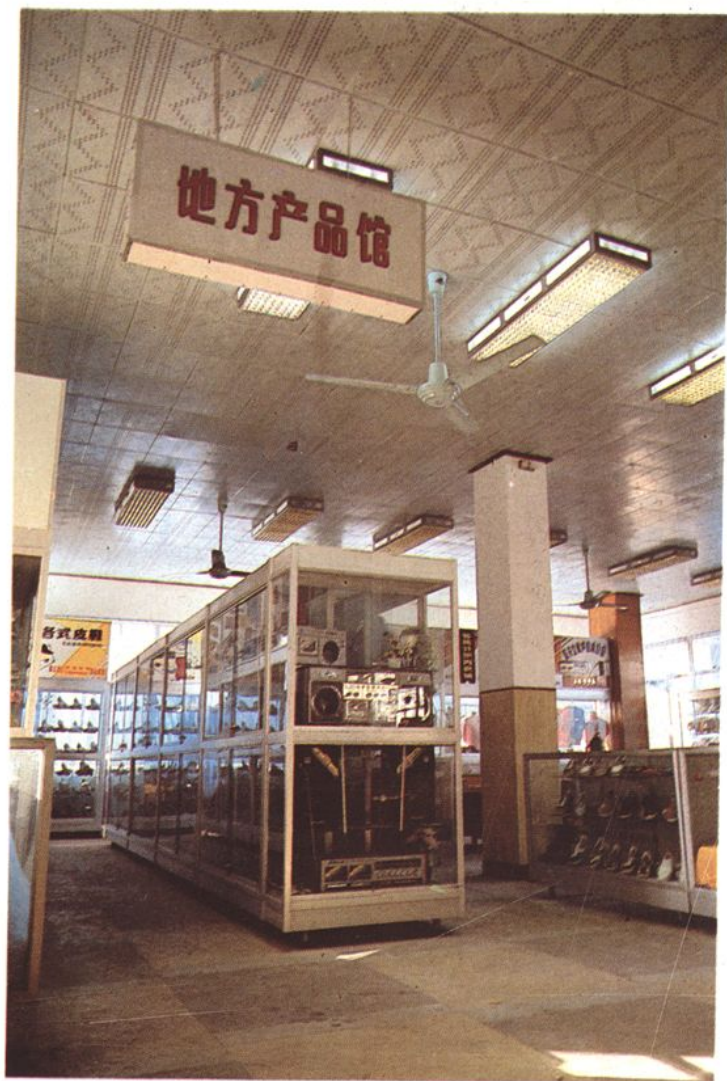
县百货公司批发大厅内地方产品批发商场