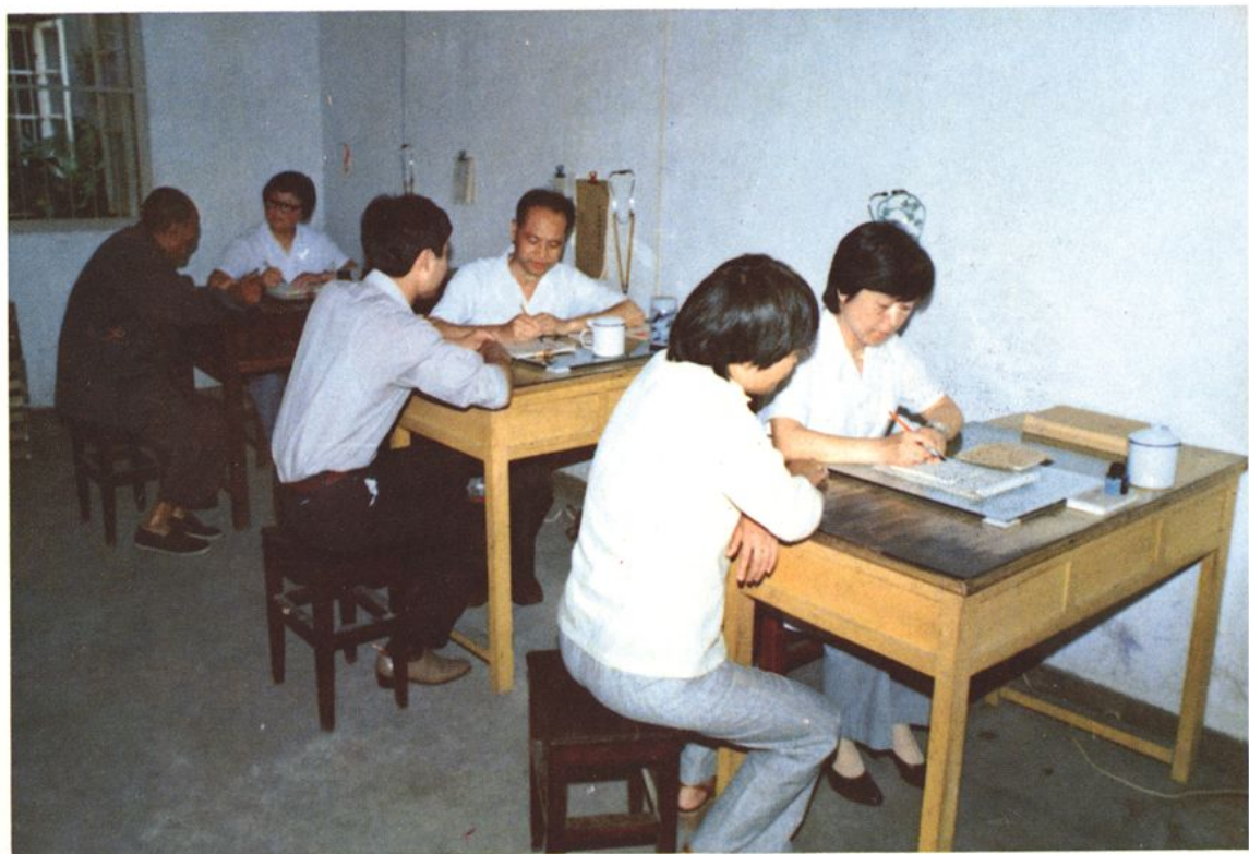
商业局保健站一角