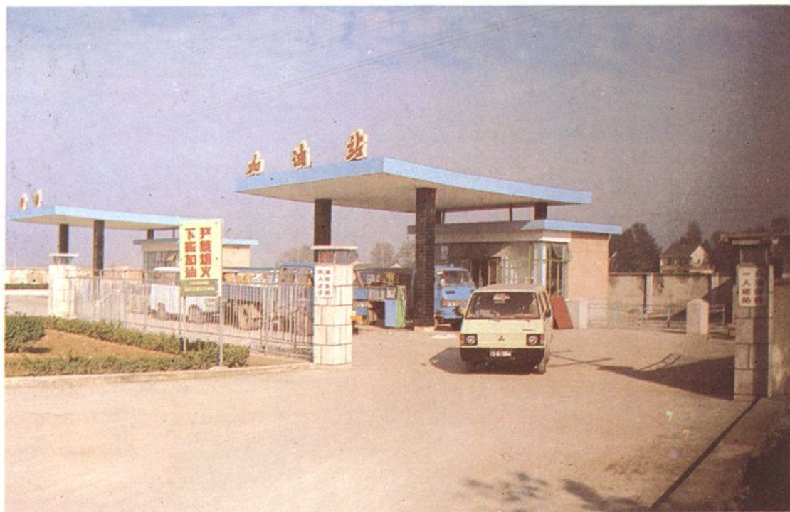
县石油公司衙前加油站