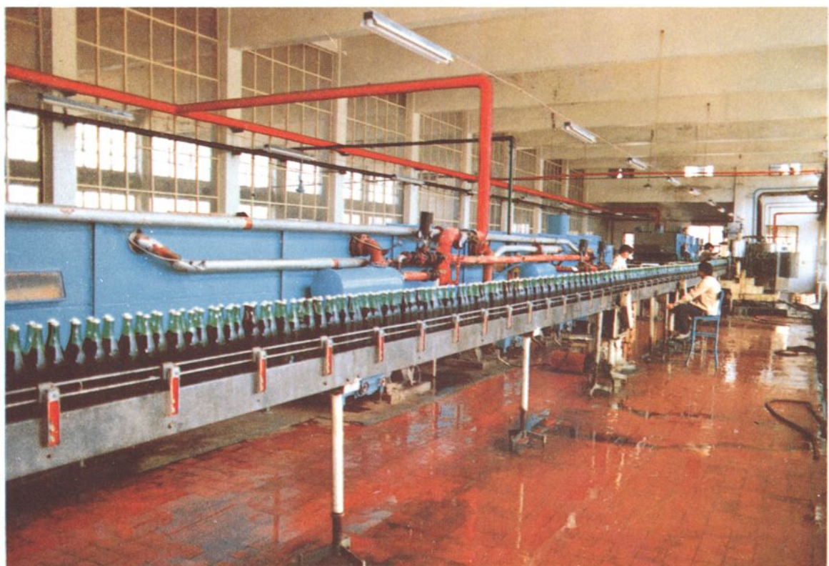
县副食品公司与城南乡联营的湘湖啤酒厂车间一角