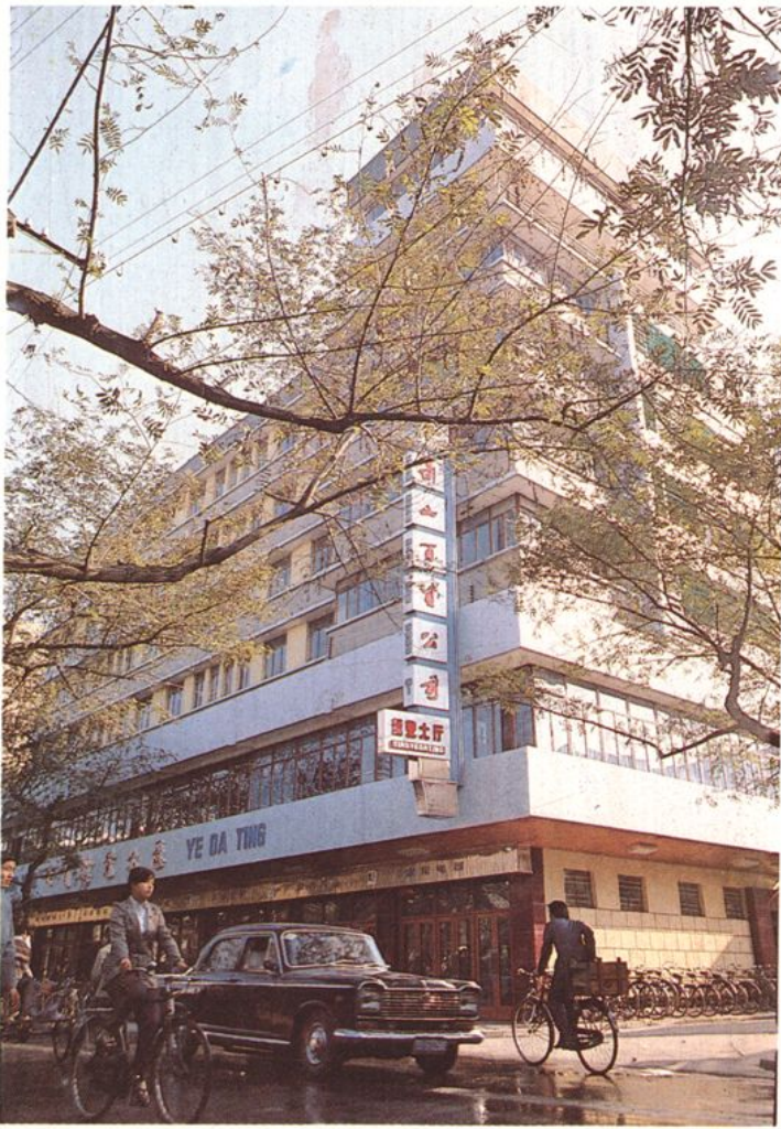
县百货公司办公楼与批发大厅侧貌