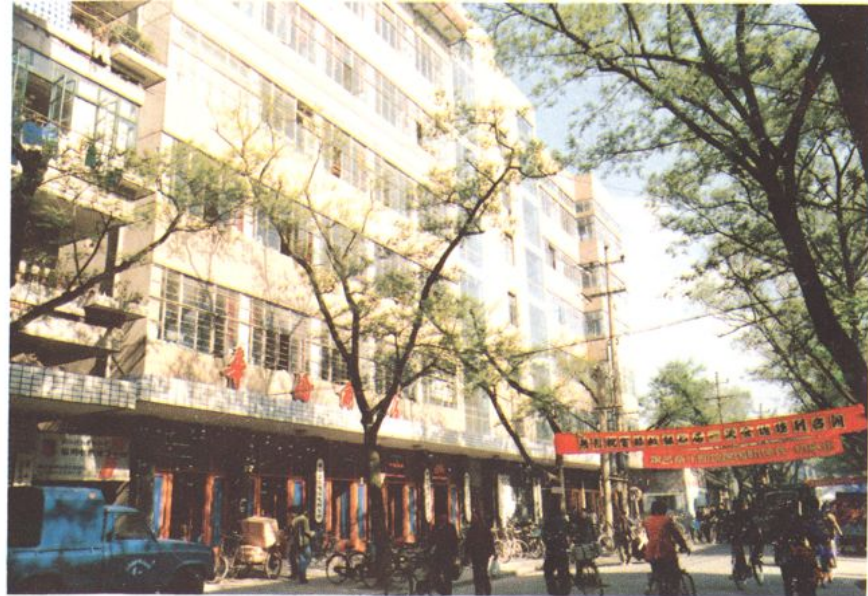
萧山五交化批发部一角