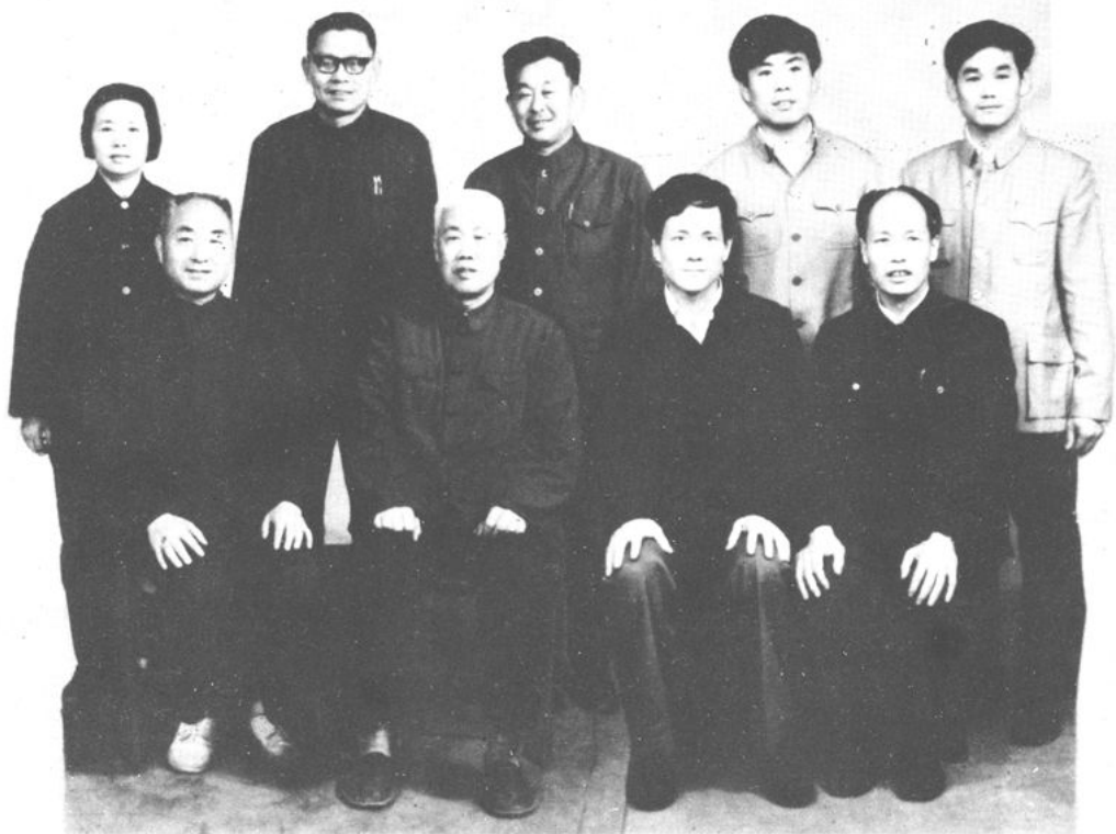
萧山县商业局党委成员（一九八〇年至一九八七年期间）