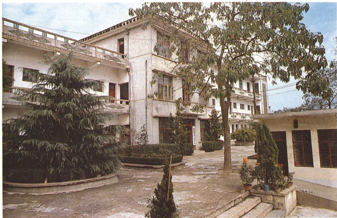
县技工学校商业分校、商业职工学校