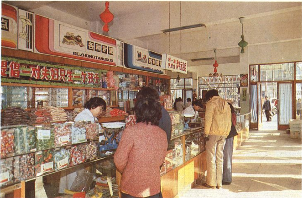
县副食品公司批发商场一角