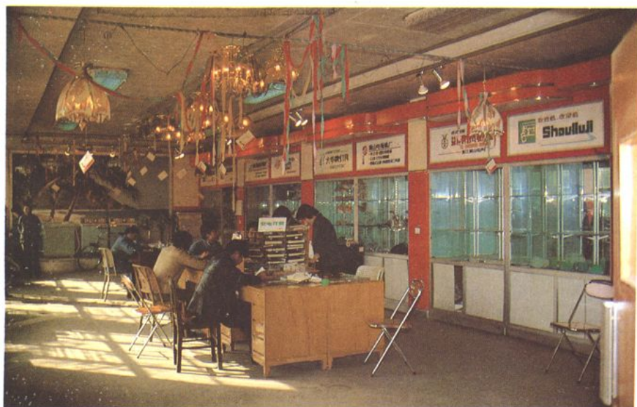
萧山五交化商场营业场一角