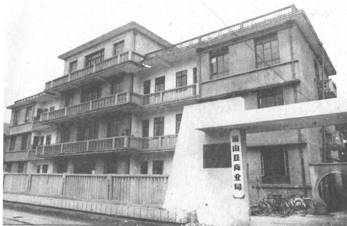
县商业局、县供销社合署办公楼