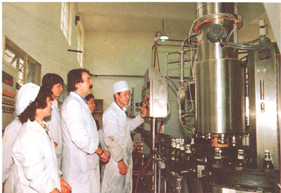
杭州国际大厦饮料厂从意大利引进的软饮料全自动生产线