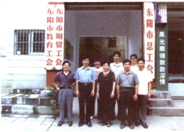
市总工会办公楼(西街2号)大门