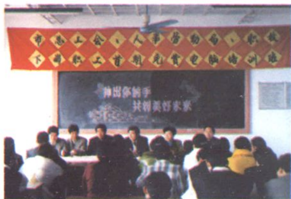
市总工会、人事劳动局、职校为下岗职工举办首期免费电脑培训班开训典礼。