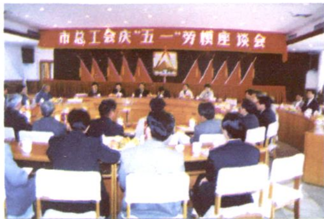
“五.一”劳动模范座谈会

1999年5月7日，市委组织部、市总工会联合召开首次镇乡工会工作会议，市委书记杨守春（中）到会讲话。