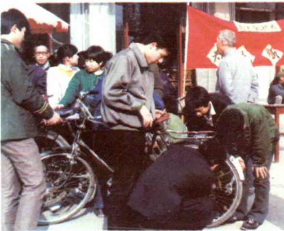
总工会职校师生为民服务活动