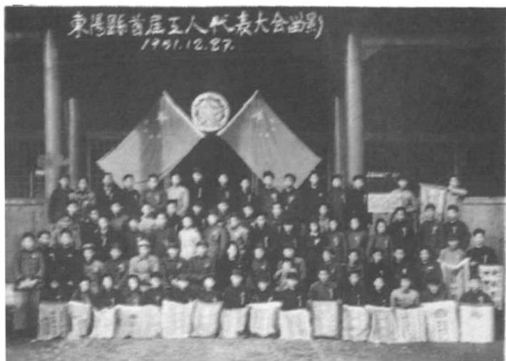
1951年12月27日召开的东阳县首届工人代表大会代表。