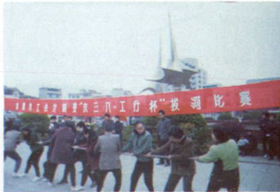
女职工进行拔河比赛