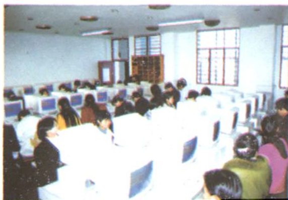
培训班的下岗职工在操作电脑