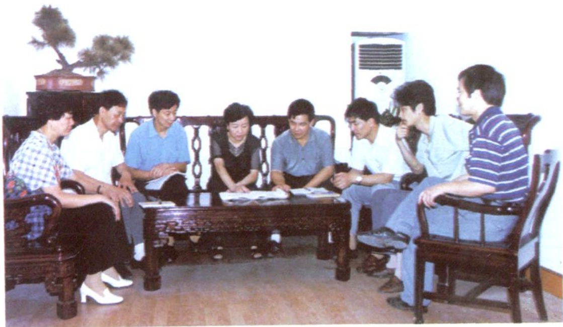
市工会常委们一起研讨工作