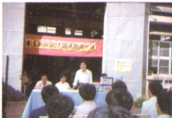
市总工会开展职工技术操作比赛