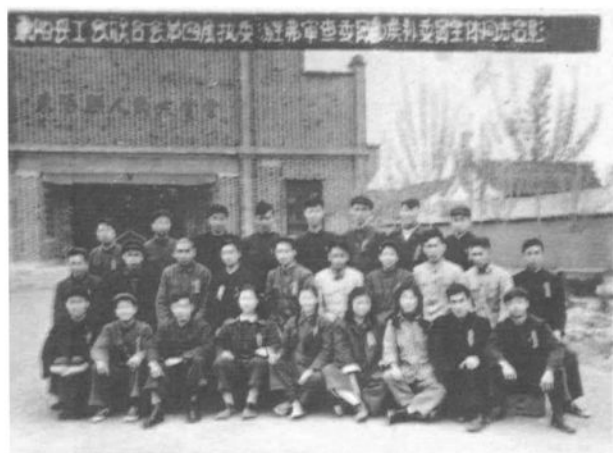
1956年4月11日，东阳县工会联合会第四届执委、经费审查委员、候补委员合影。