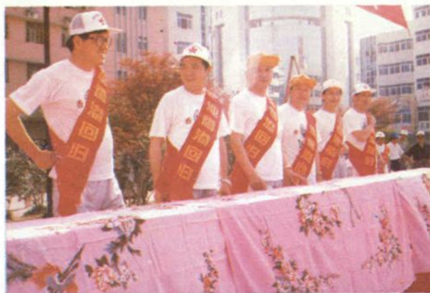
市五套班子领导在开幕式主席台