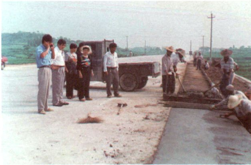
市委领导、总工会同志冒暑慰问筑路工人。