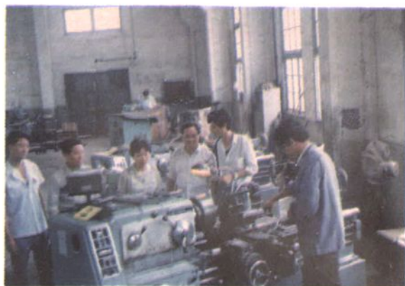
职工正在进行技术操作