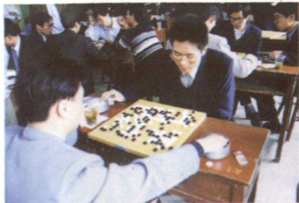
工人文化宫开展的职工棋类活动