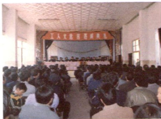
工人文化宫落成典礼