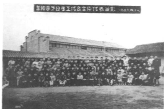
1957年1月7日，东阳县工会联合会首届优秀积极分子代表大会全体代表。