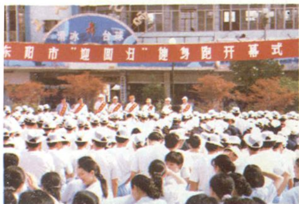
“迎回归”健身跑开幕式