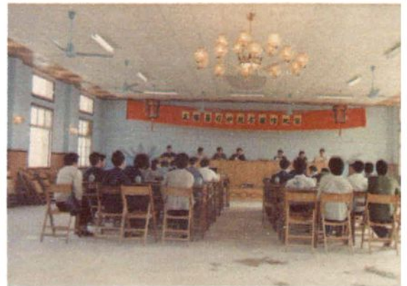
市总工会组织的司炉工技术操作比赛