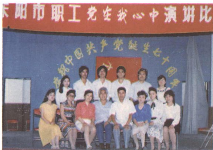
总工会开展“党在我心中”职工演讲活动，图为获奖人员合影。