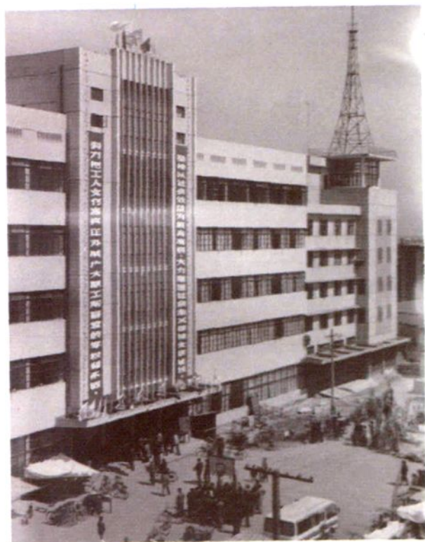
◁ 1986年3月7日落成的 工人文化宫大楼外景