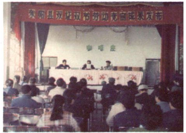
1988年县总工会开展“双增双节”劳动成果发布会