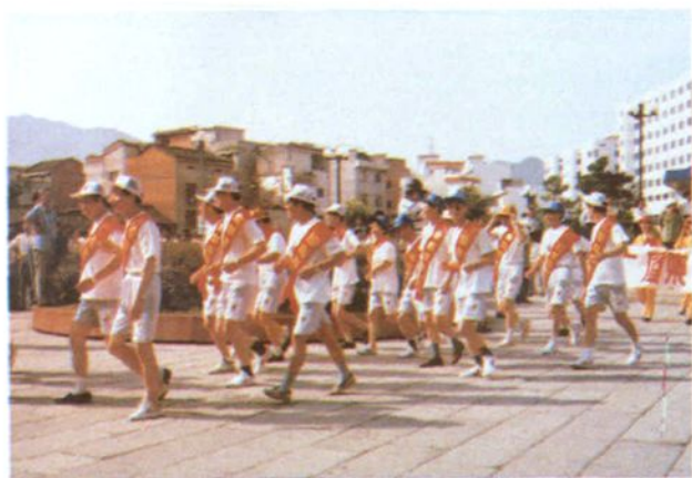
市五套班子领导身披红绶带跑 在队伍最前头。