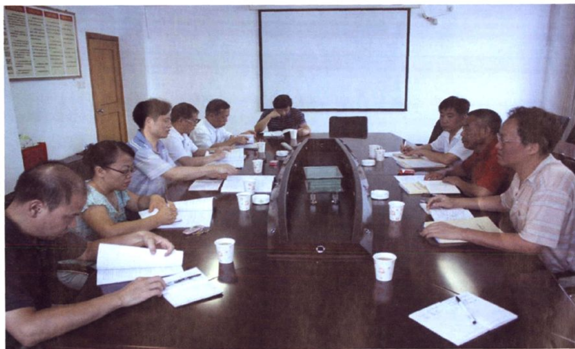
2010年7月22日《泉州市水土保持志(送审稿)》评审会议