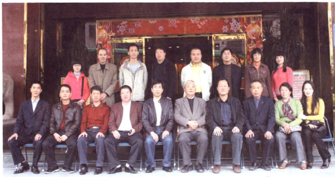
《泉州市水土保持志》编纂委员会成员及顾问