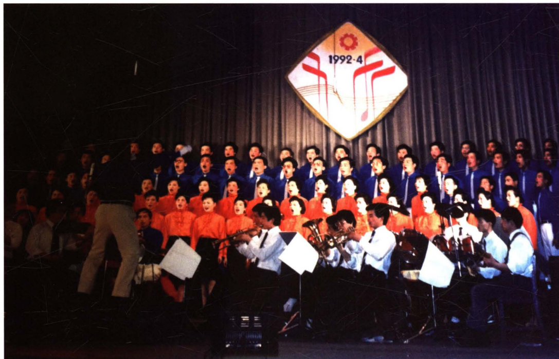
▲ 1992年4月，全县举行职工歌咏大合唱