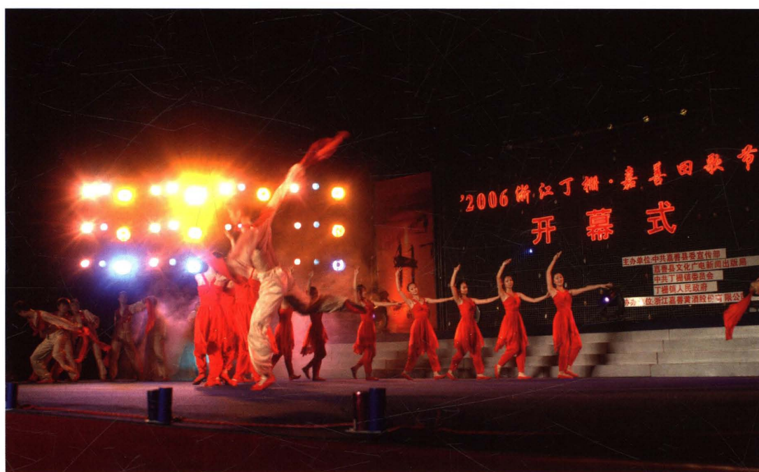
▼2006年“嘉善田歌节”开幕式