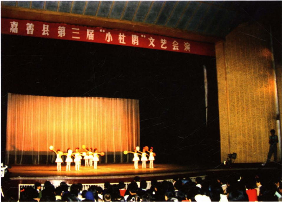
▲1987年，嘉善县第三届“小杜鹃”文艺会演