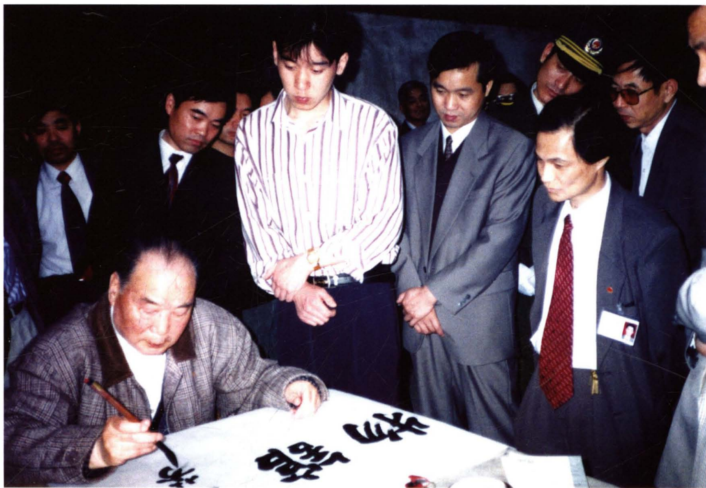
▲1996年10月30日，原国务委员、公安部部长王芳参观梅花庵、吴镇墓并题写“嘉善博物馆”馆名