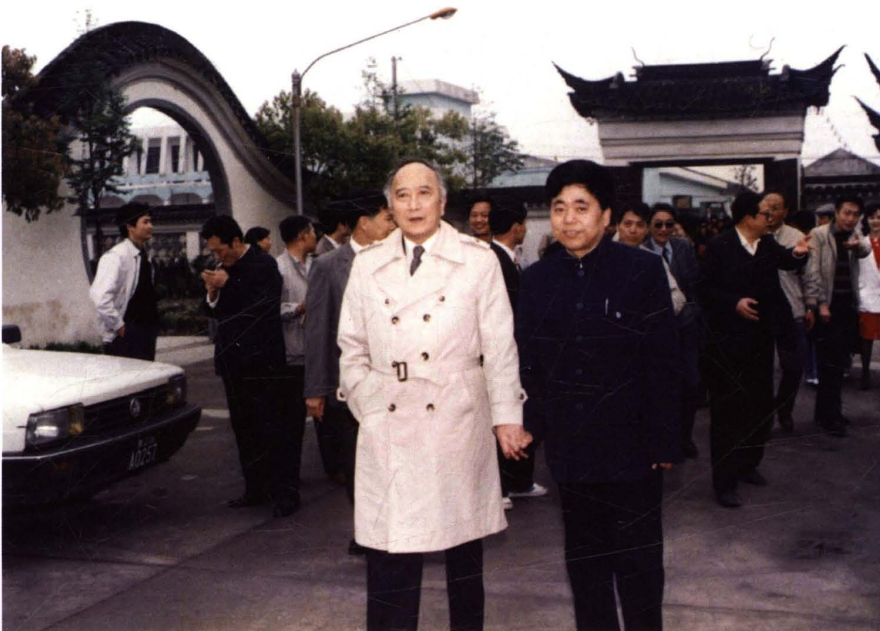
▼1989年4月22日，嘉善举办孙道临先生从影四十周年活动故乡行