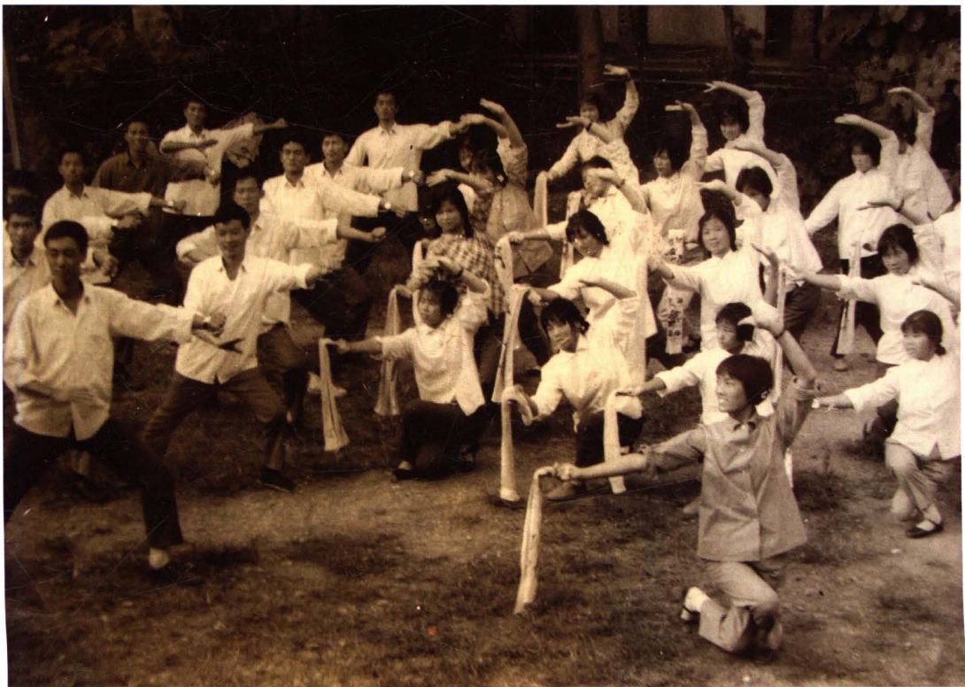
▼20世纪70年代，县文化馆开展群众文艺辅导