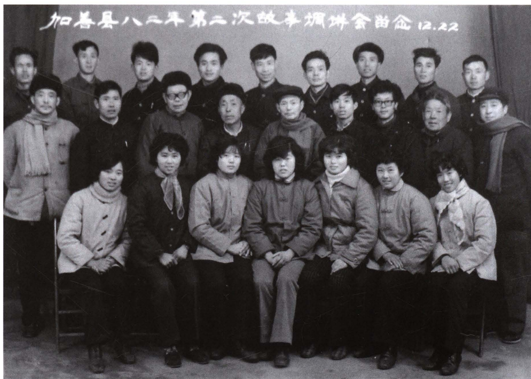
▼1982年12月，县文化馆举办全县故事员培训班