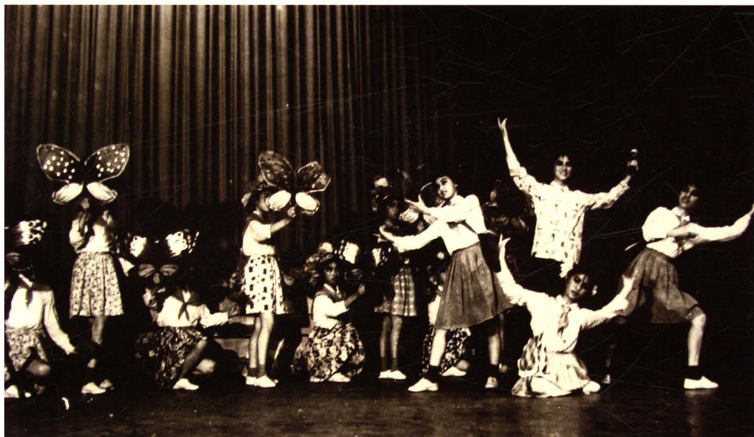
▲1978年，为纪念毛泽东同志《在延安文艺座谈会上的讲话》发表三十六周年，全县举行文艺调演