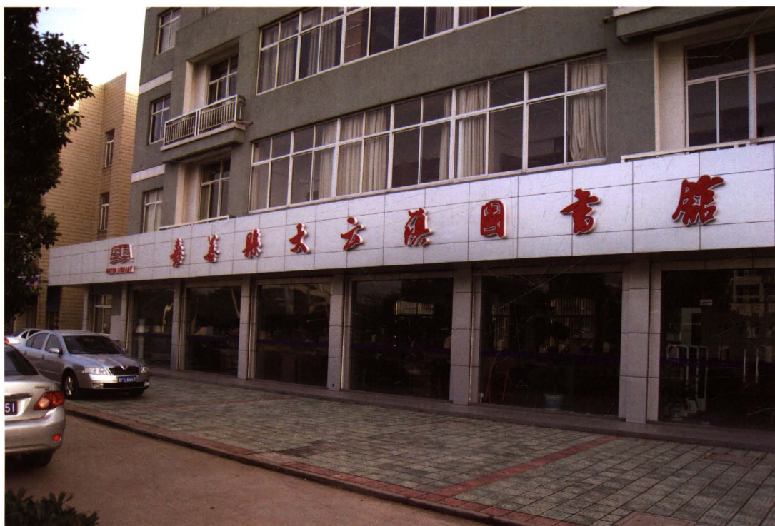
▼嘉善县大云镇图书馆