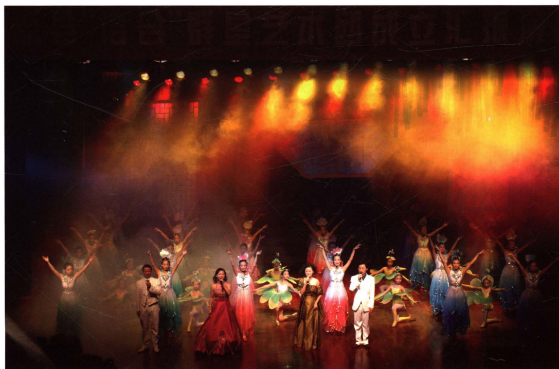
▼ 2005年，“信合”群星艺术团举行成立汇报演出