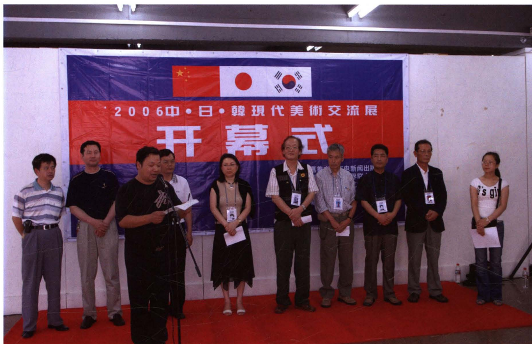
▲2006年，中日韩现代美术交流展在华东师范大学艺术厅举行