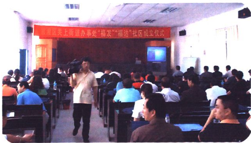
◀2007年8月福发、福达社区居民委员会成立仪式