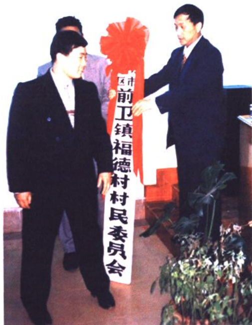
◀1997年3月10日福德村民委员会成立授牌仪式