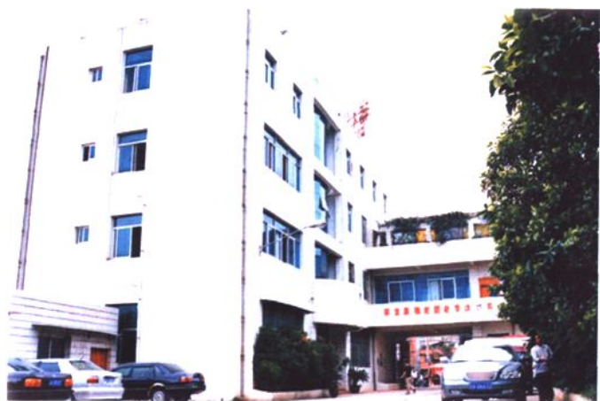
▶1996年9月福德办事处新办公楼落成时建立的村务公开栏