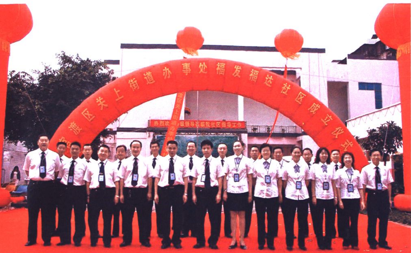
▲2007年8月福德、福发、福达社区全体工作人员合影