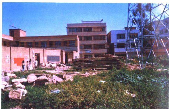
◀2004年位于金汁河沿岸的福德办事处办公楼