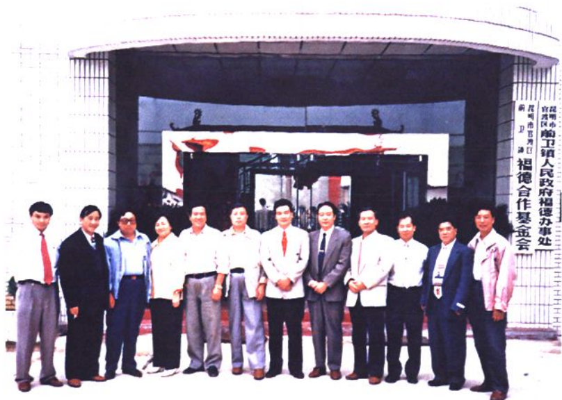
▲1996年9月24日官渡区领导在福德办事处参加区内首批农村合作基金会(试点)成立仪式