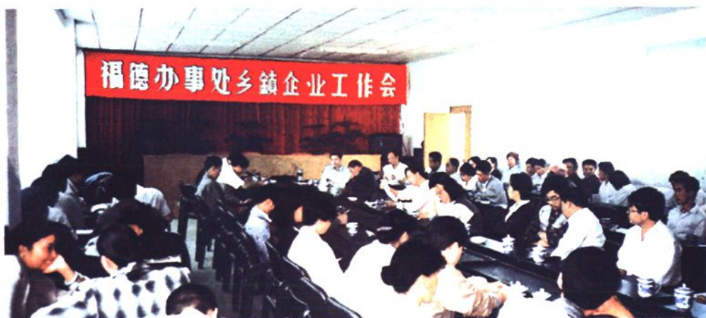
▲1997年6月10日福德办事处开展乡镇企业经济工作会议