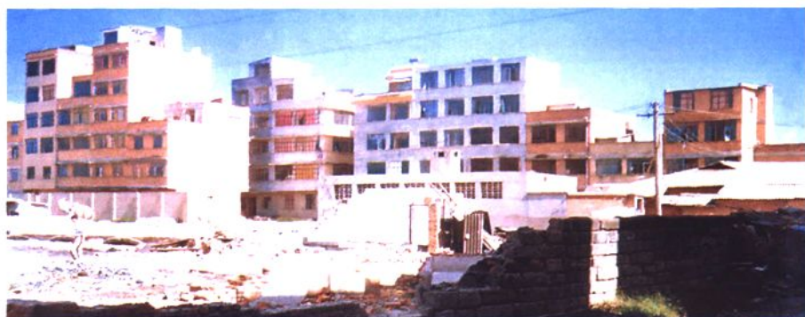
▲2000年位于豆腐营的村办集体企业玻璃厂旧址