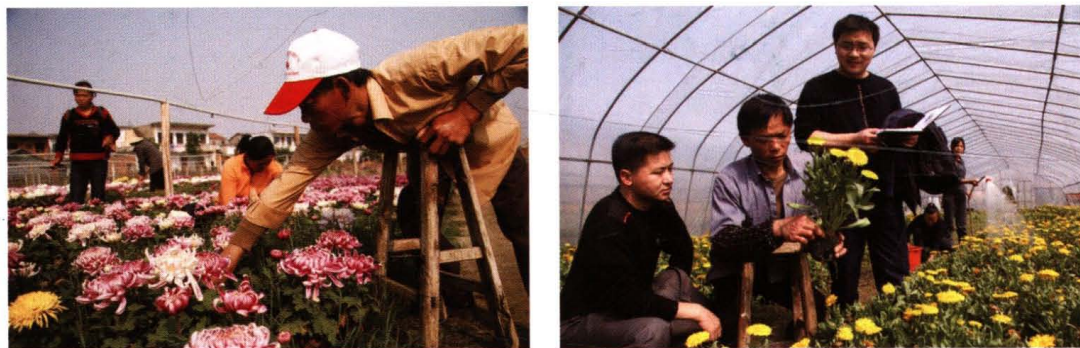
南昌农商银行积极支持罗家、昌北等地区花卉种植，提高农户经济效益，促进和改善城市建设