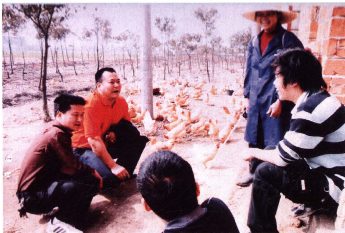
南昌农商银行积极支持城郊农民发展家禽、水产等养殖业，促进农户增收