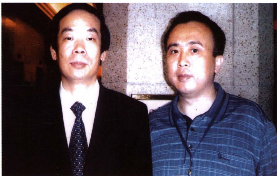
2005年7月，时任团中央书记、全国青联主席赵勇与出席全国青联会议的洪都联社理事长应勇合影