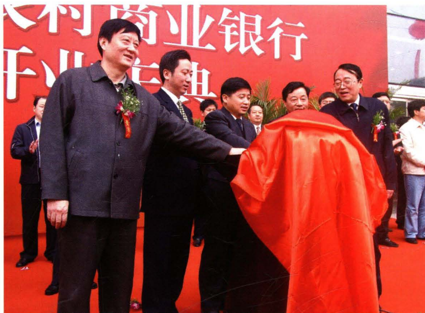
2009年3月26日，时任江西省政府副省长熊盛文出席洪都农村商业银行开业庆典