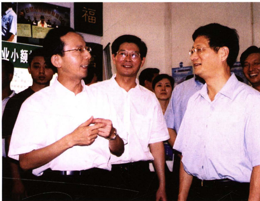
2006年9月27日，在“2006年江西创业博览会”洪都联社展区前，时任江西省委书记孟建柱听取省联社副主任孔发龙介绍下岗职工再就业贷款业务开展情况