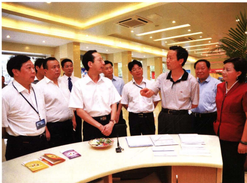
2009年9月29日，时任江西省常委、副省长陈达恒莅临洪都农村商业银行北京西路支行考察调研