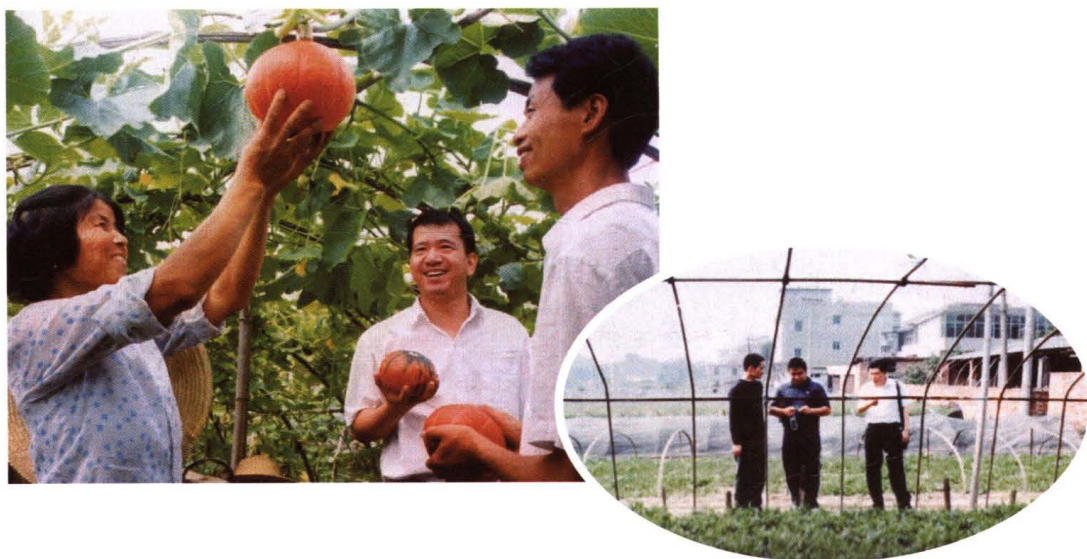
南昌农商银行积极支持扬子洲等城郊农户从事蔬菜生产，满足市民生活需求