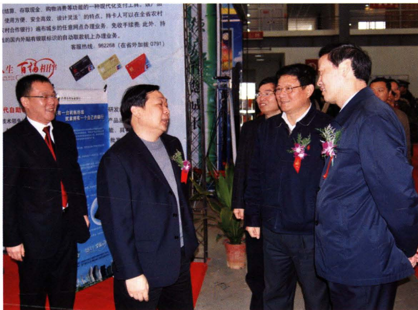
2009年12月11日，时任江西省常委、南昌市委书记余欣荣视察首届南昌金融展洪都农村商业银行展厅