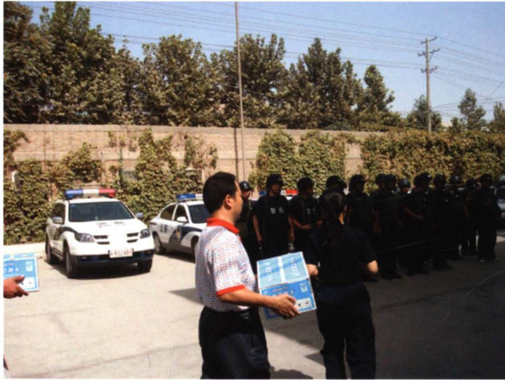
2009年6月10日，县联社慰问武警官兵