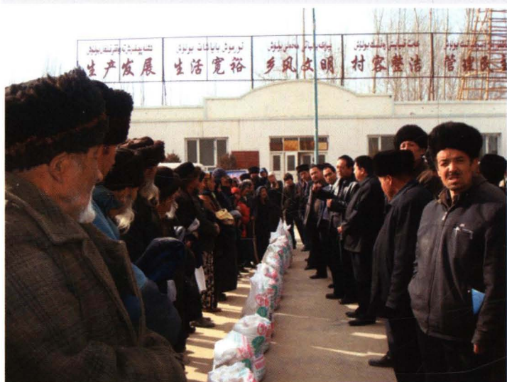
2008年12月22日，“两节”期间 县联社领导慰问朗如乡贫困村农民