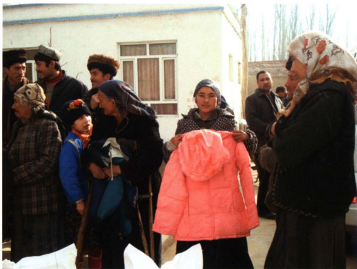
2008年12月22日，朗如乡贫困村 农民领取联社职工捐助的衣物