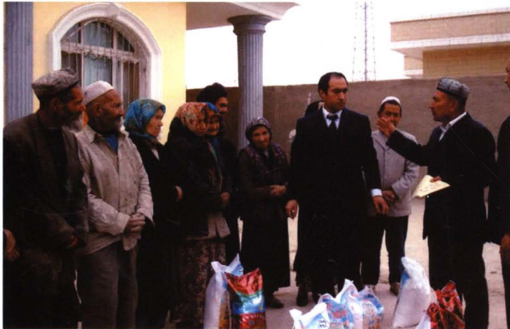
2012年10月，“两节”期间慰问朗如乡艾古赛村贫困户