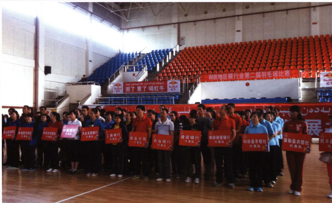
2013年10月，参加银行业协会举办的职工运动会