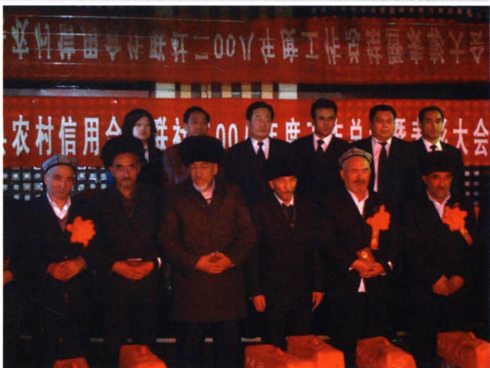
2009年1月28日，县联社领导班 子成员与退休老干部合影