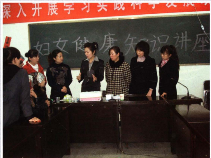
2009年11月4日，县联社邀请和田市妇幼保健站医务人员讲解妇女健康知识