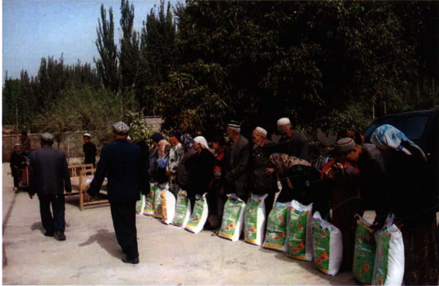
2013年10月，慰问 朗如乡艾古赛村贫困户