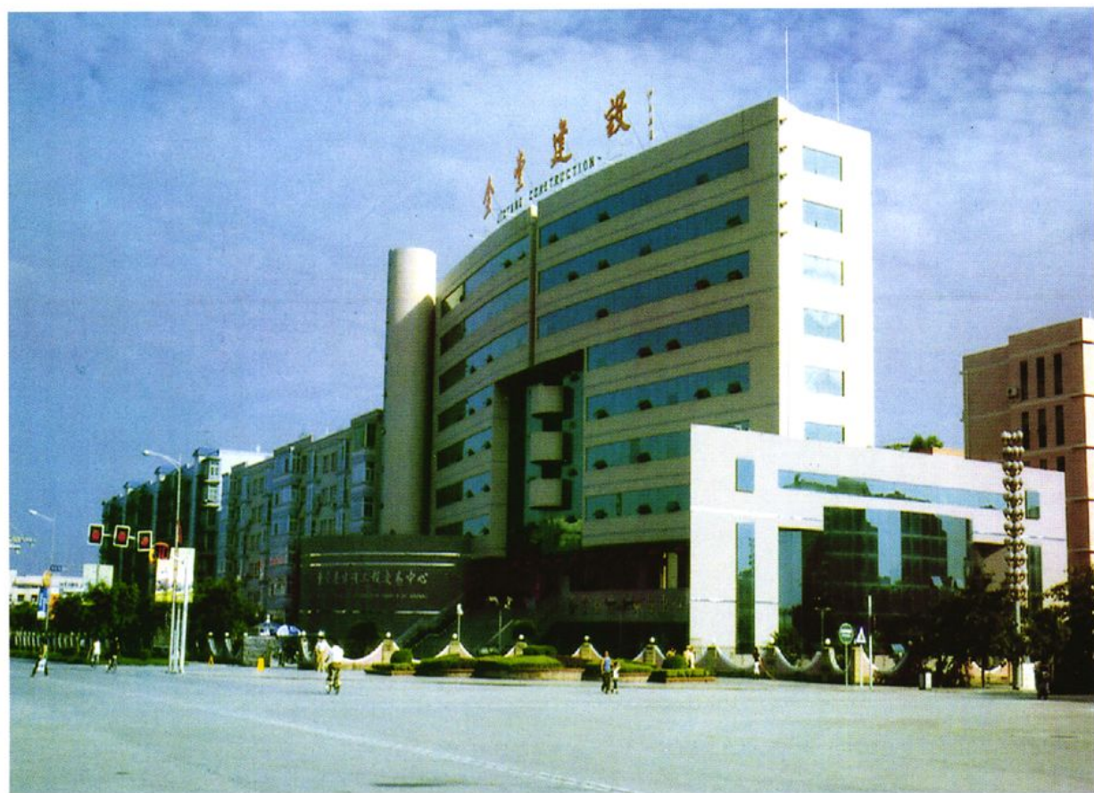
2001年6月新建成的金堂县建设局办公大楼