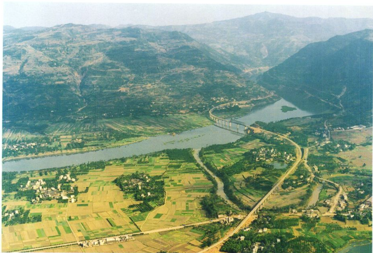
1995年1月建成的金堂沱江铁路大桥，全长647.12米