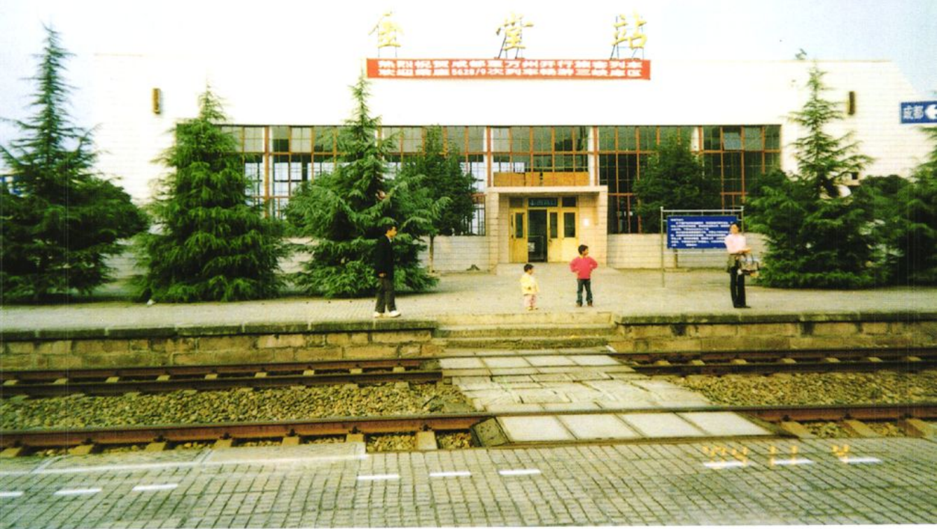
1997年底建成的金堂县城火车站