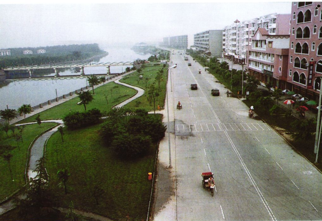
新建的滨江路河堤