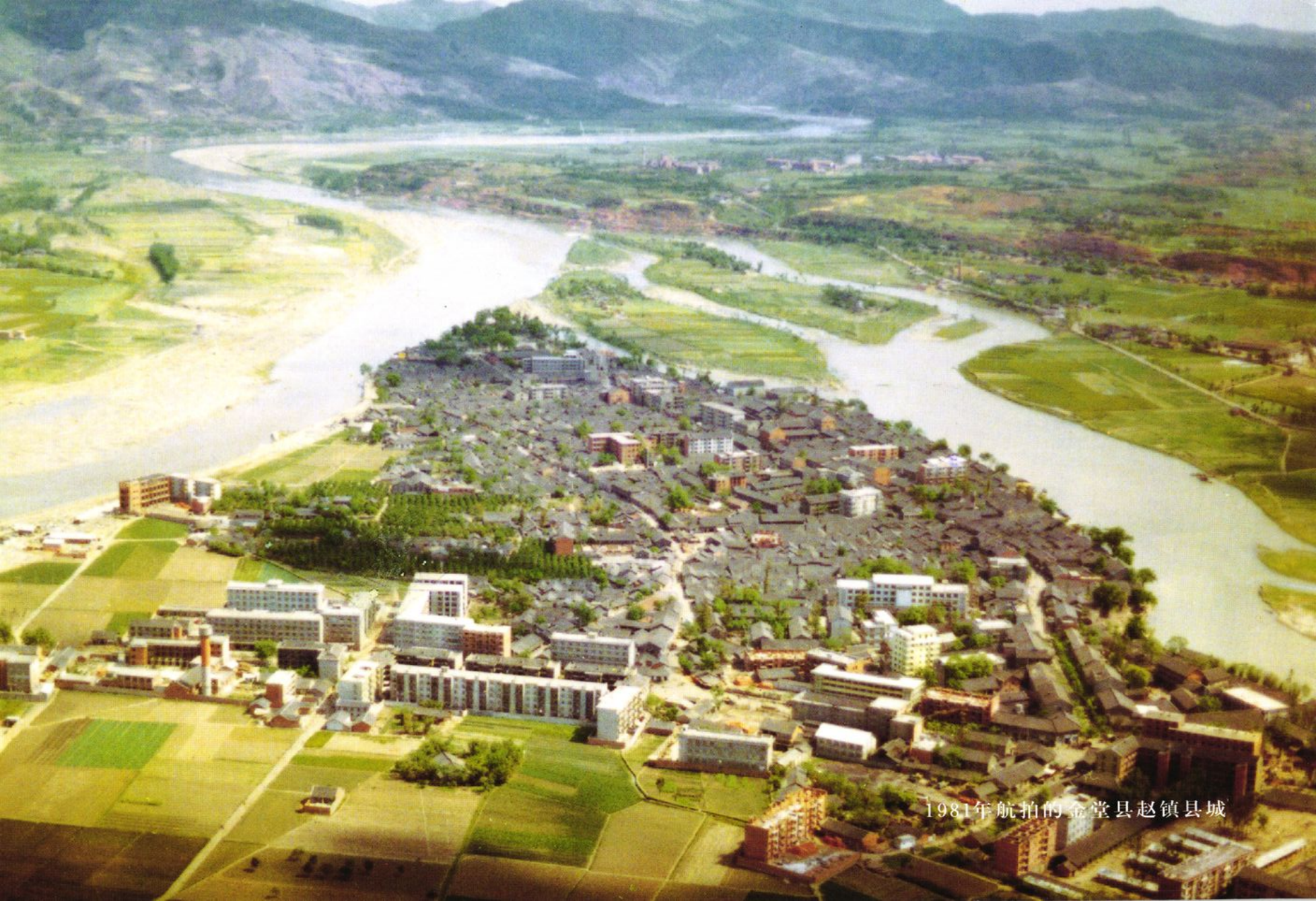
1981年航拍的金堂县赵镇县城