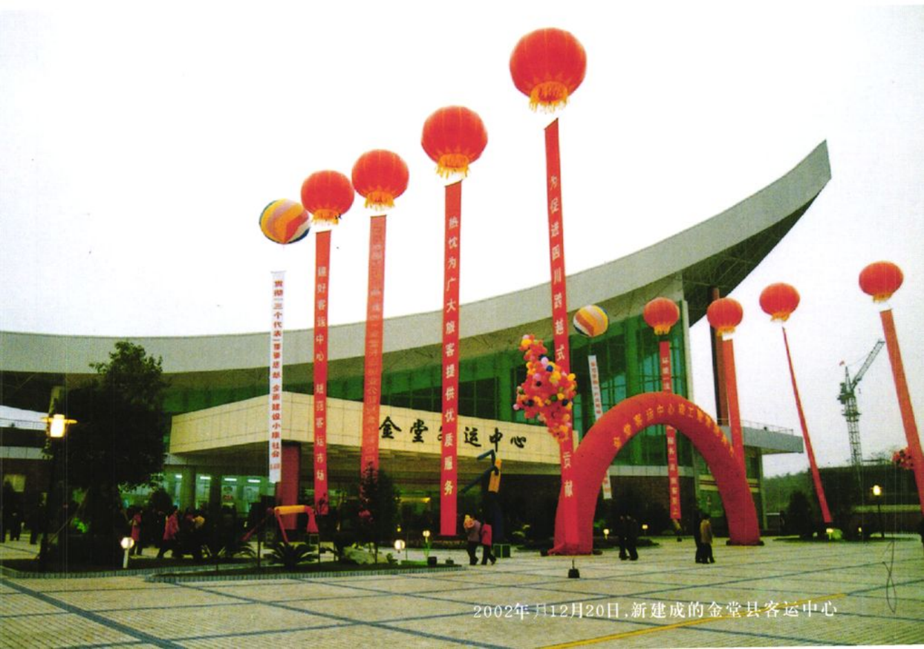
2002年12月20日,新建成的金堂县客运中心