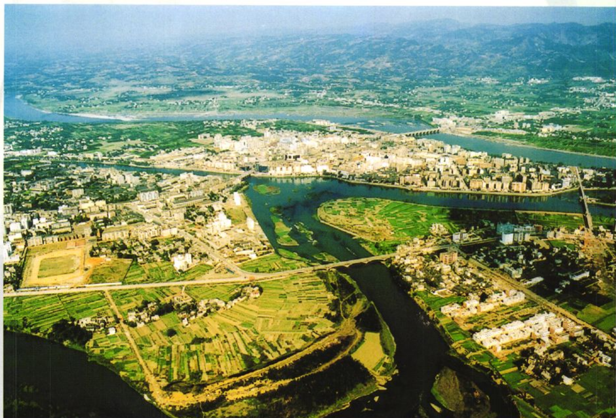
1995年航拍的金堂县赵镇县城