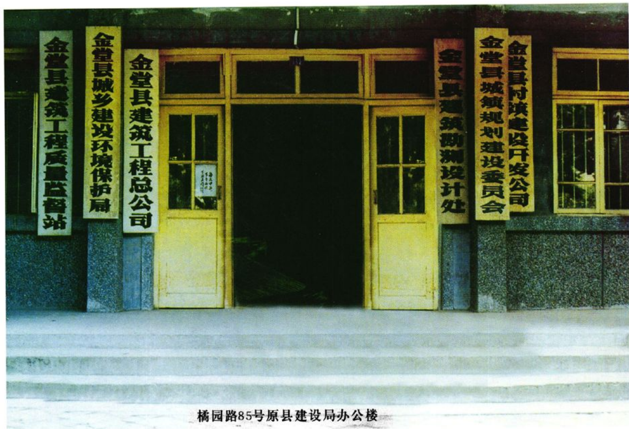
橘园路85号原县建设局办公楼