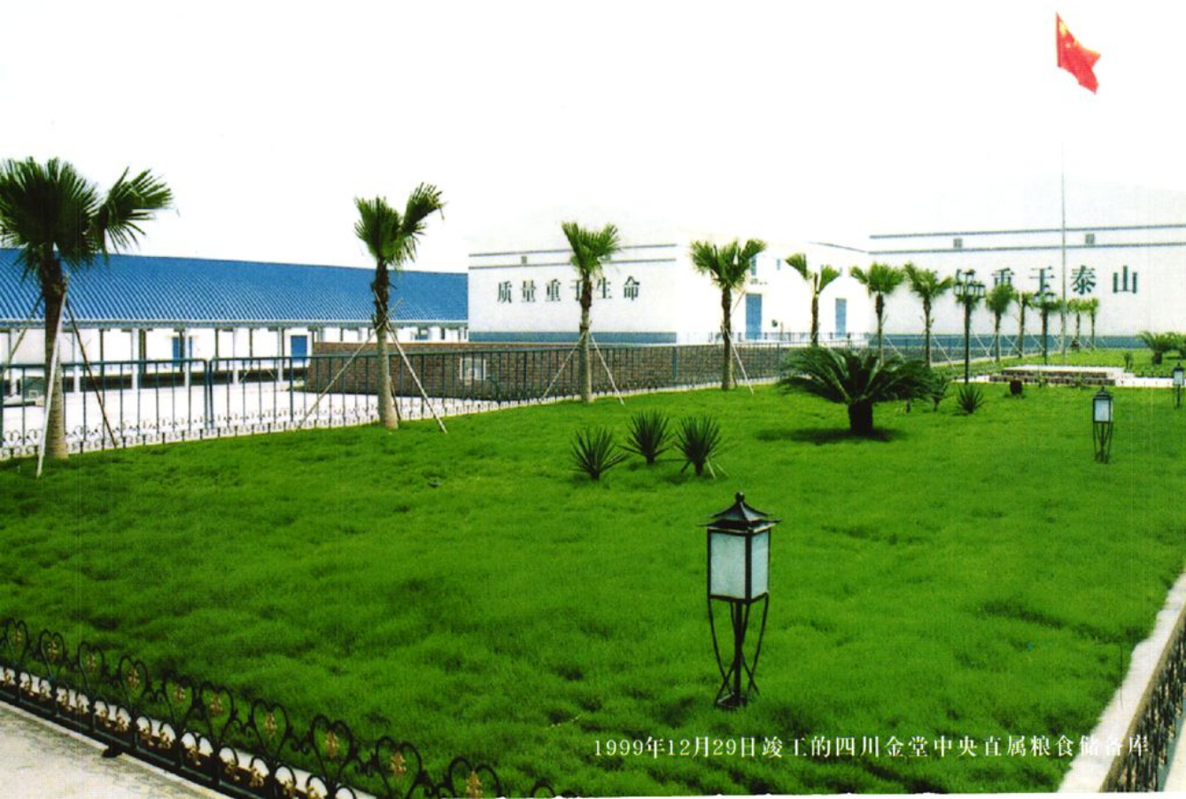
1999年12月29日竣工的四川金堂中央直属粮食储备库