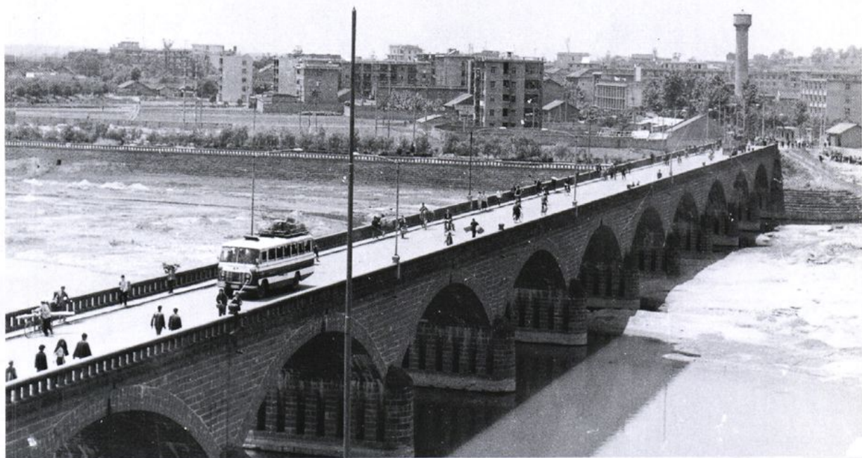
1960年建成通车的北河大桥