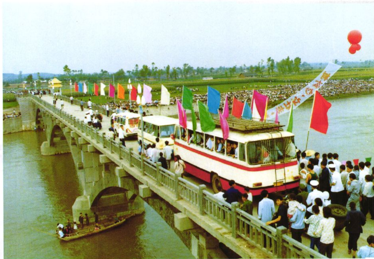
1983年6月15日竣工通车的韩滩桥