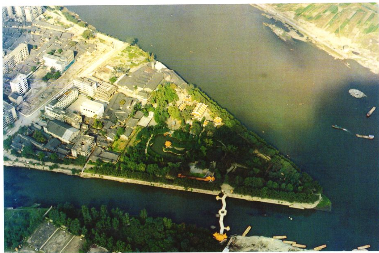
1995年航拍下的金堂梅林公园及改建中的下横街