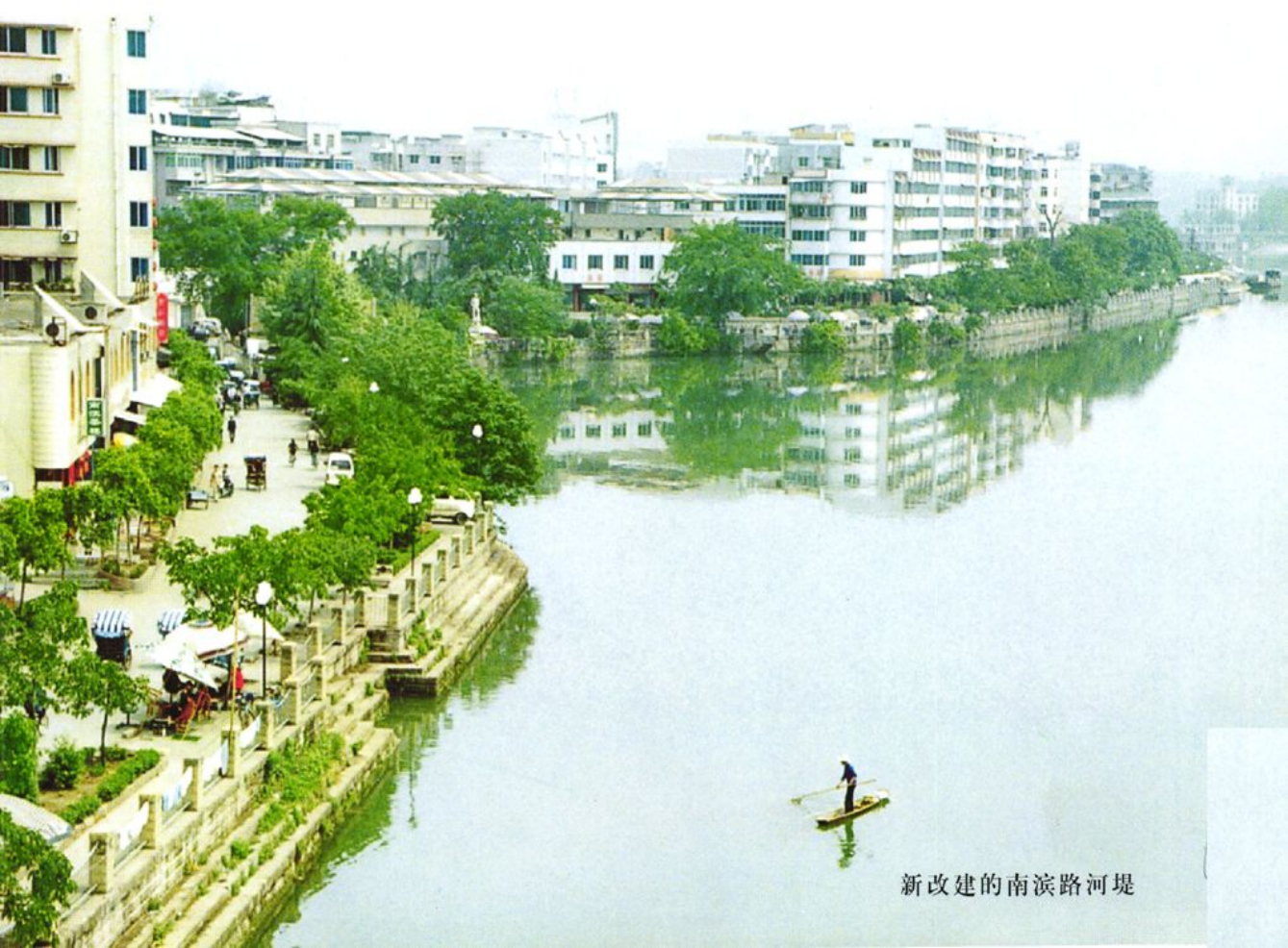
新改建的南滨路河堤