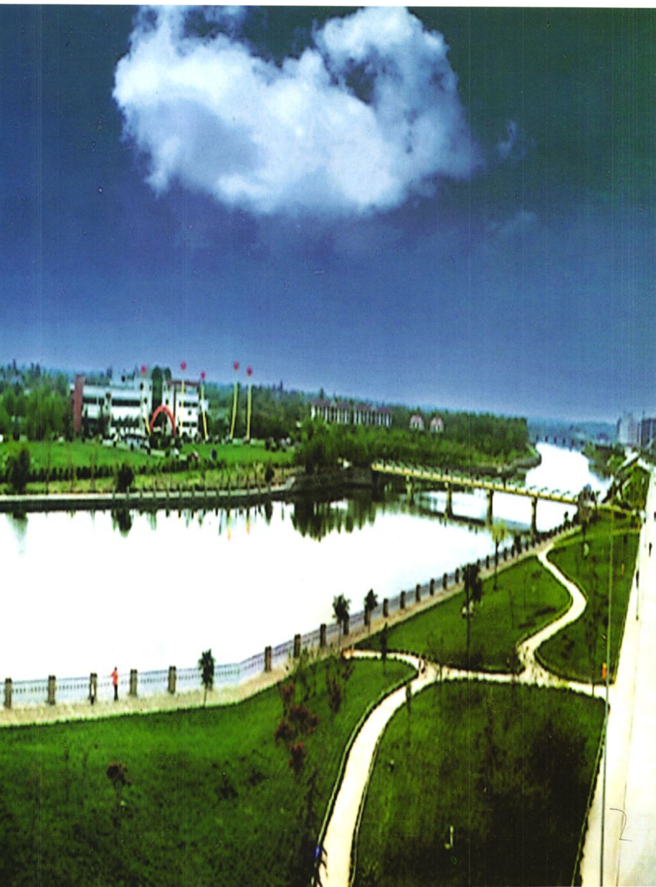
中国西部花园水城——四川省成都市金堂县绿岛旅游胜地